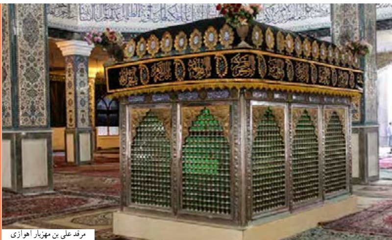
مرقد علی بن مهزیار اهوازی

از این رو، امامان، یارانی را تربیت می‌کردند که در عین سخت‌گیری‌های حاکمان، با شجاعت و ایثار به مناطق مختلف می‌رفتند و برای پیشبرد اهداف ائمه اطهار علیهم‌السلام تلاش می‌کردند و جایگاه امامان را نیز برای مردم توضیح می‌دادند.