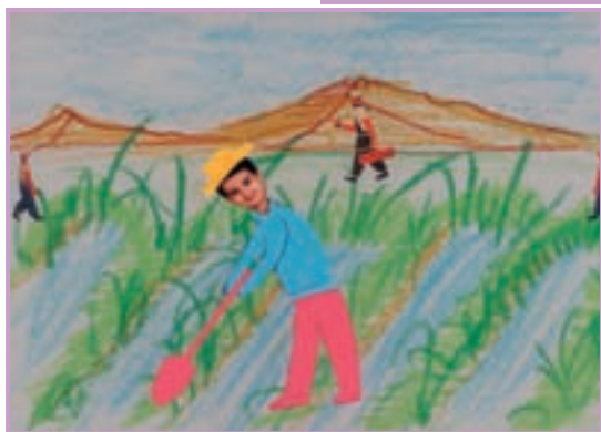
اثر هنری (کار فردی)