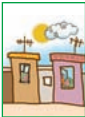
درس ۲۵ حق همسایگی ۲۷