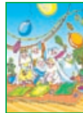
درس ۱۰ چه باشکوه و زیبا...! ۱۰