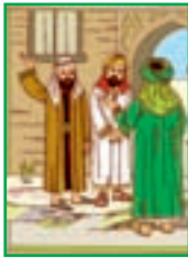
درس ۲۴ عبادت ۲۶