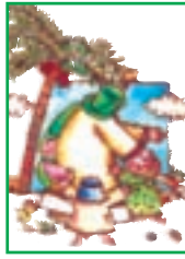
درس ۱۵ بهترین انسان ۱۳