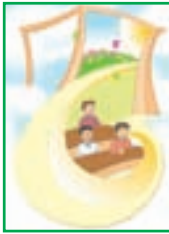
درس ۱۷ کودکان شاد ۱۶