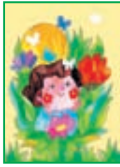
پاداش نیکی ۲۲