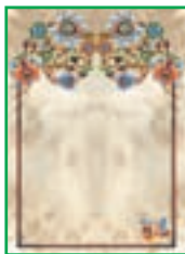
بخش آموزش قرآن ۲۸