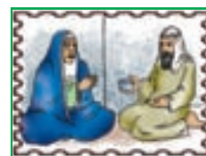
درس ۱۴ اهل یمن ۱۲