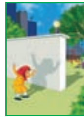
درس ۱ سایه و سارا ۴