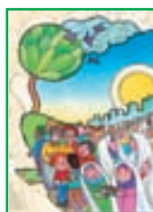
درس ۲۰ جشن مسلمانان ۲۰