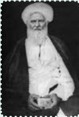
آیت‌الله عبدالکریم حائری یزدی

یکی از اقدام‌های هوشمندانه مرجعیت شیعه در ایران، تأسیس حوزه علمیّه قم در سال ۱۳۰۱ ش پس از شکست عثمانی در جنگ اول و اشغال عراق توسط انگلیس بود، که توسط آیت‌الله «حاج شیخ عبدالکریم حائری یزدی» انجام گرفت. تا قبل از تأسیس حوزه علمیّه قم، پایگاه علمی مرجعیت شیعه، عمدتاً در نجف اشرف و دیگر شهرهای مذهبی عراق متمرکز بود. این اقدام ارزشمند و خردمندانه، در عصری که استعمار در صدد اجرای نقشه‌های ضدّ دینی خود در منطقه بود، پس از عصر صفویان، موجب تقویت ایران به عنوان پایگاه فقه و معارف شیعه شد. علاوه بر آن، زمینه را برای مهاجرت علما و مراجعی که علیه سیاست‌های استعماری انگلستان مبارزه می‌کردند، فراهم آورد.