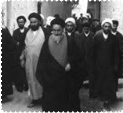
امام خمینی، سال‌های تبعید در نجف

امام خمینی در دوران تبعید با مواضع شجاعانه، هوشمندانه و نیز ساده‌زیستی مثال زدنی اش ۱ همه محدودیت‌ها و تنگناها را تحمل کرد. ۲ او در اعماق دل مردم ایران و مبارزان مسلمان در کشورهای اسلامی و آزادی‌خواهان جهان جای گرفت. صفات و ویژگی‌هایی که در امام یکجا جمع شده بود، از وی شخصیت بی‌بدیل و متمایزی ساخته بود. ۳