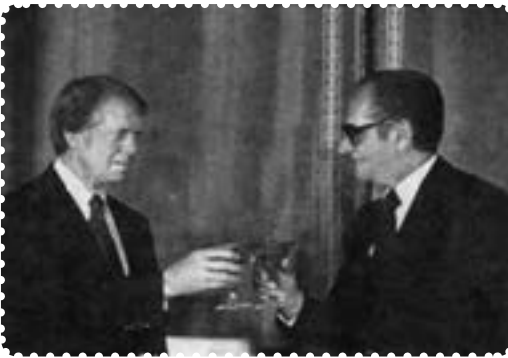
کارتر و شاه

در این درس با وضعیت کشور در آستانه انقلاب اسلامی آشنا می‌شوید. سوءاستفاده آمریکایی‌ها از ایران تحت سلطه، روی کار آمدن جیمی کارتر، چگونگی برخورد با زندانیان سیاسی، سفر کارتر به ایران، رحلت آیت‌الله حاج آقا مصطفی خمینی، انتشار مقاله اهانت آمیز نسبت به امام خمینی، قیام نوزدهم دی قم و کشتار هفده شهریور ۱۳۵۷ در تهران مهم‌ترین موضوع‌های مورد بررسی در این درس است.