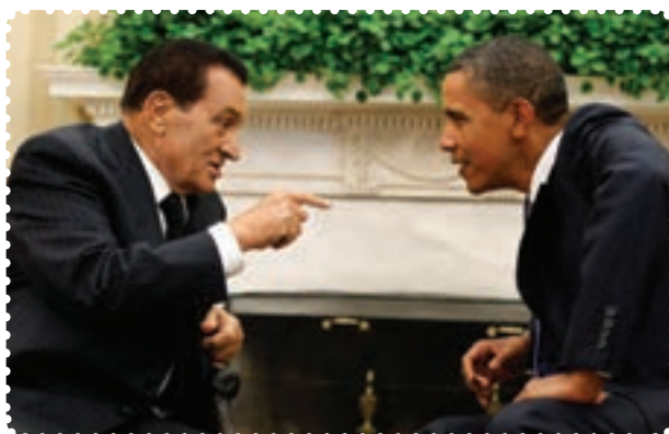
مبارک دیکتاتور مخلوع مصر و او بامار رئیس‌جمهور امریکا

در سال ۱۲۶۰ش/۱۸۸۱م انگلیسی‌ها، مصر را اشغال کردند. تحت تأثیر تحولات ناشی از جنگ جهانی اول، کوشش مصری‌ها برای رهایی از سلطه استعماری انگلستان بیشتر شد و سرانجام انگلیس به وضعیت تحت‌الحمایگی این کشور پایان داد و در این کشور نظام سلطنتی مشروطه اعلام کرد.