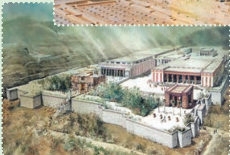
تخت جمشید و طرح خیالی آن

یافته است. ۱ برخی معتقدند، «ذوالقرنین» که در قرآن مجید ۲ به عنوان فرمانروایی نیک سیرت ستوده شده، همان کوروش پادشاه ایران است. ۳ با اینکه مؤسس دولت مقتدر هخامنشیان از سرزمین پارس