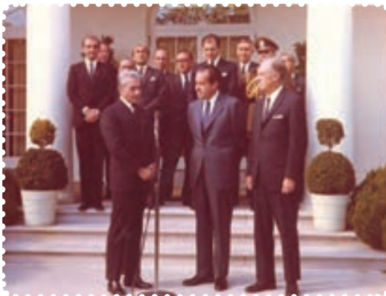
محمد رضا شاه در دیدار با نیکسون رئیس‌جمهور آمریکا

زندانی و تبعید کردن روحانیان، دانشمندان، فرهنگیان، استادان دانشگاه و نویسندگان پیامدهای منفی بسیاری برای رژیم داشت. براساس اعلام سازمان عفو بین‌المللی، ایران در سال‌های مذکور از نظر تعداد زندانیان سیاسی، مقام سوم را در جهان داشت. ۱