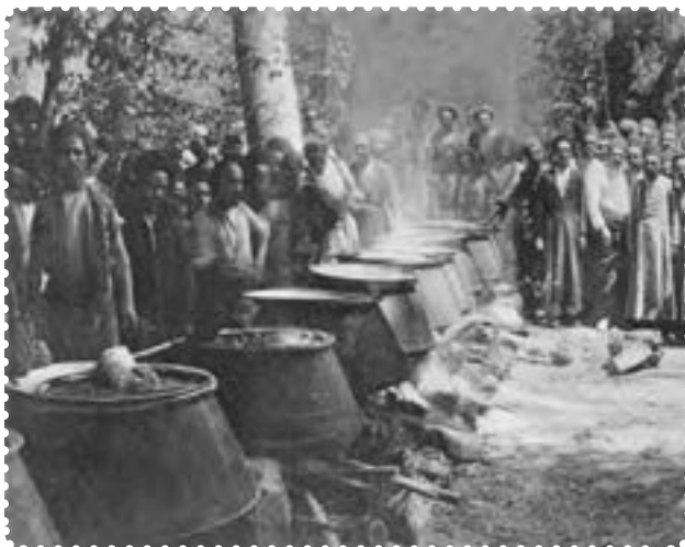
دیگ‌های غذا در سفارت انگلیس برای مشروطه خواهان

بدون پناهندگی به سفارت انگلستان، می‌توانستند به خواسته‌های خود دست یابند. دولت انگلستان بر خلاف دولت روسیه که از دربار حمایت می‌کرد، به ظاهر پشتیبان نهضت مشروطه بود. انگلستان، برای نیل به مقاصد و منافع استعماری‌اش این سیاست را در پیش گرفته بود. اما کسانی که از سیاست پیچیده استعمار انگلستان درک روشنی نداشتند