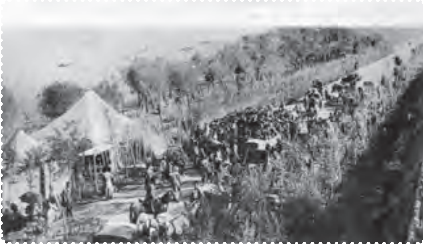
بازگشت علما از مهاجرت کبری

مظفرالدین شاه تسلیم خواسته‌های مردم شد. او عین‌الدوله را عزل کرد و فرمان تشکیل مجلس شورای ملی را در ۱۴ مرداد ۱۲۸۵ صادر کرد. هفت روز بعد، علما، با استقبال پرشکوه مردم، از قم بازگشتند. شهر چراغانی و جشن شادی به پا شد و در ۲۸ مرداد، اولین دوره مجلس شورای ملی با حضور نمایندگان تهران تشکیل گردید. عده‌ای از سیاستمداران مشروطه‌خواه، به تدوین قانون اساسی پرداختند. ۱ آنان با عجله آن را نوشتند و به امضای مظفرالدین شاه رساندند. شاه، ده روز پس از امضای قانون اساسی، درگذشت. به این ترتیب، کشور استبداد زده‌ی ما، با بهره‌گیری از اندیشه‌های سیاسی عالمان بزرگ دینی، کوشش فرهیختگان جامعه و مجاهدت مردم، به حکومتی دست یافت که می‌بایست براساس قانون اداره می‌شد.