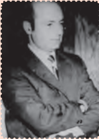
دکتر علی شریعتی (۱۳۱۲-۱۳۵۶ ش)