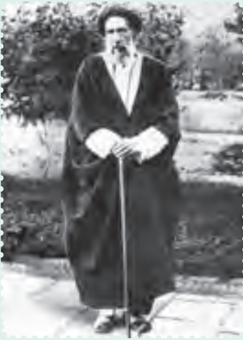
سید حسن مدرس نماینده ادوار مختلف مجلس شورای ملی

اقدام های خودسرانه و خشونت آمیز رضاخان در دوران تصدی وزارت جنگ، منجر به طرح استیضاح او در مجلس، به رهبری آیت الله سید حسن مدرس شد اما رضاخان، با طرح شایعه استعفای خود و صحنه سازی، طرفدارانش را علیه مجلس تحریک کرد و مخالفان را مورد ضرب و شتم و ارباب، قرار داد.