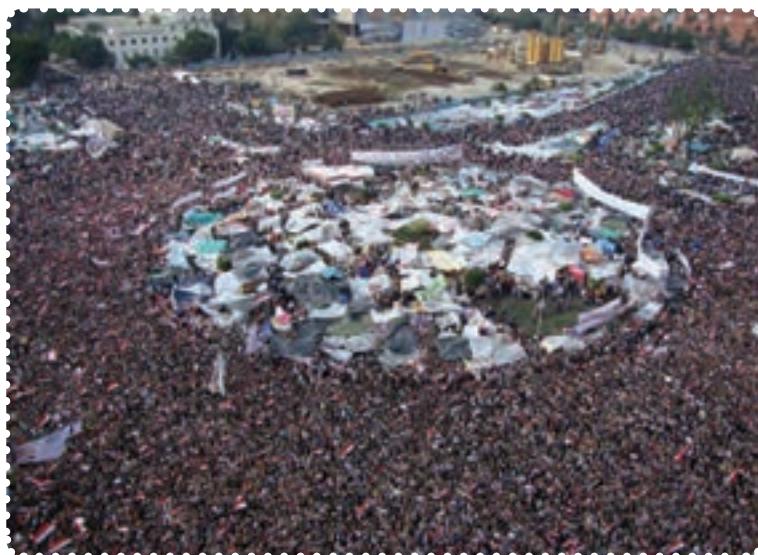
قیام مردم مصر در میدان التحریر (آزادی)

بیداری اسلامی در مصر ریشه‌دار بود و به همین دلیل شعله‌های انقلاب مردم مصر با یک تظاهرات زبانه کشید و به‌سرعت به مناطق دیگر هم سرایت کرد. امواج سهمگین انقلاب مردم حسنی مبارک را مجبور به تسلیم و شکست کرد.