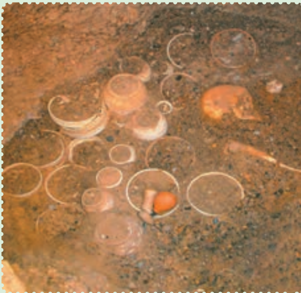
آثار یافت‌شده در شهر سوخته

پس از مدتی، زردشت که پیامبر ایران باستان است در میان ایرانیان ظهور کرد. او مردم را به پیروی از خدای یگانه که اهورامزدا نام داشت، دعوت کرد و مروج اندیشه، گفتار و کردار نیک بود. اعتقاد به سرای آخرت و جهان پس از مرگ، عقیده به آخرالزمان و ظهور یک منجی که حکومتی با عدل و داد و به‌دوراز ناپاکی و ستم برپا خواهد کرد، از بنیان‌های استوار و اعتقادی ایرانیان بوده است که آن‌ها را از سایر ملل دوران باستان متمایز می‌ساخت. ۲