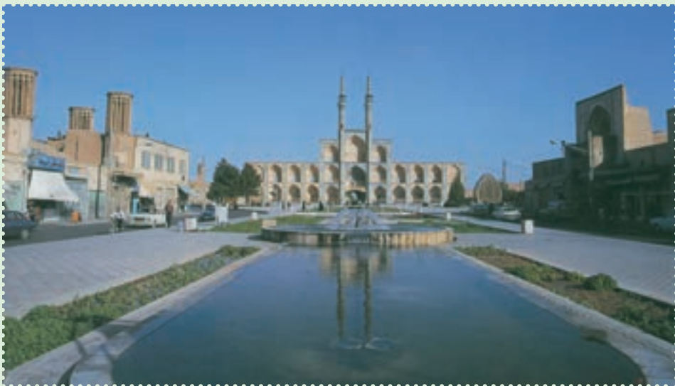
میدان تاریخی امیر چخماق در مرکز شهر یزد

با آنکه مغولان در آغاز ویرانی های بسیاری به همراه آوردند، ولی بر اثر آشنایی با فرهنگ ایران و اسلام، از طریق آنان فرهنگ، هنر و تمدن ایران و اسلام رواج یافت. پس از پایان حکومت ایلخانان، حکومت های ملوک الطوائفی و محلی متعددی چون تیموریان، آل جلائر، آل مظفر، سرداران و آل کرت، اتابکان، قراقویونلوها و آق قویونلوها طی قرن های هشتم و نهم قمری بر ایران حکومت کردند، اما هیچ کدام نتوانستند یکپارچگی ایران را حفظ کنند. سرانجام در سال ۹۰۷ق، حکومت صفوی توانست پس از