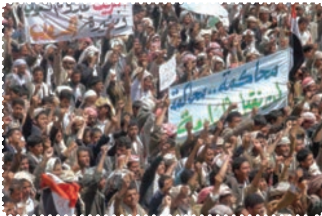
قیام مردم مسلمان یمن

کرد. سرانجام پس از ماه‌ها درگیری نظامی با سقوط طرابلس، حکومت قذافی سرنگون و خود او کشته شد. نکته جالب در مورد قذافی این است که وضعیت او بیش از هر دیکتاتوری به صدام شبیه بود. ت) بیداری اسلامی در یمن: جمهوری یمن در جنوب شبه جزیره عربستان واقع است و دارای نژادهای عرب (۸۶ درصد)، ترک، هندی، ایرانی و سومالیایی است. بیش از ۵۰ درصد یمنی‌ها شیعی مذهب‌اند که غالباً در منطقه صعده و شمال یمن ساکن‌اند. البته عمده شیعیان یمن زیدی‌اند که بعد از امام سجاد (ع)، زید بن علی (ع) را امام می‌دانند. مردم یمن در پی انقلاب‌های گوناگون در کشورهای اسلامی، اعتراضات و تظاهرات گسترده‌ای را در شهرهای مختلف علیه رژیم دیکتاتوری علی عبدالله