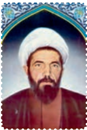
شهید دکتر محمد مفتاح

مرحله اول آن از ابتدای سال ۱۳۵۸ آغاز شد: در سوم اردیبهشت ماه ۱۳۵۸، تیمسار قرنی، اولین رئیس ستاد مشترک ارتش جمهوری اسلامی ایران را به شهادت رساندند. در دوازدهم اردیبهشت ماه همان سال، رئیس شورای انقلاب، علامه شهید، آیت‌الله مرتضی مطهری، که پس از امام، دارای بالاترین موقعیت دینی، سیاسی و فرهنگی کشور بود و از نظر علمی نیز موقعیت بسیار ممتازی در میان علمای زمان خویش داشت و از نظریه پردازان بسیار ارزشمند انقلاب اسلامی به‌شمار