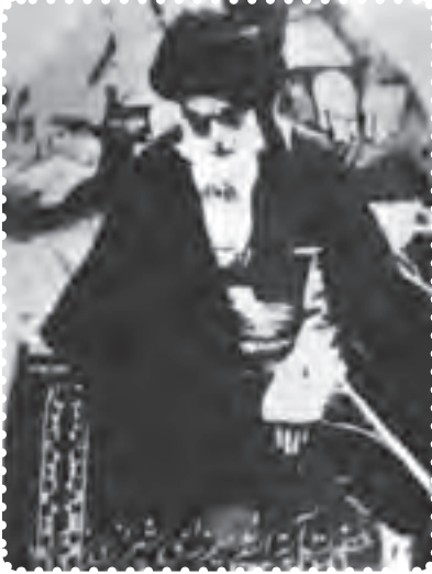
آیت الله میرزای شیرازی