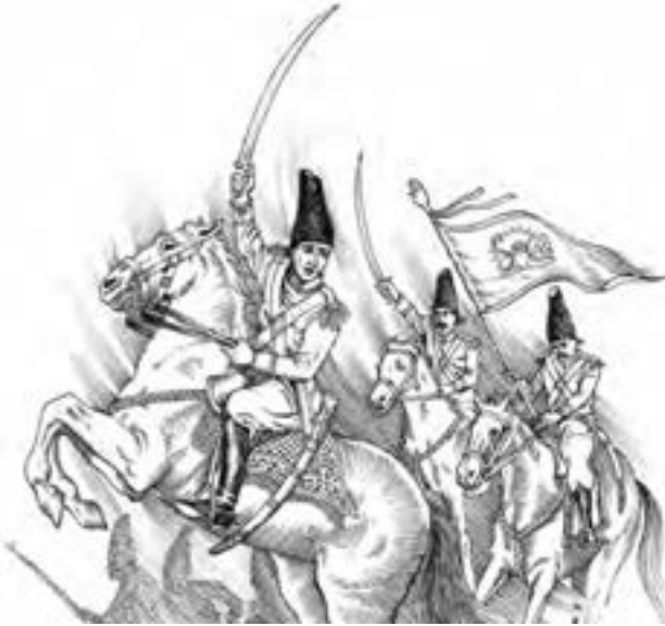
آقا محمدخان مؤسس حکومت قاجاریه

به این ترتیب، آقامحمدخان توانست سلسله قاجار را در ایران بنیاد نهد. وی تهران را که در آن زمان روستایی در حومه ری بود به پایتختی برگزید. این سلسله از سال ۱۱۷۴ تا ۱۳۰۴ ش، یعنی قریب ۱۳۰ سال، بر ایران فرمانروایی کرد.