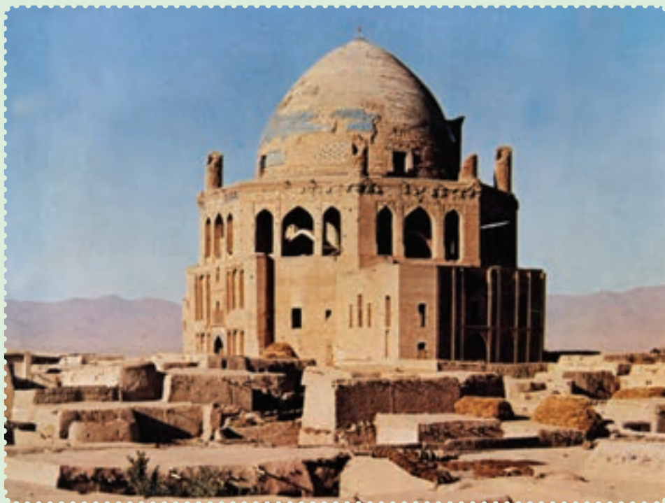
مقبره الجایتو، سلطانیه

چنگیزخان انجامید. این حادثه بهانه‌ای برای حمله به ایران بود. ۱ لشکرکشی مغولان یکی از بزرگ‌ترین راهپیمایی‌های نظامی تاریخ به‌شمار می‌رود. حدود ۲۵۰ هزار نفر از قبایل مغول، در سرمای سخت از سرزمین مغولستان در شمال چین، به فرماندهی تموچین (چنگیزخان) به سوی ایران سرازیر شدند. ۲ هدف نخستین آنها شهر اُترار بود، اما پس از قتل عام اهالی این شهر و دستگیری عاملان قتل بازرگانان، به سوی شهر بخارا و سایر ایالت‌های ایران پیشروی کردند. ۳ حمله مغول همچون طوفانی سهمگین، نه تنها طومار حکومت خوارزمشاهی را در هم پیچید، بلکه بیشتر شهرهای ایران را ویران و مظاهر تمدن باشکوه دوران اسلامی را نابود کرد. دامنه این تندباد، علاوه بر ایران، بخش‌های زیادی از جهان اسلام را نیز درنوردید. ۴