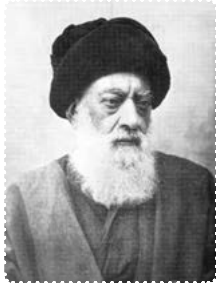
آیت الله طباطبایی