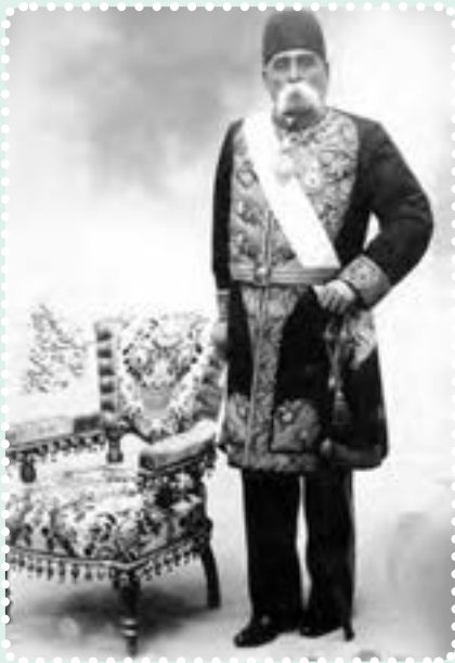
عبدالمجید میرزای عین الدوله

به هم ریخت؛ بازارها بسته شد و مردم در «مسجد شاه» گرد آمدند. در پی این تجمع، مردم نیرو گرفتند و کشمکش بین طرفداران استبداد و عدالت خواهان، شدت گرفت. دولت به وحشت افتاد و با پادرمیانی حاج میرزا ابوالقاسم امام جمعه، به طور موقت، قضیه فیصله یافت. حاج میرزا ابوالقاسم، داماد مظفرالدین شاه بود. او از جانب شاه به امامت جمعه تهران منصوب شده بود و از وی و دربار، پشتیبانی می کرد.