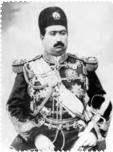
محمد علی شاه قاجار

بعد از مظفرالدین شاه، ولیعهد او، محمدعلی میرزا، با عنوان محمدعلی شاه، یکی از شاهان خودکامه دوره قاجار بود که نمی‌خواست در برابر قانون اساسی و مجلس شورای ملی تمکین کند. او در ۲۸ دی ۱۲۸۵ جشن تاج‌گذاری بر پا کرد و از اشراف و نمایندگان دولت‌های خارجی برای شرکت در این مراسم دعوت به عمل آورد، اما نمایندگان مجلس شورای ملی را دعوت نکرد. این، اولین بی‌اعتنایی محمدعلی شاه به مجلس بود. او ملت را بنده و برده خود می‌پنداشت و نمایندگان مجلس را برای دخالت در امور کشور و مشورت در سیاست، لایق نمی‌دانست. ۱