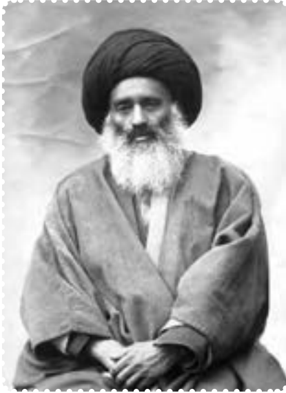
آیت الله بهبهانی