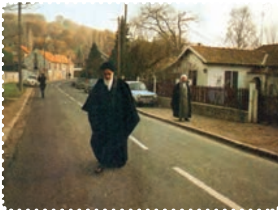
محل اقامت امام در پاریس، مرکز تجمع دانشجویان و ایرانیان ساکن آنجا بود.

با روزافزون شدن تظاهرات مردمی در ایران، رژیم عراق در پی یک توافق محرمانه با شاه و هماهنگی با آمریکا ۱ ، اقدام به اخراج امام خمینی از آن کشور کرد. امام در سیزدهم مهر ۱۳۵۷ به طرف کویت رفت. اما دولت کویت اجازه ورود به وی نداد. این در حالی بود که عراق نیز به امام، اجازه بازگشت نمی داد. در نتیجه امام خمینی و همراهانش، در پانزده مهر ۱۳۵۷ به فرانسه رفتند، ولی رئیس جمهور