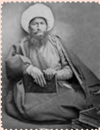
آیت‌الله حاج ملاعلی کنی

آیت‌الله ملاعلی کنی ملقب به رئیس‌المجتهدین (۱۱۸۴ - ۱۲۶۷ ش.) از علمای معروف و مبارز ایران در قرن سیزدهم و اوایل قرن چهاردهم