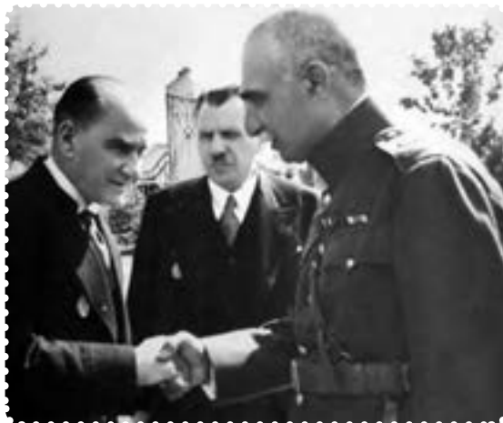
رضا شاه هنگام ملاقات با آتاتورک در ترکیه