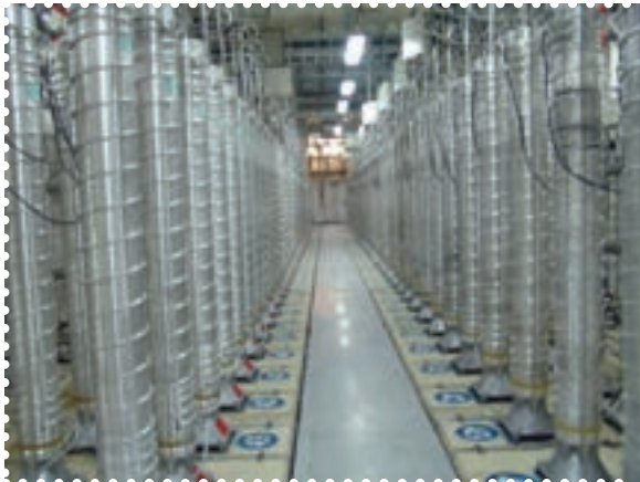
تأسیسات هسته ای نظنز

دستیابی به فناوری هسته ای صلح آمیز، یکی از عظیم ترین و افتخار آمیزترین دستاوردهای فنی و علمی انقلاب اسلامی است. دسترسی به چرخه سوخت هسته ای، یعنی فرایند تبدیل اورانیوم طبیعی به