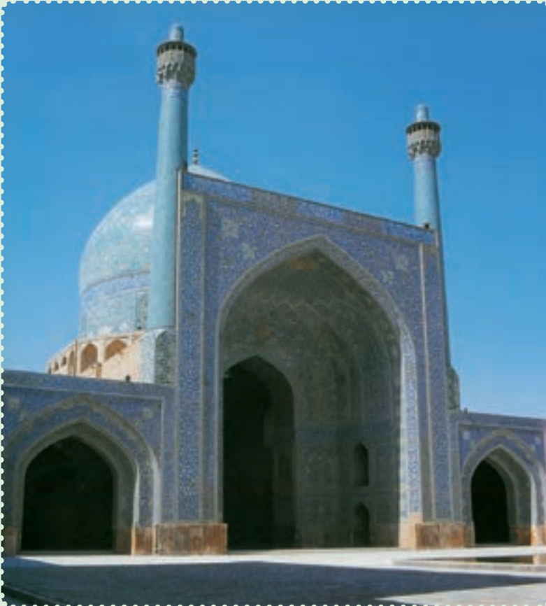
مسجد امام از آثار دوره صفوی در اصفهان

صفویان حکومتی تشکیل دادند که بیش از دو سده دوام یافت. در پرتو این حکومت مقتدر، علاوه بر برقراری امنیت و رونق اقتصادی، پیشرفت بازرگانی و کشاورزی و صنعت، تشکیل ارتش منظم و سیاست خارجی مقتدرانه، آنها توانستند فرهنگ و تمدن ایران و اسلام را بار دیگر شکوفا کنند. هنر و معماری در این دوره نیز از نظر کمی و کیفی توسعه و تحول یافت. اصفهان، پایتخت صفویان، دارای مجموعه‌ای از معماری عصر صفوی است که نشان می‌دهد، معماری ایرانی