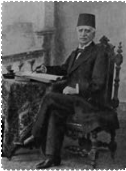
میرزا ملکم خان

ایران (معادن، جنگل‌ها، صنایع، گمرکات، بنادر، شیلات و...) که پشتوانه کشور و متعلق به نسل حاضر و آینده بود به تاراج رفت.