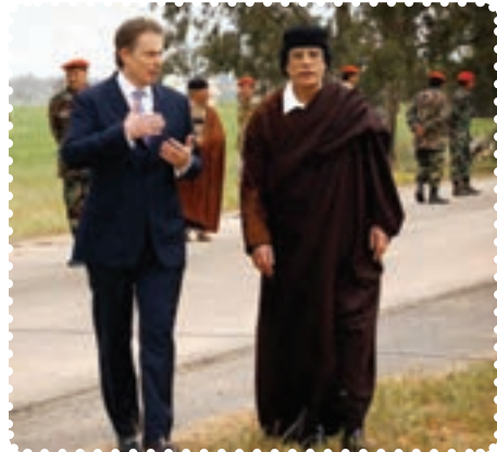
سرهنک قذافی دیکتاتور پیشین لیبی در کنار نخست وزیر انگلستان

کرد. سرانجام پس از ماه‌ها درگیری نظامی با سقوط طرابلس، حکومت قذافی سرنگون و خود او کشته شد. نکته جالب در مورد قذافی این است که وضعیت او بیش از هر دیکتاتوری به صدام شبیه بود. ت) بیداری اسلامی در یمن: جمهوری یمن در جنوب شبه جزیره عربستان واقع است و دارای نژادهای عرب (۸۶ درصد)، ترک، هندی، ایرانی و سومالیایی است. بیش از ۵۰ درصد یمنی‌ها شیعی مذهب‌اند که غالباً در منطقه صعده و شمال یمن ساکن‌اند. البته عمده شیعیان یمن زیدی‌اند که بعد از امام سجاد (ع)، زید بن علی (ع) را امام می‌دانند. مردم یمن در پی انقلاب‌های گوناگون در کشورهای اسلامی، اعتراضات و تظاهرات گسترده‌ای را در شهرهای مختلف علیه رژیم دیکتاتوری علی عبدالله