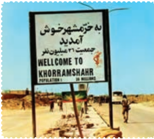
ورودی شهر خرمشهر در زمان جنگ تحمیلی

کمک به دفاع ملی دریغ نورزیدند. پس از چند هفته، دشمن متجاوز دریافت که خیال تصرف ایران، خام