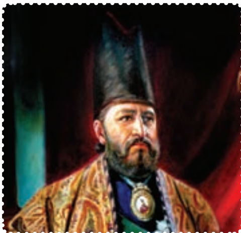
میرزا تقی‌خان امیرکبیر

کوتاه صدارت، برای حفظ تمامیت ارضی و مبارزه با دخالت بیگانگان، تلاش زیادی کرد. در روزگار او، سیاست داخلی و خارجی ایران به شدت تحت تأثیر دولت‌های بیگانه، به‌ویژه روسیه و انگلیس قرار