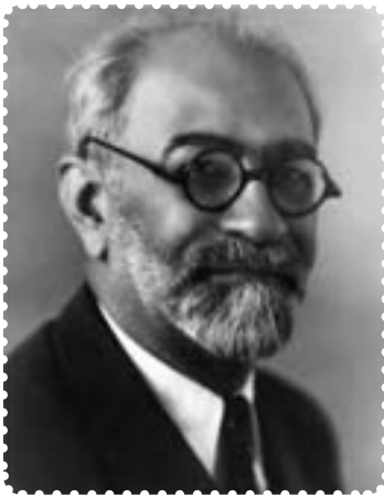
محمد علی فروغی

با انتقال سلطنت به سلسله پهلوی، محمدعلی فروغی (ذکاءالملک ۱ ) به عنوان اولین نخست‌وزیر دوران سلطنت رضاشاه منصوب شد. نخستین اقدام او، برپایی آیین تاج‌گذاری و نشستن رضاشاه بر تخت قدرت بود.