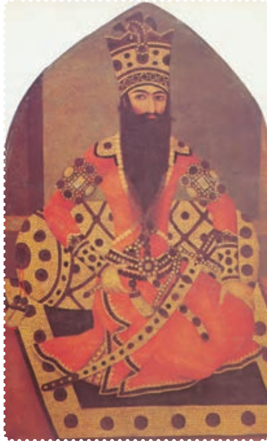
فتحعلی‌شاه، دومین پادشاه قاجاریه

ایران و روس شد. این جنگ‌ها از سال ۱۱۸۲ تا ۱۱۹۱ ش به درازا کشید، و به بسته شدن «عهدنامه گلستان» ۱ انجامید. به موجب این عهدنامه، ایران حاکمیت روسیه را بر ولایت‌هایی که تا آن زمان اشغال کرده بود به رسمیت شناخت. به این ترتیب ایالات داغستان و گرجستان و شهرهای باکو، دربند، شیروان، قره‌باغ، شکگی، گنجه، موقان و قسمت بالای طالش، به روسیه واگذار شد. به علاوه، حق کشتی‌رانی در دریای خزر، از ایران سلب گردید، در برابر، روسیه نیابت سلطنت عباس میرزا را در ایران به رسمیت شناخت و رساندن او به سلطنت را تعهد کرد. این بند که ظاهراً امتیازی برای ایران به حساب می‌آمد، در واقع به منزله نادیده گرفتن استقلال کشور و به رسمیت شناختن دخالت روسیه در امور داخلی آن بود.