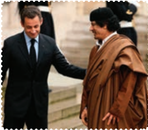
قذافی و سارکوزی رئیس جمهور پیشین فرانسه