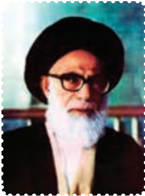
شهید آیت الله دستغیب

خواست تا به افسران فراری خارج از کشور بپیوندند. اما این قتل‌های ناجوانمردانه، مردم را در عزم خویش استوارتر می‌ساخت. ترورهای پی‌درپی منافقین، تنها شخصیت‌های بلندپایه کشور را در بر نمی‌گرفت، آنها فقط در عرض یک ماه، ۳۷۰ نفر زن، مرد و حتی کودک را آماج حملات خود قرار دادند. برای ایجاد رعب و وحشت، بسیاری از ترورها مقابل چشمان سایر اعضای خانواده انجام می‌شد. تروریست‌ها حتی در مساجد و کانون‌های دینی و مصلاهای نماز جمعه، به انفجار بمب و ترور ائمه جمعه و جماعات اقدام می‌کردند. شهدای محراب، آیت‌الله سیدعبدالحسین دستغیب در شیراز، آیت‌الله مدنی در تبریز، آیت‌الله صدوقی در یزد، آیت‌الله اشرفی اصفهانی در کرمانشاه و حجت‌الاسلام هاشمی‌نژاد، دانشمند و روحانی مؤثر مشهد، از این جمله بودند. ترور این دانشمندان و حتی عالمانی از روحانیان اهل سنت، نشانگر این بود که دشمنان انقلاب بیش از هر چیز، از اندیشه متفکران اسلامی بیمناک‌اند.