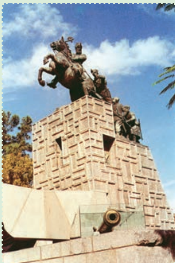
مجسمه و آرامگاه نادرشاه افشار در مشهد مقدس

توانست با شیوه حکومت داری توأم با ملاحظت، عدالت و رفاه نسبی، نام نیکی از خود بر جای بگذارد. ۱ وی تلاش کرد روابط خارجی ایران را که به دلیل هرج و مرج و نبود امنیت دچار اختلال شده بود، سامان بخشد، همچنین در برابر گسترش فعالیت‌های بازرگانی انگلستان در ایران ایستادگی کرد ۲ و از منافع نامشروع و استعماری این دولت جلوگیری به عمل آورد.