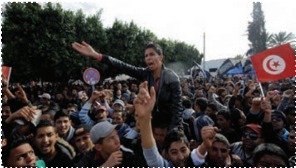
تظاهرات مردم تونس علیه دیکتاتور وابسته به غرب

الف) بیداری اسلامی در تونس: تونس کشوری اسلامی در شمال آفریقا است که در کنار دریای مدیترانه واقع شده است و به دلیل موقعیت جغرافیایی، سیاسی، تجاری و سوق‌الجیشی، نقش مهمی را در سیاست کلی آفریقا و کشورهای عربی برعهده دارد و به همین علت، از دیرباز مورد طمع قدرت‌های استعماری بوده است. به گونه‌ای که ژول فری، نخست وزیر اسبق فرانسه از تونس به عنوان «کلید خانه فرانسویان» یاد می‌کند. ۱ فعالیت‌های سیاسی در تونس به دلایل مختلف، از جمله نزدیکی جغرافیایی با اروپا، آشنایی اکثریت مردم به زبان فرانسه، وجود مراکز متعدد آموزش عالی، رفت و آمد میلیون‌ها جهانگرد خارجی به خصوص اروپاییان، گسترش فعالیت مطبوعات و به‌طور کلی گسترش آگاهی‌های عمومی مردم، از سایر کشورهای منطقه و جهان عرب بیشتر است.