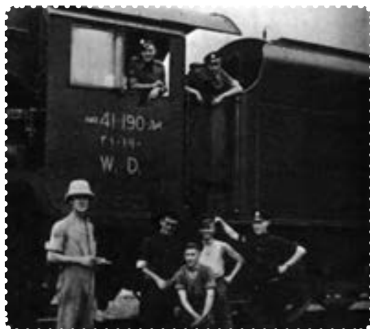
اشغالگران از راه آهن ایران برای مقاصد نظامی خود استفاده می‌کردند.

سرانجام در سوم شهریور ماه ۱۳۲۰/۲۵ اوت ۱۹۴۱ سفیران انگلیس و شوروی، طی