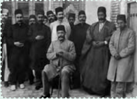
مخبر السلطنه (مهدی قلی هدایت) به هنگام والیگری آذربایجان (بار دوم)

مخبر السلطنه دربارهٔ حجاب نوشته است: «...چادر رسم ایرانیان بود و ریشه در فرهنگ گذشتهٔ ایران داشت ... در شاهنامه در سه جا ذکر «چادر» شده است و در گذشته، چادر حفاظ و فخر نجبا بود و ما که مدعی تجدید دورهٔ پهلوانی و باستانی هستیم، در تخت جمشید و یا نقش‌های بیستون، صورت زن، نیست» ۱ .