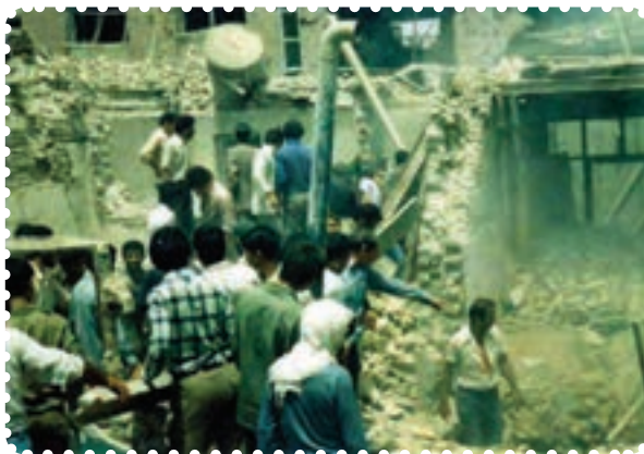
دزفول در پی یکی از حملات موشکی

در طول مدت جنگ شهرها، ارتش عراق موشک‌های دوربرد بسیاری به شهرهای ایران پرتاب کرد. ۱ به علاوه، استفاده از گازهای شیمیایی در جبهه‌های جنگ را در پیش گرفت. در چنین شرایطی، آمریکا رسماً به کمک نیروهای صدام آمد. اعزام ناوگان جنگی به خلیج فارس و هدف قرار دادن هواپیمای مسافربری ایران در تیرماه ۱۳۶۷، از جمله اقدامات ناجوانمردانهٔ آمریکایی‌ها بود.