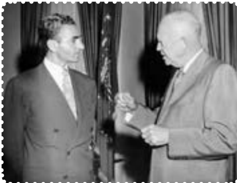
شاه در ملاقات با آیزنهاور رئیس‌جمهور آمریکا

آمریکا که از کمک به دولت دکتر مصدق اجتناب می‌کرد، پس از پیروزی کودتاچیان کمک‌های زیادی در زمینه‌های نظامی و اقتصادی به دولت کودتا کرد. ۱ باروی کارآمدن دولت نظامی زاهدی ۲ ، فضای تیره‌ای در جامعه ایران حکم فرما شد، فرمانداری نظامی تهران به سرتیپ تیمور بختیار سپرده شد. بختیار که افسری بی‌رحم و خونریز بود، برای استقرار و تثبیت حکومت کودتا، سرکوب نیروهای ضدکودتا