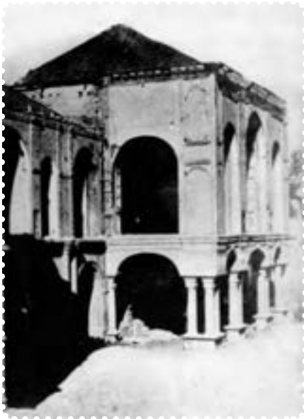
ساختمان مجلس شورای ملی پس از به توپ بستن توسط لیاخوف در ایام مشروطیت

ملک‌المتکلمین و سید جمال‌الدین واعظ اعدام شدند. بعضی از نمایندگان نیز که مورد تعقیب قرار گرفته بودند (از جمله تقی‌زاده)، به سفارت انگلیس پناه بردند. ۱ بدین گونه، دوباره، برای مدتی، استبداد حاکم شد. این دوره که یک سال به طول انجامید بار دیگر استبداد به جای مشروطیت حاکم شد. از این رو آن را دوره استبداد صغیر نامیده‌اند.