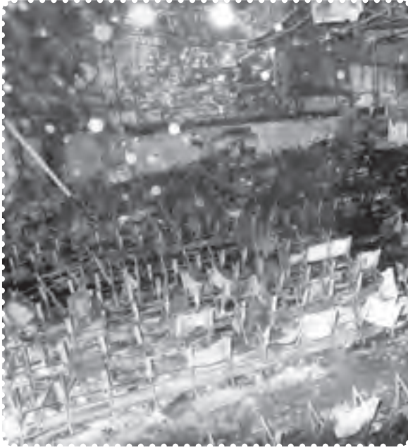
سینما رکس آبادان

امام خمینی، به شدت مورد حمله و توهین قرار گرفته بود. ۱