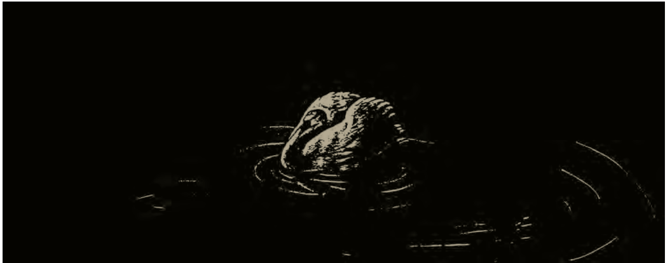
اثر : عبدا... حاجیوند (نقاشی برای همین کتاب)