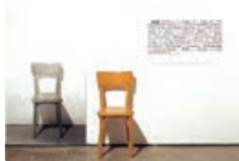
یک و سه صندلی - جوزف کاسوت

هنرمندان برجسته: پیت موندریان، مارک روتکو، جوزف آبرز، بورگان دیلر.