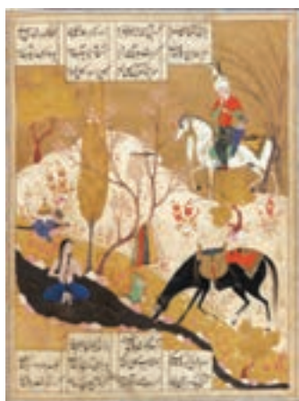
شیرین در حال آبستن کردن و نظاره خسرو