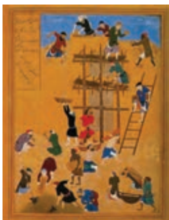
ساختن کاخ خورنق، بهزاد