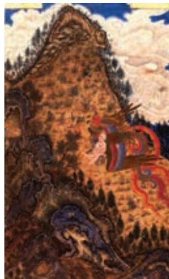
زال و سیمرغ