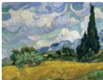
شب پر ستاره - ون گوگ

گرافتن لندن برگزار شد و فرای آن را ((مانه و پست امپرسیونیست‌ها)) نامید. هنرمندان برجسته: پل سزان، ونسان ونگوگ و پل گوگن در میان این هنرمندان سزان شهرت خاصی دارد. شیوه کاری وی به گونه‌ای بود که او را باز کننده راه برای سبک کوبیسم می‌دانند.