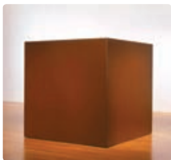
مرگ - تونی اسمیت