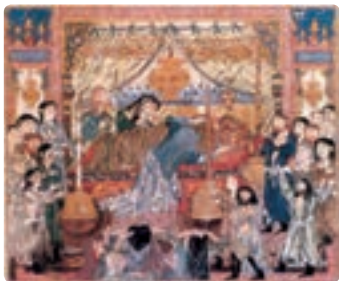
مرگ اسکندر - شاهنامه ایلخانی - تبریز