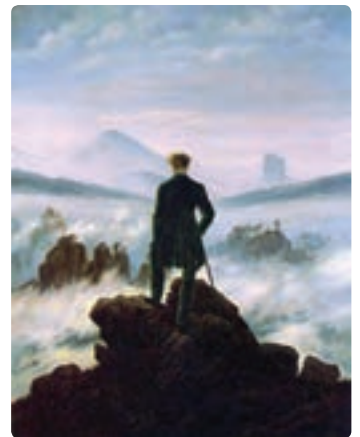
گاسپار دیوید فریدریش

رمانتیسیسم، مهمترین جنبش هنری و ادبی قرن ۱۹ است، که در تقابل با خردگرایی نئوکلاسیک، در انگلستان و آلمان مطرح شد. هنرمندان این جنبش، با استفاده از رنگ‌ها و خطوط درون‌نما و با هویتی خردگریز، سعی در بیان احساسات و هیجانات خود دارند. مهم‌ترین مرکز تولید آثار تجسمی رمانتیسیسم، انگلستان است. شعار هنر برای هنر، اولین بار توسط پیروان این مکتب (و پس از آنها توسط پیروان مکتب سمبولیسم) مطرح می‌شود. هنرمندان برجسته: جان کاتمن، جان کنستابل، ویلیام ترنر، اوژن دلاکروا، تئودور ژریکو، فریدریش، گویا، ویلیام بلیک، فرانسوا رود (با اثر معروف لامارسیز)