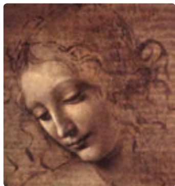
سوزان، لئوناردو داوینچی

در قرن ۱۴ میلادی، به مرکزیت ایتالیا در فلورانس، رنسانس به وجود آمد. رنسانس به معنای نوزایی می‌باشد. از ویژگی‌های این دوره استفاده از ویژگی‌های یونان و روم، انسان‌گرایی، فردیت‌گرایی، عقل‌گرایی، ناتورالیسم و مضامین مسیحی را می‌توان نام برد. ویژگی‌های تجسمی آثار این دوره شامل استحکام ساختار ترکیب‌بندی، استفاده از رنگ‌های روشن و تابناک، تأکید بر پرسپکتیو علمی و هنری، سایه روشن کاری، تأکید بر فضا با فعال کردن عامل مکان می‌باشد. رنسانس به سه دوره تقسیم می‌شود: