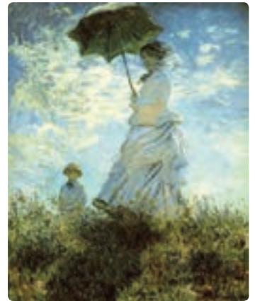
بانویی با چتر - کلود مونه

هنرمندان برجسته: ژرژ سورا، کلود مونه، پیر آگوست رنوار، آلفرد سیسلی، کامی پیسارو، ادگار دگا، پل سزان