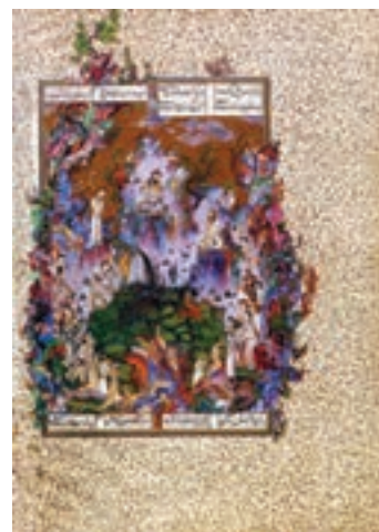
بارگاه کیومرث، سلطان محمد

«رضا عباسی» را پایه گذار این مکتب می دانند. از ویژگی های دیگر این مکتب می توان از نقاشی به صورت رقع، استفاده از خطوط منحنی، استفاده از حداقل رنگ و استفاده از حالت توصیفی و بیانی خطوط نام برد.