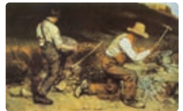
سنگ‌شکنان - گوستاو کوربه

رئالیسم به صورت جامع و کلی به مفهوم حقیقت، واقعیت و وجود مسلم، و نیز نفی تخیلات و امور ناممکن و غیر عملی است. رئالیسم در هنرهای تصویری و ادبیات، نمایش چیزها به شکلی است که در زندگی روزانه هستند بدون هرگونه آرایش یا تعبیر افزون. در این شیوه از نقاشی هنرمند باید در نمایش طبیعت (طبیعت بدون انسان و با انسان) از هرگونه احساساتی‌گری خودداری کند. که در اواسط قرن نوزدهم در فرانسه رواج پیدا کرد.