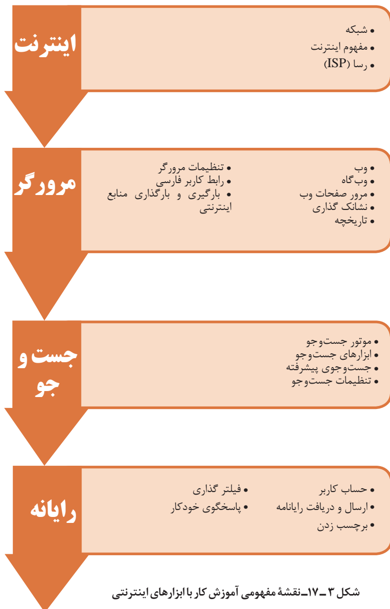
شکل ۳-۱۷- نقشه مفهومی آموزش کار با ابزارهای اینترنتی