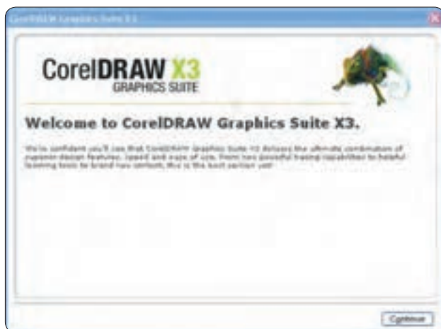
شکل ۱-۱ کادرمحاوره راهنمای نصب

در کادرمحاوره بعدی، شماره سریال (Serial Number) را در بخش 'Already have a Trial serial number?' از محتوای CD پیدا کرده و در کادر متنی مربوطه وارد کنید. سپس روی دکمه Continue کلیک کرده و وارد کادرمحاوره بعدی شوید (شکل ۱-۲).