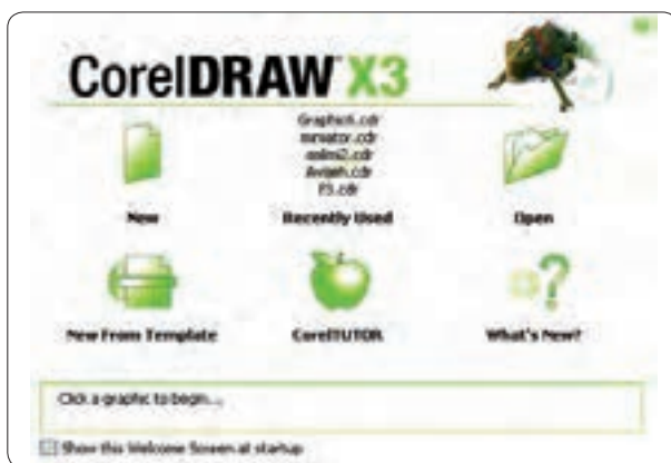
شکل ۴-۱ کادر محاوره خوشامدگویی

از مسیر Start/All Programs/Corel Graphics Suite X3 روی آیکن Corel DRAWX3 کلیک کنید تا نرم‌افزار اجرا شود. با اجرای نرم‌افزار، در ابتدای ورود به برنامه کادر محاوره خوشامدگویی (Welcome screen at startup) ظاهر می‌شود (شکل ۴-۱).