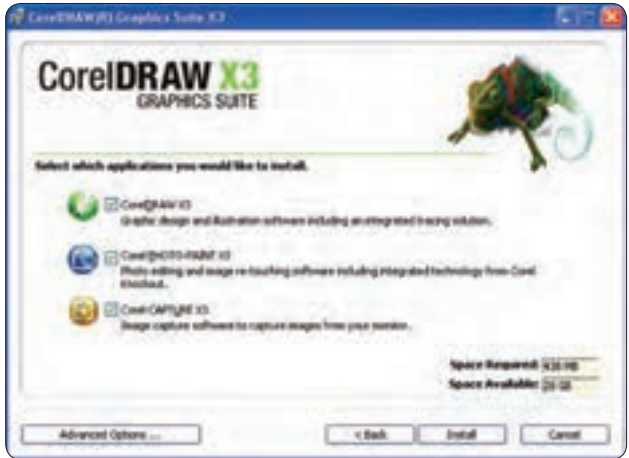
شکل ۱-۳ پنجره راهنمای نصب