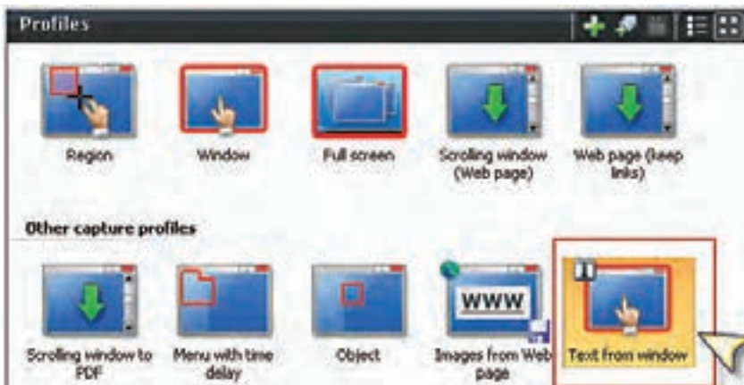
شکل ۳-۲ انتخاب نوع ورودی از بخش Profiles

پنجره‌های را که می‌خواهید متن موجود در آن را جدا کنید، باز کرده و سپس در نرم‌افزار SnagIt از پانل Profile گزینه‌ی Text from a window را انتخاب کنید. اکنون اگر دکمه Capture را که در قسمت پایین و سمت راست کادر محاوره قرار دارد، کلیک کنید یا از کلید میانبر تعریف شده (Print Screen) استفاده کنید، اشاره‌گر ماوس به شکل یک دست در می‌آید؛ در این حالت چنانچه روی پنجره مورد نظر کلیک کنید، عملیات Capture انجام خواهد شد. (شکل ۳-۲)