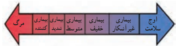
شکل طیف سلامت و بیماری

سلامت و بیماری دارای درجات مختلفی است. عده‌ای از مردم در ظاهر هیچ‌گونه ناراحتی یا علامتی از بیماری ندارند اما با انجام آزمایش و معاینه دقیق مشخص می‌شود که آن‌ها بیمارند. این‌گونه بیماری‌ها را بیماری‌های بدون علامت می‌نامند. در اغلب بیماری‌ها نشانه‌هایی هست که سبب تشخیص آن بیماری‌ها می‌شود، بیماری شدید شکل دیگر بیماری است که ممکن است به معلولیت و حتی مرگ منتهی شود. بنابراین طیف سلامت و بیماری از نقطه اوج سلامت شروع و به مرگ منتهی می‌شود.