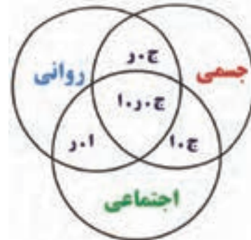
ارتباط ابعاد جسمی، روانی، اجتماعی در انسان

اغلب مردم برای تعیین سلامت افراد، به ظاهر فیزیکی آن‌ها توجه می‌کنند و اگر در ظاهر آن‌ها نشانه‌ای از درد و علائمی از بیماری جسمی مشاهده نشود او را شخصی سالم می‌دانند. براساس تعریفی که در اساس نامهٔ سازمان جهانی بهداشت ۱ آمده است، سلامت عبارت است از رفاه کامل جسمی، روانی و اجتماعی و نه فقط نبودن بیماری و معلولیت