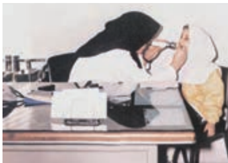
۳- سطح سوم: این سطح از پیشگیری زمانی مطرح از عینک و ... است.

بیماری یعنی تب رماتیسمی در شخص مبتلا می‌شود.