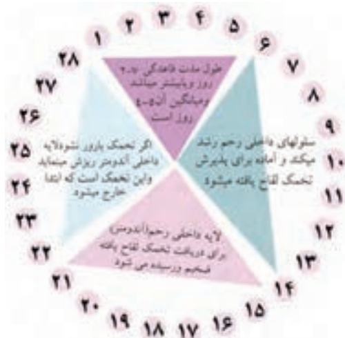
چرخه تغییرات در یک دوره قاعدگی

قاعدگی با افزایش بیش‌تر هورمون‌ها دیواره‌ی داخلی رحم ضخیم‌تر می‌شود. چنانچه در این زمان لقاح صورت بگیرد، تخمک آزاد شده از تخمدان، بارور شده و در دیواره جایگزین می‌شود اما اگر تخمک بارور نشود، مجدداً میزان هورمون‌ها کاهش می‌یابد و به تدریج دیواره‌ی داخلی رحم نازک می‌شود تا این‌که با نزدیک شدن به زمان خونریزی قاعدگی دوباره ریزش می‌کند و خونریزی بعدی اتفاق می‌افتد.