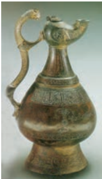
▲ شکل ۹-۱۵- ظرف فلزی

فلزکاران نیز در این دوره همه گونه اشیاء زیبا را به شیوه‌های گوناگون فلزکاری می‌ساختند و بیشترین شکل‌ها و نقش‌های به‌جا مانده نقوش جانوری، پرندگان و یا موجودات تلفیقی است. شاخص اصلی شکل ظروف در کاربردهای مختلف، نقش پرنده و شاخه با تزیینات شبدری ۱ و ترنجی ۲ بوده است (شکل ۹-۱۵). همچنین بیشتر این نقوش بر روی گچ‌بری‌ها و سفالگری نیز دیده می‌شود. هنر سفالگری در این دوره نیز به تدریج از لحاظ کمیت و کیفیت پیشرفت کرد و به موازات هنر فلزکاری مفرغی به عالی‌ترین درجه خود نائل گردید. پخت سفال‌هایی خاص و نازک به نام «پوست تخم مرغی» که با طرح‌های ظریف شاخ و برگ گیاهی تزیین شده و به وسیله لعاب شفاف قلیایی پوشانده شده بود، در این دوره به وجود آمد (شکل ۹-۱۶). وجود ظروف با تزیین مینایی ۳ که از نظر ظرافت و تنوع نقوش با نسخه‌های خطی این دوره قابل مقایسه است، بر همکاری نگارگران و سفالگران دلالت دارد. بیشترین