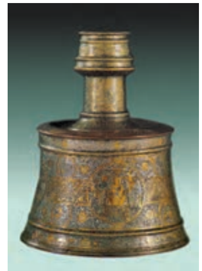
▲ شکل ۲۱-۱۰- پایه شمعدان فلزی، شیراز