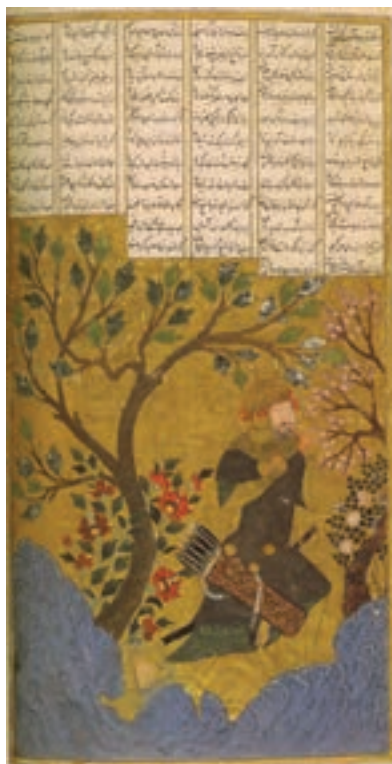
▲ شکل ۱۴-۱۰- برگي از مجموعه شعر مکتب شیراز سال ۸۰۰ هجری