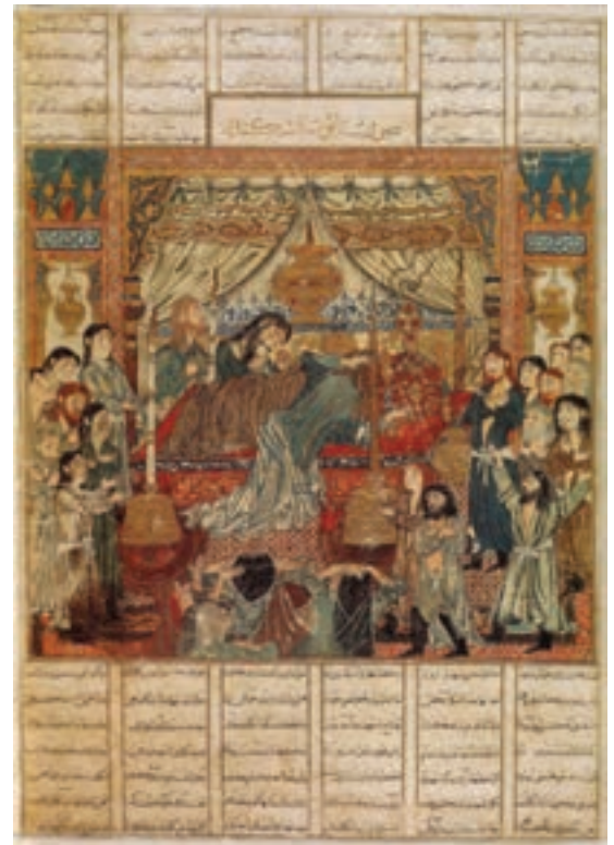
▲ شکل ۱۰-۱۰- برگی از کتاب شاهنامه بزرگ مغول، مکتب تبریز

همزمان با دوران تسلط ایلخانان مغول، نگارگران شیراز توانستند میراث‌دار سنت‌های پیشین هنری ایران در نگارگری باشند. آنها همت بسیاری در تولید آثار