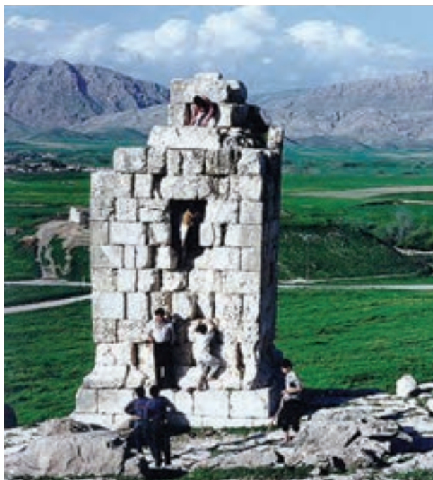
▲ شکل ۷-۹- میل ازدها، نورآباد ممسنی، فارس، دوره اشکانی

توجه به معماری‌های غیرمذهبی بنا به ضرورت و نیاز فرمانروایان این دوره در شکل کاخ‌ها (شکل ۹-۹) و دیگر بناهای مرتبط با تجارت، بازرگانی و سفر از جمله رباط‌ها و کاروانسراها (شکل ۹-۱۰) به ظهور رسیده است. در تمامی بناهای این دوره از مصالح و فنون ساخت عالی، طاقسازی، گنبد و عناصر مختلف معماری به خوبی بهره‌برداری شده است. همچنین کتیبه‌نگاری در تمامی بخش‌های بنا به کار رفته و توانسته ضمن نقش تزئینی، جنبه‌های کاربردی آن نیز مورد توجه باشد.