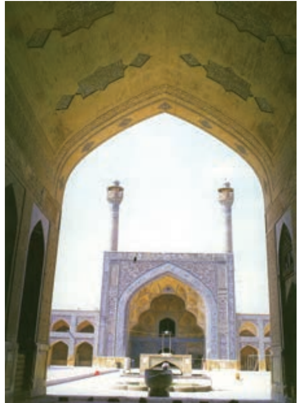
▲ شکل ۹-۲ الف- مسجد جامع، اصفهان، طرح تکمیلی سده‌های چهارم تا ششم هجری