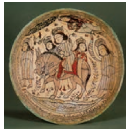
▲ شکل ۱۸-۱۰ - ظرف سفالین، کاشان

سفالگری در این دوره نیز مورد توجه بوده است و از مهم‌ترین مراکز تولید سفال کاشان، ری و سلطان‌آباد است. سفالگران کاشانی به دلیل دارا بودن امکانات منطقه‌ای رشد قابل ملاحظه‌ای در سفالگری داشتند. آنها توانستند در این دوره نوشته‌های برجسته‌ای را به نقاشی بیفزایند و فن مشبک‌سازی ظروف سفالین را به کمال برسانند. همچنین در تزیین از طراحی و خطاطی و شیوه نگارگری بهره بردند (شکل ۱۸-۱۰). از مناطق رقیب کاشان بایستی به ری اشاره کرد که غالباً بر روی سفالینه‌ها موضوعاتی از جمله مجالس شکار یا چوگان را بر زمینه سفید یا لاجوردی به همراه نقش ترنج‌های زیبا و پرکار استفاده می‌کردند (شکل ۱۹-۱۰). همزمان شیوه سلطان‌آباد با نوعی ترنج چهارپر که درون آن را با تصاویر بسیار زنده از جمله گوزن و آهو پر می‌کردند به شیوه‌ای خاص و بدیع مبدل شد. در آن طرح شکوفه‌هایی با خط‌های باریک آبی روی زمینه‌های تاریک اجرا می‌شد (شکل ۲۰-۱۰ الف و ب).