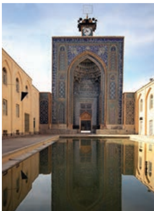
▲ شکل ۵-۱- مسجد جامع کرمان