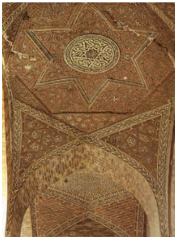
▲ شکل ۲-۱- نمای داخلی گنبد سلطانیه، زنجان

مهم‌ترین تحول معماری در این دوره که در برخی منابع آن را به شیوه آذری خوانده‌اند، شامل بلندی بنا، گنبد‌های ساق بلند، نقشه هشت ضلعی و گنبد دو پوسته و ایوان‌های باریک و بلند است. همچنین بلندتر شدن سقف اتاق‌ها و ارتفاع مناره‌ها، تزیینات بنا با پوشش کاشی، گچ کاری رنگی و مقرنس کاری ۱ است (شکل ۲-۱). شاخص‌ترین اثر معماری این دوره را می‌توان مسجد جامع ورامین (شکل ۳-۱)، مسجد جامع یزد (شکل ۴-۱)، مسجد جامع کرمان (شکل ۵-۱)، آرامگاه بایزید بسطامی (شکل ۶-۱)، آرامگاه شیخ عبدالصمد