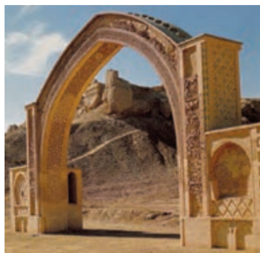
▲ شکل ۹-۹- کاخ لشکری بازار، غزنه، افغانستان

۱- رباط (کاروانسرا) : محلی بین راه برای استراحت و اقامت مسافر و کاروان است.