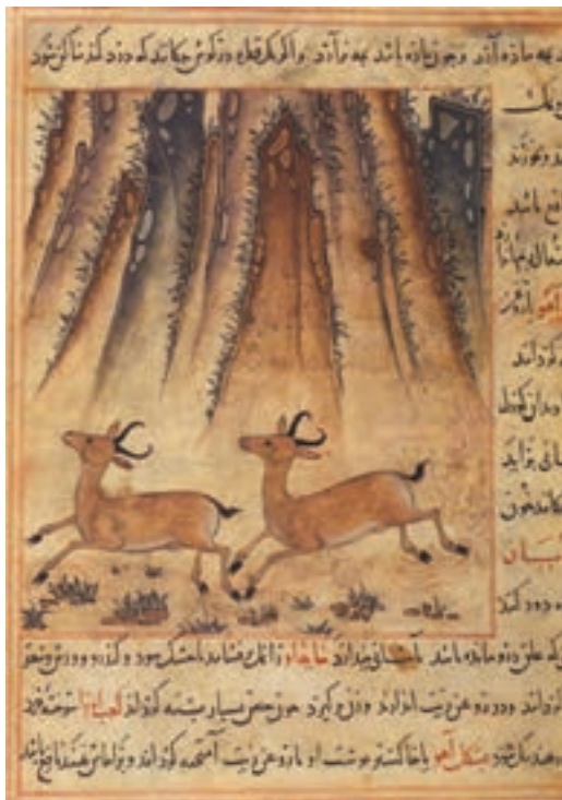
▲ شکل ۱۲-۱۰- برگی از کتاب منافع الحيوان