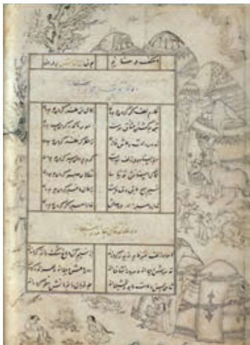
▲ شکل ۱۶-۱۰ - تشعیر، برگه از کتاب دیوان سلطان احمد جلایر

سفالگری در این دوره نیز مورد توجه بوده است و از مهم‌ترین مراکز تولید سفال کاشان، ری و سلطان‌آباد است. سفالگران کاشانی به دلیل دارا بودن امکانات منطقه‌ای رشد قابل ملاحظه‌ای در سفالگری داشتند. آنها توانستند در این دوره نوشته‌های برجسته‌ای را به نقاشی بیفزایند و فن مشبک‌سازی ظروف سفالین را به کمال برسانند. همچنین در تزیین از طراحی و خطاطی و شیوه نگارگری بهره بردند (شکل ۱۸-۱۰). از مناطق رقیب کاشان بایستی به ری اشاره کرد که غالباً بر روی سفالینه‌ها موضوعاتی از جمله مجالس شکار یا چوگان را بر زمینه سفید یا لاجوردی به همراه نقش ترنج‌های زیبا و پرکار استفاده می‌کردند (شکل ۱۹-۱۰). همزمان شیوه سلطان‌آباد با نوعی ترنج چهارپر که درون آن را با تصاویر بسیار زنده از جمله گوزن و آهو پر می‌کردند به شیوه‌ای خاص و بدیع مبدل شد. در آن طرح شکوفه‌هایی با خط‌های باریک آبی روی زمینه‌های تاریک اجرا می‌شد (شکل ۲۰-۱۰ الف و ب).