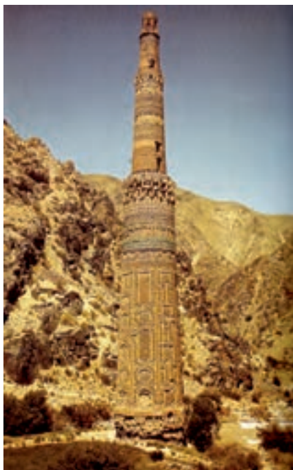
▲ شکل ۸-۹- منار جام، افغانستان