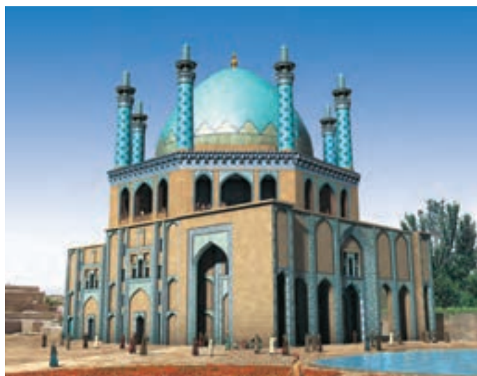
▲ شکل ۱-۱۰ ب - طرح بازسازی شده گنبد سلطانیه

در سده‌های هفتم و هشتم هجری با حملات فراگیر مغول به مرز و بوم ایران برای مدتی اوضاع نابسامانی شکل گرفت. اما با درایت اندیشمندان و سیاستمداران ایرانی و نفوذ آنان به دستگاه حکومت این اقوام وحشی شرایط به گونه دیگری رقم خورد. همین مردمانی که با نگرشی وحشیانه و خونخوار تربیت یافته بودند به فرمانروایان هنردوست تبدیل شدند. از جمله اقدامات مهم فرهنگی در این دوره ربیع رشیدی ۱ است. در این دوره شاهد برپایی برخی از عظیم‌ترین و پیچیده‌ترین بناها و همچنین هنرهای متفاوت هستیم. این دوران زمینه‌ساز حکومت‌های متفاوت مغولی از جمله بر سرکار آمدن ایلخانان، جلایریان، آل مظفر و ... می‌باشد.