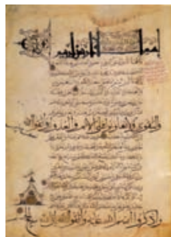
▲ شکل ۹-۱۱- برگه از قرآن کریم با خطوط مختلف

مهم‌ترین ویژگی هنر نگارگری این دوران را می‌توان در استفاده رنگ سرخ زمینه، پرکردن زمینه با نقش اسلیمی، پوشش لباس‌های بدون چین و چروک و شیوه ترسیم انتزاعی نقوش گیاهی دانست. همچنین پیکره‌های کوتاه قامت، صورت‌های تمام رخ با دهان تنگ و چشمان مورب و قلم‌گیری (که بازمانده از سنت‌های نقاشی مانوی است) از دیگر ویژگی‌های نگارگری این دوره است. از نقش‌های پارچه، ظروف فلزی و سفالینه‌ها می‌توان وجود هنر نگارگری بسیار ظریفی را بازشناخت. بنا به اسناد تاریخی، نخستین نمونه نقاشی کتاب در این دوره اندرزنامه (قابوس‌نامه) است. اما شاخص‌ترین اثر کتاب فارسی مصور، کتاب «ورقه و گلشاه» است که در آن پیوند شعر و نقاشی به‌طور کامل مشهود است (شکل ۹-۱۲). نقاشی این دوره ریشه در نگرش تصویرسازی کهن ایرانی دارد.