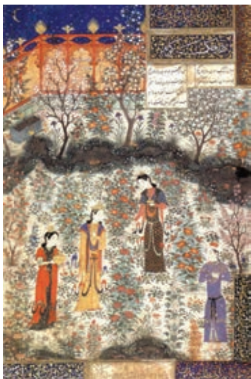
▲ شکل ۱۵-۱۰- برگي از کتاب دیوان خواجه کرمانی

مکتوب و سنت کتابت داشتند و ابداعاتی را در زمینه نقاشی و نگارگری ایجاد کردند. در این مکتب بر انسان تأکید تصویری بسیاری شده است. پیکره‌ها بیش از حد بلند قامت و بی‌تناسب با منظره و معماری کشیده می‌شد، پیرامون وی را نقوش گیاهی بسیاری پر می‌کرد و زمینه افق در بالا به کار می‌رفت. همچنین نوعی هماهنگی خط و رنگ رعایت می‌شد (شکل ۱۴-۱۰).