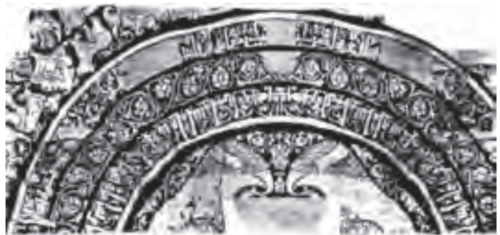
▲ شکل ۹-۱۴- بخشی از پارچه با طرح پرنده

فلزکاران نیز در این دوره همه گونه اشیاء زیبا را به شیوه‌های گوناگون فلزکاری می‌ساختند و بیشترین شکل‌ها و نقش‌های به‌جا مانده نقوش جانوری، پرندگان و یا موجودات تلفیقی است. شاخص اصلی شکل ظروف در کاربردهای مختلف، نقش پرنده و شاخه با تزیینات شبدری ۱ و ترنجی ۲ بوده است (شکل ۹-۱۵). همچنین بیشتر این نقوش بر روی گچ‌بری‌ها و سفالگری نیز دیده می‌شود. هنر سفالگری در این دوره نیز به تدریج از لحاظ کمیت و کیفیت پیشرفت کرد و به موازات هنر فلزکاری مفرغی به عالی‌ترین درجه خود نائل گردید. پخت سفال‌هایی خاص و نازک به نام «پوست تخم مرغی» که با طرح‌های ظریف شاخ و برگ گیاهی تزیین شده و به وسیله لعاب شفاف قلیایی پوشانده شده بود، در این دوره به وجود آمد (شکل ۹-۱۶). وجود ظروف با تزیین مینایی ۳ که از نظر ظرافت و تنوع نقوش با نسخه‌های خطی این دوره قابل مقایسه است، بر همکاری نگارگران و سفالگران دلالت دارد. بیشترین