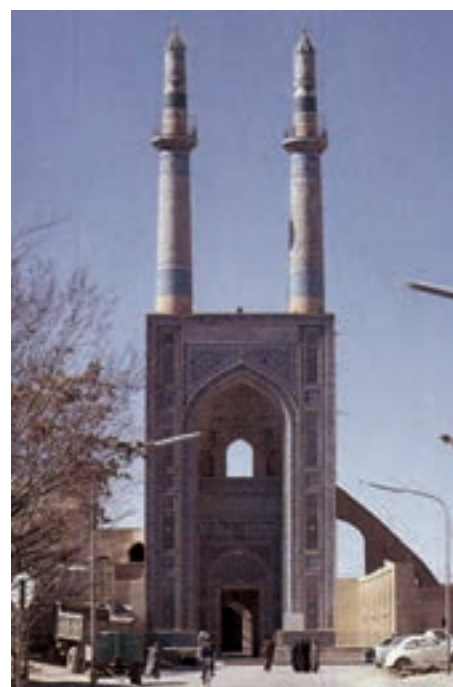
▲ شکل ۴-۱- مسجد جامع یزد