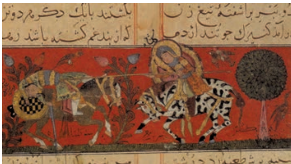
▲ شکل ۹-۱۲- برگه از کتاب ورقه و گلشاه

در بین سده‌های چهارم تا ششم هجری مهارت بافندگی پارچه منقوش نیز به کمال رسید. در این پارچه‌ها طرح، نقش و بافت با وحدتی بی‌نظیر باعث شده تا آثار نفیسی به وجود آید. هنرمند با آوردن درخت مقدس زندگی ۱ ، تاک‌های پیچاپیچ، نخل، خوشنویسی و هیكل‌های نرم و لطیف جانوران و