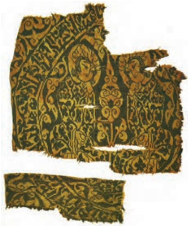
▲ شکل ۹-۱۳- نمونه پارچه آل بویه با طرح ساسانی، ابریشم

صورت‌های متین انسانی، نوعی وحدت موضوعی با بافت پارچه پدید آورده است (شکل ۹-۱۳). جنس اغلب این پارچه‌ها، ابریشمی و میراث‌دار هنر و سنت ساسانی است. از جمله نقش‌های منحصر به فرد، نقش شیر و طاووس در دو طرف درخت زندگی است که در دایره‌ای محاط شده (طاووس نشانه آسمان پرستاره) است. همچنین وجود برگ پهن با نقطه‌های درشت از سبک سفال‌های مینایی اقتباس شده است. وجود حشرات (پروانه) در این نوع نقش و بافت پارچه، نوعی بدعت و ابتکار در نقوش است. طرح دو طاووس و نخل با ساقه نازک که شاخ و برگش مانند چهره انسانی است از ابداعات هنرمندان دوره اسلامی به‌شمار می‌رود (شکل ۹-۱۴). این پارچه‌ها معمولاً در کاربردهای مختلف و با رنگ‌های متنوع که نشان دهنده مهارت بالای رنگرزی الیاف است، تولید می‌شده است.