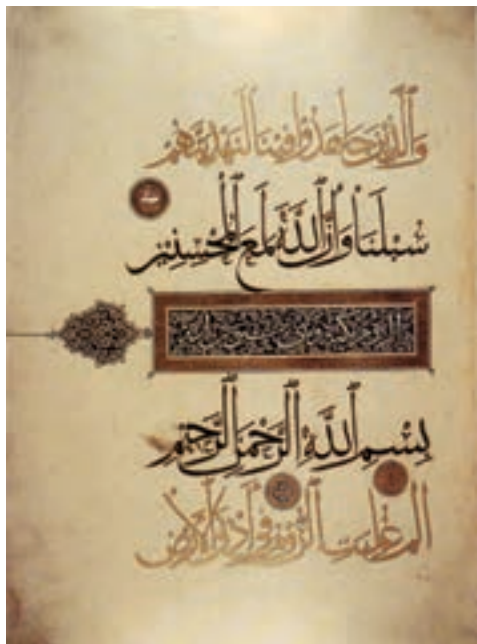
▲ شکل ۱۷-۱۰ - برگه از قرآن مجید

همچنین هنر کتاب آرایبی و خوشنویسی در زمینه‌های گسترده‌ای رواج یافت و کتابت را به هنری فاخر مبدل ساخت. این تحول با حضور استادان شش‌گانه خوشنویسی - از شاگردان یاقوت مستعصمی - در سه منطقه مهم فارس، خراسان و آذربایجان شکل می‌گیرد. این خوشنویسان هنر خویش را در کاربردهای مختلف تزیین بناها و کتابت نسخه‌های خطی گسترش دادند (شکل ۱۷-۱۰). همچنین ابداع خط نستعلیق توسط میرعلی تیریزی نیز به دوره جلایریان بازمی‌گردد.