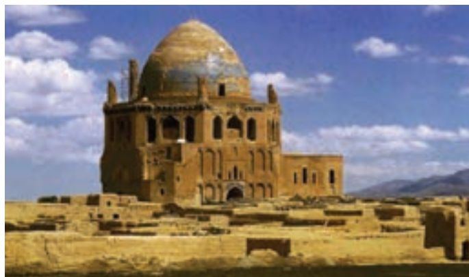
▲ شکل ۱-۱۰ الف - گنبد سلطانیه، آرامگاه اولجایتو، زنجان

در سده‌های هفتم و هشتم هجری با حملات فراگیر مغول به مرز و بوم ایران برای مدتی اوضاع نابسامانی شکل گرفت. اما با درایت اندیشمندان و سیاستمداران ایرانی و نفوذ آنان به دستگاه حکومت این اقوام وحشی شرایط به گونه دیگری رقم خورد. همین مردمانی که با نگرشی وحشیانه و خونخوار تربیت یافته بودند به فرمانروایان هنردوست تبدیل شدند. از جمله اقدامات مهم فرهنگی در این دوره ربیع رشیدی ۱ است. در این دوره شاهد برپایی برخی از عظیم‌ترین و پیچیده‌ترین بناها و همچنین هنرهای متفاوت هستیم. این دوران زمینه‌ساز حکومت‌های متفاوت مغولی از جمله بر سرکار آمدن ایلخانان، جلایریان، آل مظفر و ... می‌باشد.