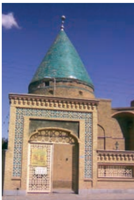
▲ شکل ۶-۱- آرامگاه بایزید بسطامی