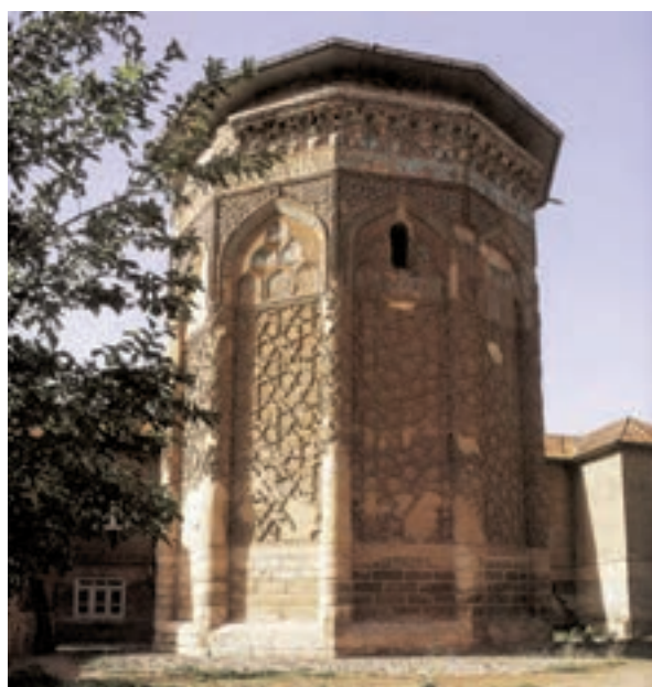
▲ شکل ۹-۵- گنبد کبود، مراغه، آذربایجان شرقی