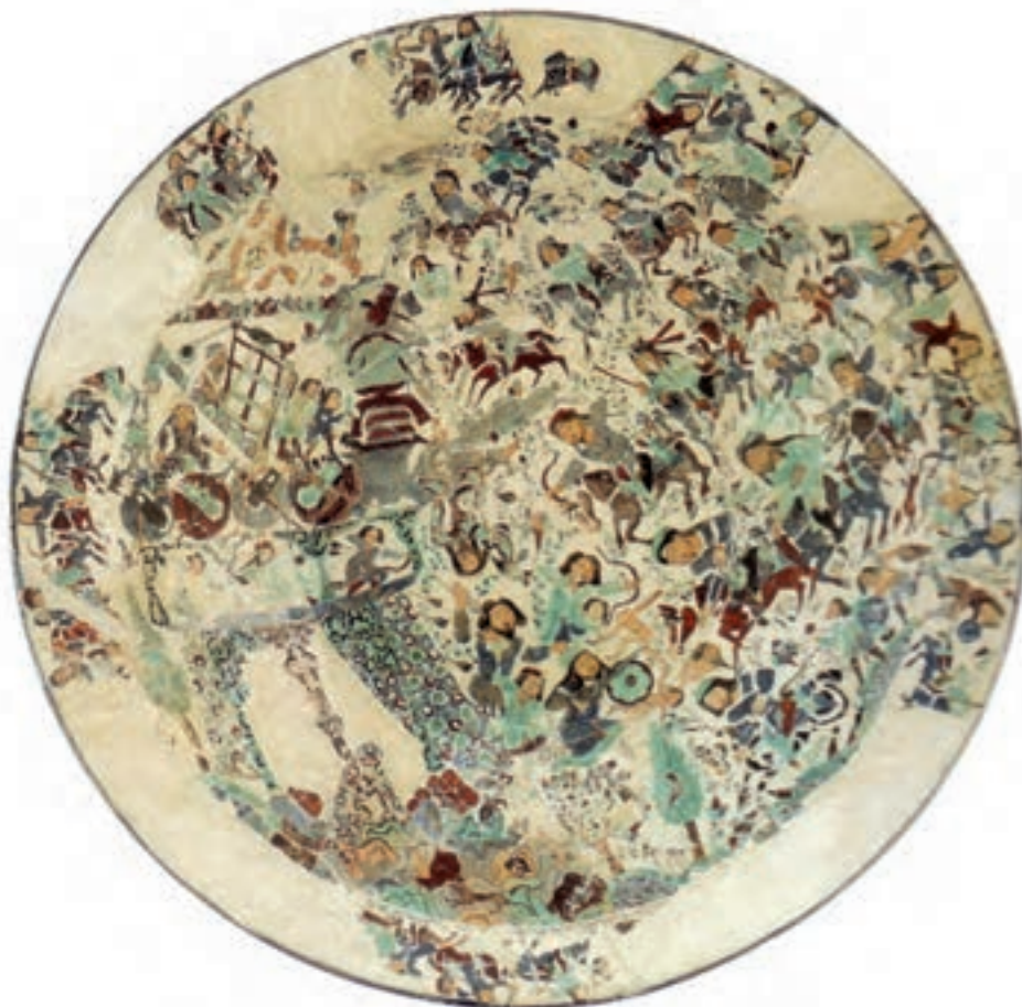
▲ شکل ۱۷-۹- ظرف مینایی، دوره خوارزمشاهی