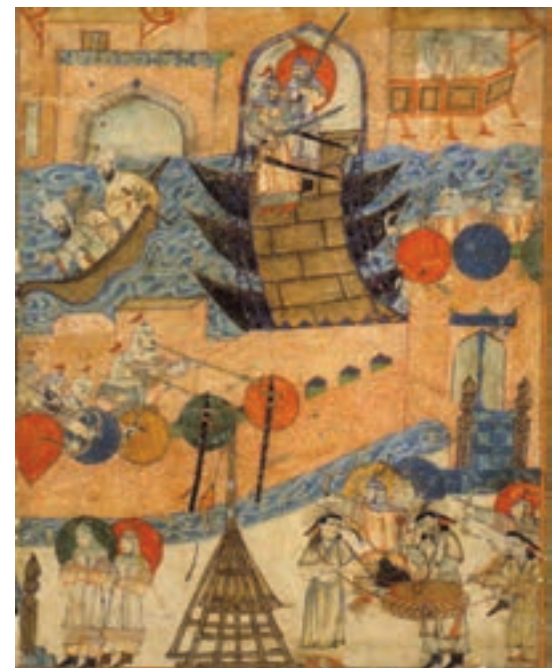
▲ شکل ۱۱-۱۰- برگی از کتاب جوامع التواریخ، رشیدالدین فضل‌الله