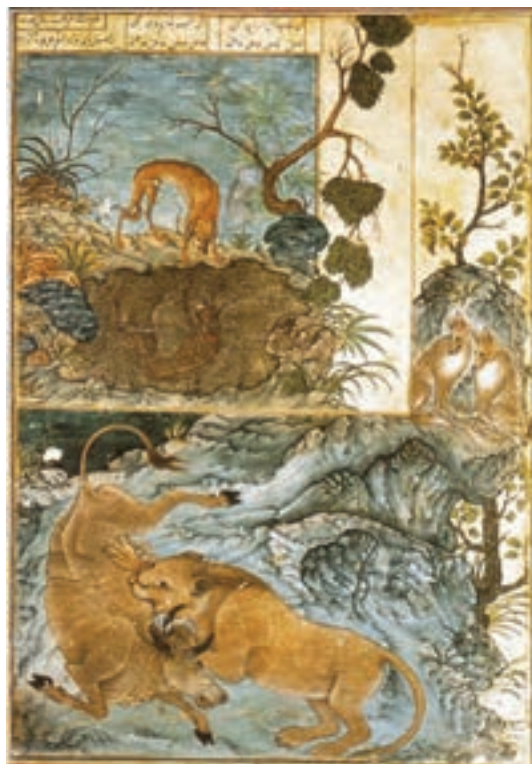
▲ شکل ۱۳-۱۰- برگي از کتاب کلیله و دمنه