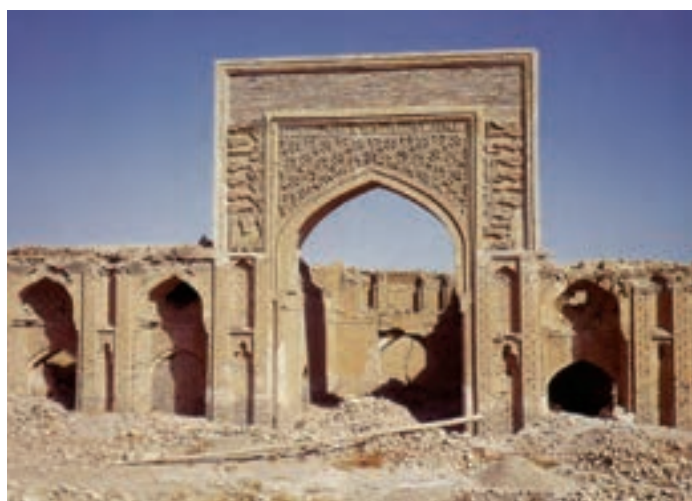
▲ شکل ۱۰-۹- رباط شرف، خراسان

توجه به معماری‌های غیرمذهبی بنا به ضرورت و نیاز فرمانروایان این دوره در شکل کاخ‌ها (شکل ۹-۹) و دیگر بناهای مرتبط با تجارت، بازرگانی و سفر از جمله رباط‌ها و کاروانسراها (شکل ۹-۱۰) به ظهور رسیده است. در تمامی بناهای این دوره از مصالح و فنون ساخت عالی، طاقسازی، گنبد و عناصر مختلف معماری به خوبی بهره‌برداری شده است. همچنین کتیبه‌نگاری در تمامی بخش‌های بنا به کار رفته و توانسته ضمن نقش تزئینی، جنبه‌های کاربردی آن نیز مورد توجه باشد.