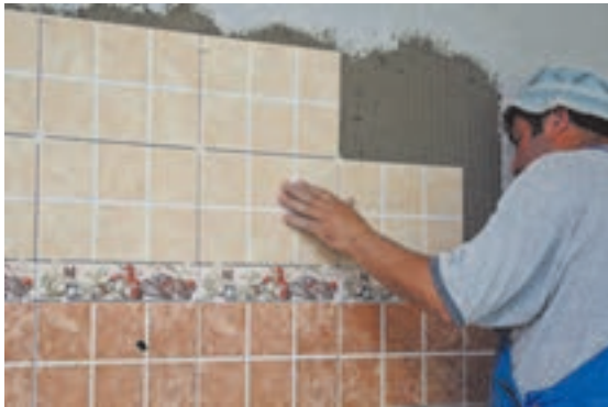
شکل ۴-۴ ▲

در این روش ملات خمیری ماسه و سیمان را در پشت کاشی قرار داده و به دیوار می‌چسبانند. همان‌طور که گفته شد از این روش بیشتر برای رچ‌های آخر که امکان دوغاب‌ریزی نداشته و نیز زیر سقف‌ها استفاده می‌شود. لازم به توضیح است که اگر بخواهند از این روش در کارهای نو همانند زیر سقف‌ها استفاده نمایند ابتدا باید سطح زیر کار را با اندود ماسه و سیمان هموار نموده، پس از خشک شدن اندود، به نصب کاشی‌ها اقدام گردد.