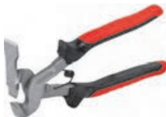
شکل ۳-۴ ▲