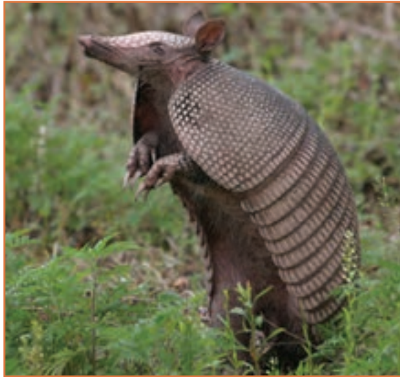
شکل ۹-۱- آرمادیلو

« وَ فِي الْأَرْضِ آيَاتٌ لِلْمُوقِنِينَ وَ فِي أَنْفُسِكُمْ أَفَلَا تُبْصِرُونَ »