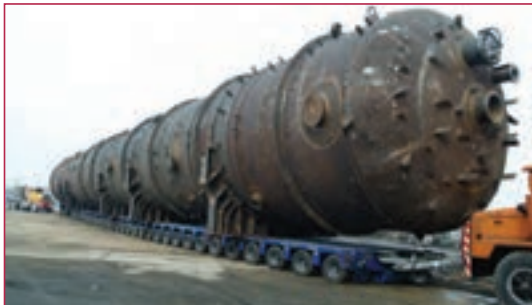
شکل ۴-۱- مخزن پتروشیمی

تکنسین‌ها و مهندسیین جوش کاری: تکنسین جوش آرگون، تکنسین نقطه جوش، تکنسین جوش لیزر، تکنسین جوش پلاسما، تکنسین جوش میگ و مگ، بازرسان جوش: تکنسین تست التراسونیک، تکنسین کنترل کیفی جوش، تکنسین تست مایع نافذ و ذرات مغناطیسی برخی از مشاغل رشته صنایع فلزی است که هنرجویان پس از کسب شایستگی‌های لازم در این رشته، می‌توانند در هر یک از این مشاغل در صنایع نام‌برده مشغول به کار شوند.