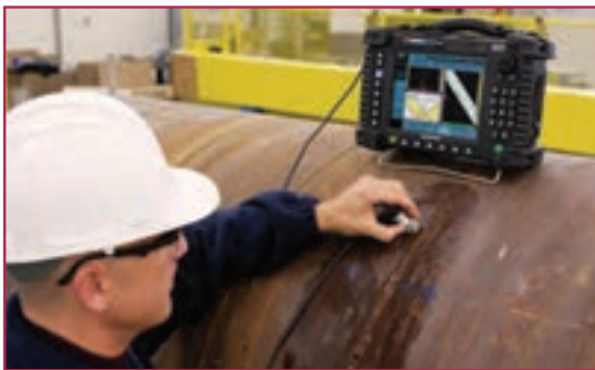
شکل ۶-۱- بازرسی جوش (تست التراسونیک)