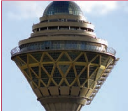
شکل ۱-۱- نقش رشته صنایع فلزی در پروژه‌های عمرانی

رشته صنایع فلزی یکی از رشته‌های بنیادی مورد نیاز کشور است. افراد توانمند و متخصص در این رشته در بخش صنعتی مانند صنایع خودروسازی، پالایشگاه‌های نفت و گاز، ماشین‌سازی و صنایع کوچک صنعتی توانسته‌اند گام مؤثری را در توسعه اقتصاد پایدار کشور بردارند. دانش آموختگان این رشته قادر خواهند بود در تمامی پروژه‌های عمرانی و تأسیساتی و همچنین بازارکار علاوه بر انجام وظایف شهروندی با استفاده از آموخته‌های خویش در مشاغل مرتبط با این رشته در سطوح میانی (کارگر ماهر- تکنسین) به کار اشتغال ورزند. دانش آموختگان با توجه به نیاز بومی، منطقه‌ای و کشوری می‌توانند به رشته‌های مهندسی صنایع، مکانیک جامدات و سیالات راه یابند.