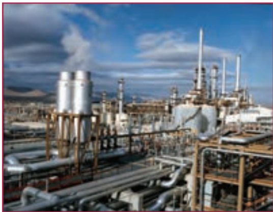
شکل ۱-۳- نقش رشته صنایع فلزی در پتروشیمی