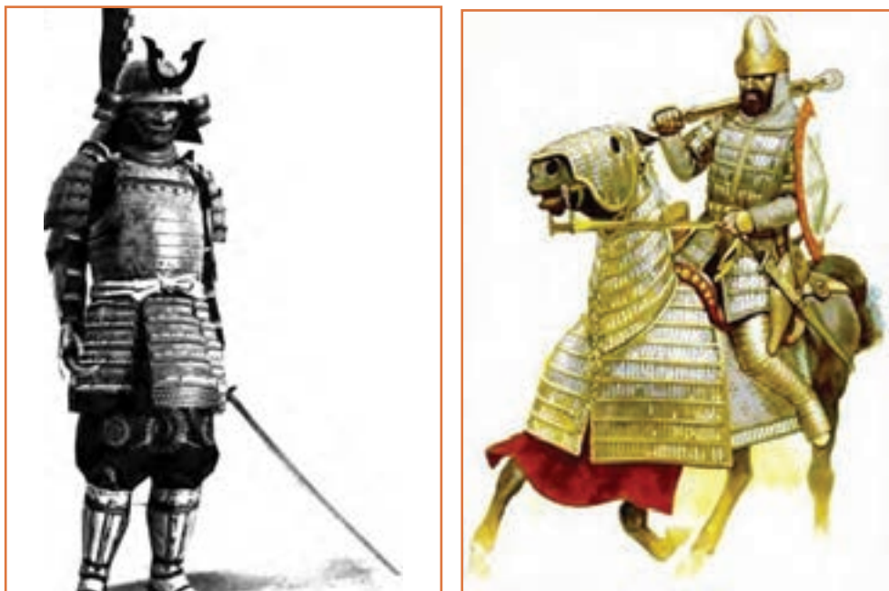
شکل ۸-۱- الگوبرداری از خلقت در ساخت زره

زره یک لباس نسبتاً محکم از جنس فلزاتی مانند آهن بود که در زمان‌های قدیم سربازان برای محافظت از خود به تن می‌کردند و امروز نیز از این فناوری در ساخت لباس‌های نظامی استفاده می‌شود دو تصویر زیر یک سرباز از ایران باستان و یک سامورایی متعلق به کشور ژاپن است.