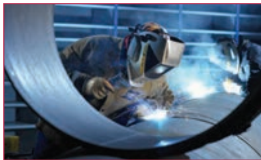
شکل ۵-۱- جوش کاری مخزن فولادی