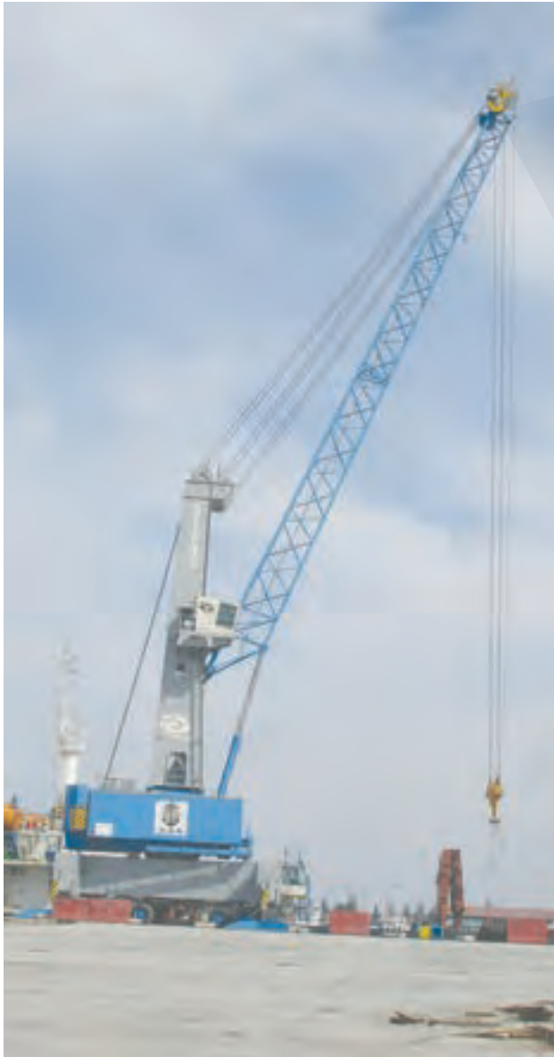
پ) بالا بردن اجسام سنگین