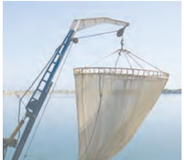
ب) بالا کشیدن تور ماهیگیری