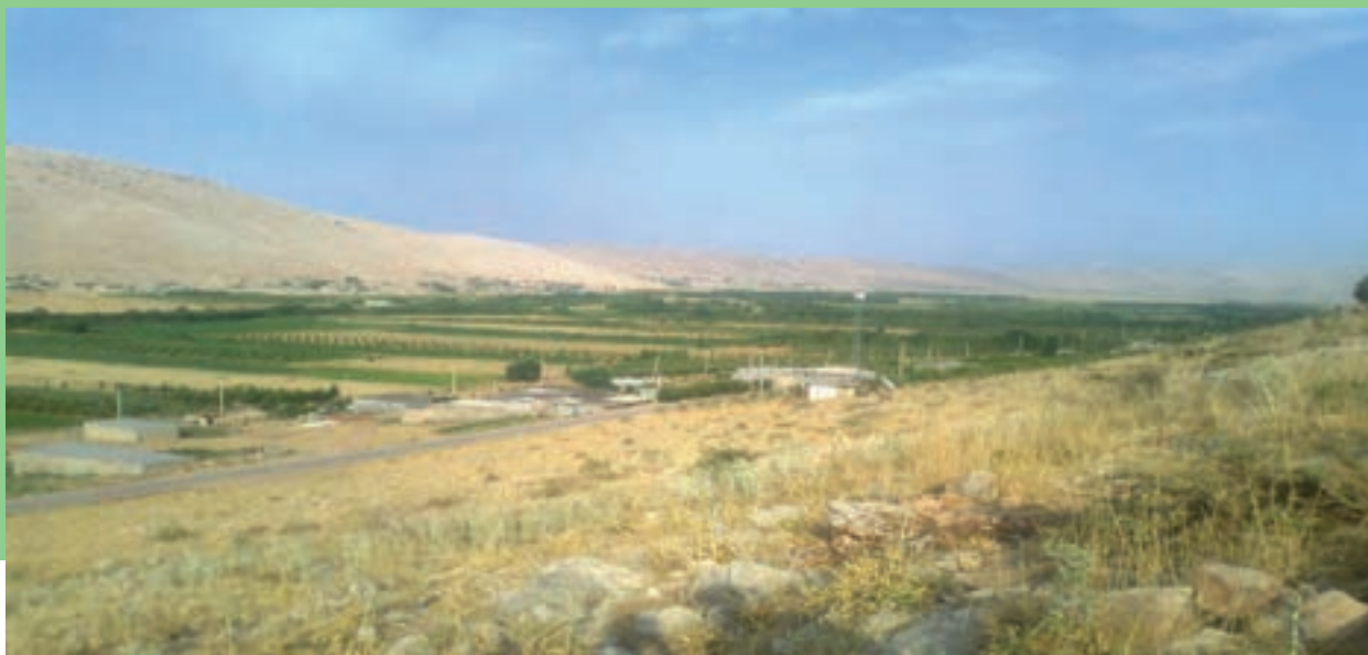
شکل ۷-۱- دشت روم در بویراحمد