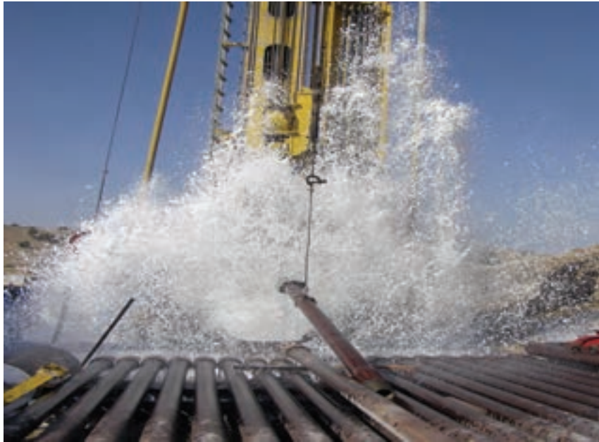
شکل ۲۴-۱- حفر چاه برای تأمین آب مورد نیاز

۲- چاه : چاه‌های استان بر دو گونه‌اند : چاه‌های عمیق و نیمه عمیق. یک حلقه چاه آرتزین نیز در مسیر دهدشت - گچساران وجود دارد. ۳- قنات : یکی دیگر از منابع تأمین آب استان، قنات است که از دیر باز مورد استفاده بوده است. در این استان، شانزده رشته قنات وجود دارد که نه رشته از آنها در ناحیه باشت، دو رشته در ناحیه دهدشت، دو رشته در ناحیه دوگنبدان و سه رشته در ناحیه یاسوج قرار دارد.