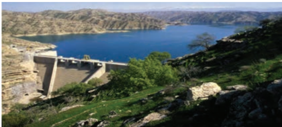
شکل ۲۵-۱- سد کوثر