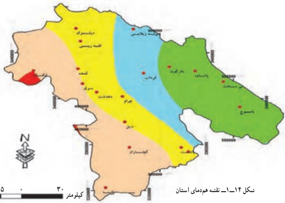
شکل ۱۴-۱ نقشه هم‌دمای استان