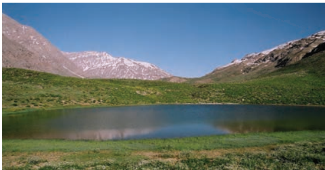
شکل ۱-۲۲- دریاچه کوه گل در ارتفاع ۲۰۰۰ متری دنا