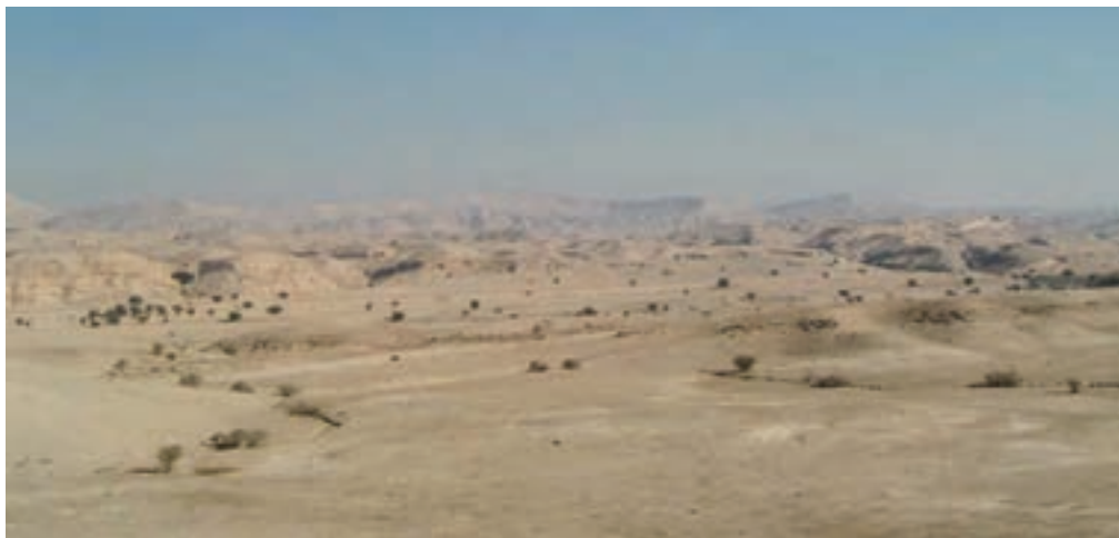
شکل ۱-۴ چشم اندازی از کوه‌های منطقه پست استان (لیشتر)

بلندترین نقطه استان، قله دنا با ارتفاع ۴۴۰۹ متر در شهرستان دنا و پایین‌ترین نقطه آن، چره زن (حیدر کرار) در جنوب غرب بی‌بی حکیمه در شهرستان گچساران است که حدود ۱۹۷ متر ارتفاع دارد. یعنی بین بلندترین نقطه و پایین‌ترین نقطه حدود ۴۲۸۵ متر اختلاف ارتفاع است که تنها ۲۰۰ کیلومتر از هم فاصله دارند و اختلاف دمای بین آنها حدود ۳۳ درجه سانتی‌گراد است.