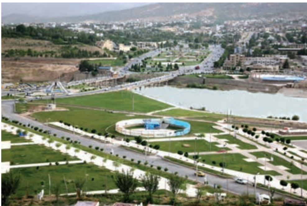
شکل ۱۷-۱- مسیر رودخانه بشار در شهر یاسوج

۳- رودخیرآباد: این رود که تا چندی پیش به رود شیرین معروف بود، از بخش مرکزی استان، یعنی دیلگان بویراحمد و تسوج کهگیلویه سرچشمه گرفته و در مسیر خود به نام‌های رود سرکورته تسوج، بیچاب، شاه بهرام و نازمکان شناخته می‌شود و پس از دریافت آب رودخانه‌های سیاه و خونی به نام رود خیرآباد جریان می‌یابد و سرانجام در نزدیکی روستای حیدرکرار واقع در ضلع جنوب شرقی زیدون بهبهان به رود زهره می‌پیوندد.