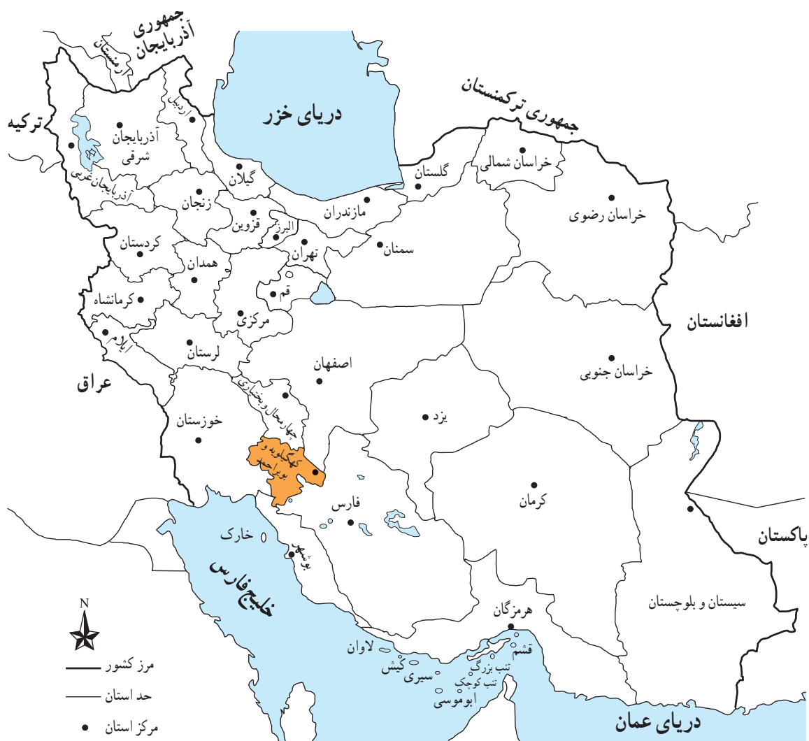
شکل ۱-۱- نقشه تقسیمات کشوری ایران به تفکیک استان‌ها

به شکل ۱-۱ نگاه کنید. آیا می دانید استان کهگیلویه و بویراحمد در کدام قسمت ایران واقع شده است و با کدام استان‌ها همسایه است؟ استان کهگیلویه و بویراحمد حدوداً ۱۶۲۶۴ کیلومتر مربع وسعت دارد.