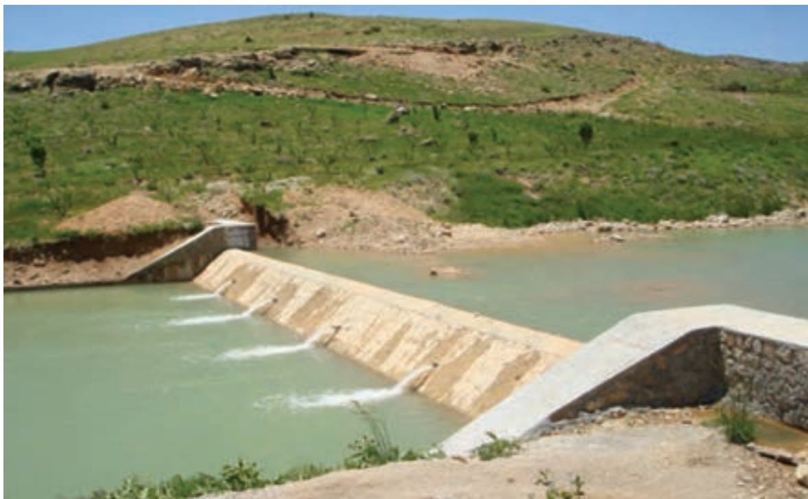
شکل ۲۶-۱- پروژه آبخیزداری بندسنگی ملاتی سرچنار