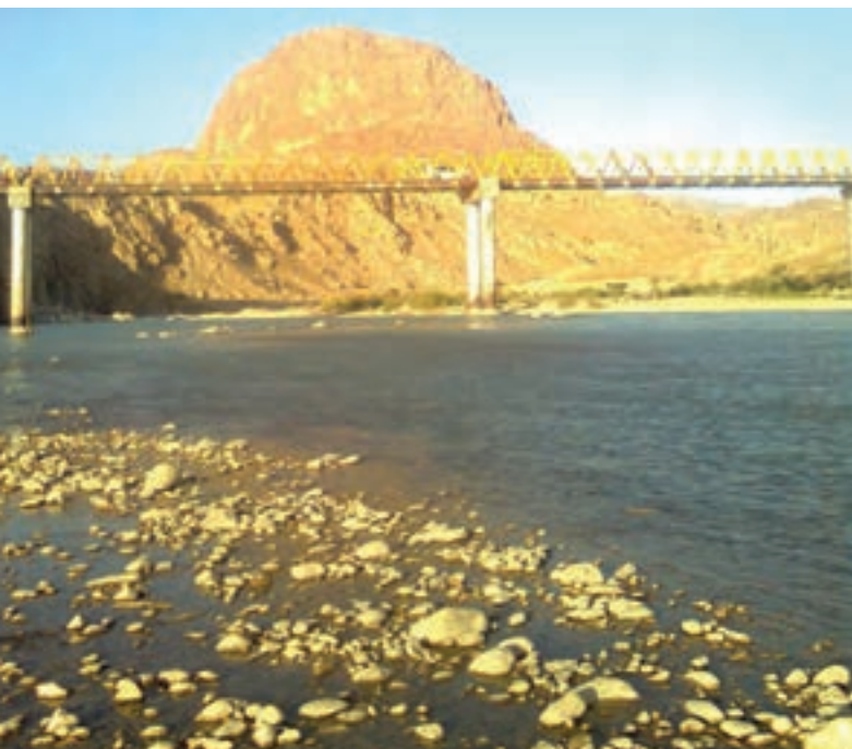
شکل ۱۶-۱- رود مارون

حوضه آبریز را در استان به خود اختصاص داده، از ارتفاعات نرماب، دمه سادات و مارگون بویراحمد، چاروسا و طیبی در شهرستان کهگیلویه سرچشمه می‌گیرد و در نهایت، به نام رود مارون از مرز استان (تنگ تکاب) خارج می‌شود. آنگاه، پس از دریافت سیلاب‌ها و رودهای دیگر، با نام جراحی به خلیج فارس می‌ریزد.