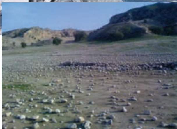
شکل ۱۲- منطقه گرمسیر استان