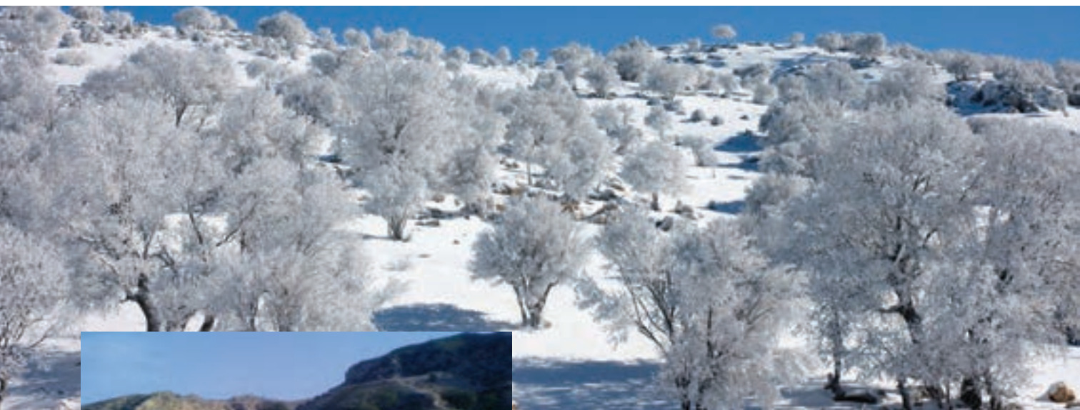
شکل ۱۱- منطقه سردسیر استان