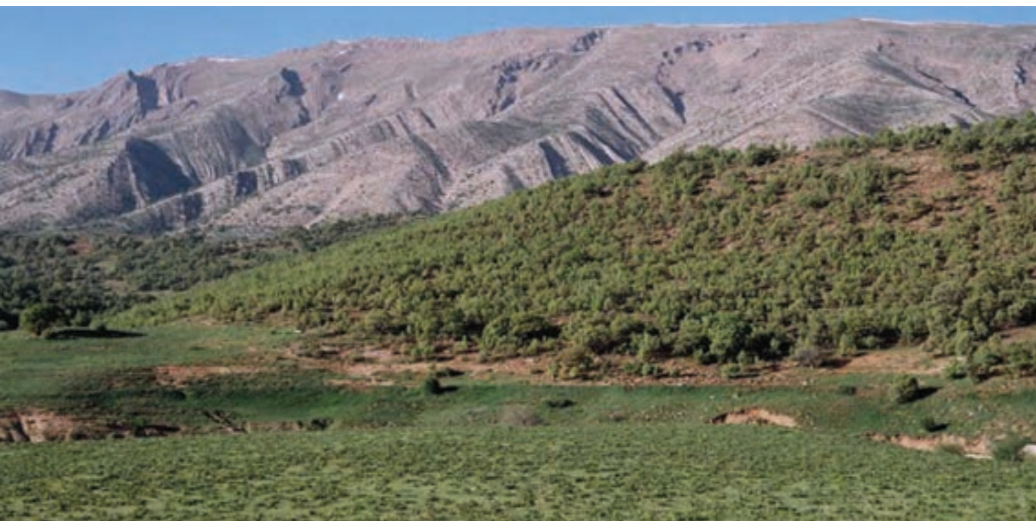
شکل ۱-۵ چشم اندازی از کوه‌های مرتفع استان