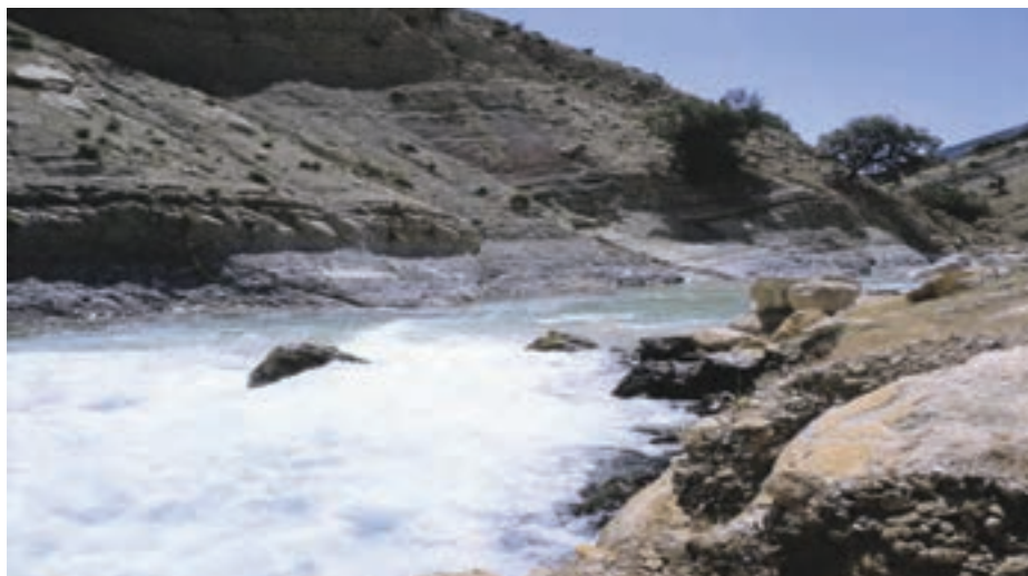
شکل ۱۹-۱- رود جن