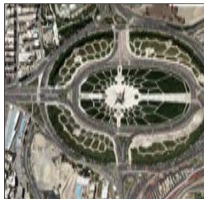
شکل ۳- میدان آزادی - تهران ۱۳۹۵