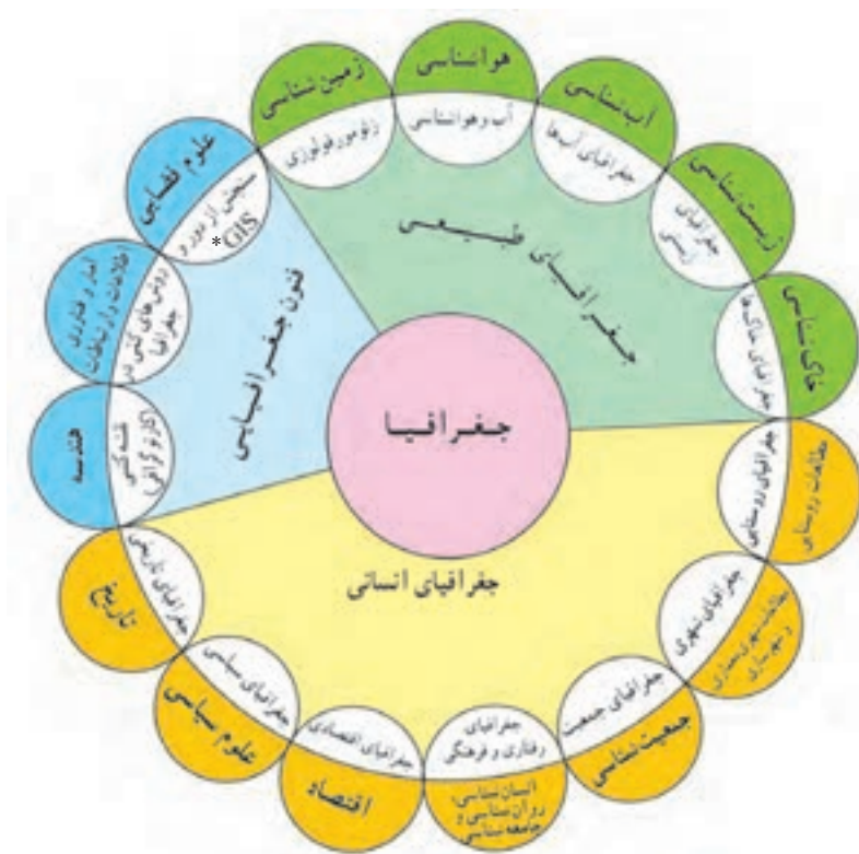
شکل ۲- ارتباط بین علوم و فنون مختلف جغرافیا و شاخه‌های آن