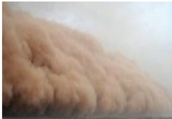
شکل ۱- توفان گردوغبار - دهلران - استان ایلام

- سؤال چرا ، به علت وقوع پدیده می‌پردازد. «چرا این پدیده به وجود آمده است؟» (تداوم خشکسالی در سال‌های اخیر).