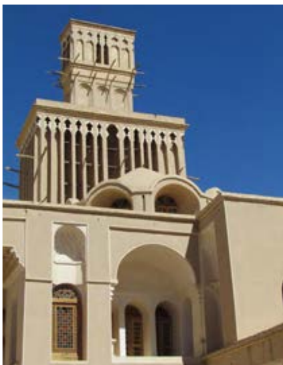
شکل ۵ - بادگیر دوطبقه ابرکوه - استان یزد

۲- روابط متقابل انسان با محیط: انسان و محیط دو عامل مهم در علم جغرافیا است. محیط طبیعی، مجموعه‌ای متعادل است. با ورود انسان، زمینه‌های تغییر در محیط فراهم می‌شود. هوش و استعداد انسان به او در جهت تغییر کمک می‌کند تا از محیط خود بهره‌مند شود. در دهه‌های اخیر، فناوری به کمک انسان آمده و سبب شده است که انسان در محیط، تأثیر بسیاری بگذارد. فناوری‌های جدید، انسان را قادر به بهره‌برداری از اعماق زمین کرده و میزان دسترسی انسان را گسترش داده است. تصویر روبه‌رو نشان می‌دهد که انسان برای رفع نیازهای خود به تغییر محیط دست می‌زند و در نتیجه محیط طبیعی به محیط جغرافیایی تبدیل می‌شود.