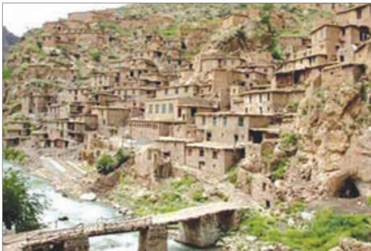
شکل ۱۰- روستای پالنگان - کامیاران - کردستان