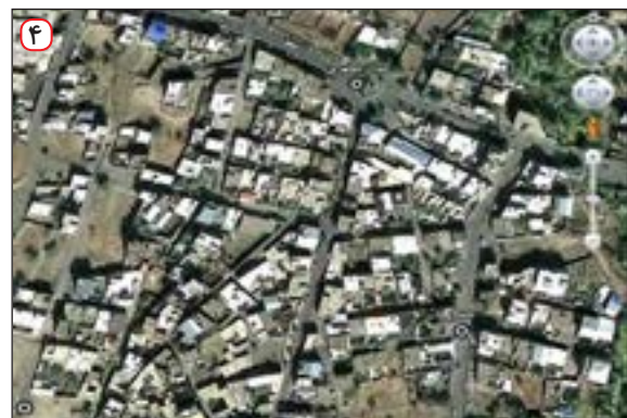
تصویر ماهواره‌ای شهر تفرش - استان مرکزی