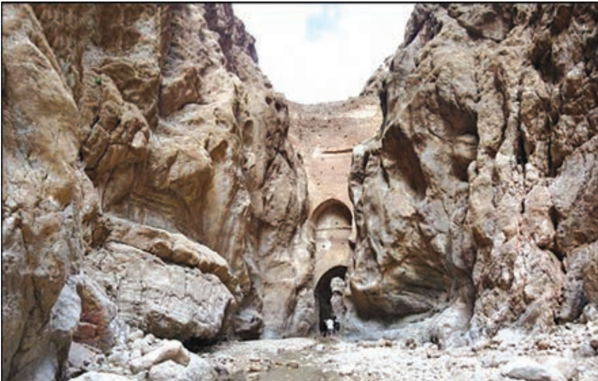
شکل ۱- سد کربت بزرگ‌ترین سد قوسی تاریخی جهان در نزدیکی طبس - خراسان جنوبی

طی سال‌های گذشته، مطالبی دربارهٔ محیط پیرامون خود و سایر مکان‌ها خوانده‌اید. اطلاعات مربوط به کرهٔ زمین، مانند زیستگاه‌های مختلف، آب و هوا، رودها و کوه‌ها و حتی مسائل مربوط به آداب و رسوم و سنت‌ها به ما کمک می‌کند که دانش ما از محیط پیرامون و سایر مکان‌ها افزایش یابد. آیا شناخت محیط در جهت بهبود کیفیت زندگی انسان نقشی داشته است؟