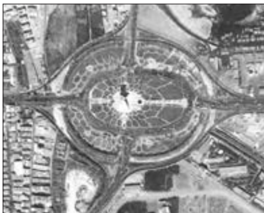
شکل ۴- میدان آزادی - تهران ۱۳۶۵

در هر مکان، پدیده‌های مختلفی هستند که بر یکدیگر تأثیر گذاشته و به نوبه خود از هم تأثیر می‌پذیرند؛ به طور مثال یک روستا را در نظر بگیرید که خاک، آب، سرمایه و نیروی انسانی آن بر نوع اشتغال آن اثر می‌گذارد و بالعکس. این روند تأثیرگذاری و تأثیرپذیری به صورت جریانی پیوسته در مکان ادامه دارد و سبب تغییر شکل مکان‌ها می‌شود. به تصاویر زیر دقت، و برداشت خود را از آنها با سایر هم‌کلاسی‌های خود مطرح کنید، نظر آنان را جویا شوید و با یکدیگر مقایسه کنید.