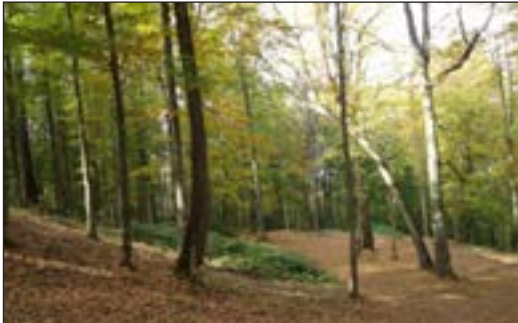
جنگل گلستان - استان گلستان

عملکرد مثبت و منفی انسان را در هر یک از نواحی زیر بررسی کنید و جدول را کامل نمایید.