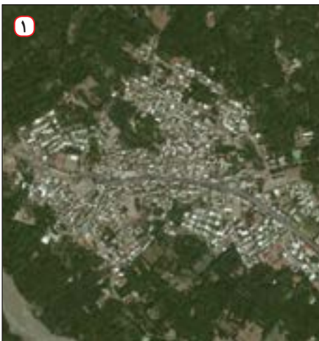
عکس هوایی روستای قاضی جهان - آذربایجان شرقی

● پژوهشگر به سالنامه آماری یک دهه مراجعه می‌کند و تغییرات جمعیتی شهر کرج را مورد مطالعه قرار می‌دهد. او با کمک عکس‌های هوایی و ماهواره‌ای، رشد فیزیکی شهر کرج را طی یک دهه بررسی می‌کند.