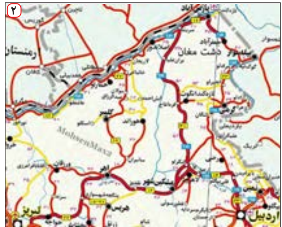
نقشه استان اردبیل