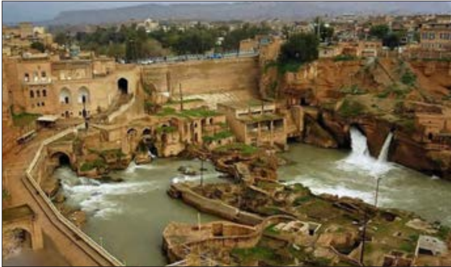
شکل ۶- سازه های آبی شوشتر - نماد رابطه صحیح انسان با محیط - خوزستان

محیط جغرافیایی از تعامل بین محیط طبیعی و محیط انسانی به وجود می آید.