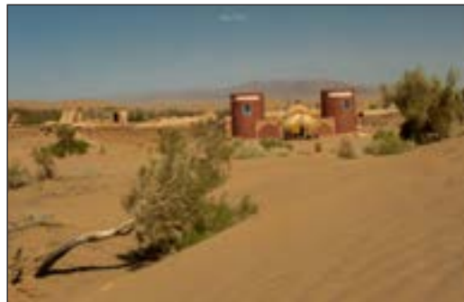
کویر مصر - اصفهان