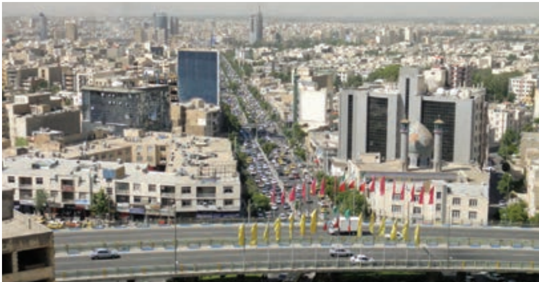
شکل ۳- شهر کرج - استان البرز

عوامل مؤثر در افزایش جمعیت شهر کرج در دهه اخیر چیست؟