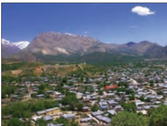
شکل ۹- شهر کوهپایه ای سی سخت - کهگیلویه و بویراحمد

دید ترکیبی یعنی: مطالعه همه جانبه و جامع پدیده‌ها با تمام ویژگی‌های آن در یک مکان