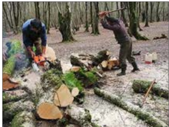
شکل ۷- قطع بی رویه درختان جنگل - مازندران

به نظر شما کدام یک از این عملکردها تعادل محیط را در مدت طولانی حفظ می کند؟ از آنجا که جغرافیا روابط متقابل انسان را با محیط، مطالعه و بررسی می کند، بنابراین شناخت توان ها و ظرفیت های محیطی بدون دانش جغرافیا ممکن نیست؛ پس جغرافیا علمی برای زندگی بهتر است.