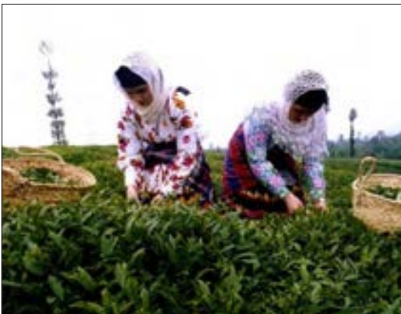
شکل ۸- کشاورزی و رفع نیازها - برداشت چای - لاهیجان - گیلان