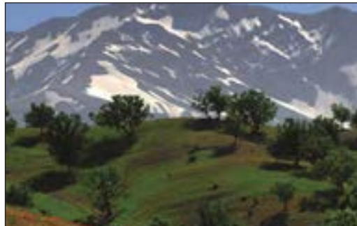
زردکوه - چهارمحال بختیاری