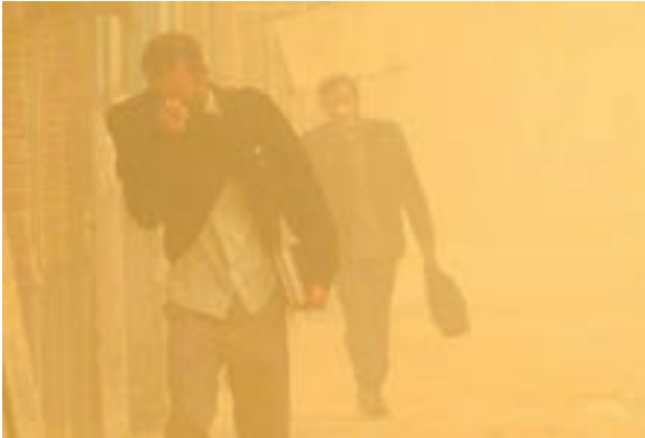
شکل ۲- گردوغبار در شهر اهواز - استان خوزستان

- سؤال چه چیز ، بر ماهیت هر پدیده یا مسئله، دلالت دارد؛ «چه چیزی رخ داده است؟» (وجود ریزگردهای بیش از حد مجاز در هوا).