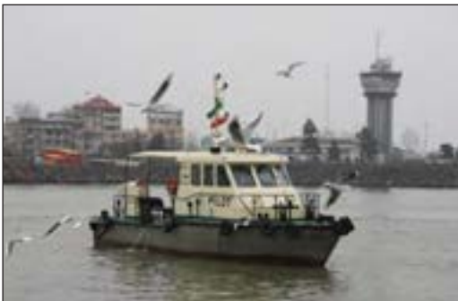
ساحل بندر انزلی - گیلان