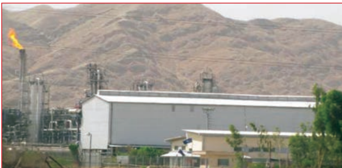
شکل ۳۶-۱- صنایع آلاینده هوا

عواملی که موجب آلودگی هوا در استان می‌شوند، عبارت‌اند از: عوامل طبیعی مانند گرد و خاک و عوامل انسانی مانند وسایل نقلیه موتوری - واحدهای تولیدی و صنعتی و غیره. از نظر آلودگی هوا به جز شهر دوگنبدان، مرکز گچساران که بر اثر استخراج نفت ایجاد شده و گسترش یافته است، در شهرهای دیگر استان خوشبختانه هوا آلوده نیست.