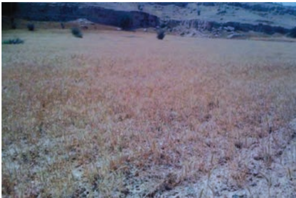
شکل ۴۰-۱- آثار خشکسالی در منطقه گرمسیر استان

خشکسالی در استان : استان ما به لحاظ منابع آبی جزء غنی‌ترین استان‌های کشور است. بیشینه بارش زمستانه کشور در این استان (یاسوج) واقع شده است. اما طبق بررسی و تحلیل آماری به فاصله هر هفت سال یک بار بارش‌های کمتر از میانگین بلند مدت که زمینه حضور خشکسالی را فراهم آورده، در آن وجود داشته است. شدیدترین خشکسالی طی سال‌های اخیر مربوط به سال زراعی ۱۳۸۷ و ۱۳۸۶ بوده که خسارت بسیار زیادی به بخش‌های مختلف تولیدی استان وارد کرده است.