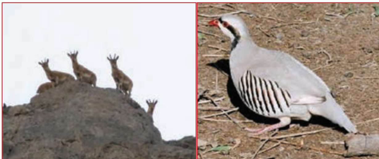
شکل ۳۴-۱- نمونه‌ای از حیات وحش استان

«محیط زیست به معنای تمامی محیطی است که حیات و تعالی ما به طور مستقیم و غیرمستقیم به آن وابسته است و حفاظت از آن، وظیفه ملی و عمومی است».