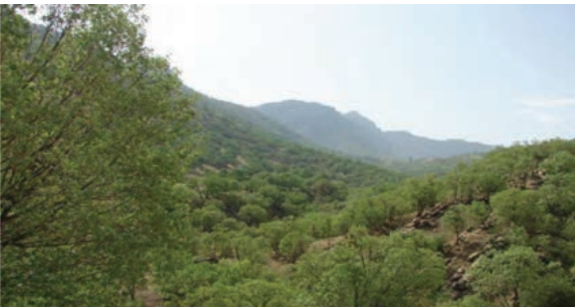
شکل ۲۹-۱ چشم اندازی از جنگل‌های زیبای استان

جنگل : استان ما دارای بیش از ۸۷۴۰۰۰ هکتار جنگل و بیشه زار است؛ و همچنین بیش از ۲۰۰۰ هکتار جنگل دست کاشت در استان وجود دارد. گسترده‌ترین جامعه جنگلی که بخش عمده‌ای از سطح استان را در بر می‌گیرد، درختان بلوط است (حدود ۸۰ درصد) که در مناطق سردسیر و معتدل استان قرار دارد. در استان گونه‌هایی از پوشش گیاهی زاگرس، خلیج عمانی کاسا دیده می‌شود. که شامل درختان بلوط ایرانی بنه (پسته وحشی)، افرا یا کیکم، زبان گنجشک (ون)، داغان (تاگ)، کلخونگ (کله خونگ)، مهلب