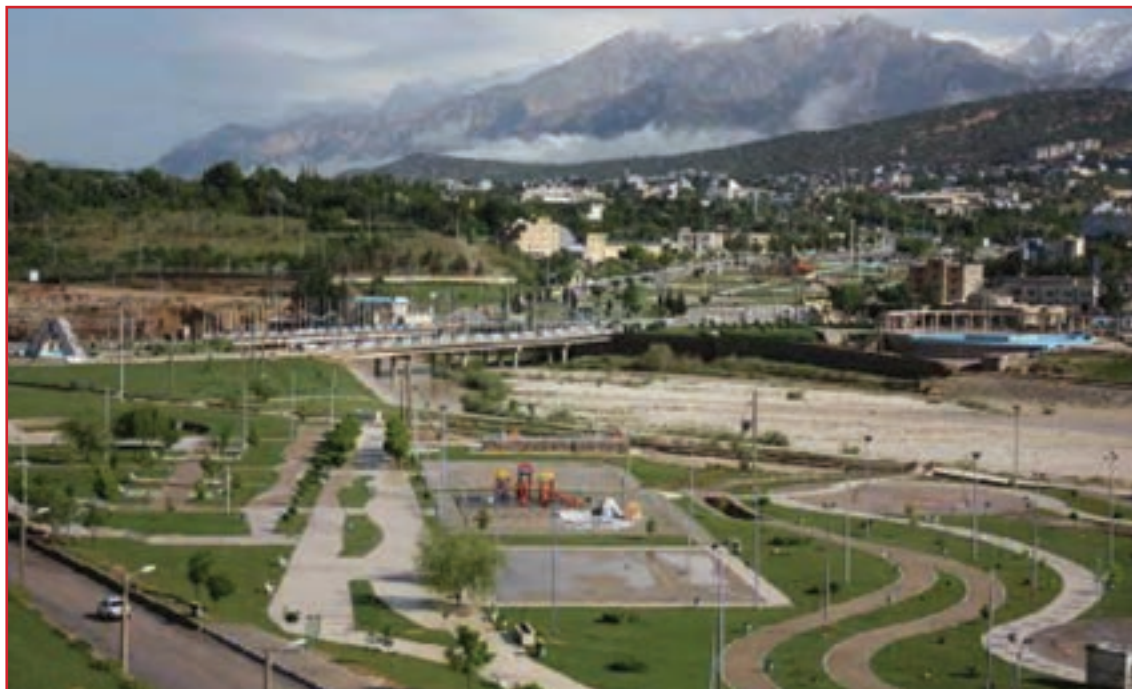
شکل ۳۷-۱ چشم اندازی از شهر زیبای یاسوج

۴- از شهر پاتاوه تا محل خروج رود از استان در مسیری به طول ۷۰ کیلومتر منابع آلاینده کاهش می‌یابد.