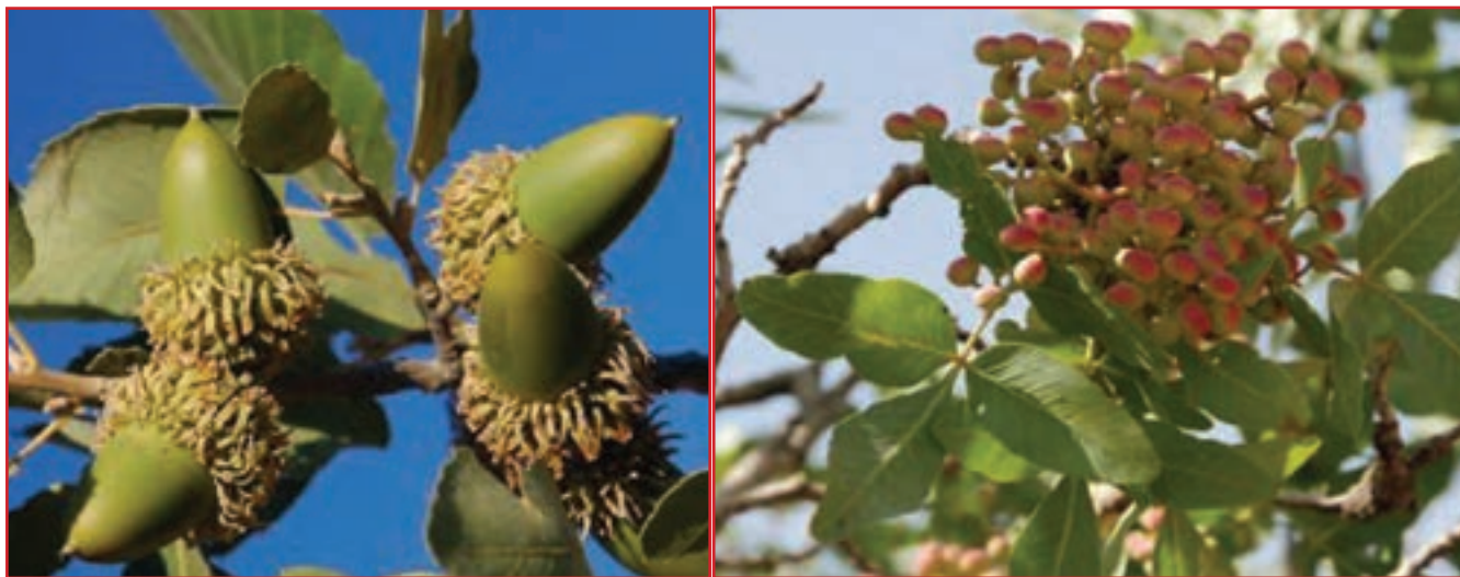
شکل ۳۵-۱ نمونه‌ای از میوه‌های جنگلی استان