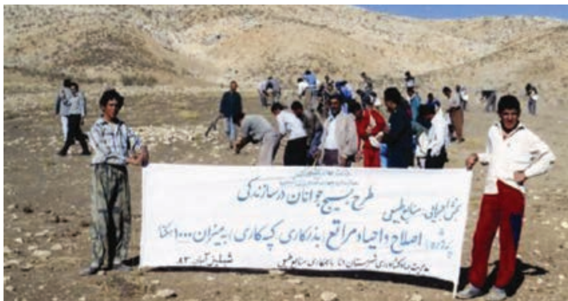
شکل ۳۲-۱- اصلاح و احیای مراتع توسط جوانان