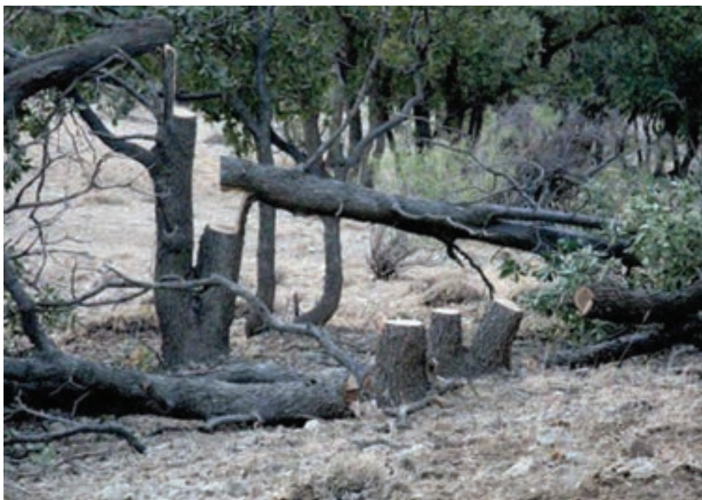
شکل ۳۳-۱ قطع بی‌رویه درختان عامل نابودی جنگل‌ها

۳- مراتع ضعیف (درجه ۴): با برداشت ۱۵۰ کیلوگرم در هر هکتار مهم‌ترین بهره‌برداری‌ها از مراتع استان عبارت است از: مصارف دارویی، صنعتی، خوراکی، تهیه انواع عطرها و تأمین علوفه برای دام‌ها.