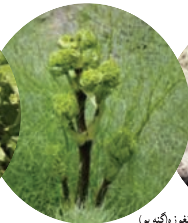
ب) آنغوزه (گنه بو)