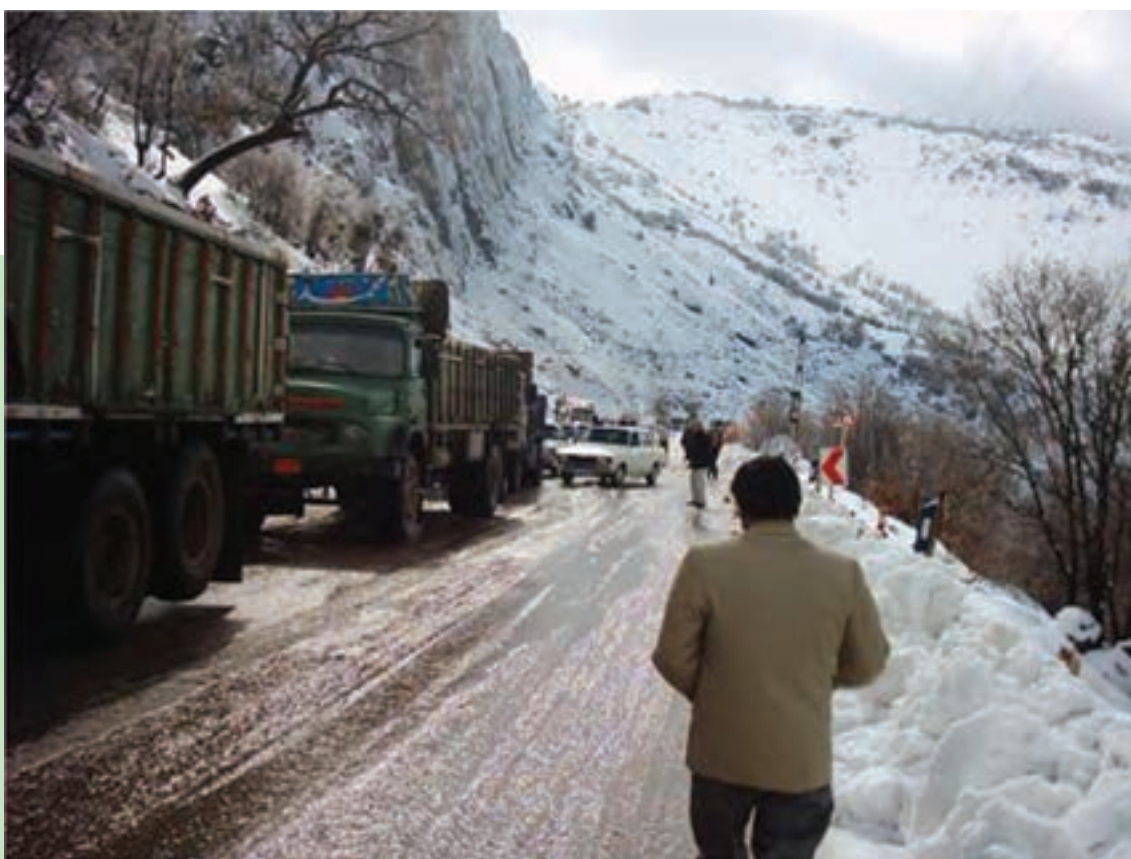
شکل ۴۱-۱- مشکلات ناشی از یخ‌بندان

یخ‌بندان سطح زمین در استان : سرمازدگی و یخ‌بندان و برف در استان در ماه‌های آبان، آذر، دی، بهمن و اسفند در مناطق سردسیری استان به تناوب وجود دارد و بیشترین یخ‌بندان در یاسوج و سی سخت اتفاق می‌افتد که می‌توان از طریق ایجاد حرارت به وسیله بخاری، آتش زدن کاه و گلش و شاخه‌های هرس شده، استفاده از دستگاه‌های مولد باد به منظور برهم زدن پایداری هوا و استفاده از هورمون‌های گیاهی تأخیر در شکوفه‌دهی و...، از خسارت ناشی از سرمازدگی جلوگیری کرد. پدیده گرد و غبار از جمله دیگر مخاطرات طبیعی در استان مثل سایر نقاط جنوب و جنوب غربی کشور است که خساراتی به استان وارد می‌کند. می‌توان با برنامه‌های کوتاه و بلند با این پدیده نیز مقابله کرد.