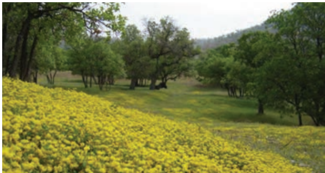
شکل ۲۸-۱ چشم اندازی از گیاهان و درختان استان

۳- منطقه کوه‌های مرتفع : دوره یخبندان آن طولانی و مراتع طبیعی آن بیشتر شامل جاشیر، چویل و گراس است.