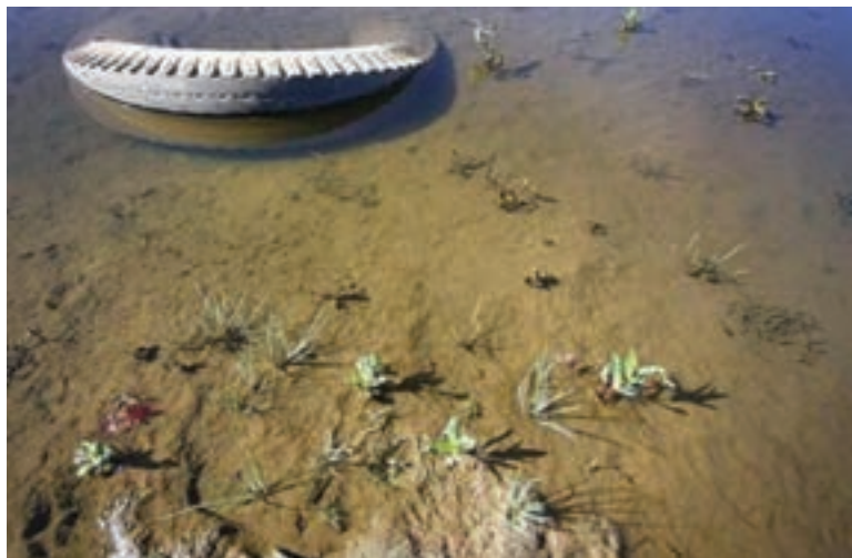
شکل ۸۰-۱- آلودگی آب ها بر اثر ریختن زباله به داخل آن

فاضلاب ها و زباله های شهری (خانگی و بیمارستانی)، کشاورزی و صنعتی، عمده ترین عوامل آلوده کننده آب های سطحی و زیرزمینی استان محسوب می شوند. سالانه بیش از ۵۰ میلیون مترمکعب فاضلاب شهری به عرصه های زیست محیطی وارد می شود. در فاضلاب های شهری باکتری های بیماری زای فراوانی وجود دارد که اگر باروش های مناسب نباشد یا دفع نگردند، در محیط باقی می ماند و خطرهای جدی برای انسان به بار می آورند. فاضلاب های کشاورزی نیز به دلیل همراه داشتن سموم آفت کش و کودهای شیمیایی به صورت محلول، در روان آب های کشاورزی باقی می ماند