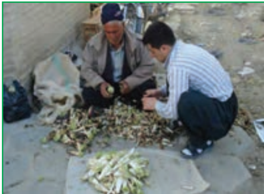
شکل ۵۸-۱- برداشت کنگر از مراتع