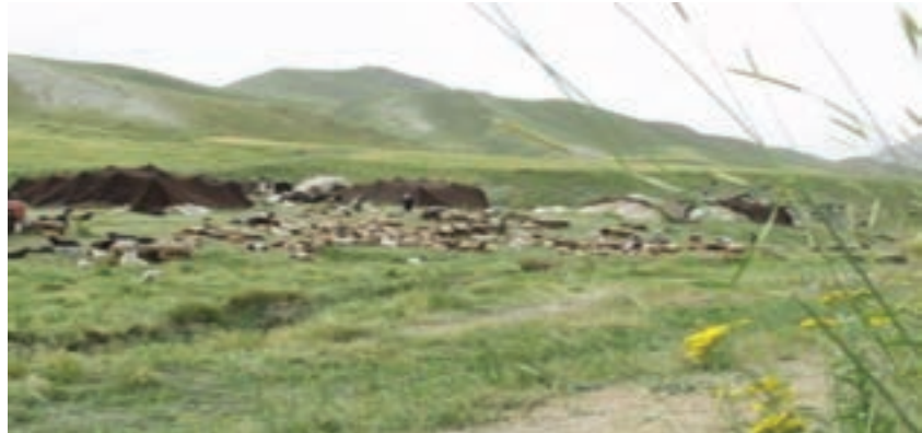
شکل ۵۷-۱- تغذیه دام عشایر