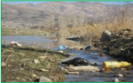
شکل ۸۱-۱- فاضلاب‌های شهری در بستر رودخانه‌ها

و به چرخه آب برمی‌گردند که باعث آلودگی آب و خاک می‌شوند. در اثر فعالیت‌های تولیدی و صنعتی در کارخانجات و واحدهای صنعتی استان نیز فاضلاب صنعتی تولید می‌شوند و در نتیجه مقدار قابل توجهی از مواد شیمیایی خطرناک را وارد آب‌های سطحی و زیرزمینی می‌کنند.