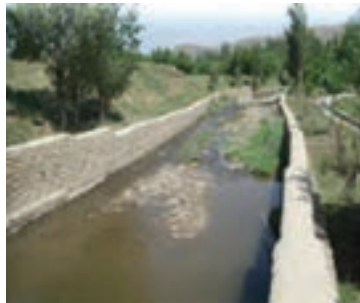
شکل ۱-۶۴- دیوار حاشیة رودخانه