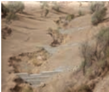
شکل ۱-۶۳- بند گابیونی (سنگ‌ها در تور سیمی)