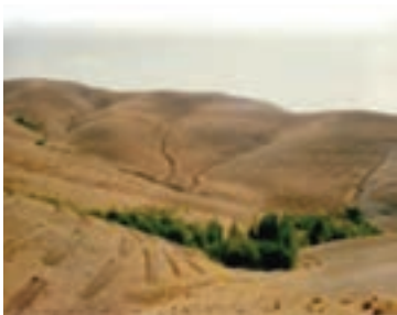
شکل ۱-۶۶- احداث بانکت بندی