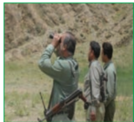
شکل ۱-۷۲- محیط‌بانان سازمان حفاظت از محیط زیست

بررسی کنید که در سال‌های اخیر کدام یک از گونه‌های گیاهی و جانوری محل زندگی شما از بین رفته است؟ نتیجه را به کلاس ارائه دهید.