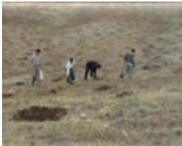
شکل ۱-۶۲- کپه کاری