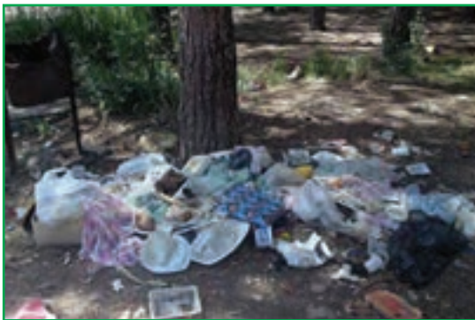
شکل ۸۲-۱- ریختن زباله در محیط

خاک، بستر حیات و زیستگاه بسیاری از موجودات و یکی از مهم‌ترین اجزای محیط طبیعی ماست که زمینه تأمین مواد غذایی مورد نیاز انسان و سایر جانوران را فراهم می‌کند. استان ما از توان بسیار بالایی در زمینه کشاورزی برخوردار است و بیشتر فعالیت‌ها در بخش کشت و زرع، باغداری و پرورش دام صورت می‌گیرد. امروزه توسعه این فعالیت‌ها موجب به‌کارگیری انواع کودهای شیمیایی و سموم دفع آفات نباتی در این بخش شده و استفاده گسترده از این مواد، موجبات آلودگی خاک را فراهم کرده است. از طرفی اقداماتی نظیر آبیاری با فاضلاب‌های شهری، ریختن زباله‌ها در محیط و آتش‌زدن بقایای محصولات کشاورزی، موجب آلودگی و تضعیف خاک‌های استان شده است.