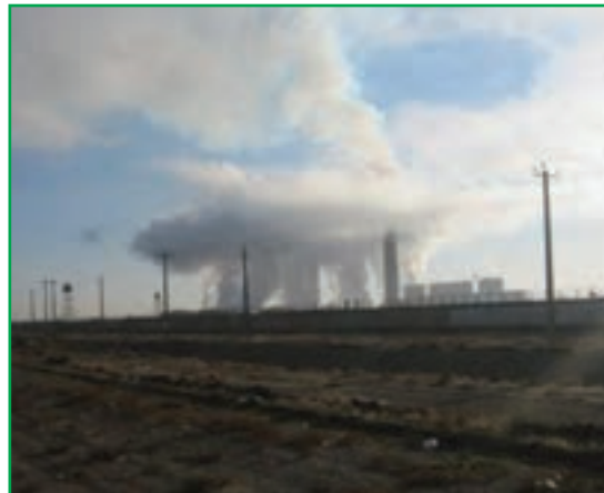
شکل ۲۸-۱- آلودگی هوا - صنایع