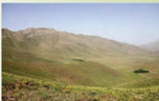
شکل ۱-۷۴- منطقه حفاظت شده لشگردر - ملایر

منطقه حفاظت شده لشگردر: این منطقه در جنوب شرقی شهر ملایر و در ۹۰ کیلومتری شهر همدان در محاصره ۱۴ روستای مجاور از جمله جوزان، مانیزان، فروز، ازناوله، زنگنه و احمد روغنی است و به لحاظ طبیعت مساعد از نظر آب، پوشش گیاهی و شرایط اقلیمی، همواره زیستگاه مناسبی برای جانوران و پرندگان است.