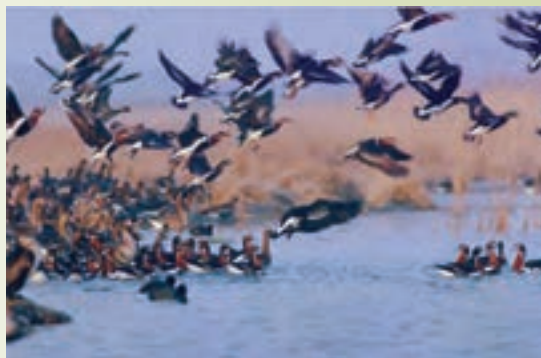
شکل ۱-۷۵- منطقه شکار ممنوع - شیرین سو

منطقه شکار ممنوع: منطقه شکار ممنوع نیز همچون مناطق حفاظت شده دارای شرایط مناسب جهت حفظ و تکثیر گونه‌های مختلف گیاهی و جانوری‌اند و با نظارت سازمان حفاظت محیط زیست دارای ممنوعیت شکار و صید، قطع درختان و آسیب‌رساندن به محیط است.