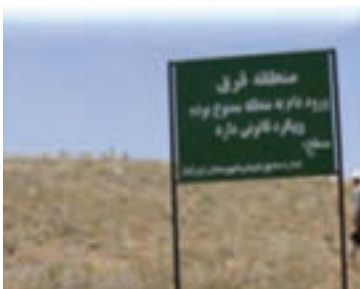
شکل ۱-۶۸- حفاظت و قرق مراتع