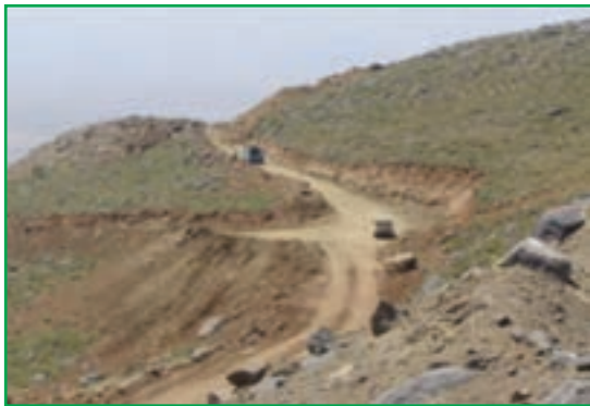
شکل ۵۹-۱- احداث راه در مراتع