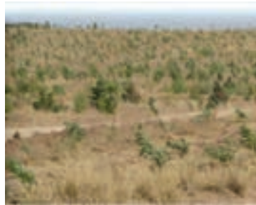
شکل ۱-۶۱- نهال کاری