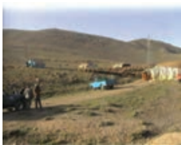
شکل ۱-۶۷- مدیریت و نظارت بر چرا