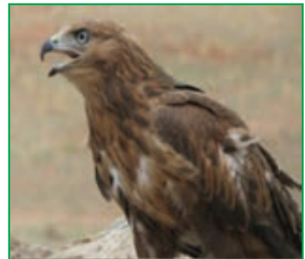
شکل ۱-۷۱- عقاب طلایی