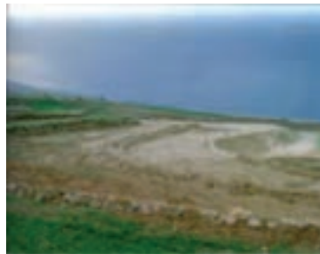
شکل ۱-۶۵- تراس بندی