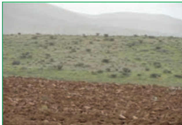
شکل ۶۰-۱- تبدیل مراتع به زمین کشاورزی