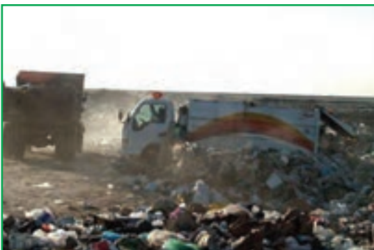
شکل ۸۳-۱- دفع غیربهداشتی زباله‌ها