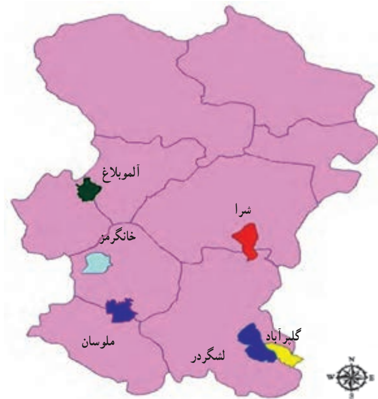
شکل ۱-۷۰- نقشه مناطق حفاظت شده استان

استان ما در حال حاضر، دارای ۶ منطقه مهم حفاظت شده است که عبارت‌اند از: گلپرایاد، خان‌گرمز، لشگردر، شرا، الموبلاغ، ملوسان و دو منطقه شکار ممنوع شیرین سو و و آق‌گل. (نقشه ۱-۷۰)