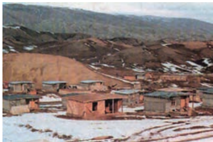
شکل ۱-۶۴- بازسازی روستای زلزله زده توب چنار شهرستان مانه و سملقان با استفاده از اسکلت زوگالی (چوبی)