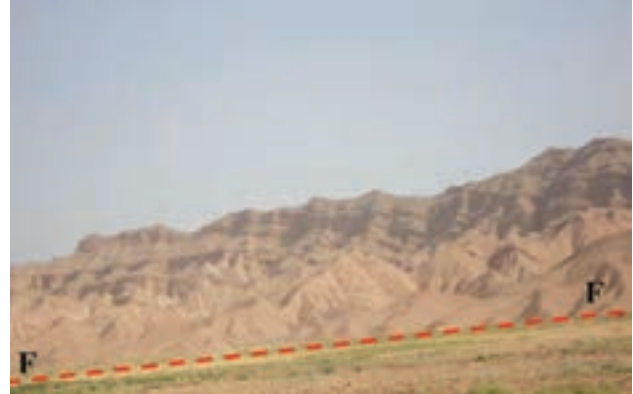
شکل ۱-۶۵- گسل امین آباد از گسل‌های فعال استان

سیل: بعد از زلزله، سیل مخرب‌ترین خطر طبیعی استان به حساب می‌آید. خراسان شمالی از نظر وقوع سیلاب در بین استان‌های کشور جایگاه دوم را دارد.