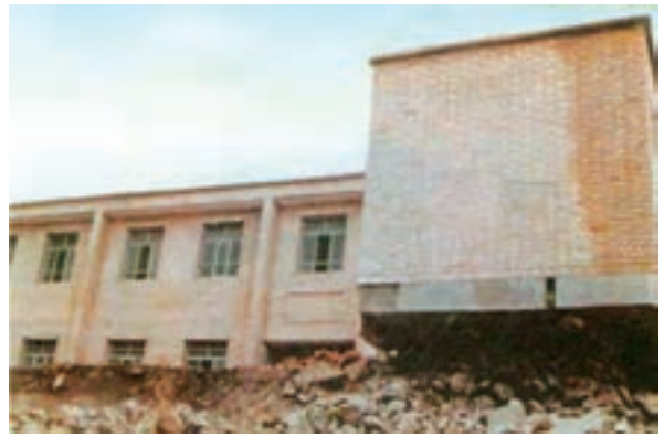
شکل ۱-۶۲- ساختمان دبستان روستای ناوه پس از زلزله