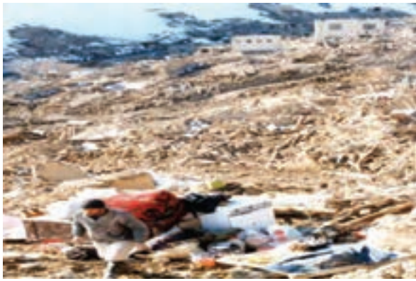
شکل ۱-۶۳- روستای ناوه پس از زلزله

زلزله: زلزله مخرب‌ترین پدیده طبیعی است که همه ساله خسارت‌های جانی و مالی زیادی به انسان‌ها وارد می‌کند. خراسان شمالی از استان‌های زلزله خیز کشور است. به علت فراوانی و طول زیاد گسل‌ها و جوان بودن چین‌خوردگی‌ها در استان، تاکنون زلزله‌های بسیاری در این استان به وقوع پیوسته است. از مخرب‌ترین آنها می‌توان به زمین لرزه‌های سال ۱۳۵۲ دهنّه اجاق در شهرستان اسفراین و زلزله ۱۹ بهمن سال ۱۳۷۵ روستای ناوه در شهرستان بجنورد اشاره نمود. هر چند، زلزله‌ها، سبب تخریب ساختمان‌ها می‌شوند ولی رعایت نکات ایمنی در ساختمان سازی می‌تواند تا حدودی از خسارات آن بکاهد. تأثیر این نکته را در مقایسه شکل‌های (۱-۶۲) و (۱-۶۳) می‌توانید به خوبی مشاهده کنید.