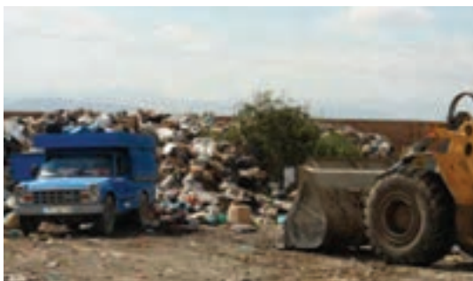
شکل ۷۶-۱- شیوه‌های نامناسب جمع‌آوری، انتقال و دفن زباله در استان