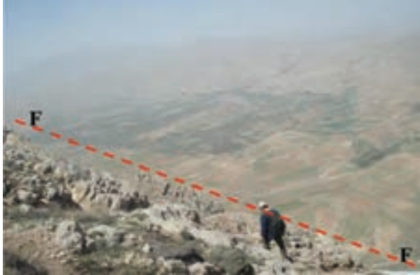
شکل ۱-۶۶- گسل سالوک از گسل‌های فعال استان

آخرین فعالیت گسل‌های استان مربوط به گسل امین آباد، در شمال غرب شهر اسفراین است که منجر به زمین لرزه‌ای با قدرت ۴/۵ درجه در مقیاس ریشتر شد. این زمین لرزه در نیمه شب جمعه ۱۸ آذرماه ۱۳۹۰ بر اثر فعال شدن قسمت شمال غربی این گسل رخ داد. این زلزله خسارات مالی و جانی نداشت ولی سبب ترس و وحشت مردم شد.