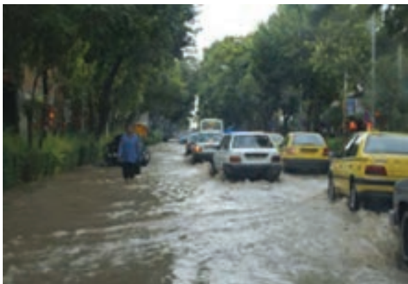
شکل ۱-۶۸- آب‌گرفتگی خیابان‌های شهر بجنورد در سیلاب سال ۱۳۸۷

علل وقوع سیلاب در استان منشأ طبیعی و انسانی دارد. از مهم‌ترین دلایل طبیعی آن می‌توان به ذوب ناگهانی برف و یخ در کوهستان‌ها، بارش‌های رگباری، کم شدن پوشش گیاهی و شیب زمین و از مهم‌ترین عوامل انسانی می‌توان به عدم اعمال مدیریت صحیح در حوضه‌های آبخیز، برداشت غیر اصولی مصالح رودخانه‌ای، تجاوز به حریم رودخانه‌ها، توسعه شهرها و روستاها در عرصه‌های سیل‌گیر اشاره نمود.