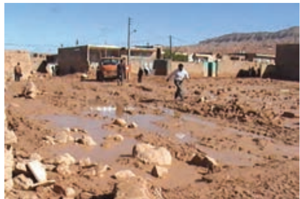
شکل ۱-۶۷- ورود سیلاب‌ها به مناطق مسکونی روستای فرتان اسفراین