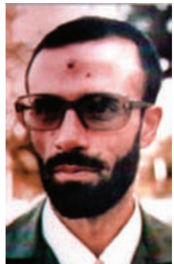
شکل ۸-۴- شهید کلاهدوز

شخصیت‌های برجسته‌ی زیادی را می‌توان از تهران نام برد که سنگرهای خود را در مجلس شورای اسلامی، مدرسه و ... ترک کردند و به جبهه‌ها شتافتند و به درجه رفیع شهادت نائل آمدند؛ از آن جمله می‌توان شهید مصطفی چمران را نام برد. همچنین از میان سرداران سپاه و ارتش نیز افراد برجسته‌ای بودند که با وجود مسئولیت‌های کلان کشوری، سنگرها را بر صندلی‌ها ترجیح دادند و همچون سایر رزمندگان به خطوط مقدم جبهه رفتند؛ از جمله تیمسار ولی... فلاهی، شهید ستاری، شهید حسن باقری، شهید کلاهدوز و شهید سید مرتضی آوینی (شهید اهل قلم) روایتگر «روایت فتح».