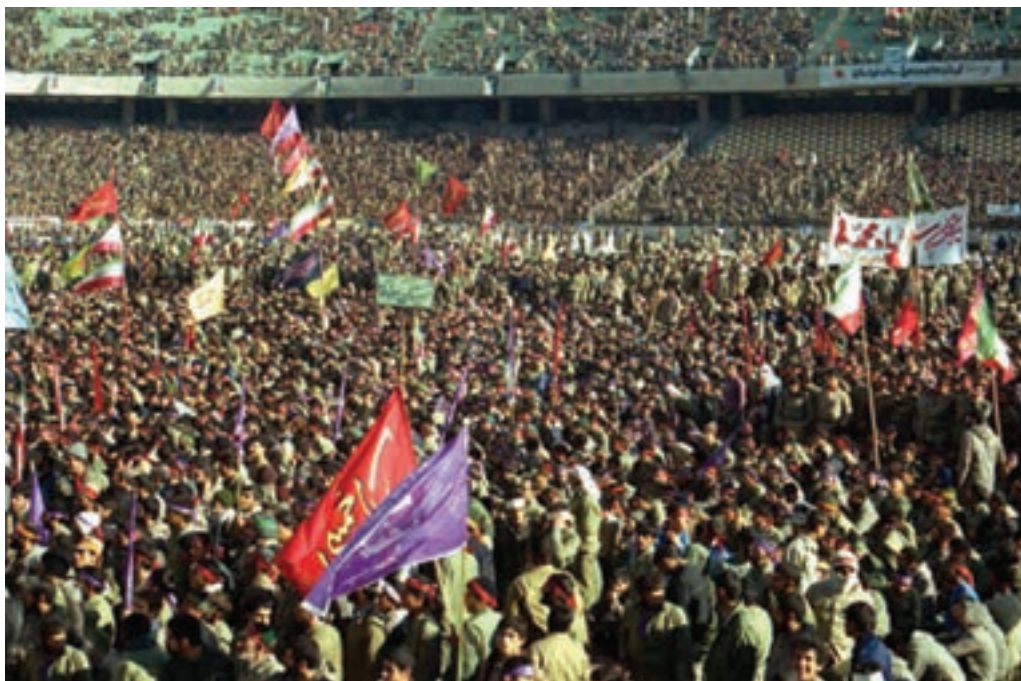
شکل ۷-۴- اعزام سراسری یکصد هزار نفری سپاه حضرت محمد (ص) از شهر تهران

شهر تهران به دلیل مرکزیت سیاسی، نقش بسیار ارزشمندی در دفاع از کیان اسلامی در دوران هشت سال دفاع مقدس بر عهده داشت. استان تهران اگرچه از نظر جغرافیایی دور از مرزها به سر می برد، ولی به واسطه پایتخت بودن و پشتیبانی خطوط جبهه، تقریباً مانند شهرهای مرزی مورد حملات هوایی قرار می گرفت. تهران به دلیل برخورداری از استعدادهایی در زمینه جذب و انتقال نیرو نسبت به سایر شهرها موقعیت ویژه ای داشت، به همین جهت، از اولین شهرهایی بود که در آغاز جنگ تحمیلی مورد حمله قرار گرفت. وجود پادگان های متعدد و فرودگاه های نظامی، خود استعداد بالقوه ای برای جذب نیروهایی شده بود که در بدو پیروزی انقلاب به دامن مردم پناه آورده بودند و پس از آغاز جنگ، عمده آن ها به پادگان ها برگشتند و به دفاع از سرزمین مقدس خود پرداختند. استان تهران با برخورداری از جمعیت کثیری نسبت به سایر استان ها و دارا بودن پادگان ها و مراکز دفاعی متعدد، به طور طبیعی نقش بسیار خطیری در دفاع از میهن اسلامی بر عهده داشت. با آغاز جنگ تحمیلی علیه جمهوری نوپای اسلامی، حضور داوطلبانه و فعال نیروهای مردمی، بسیاری از مشکلات را حل کرد. علاوه بر آن، حضور ارزشمند نیروهای مردمی در قالب نیروهای داوطلب، از پایگاه های بسیج ادارات و مساجد نیز شکوه دیگری از این عظمت را نشان داد که اوج آن را در اعزام سراسری یکصد هزار نفری سپاه حضرت محمد (ص) شاهد بودیم.