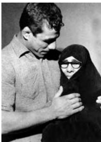
شکل ۱۵-۴- جهان پهلوان تختی

از روحانیان ممتاز می‌توان از مرحوم آیت‌الله طالقانی یاد کرد. او شکنجه‌های بسیاری در زندان طاغوت کشید و از یاران امام خمینی (ره) و اولین امام جمعه تهران پس از انقلاب بود. آیت‌الله طالقانی شاگردان بسیاری برای مبارزه با رژیم ستم‌شاهی تربیت کرد که شهید چمران یکی از کسانی بود که در مجالس درس ایشان شرکت می‌کرد.