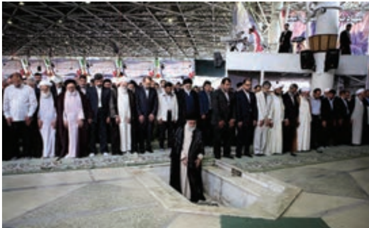
شکل ۱۶-۴- نماز جمعه تهران به امامت مقام معظم رهبری

مردم تهران نه تنها در صحنه دفاع حضور فعال داشتند بلکه با تشکیل ستاد معین بازسازی، همچنان حضور خود را در صحنه حفظ کردند و در زمینه آبادسازی مناطق آزاد شده به خصوص خرمشهر، به تلاش های خود ادامه دادند.