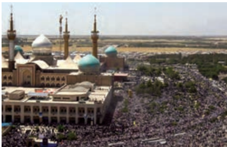
شکل ۱۷-۴- حرم مطهر امام خمینی (ره)

اکنون نیز جای آن دارد که با پاس داشتن خون شهدای گرانقدر، حفظ دستاوردهای رشادت های آن عزیزان و ادامه راه آن ها، رضایت خداوند بزرگ را نیز فراهم آوریم.