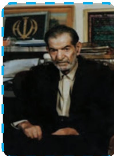
شکل ۳-۴- شهریار

منظومه «حیدر بابایه سلام» او در سال ۱۳۳۱ و ۱۳۳۲ منتشر شد و بسیار مورد استقبال قرار گرفت. این منظومه درخشان‌ترین اثر ادبی زبان ترکی است و تاکنون به ۸۷ زبان زنده دنیا ترجمه شده است.