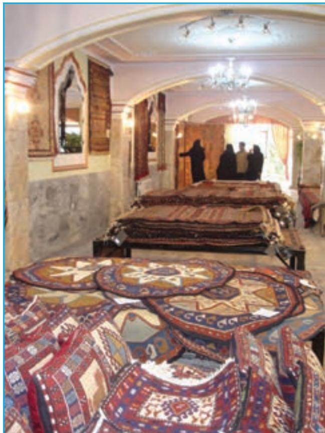
شکل ۱۲-۳- نمایشگاه و فروشگاه صنایع دستی عشایر

در این میان صنایع دستی به‌عنوان جلوه‌ای بدیع از هنرهای سنتی در آذربایجان توانسته همواره تحسین نظاره‌گران را برانگیزد.