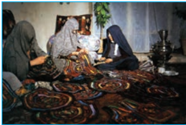
شکل ۱۳-۳- سوزن‌دوزی در میقان