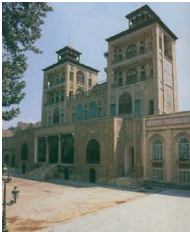
شکل ۱۵-۵- کاخ شمس العماره در مجموعه کاخ موزه گلستان

● اماکن تاریخی: تپه‌های باستانی، کاروانسراها، غارها و کتیبه‌های تاریخی، آب انبارها و حمام‌های قدیمی، بقعه‌ها، میادین و قلعه‌ها و برج‌های تاریخی از جمله جاذبه‌های دیگر استان تهران است (جدول ۲-۵).