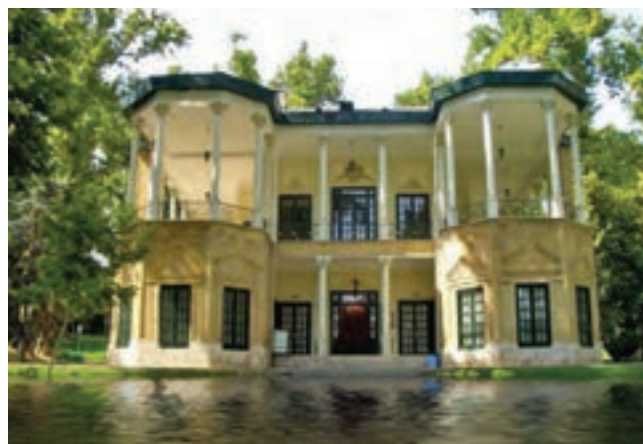
شکل ۱۴-۵- کوشک احمد شاه در مجموعه کاخ موزه نیاوران