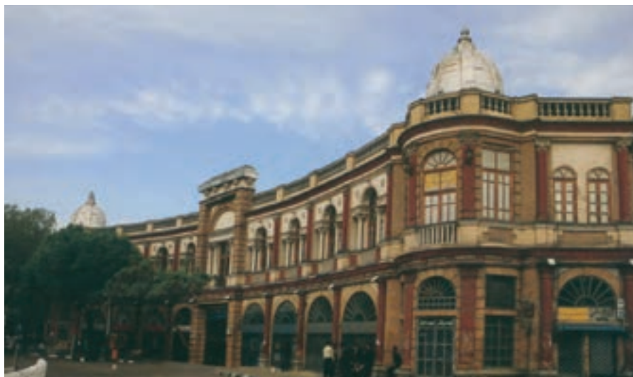
شکل ۱۶-۵- میدان حسن آباد