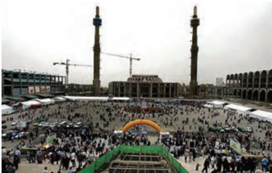
شکل ۱۸-۵- نمایشگاه بین‌المللی کتاب تهران - مصلی بزرگ امام خمینی (ره)

بر پایی نمایشگاه‌های متعدد و گوناگون در تمام طول سال، مانند نمایشگاه بین‌المللی کتاب تهران، نمایشگاه دائمی گل و گیاه و برگزاری جشنواره‌های فرهنگی - هنری نیز از دیگر جاذبه‌های استان تهران برای گردشگران است.