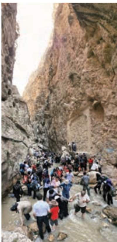
شکل ۹-۵- تنگه واشی

غرب و شرق استان تهران را رودخانه‌های خروشان در بر گرفته که با احداث سد بر روی آن‌ها دریاچه‌های بزرگ و زیبایی به وجود آمده است که مناسب انواع ورزش‌ها و تفریحات آبی هستند.