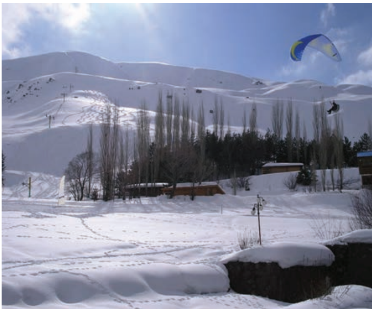
شکل ۱۲-۵- پست اسکی دیزین

پست اسکی دیزین، توچال و آبعلی بزرگ‌ترین پست‌های اسکی ایران در دامنه کوه‌های سر به فلک کشیده البرز پذیرای دوستداران ورزش‌های مفرح زمستانی هستند. غارها، چشمه‌ها، دریاچه‌ها و آبشارهای طبیعی از دیگر جاذبه‌های گردشگری این استان است، تنگه واشی یکی از این جاذبه‌هاست که در فصل تابستان زیباترین چشم‌اندازهای طبیعی را به نمایش می‌گذارد (جدول ۱-۵). غار رودافشان در ۶۲ کیلومتری جاده دماوند یکی از زیباترین غارهای استان تهران در نزدیکی روستای رودافشان واقع شده است.