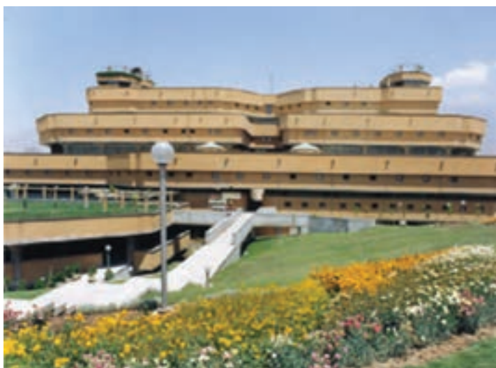
شکل ۵-۶- کتابخانه ملی