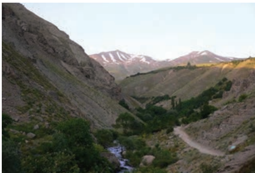
شکل ۱۳-۵- مسیر آبشار شکر آب