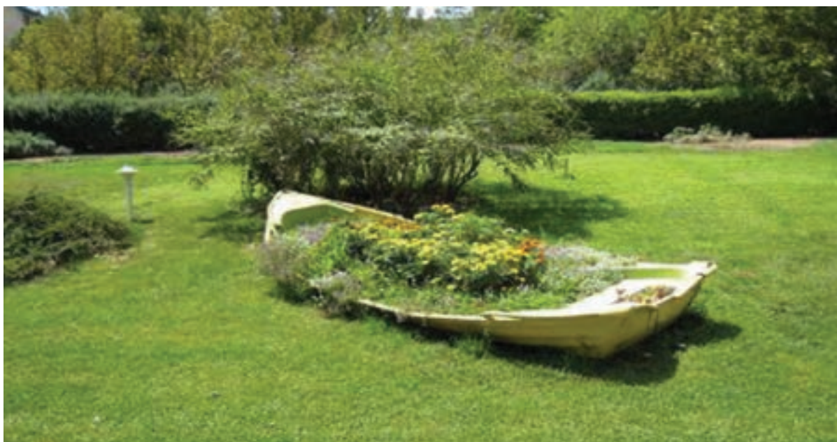
شکل ۱۰-۵- پارکی زیبا در تهران