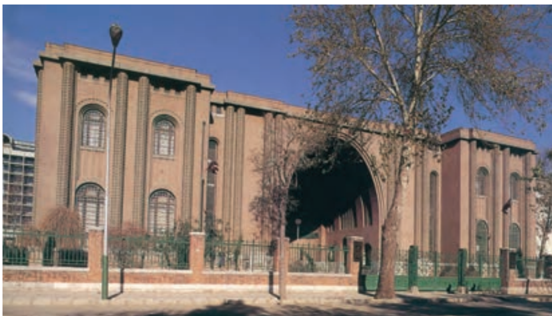
شکل ۸-۵- موزه ایران باستان

جاذبه‌های گردشگری در استان تهران به دو بخش تقسیم می‌شود :