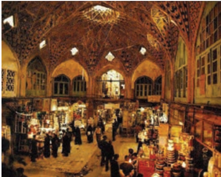
شکل ۱۷-۵- بازار بزرگ تهران

● بازارها: در تهران تعداد زیادی بازار، مراکز خرید و نمایشگاه‌های تجاری و هنری وجود دارد که در فصول مختلف سال موجب جذب گردشگران به این استان می‌شود. بازار سنتی تهران، بازار بین‌الحرمین، تیمچه امین‌اقدس و... از جمله بازارهای قدیمی تهران‌اند که علاوه بر حفظ اهمیت تجاری، از اهمیت تاریخی نیز برخوردارند.