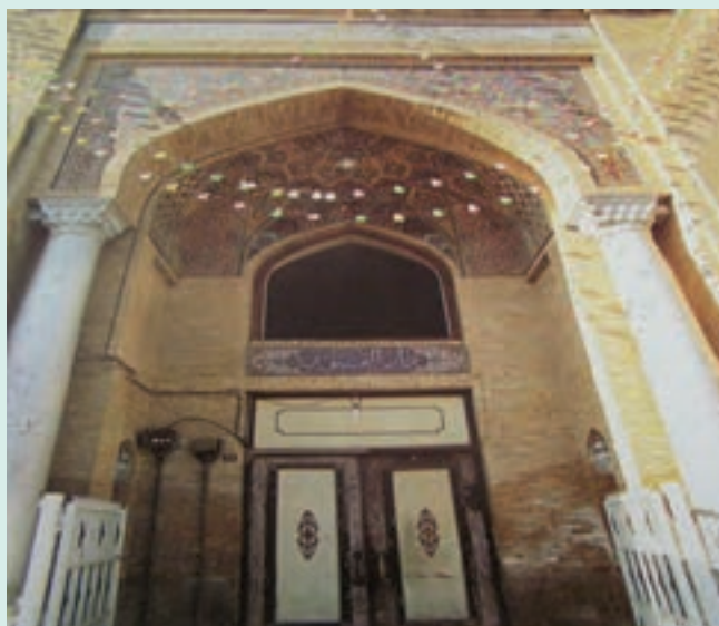
شکل ۵-۷- مدرسه دارالفنون

در مورد یکی از دانش آموختگان مشهور مدرسه دارالفنون گزارشی کوتاه تهیه کنید.