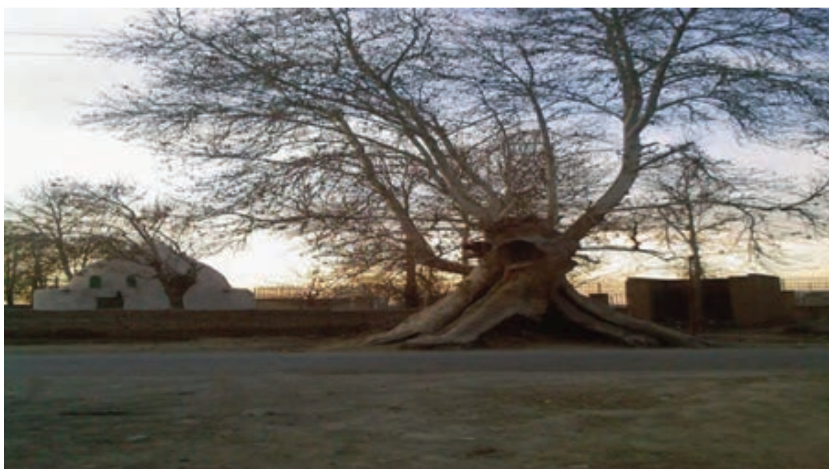
شکل ۱۱-۵- درختی کهن در ورامین