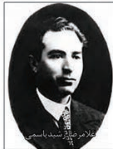
شکل ۶-۴- تصاویری از مشاهیر استان کرمانشاه