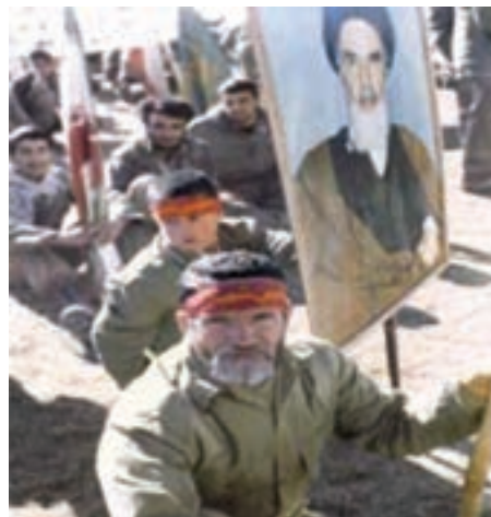
تصویر ۸-۱۱- اعزام رزمندگان اسلام به جبهه (در این نبرد، پیر و جوان، از ایران اسلامی دفاع می‌کردند)