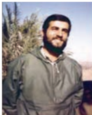
سردار شهید حاج غلامرضا کاوسی