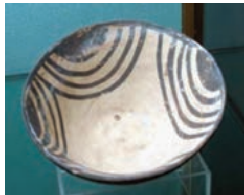
تصویر ۲-۱۰ - آثار دوره پیش از تاریخ استان