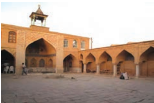
تصویر ۱۱-۱۰- مسجد جامع چالستر

در آثار نویسندگان، سیاحان و جهان‌گردانی چون ناصر خسرو، اصطخری و ابن بطوطه، از مناطق مختلف استان نظیر لردگان با عنوان «لوردغان» و فرخ شهر به صورت «کریوه الرخ» شرحی به میان آمده است. در هر حال مطالعات و بررسی‌ها نشان می‌دهد که از آغاز دوران اسلامی تا قرن سوم هجری این منطقه جزء ایالت جبال محسوب می‌شده است. در سال ۲۳ هجری با فتح نواحی شوشتر و ایزه توسط مسلمانان، کوچ نشینان آن نواحی با اسلام آشنا و به مرور سایر نواحی بختیاری و چهارمحال نیز اسلام را پذیرفتند. از اواخر قرن دوم هجری حکام محلی چهارمحال و بختیاری تابع خلفای عباسی شدند و از قرن سوم هجری به بعد است که عنوان «بلاد اللور» به استان‌های کنونی لرستان، ایلام، چهارمحال و بختیاری، کهگیلویه و بویر احمد و بخش‌هایی از استان‌های فارس و خوزستان اطلاق شد.