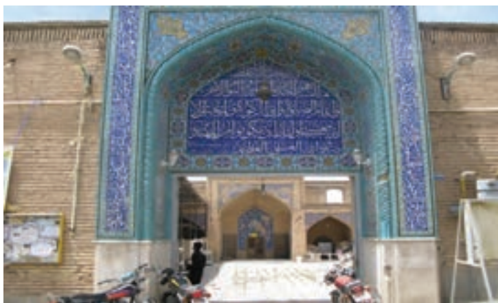
تصویر ۵-۱۱- مسجد جامع شهرکرد (یکی از مراکز تجمع و برگزاری سخنرانی‌های انقلابی در جریان انقلاب اسلامی)

الف) نقش استان در حراست از مرزهای ایران اسلامی همان‌طور که در درس دهم خواندیم، مردم چهارمحال و بختیاری در طول تاریخ همراه با دیگر هموطنان خود به پاسداری از کشور پرداخته‌اند. در این درس با نقش استان در زمان انقلاب اسلامی و جنگ تحمیلی عراق علیه ایران و نیز بعضی شخصیت‌ها و سرداران دفاع مقدس آشنا می‌شوید.