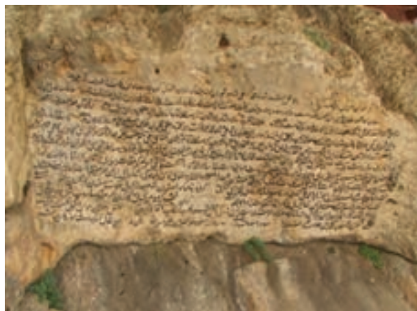
تصویر ۱۹-۱۰ سنگ نوشته مشروطه در پیرغار ده چشمه