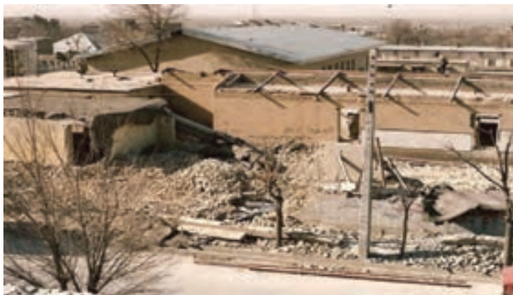
تصویر ۱۱-۱۱- بمباران شهرکرد توسط جنگنده‌های دشمن بعثی در تاریخ ۱۳۶۶/۱۲/۲۰

از آنجایی که مردم استان با تمام توان از رزمندگان اسلام حمایت می نمودند، دشمن بعثی برای شکستن مقاومت آنها، حملات وحشیانه‌ای به شهرکرد انجام داد که در اثر این حملات تعداد ۸۴ نفر از هم استانی‌های ما به درجه رفیع شهادت نایل آمدند.