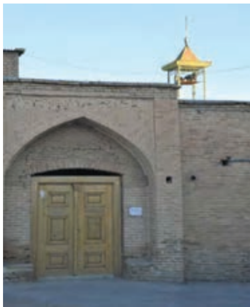
تصویر ۱۵-۱۰- مسجد جامع شهر کیان

همچنین در این زمان تعداد قابل توجهی از آرامنه در نقاط خوش آب و هوای چهارمحال اسکان داده می‌شوند. هسته اولیه بسیاری از شهرهای امروزی استان در دوره صفویه شکل گرفته است. در این زمان، مرکز حکومتی و دولتی منطقه در «قهفرخ» - فرخ شهر - قرار داشت. از این دوره آثار و بناهای بسیاری بر جای مانده است. استان در دوران افشاریه: در دوره افشاریه منطقه چهارمحال و بختیاری به دلیل هم‌جواری با شهر بزرگ اصفهان و برخورداری از شرایط طبیعی خاص و به خصوص دارا بودن چمن‌زارها و چراگاه‌های وسیع و سرسبز، استقرار ایل بزرگ بختیاری و وجود خوانین و سرکردگان قدرتمند که در صدد دستیابی به قدرت بودند، اهمیت بسیاری داشته است.