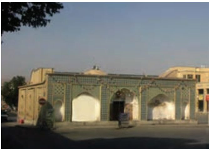
تصویر ۱۳-۱۰- مسجد اتابکان شهرکرد

بعد از تشکیل حکومت اتابکان لر در سال ۵۵۰ هـ. ق. و قرار گرفتن منطقه چهارمحال و بختیاری در محدوده این حکومت و همجواری با مرکز حکومت آنها یعنی شهر ایذه، بر اهمیت منطقه افزوده شد. اتابکان لر با ایجاد ثبات و امنیت در منطقه، اقدامات عمرانی متعددی انجام دادند که راه سازی - راه های مالرو - ساخت پل ها، احداث کاروان سراها و مساجد از مهم ترین اقدامات آنان است. دوران اتابکان شاخص ترین دوره اسلامی منطقه است، از همین رو آثار متعددی از این دوره در منطقه چهارمحال و بختیاری شناسایی شده است. از قرن ششم هجری در دوره اتابکان لر «ایالت جبال» به «عراق عجم» تغییر نام داد؛ بنابراین، استان ما در قلمرو این عنوان قرار گرفت. با انقراض حکومت «اتابکان لر» در سال ۸۲۸ هـ. ق. توسط تیموریان این منطقه همچنان اهمیت خود را در وقایع دولت تیموریان حفظ کرد.