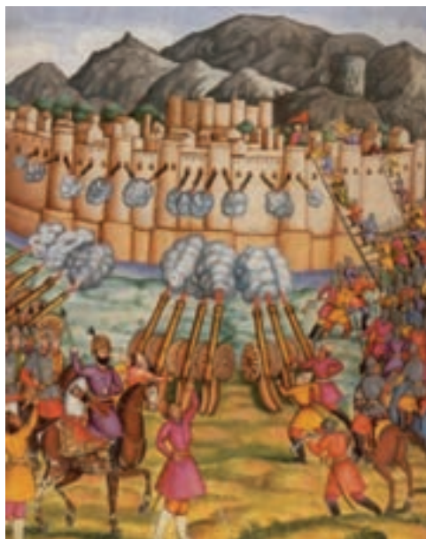
تصویر ۱۴-۱۰- فتح قلعه قندهار در دوره نادر شاه افشار

در این دوره با توجه به بروز شورش‌های مختلف علیه دولت مرکزی در منطقه بختیاری و ماهیت نظامی دولت نادر، منطقه چهارمحال و بختیاری بارها مورد تهاجم و لشکرکشی قوای نادرشاه افشار قرار گرفته است. مشارکت بختیاری‌ها در فتح قلعه قندهار توسط سپاهیان نادر یکی از وقایع مهم و ماندگار این دوران است.