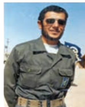
سردار شهید سید کمال فاضل