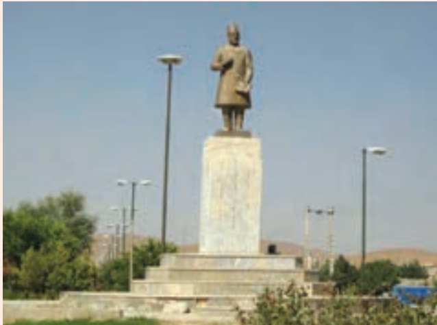
تصویر ۲۹-۱۰- تندیس یادبود میرزا حبیب دستان بنی در شهر بن

سال در تهران به فراگیری ادبیات و فقه و اصول پرداخت. او مدت کوتاهی بعد ناچار عازم استانبول در امپراتوری عثمانی آن روزگار شد و در مکاتب و مدارس مختلف به تحصیل و تدریس مشغول و مدتی از اعضای انجمن معارف آنجا بود. وی در استانبول با آزاد مردانی که برای بیداری ایرانیان کوشش می نمودند، همکاری می کرد. دستان در سال ۱۳۱۵ هـ. ق. در شهر بурсای عثمانی از دنیا رفت و در همان جا به خاک سپرده شد. از آثار این ادیب دانشمند و خوش