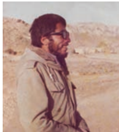
سردار شهید سهراب نوروزی