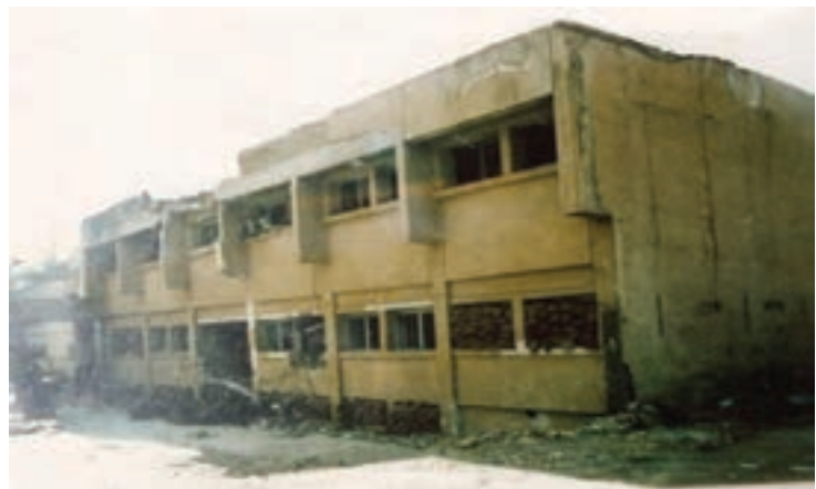
تصویر ۲-۱۱- بمباران شهرکرد توسط دشمن بعثی - (۱۳۶۶/۱۲/۲۰) - ساختمان مخابرات

مردم ولایت مدار و غیرتمند استان ما، با شروع انقلاب اسلامی با شجاعت در صحنه‌های مختلف حضور یافتند. آنها در هشت سال دفاع مقدس، با رشادت فراوان برای پاسداری از تمامیت ارضی کشور و اهداف انقلاب اسلامی از هیچ گونه فداکاری و ایثار دریغ نکردند.