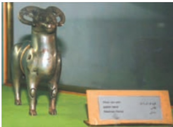
تصویر ۹-۱۰- مجسمه بازمانده از دوره ساسانی

احتمال می‌رود هم زمان با دولت سلوکیان، حکومت محلی «الیمایی» در بخش‌هایی از مناطق غربی منطقه با مرکزیت شهری ایزده تشکیل شده باشد. الیمایی‌ها با استفاده از نبود یک حکومت مرکزی مقتدر پس از سقوط هخامنشیان و نیز شیوه حکومت ملوک الطوائفی اشکانیان، بر قدرت خود افزودند؛ به طوری که نواحی جنوب خوزستان تا خلیج فارس را به اشغال خود در آورده و مستقلاً به ضرب سکه پرداختند. اگر چه با تشکیل دولت ساسانی به قدرت حکمرانان الیمایی پایان داده شد. نفوذ سیاسی - اجتماعی، تمدنی و فرهنگی ساسانیان در استان به قدری زیاد بوده که علاوه بر بقایای جاده‌ها و پل‌ها، تعداد زیادی اشیاء تاریخی از جمله سکه و مهر از این دوره بر جای مانده است. بردگوری‌ها نیز از دیرین آثار سنگی استان در دوران قبل از اسلام می‌باشند که در مناطق مختلف پراکنده‌اند.