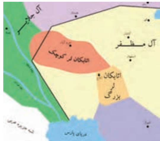
تصویر ۱۲-۱۰- محدوده حکومتی اتابکان لر

استان در دوران صفویه : در دوره صفویه استان چهارمحال و بختیاری به دلیل نزدیکی به شهر اصفهان - پایتخت صفویان - نقش مهم ایلات و عشایر، وجود چراگاه ها و مراتع غنی و سرسبز، مورد توجه پادشاهان صفوی قرار گرفت. اولین بار در دوره صفویه بود که منطقه ای که قبلاً به نام «لُر بزرگ» خوانده می شد کم کم به «بختیاری» معروف گشت. از زمان شاه تهماسب با توجه به تلاش های وی برای انتقال آب کارون به زاینده رود، منطقه مورد توجه بیشتری قرار گرفت.