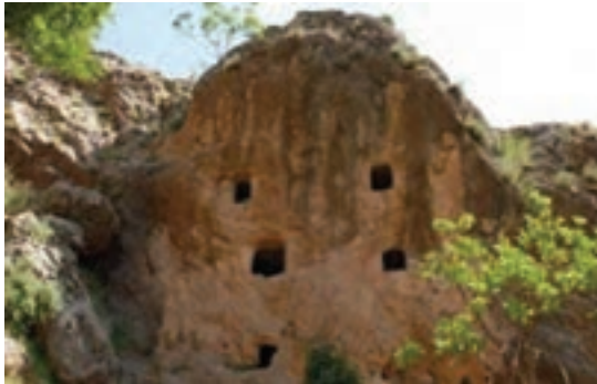
تصویر ۶-۱۰- بردگوری‌ها (اردل)

هم زمان با حکمرانی دولت‌های هخامنشیان، اشکانیان و ساسانیان، وجود مراتع غنی منطقه را به بیلاق و سکونتگاه تابستانی مهم جوامع کوچ روتبدیل کرده بود که وجود ایل راه‌های باستانی و حجاری نقوش برجسته در کنار این راه‌ها به اهمیت فوق العاده مسیرهای ارتباطی که موجب فراهم شدن زمینه ارتباطات اجتماعی و تجاری بین تمدن‌های جنوب غربی ایران و فلات مرکزی شده است، اشاره دارند.