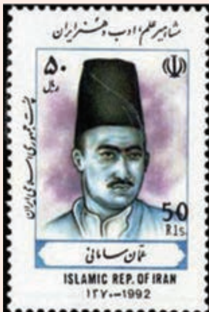
تصویر ۲۶-۱۰- تمبر یادبود میرزا نورالله عمّان سامانی

عمّان، شاعر شیعی سرود و عارف شهیر ایران در عصر قاجار، در سال ۱۲۵۸ ه.ق. در خانواده‌ای اهل شعر و ادب در قریه - شهر - سامان به دنیا آمد و پس از گذراندن دوره مقدماتی در چهارمحل، برای تکمیل علم و دانش عازم اصفهان گردید و علوم رایج در آن زمان چون فقه، اصول و منطق، حکمت، کلام و ادبیات عرب را نزد علما و اساتید برجسته آن زمان فرا گرفت. عمّان که به محافل و مجالس شعر و ادب اصفهان راه یافته بود پس از مدّت کوتاهی به شاعری توانا - به‌ویژه در شعر عاشورایی - تبدیل گردید. این شاعر و عارف برجسته در سال ۱۳۲۲ ه.ق. در زادگاهش سامان بدرود حیات گفته و بنابر وصیتش او را در نجف اشرف نزدیک قبر هود(ع) و صالح(ع) به خاک سپردند. از جمله مشهورترین آثار او به دیوان اشعار، منظومه گنجینه الاسرار، معراج نامه و تذکره مخزن الدرر می‌توان اشاره کرد.