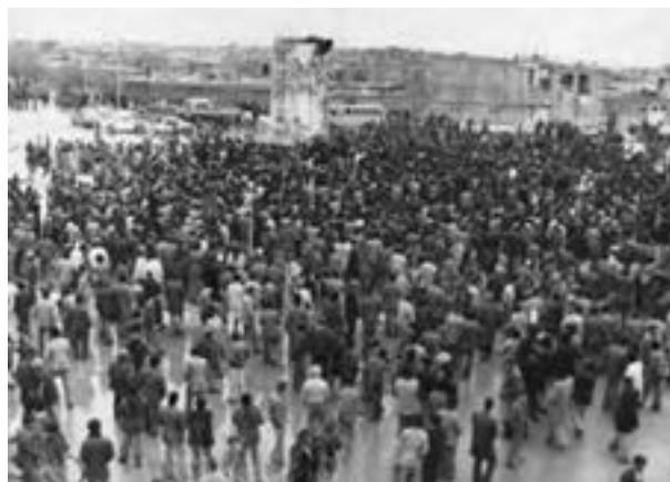
تصویر ۲۳-۱۰ - سقوط نماد نظام شاهنشاهی در شهرکرد - دی ماه ۱۳۵۷

در دوره پهلوی، بختیاری‌ها که تمام منطقه را در دست داشتند، به تدریج نقش سیاسی خود را از دست می‌دهند؛ و تشکیلات سیاسی قبیله‌ای متلاشی می‌گردد؛ و با توجه به امنیت نسبی ایجاد شده و رویدادهایی چون اسکان اجباری عشایر - در دوره پهلوی اول - و انجام اصلاحات ارضی - در دوره پهلوی دوم - کوچ روی کم رونق و یکجانشینی گسترش می‌یابد.