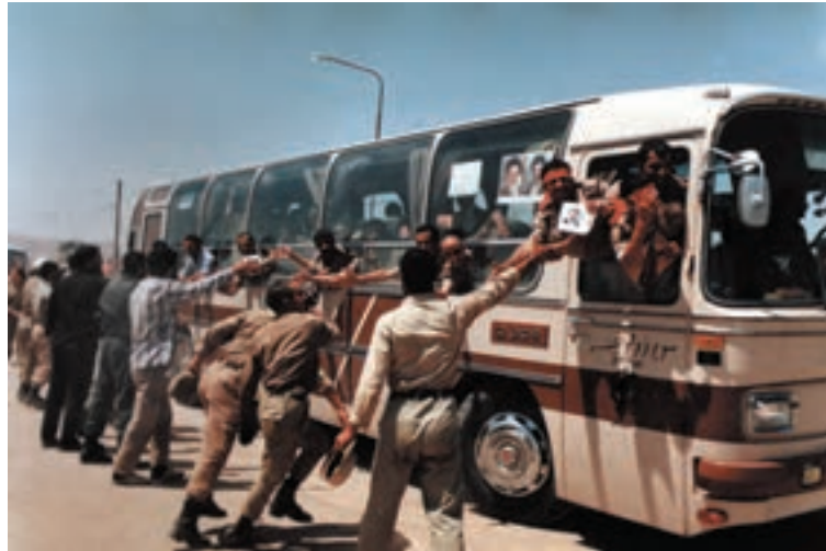
تصویر ۱۰-۱۱- ورود آزادگان به کشور