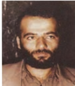
شهید مجتبی استکی