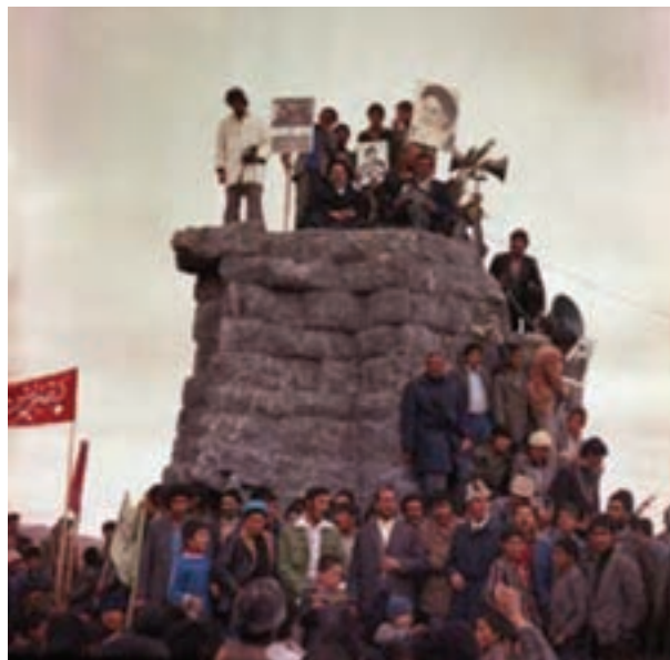
تصویر ۲۴-۱۰ - سقوط نماد نظام شاهنشاهی در بروجن

در این دوره با تأسیس برخی نهادها و مؤسسات دولتی در «شهرکرد» این محل که از اواسط دوره قاجار اهمیت یافته بود، عملاً به مرکز سیاسی و حکومتی منطقه تبدیل شد.