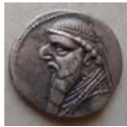
تصویر ۸-۱۰- سکه دوره اشکانی