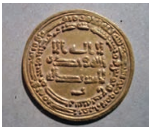
تصویر ۱۰-۱۰- سکه دوره اسلامی