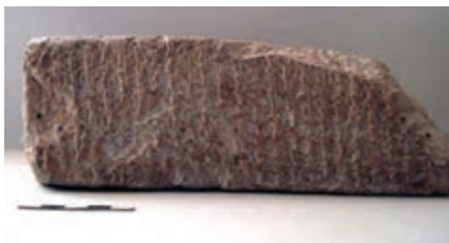
تصویر ۳-۱- آجر نوشته ایلامی کشف شده در شهرستان لردگان

محوطه‌های باستانی مربوط به هزار سال قبل به این سو نشان می‌دهند که، اندک‌اندک گروه‌های مهاجر آریایی این منطقه را مانند سایر مناطق ایران به اشغال خود درآورده و بعد از سرنگونی حکومت ایلام به دست آشوری‌ها، هخامنشیان با تأسیس امپراتوری خود وارث تمدن و فرهنگ ایلامی‌ها در منطقه شده‌اند. اگر چه اطلاعات ما از وضعیت استان در دوره هخامنشی محدود است، ولی آثار به دست آمده نشانگر حضور پررنگ هخامنشیان در منطقه چهارمحال و بختیاری است.