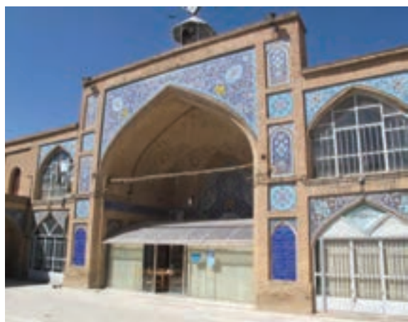
تصویر ۱۸-۱۰ مسجد جامع شهرکرد

یکی از وقایع مهم تاریخ استان در دوره قاجاریه، نقش مهم مردم استان در جریان اعاده مشروطیت (مشروطه دوم) و مقابله با استبداد محمدعلی شاهی بود. به دنبال تقاضاهای اعضای کمیته مشروطه خواهان اصفهان و علمای با نفوذی چون «حاج آقا نورالله