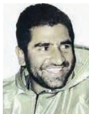
سردار شهید ایرج آقا بزرگی نافجی