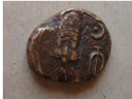
تصویر ۵-۱۰- سکه دوره الیمایی

احتمال می‌رود هم زمان با دولت سلوکیان، حکومت محلی «الیمایی» در بخش‌هایی از مناطق غربی منطقه با مرکزیت شهری ایزده تشکیل شده باشد. الیمایی‌ها با استفاده از نبود یک حکومت مرکزی مقتدر پس از سقوط هخامنشیان و نیز شیوه حکومت ملوک الطوائفی اشکانیان، بر قدرت خود افزودند؛ به طوری که نواحی جنوب خوزستان تا خلیج فارس را به اشغال خود در آورده و مستقلاً به ضرب سکه پرداختند. اگر چه با تشکیل دولت ساسانی به قدرت حکمرانان الیمایی پایان داده شد. نفوذ سیاسی - اجتماعی، تمدنی و فرهنگی ساسانیان در استان به قدری زیاد بوده که علاوه بر بقایای جاده‌ها و پل‌ها، تعداد زیادی اشیاء تاریخی از جمله سکه و مهر از این دوره بر جای مانده است. بردگوری‌ها نیز از دیرین آثار سنگی استان در دوران قبل از اسلام می‌باشند که در مناطق مختلف پراکنده‌اند.