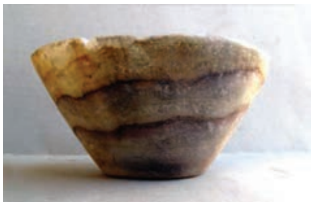
تصویر ۴-۱- ظرف سنگی کتیبه دار دوره هخامنشی