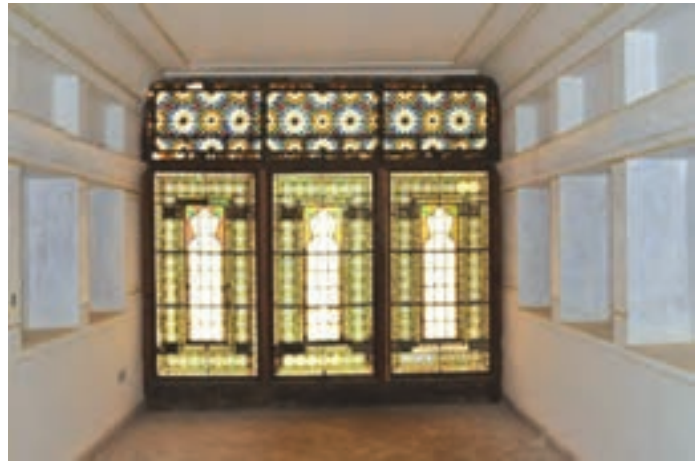
تصاویر ۱۶-۱۰- خانه آزاده چالستر