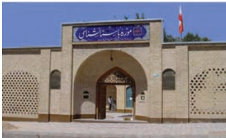
تصویر ۱-۱۰ - موزه باستان‌شناسی شهرکرد

آیا می‌دانید استان چهارمحال و بختیاری، مانند دیگر نقاط کشور ما ایران دارای پیشینه غنی تمدنی و فرهنگی است؟ فکر می‌کنید پیشینه تاریخ و تمدن در استان به چه زمانی باز می‌گردد؟ شما در این درس با برخی از جنبه‌ها و آثار تاریخی و فرهنگی و میراث‌های ماندگار استان خود آشنا می‌شوید.