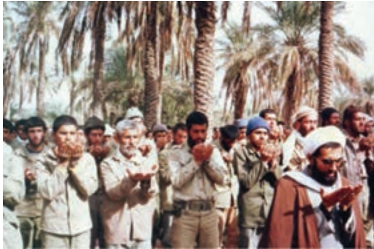
تصویر ۱-۱۱- رزمندگان استان در جبهه‌های حق علیه باطل

— آیا در مورد اتفاقاتی که در زمان انقلاب و جنگ تحمیلی در استان رخ داده، چیزی شنیده‌اید؟