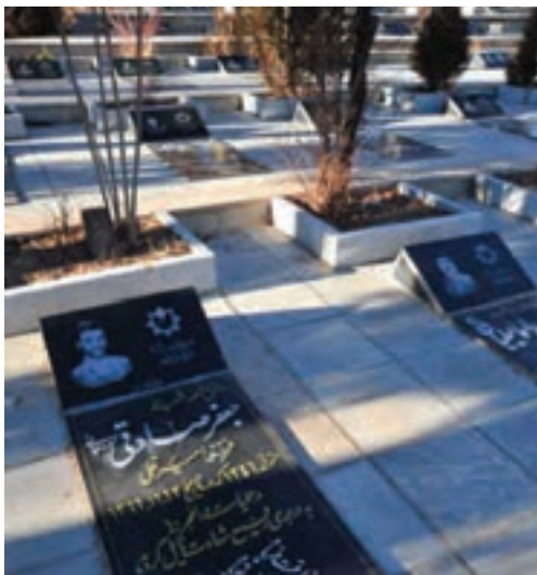
تصویر ۳-۱۱- گلزار شهدای شهرکرد

— آیا در مورد اتفاقاتی که در زمان انقلاب و جنگ تحمیلی در استان رخ داده، چیزی شنیده‌اید؟