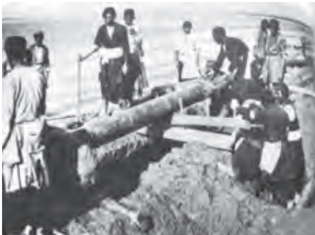
تصویر ۲۲-۱- بختیاری‌ها و نفت

از این پس خوانین بختیاری، موفق به دستیابی به مقامات و مناصب مهم دولتی و موقعیت‌های مناسب اجتماعی و اقتصادی شدند. حضور کمپانی «لینچ» در منطقه و قرارداد خوانین بختیاری با آنان برای احداث جاده‌ای کاروان رو که خوزستان را به اصفهان متصل می‌کرد؛ و نیز قرارداد انگلیسی‌ها در مورد نفت جنوب با خوانین بختیاری شرایط و موقعیت‌های مناسبی برای آنان فراهم آورد. کاخ قلعه‌های زیادی از این دوره در مناطق مختلف چهارمحال و بختیاری متعلق به خوانین بر جای مانده است.