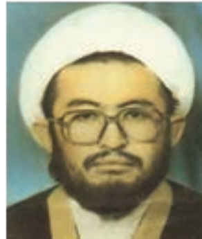
حجت الاسلام شهید عیسی توسلی