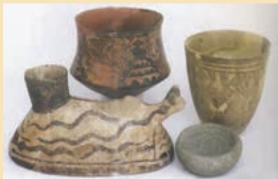
شکل ۴-۶- آثار کشف شده در قره تپه قمرود

ظروف از سفال‌های آجری و نخودی رنگ استفاده می‌کردند اما با ورود آریایی‌ها، سفالینه‌های خاکستری جایگزین آنها شد.