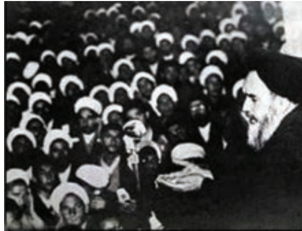
شکل ۳-۴- سخنرانی پرشور امام خمینی (ره) در ۱۲ خرداد سال ۱۳۴۲

پس از پیروزی شکوهمند انقلاب اسلامی ایران، شهر قم به پایتخت مذهبی کشور تبدیل شده است و علما و مردم آگاه قم در تحولات سیاسی کشور نقش مهمی ایفا می‌کنند و همواره پشتیبان برنامه‌ها و اهداف انقلاب اسلامی هستند.