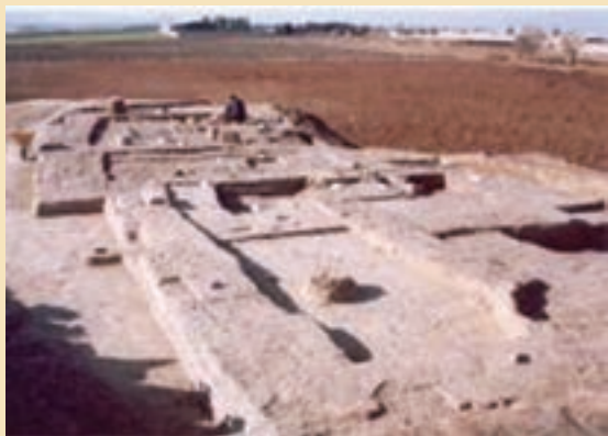
شکل ۴-۴- تپه تاریخی قلی درویش