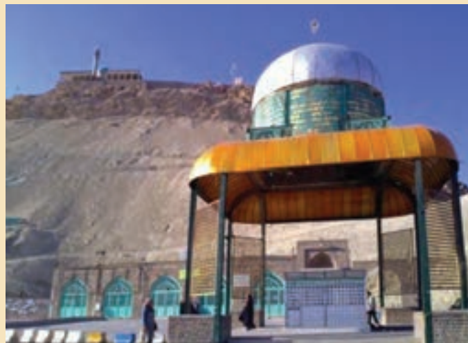
شکل ۱۹-۴- مرقد مطهر شهدای گمنام استان در دامنه کوه خضر نبی (ع)

شهدای گمنام : یکی از مکان‌هایی که مورد بازدید و زیارت مردم قم و زائران حرم مطهر حضرت معصومه (س) قرار می‌گیرد مرقد پاک و مطهر ۱۴ شهید گمنام در محل کوه خضر نبی (ع) است. این شهدا که در پایین کوه خضر به خاک سپرده شده‌اند یکی از میعادگاهها و زیارتگاههای مردم به‌شمار می‌رود که در هفته به‌خصوص شب‌های جمعه پذیرای تعداد زیادی از زائران و هم‌زمان شهدا و مردم استان و دیگر مناطق کشور است.