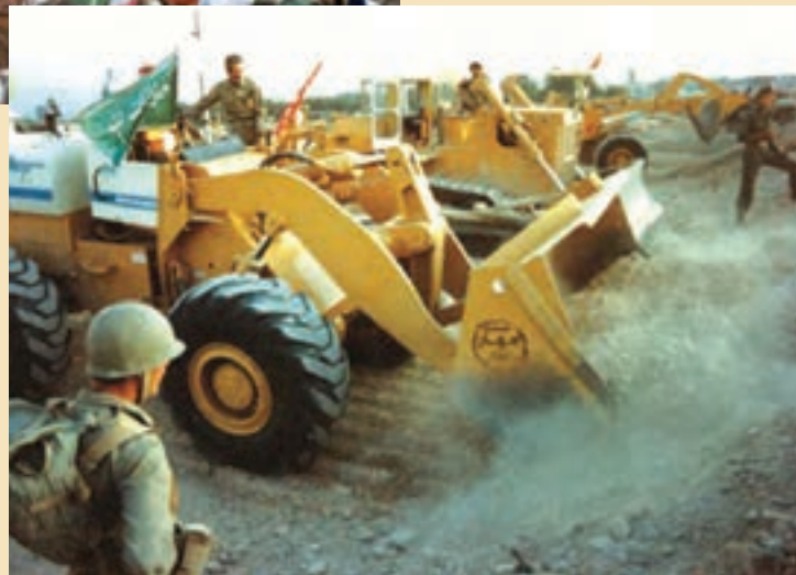
شکل ۱۵-۴- نقش جهادسازندگی در هشت سال دفاع مقدس