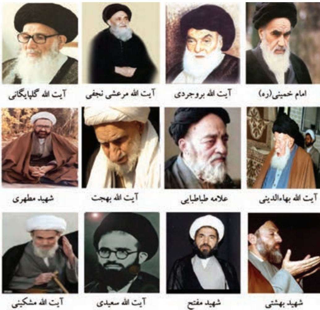
شکل ۹-۴- تصاویری از برخی شخصیت‌های بزرگ علمی و انقلابی استان قم در دوره معاصر

در دوره معاصر، بزرگان زیادی در این سرزمین مقدس زندگی کرده‌اند که به چند نفر از آنها اشاره می‌شود: حضرت امام خمینی (ره) بنیان‌گذار جمهوری اسلامی ایران، آیت الله حاج شیخ عبدالکریم حائری مؤسس حوزه علمیه قم، علامه محمد حسین طباطبایی صاحب تفسیر ارزشمند المیزان، آیت الله مرعشی نجفی، آیت الله بروجردی، آیت الله گلپایگانی، آیت الله خوانساری، آیت الله بهاء‌الدینی، آیت الله اراکی، آیت الله صدر، آیت الله بهجت، آیت الله مشکینی و استاد علی اصغر فقیهی معلم و پژوهشگر برجسته. گفتنی است شهید مفتح، شهید مرتضی مطهری، شهید بهشتی، شهید آیت الله سعیدی و شهید حسین غفاری در راه پیروزی انقلاب اسلامی، به شهادت رسیدند.