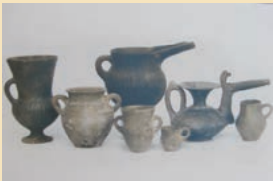
شکل ۴-۵- آثار کشف شده در تپه تاریخی صرم