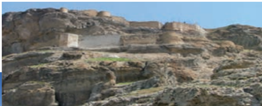
شکل ۱۰-۴- قلعه قهقهه در مشکین شهر