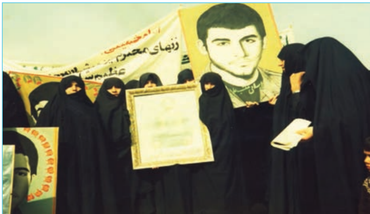
شکل ۱۳-۴- حضور زنان استان در عرصه‌های مختلف دفاع مقدس

مردم مسلمان و انقلابی این استان از دوره صفویه که مذهب تشیع از اردبیل رسمیت یافت، همواره ولایت مدار و در عرصه‌های مختلف تحت تأثیر مکتب حسینی در برابر هر گونه ظلم و ستم خارجی و داخلی ایستاده‌اند و با نثار خون خویش در حوادثی مانند جنگ چالدران، جنگ‌های ایران و روسیه، اشغال آذربایجان در جریان جنگ جهانی اول و دوم و مبارزه با فرقه جدایی طلب دموکرات از هویت دینی و ملی خود دفاع کرده‌اند. در دوره حکومت پهلوی نیز در کنار روحانیت و دیگر انقلابیون به مخالفت با اقدامات استبدادی و ضد مذهبی رژیم پرداختند. اعتراض آیت الله سید یونس اردبیلی به کشف حجاب دوره رضاشاه نمونه بارز این ادعاست. استان اردبیل با تقدیم شهدای گرانقدری در دوران انقلاب و دفاع مقدس نقش بزرگی در وقوع و استمرار انقلاب اسلامی ایفا کرده است.