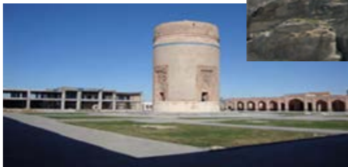
شکل ۱۱-۴- بقعه شیخ حیدر مشکین شهر

خیابان در دوره صفویه رونق بیشتری داشته است. در زمان شیخ حیدر که حاکم و والی این شهر بوده به دلیل تلاش وی برای رونق و آبادانی آن اهمیتی فوق العاده یافت. در دوره قاجار به ویژه در جنگ های ایران و روسیه این شهر از مراکز بسیار مهم برای استقرار سپاه عباس میرزای ولیعهد بوده است. در سال ۱۲۷۵ ه. ق. لشکریان روس پس از جنگ سختی با توپ و تفنگ و تجهیزات کامل شهر را به مدت ۶ ماه محاصره کرده و پس از سرکوب ایلات شاهسون که به شدت مقاومت می کردند، اموال مردم به عنوان غرامت توسط روس ها به یغما رفت.