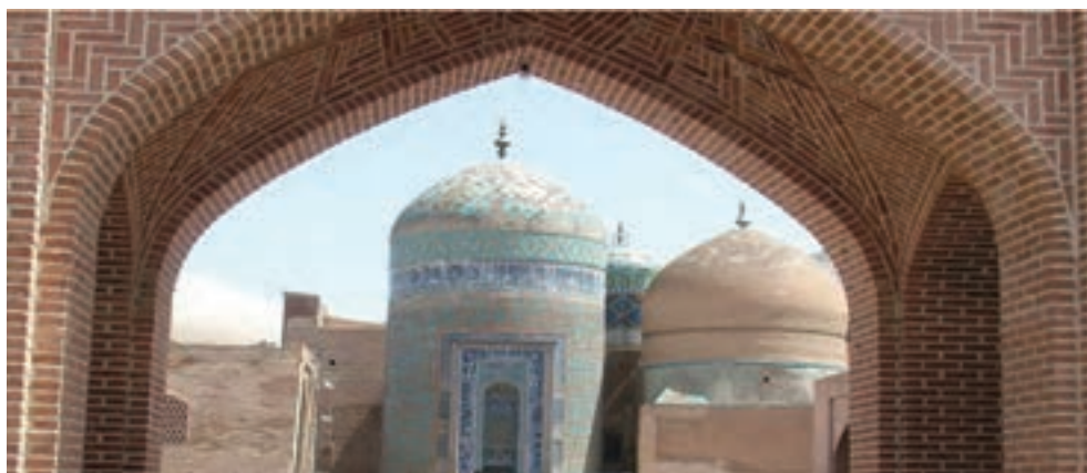
شکل ۷-۴- مجموعه بقعه شیخ صفی - گنبد الله الله در اردبیل