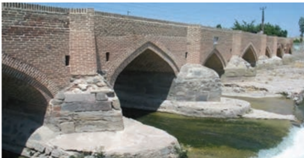
شکل ۸-۴- پل هفت چشمه اردبیل از دوره صفویه