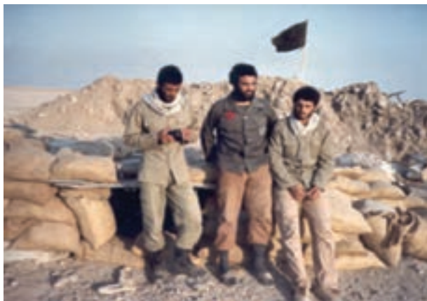
شکل ۲۱-۴- شهید میر محمود بنی هاشم (نفر دوم)