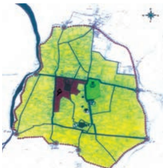
شکل ۴-۴- شهر قزوین در دوره قاجاریه

هـ. ق) پس از پیروزی بر افغان‌ها عازم قزوین شد. او به هنگام اقامت در قزوین تاجی را که بزرگان محلی در اختیارش نهاده بودند به سر نهاد و در داخل ارگ قزوین کوشکی بنا نهاد و تالاری برای پذیرایی پی افکند که به نام تالار نادری معروف شد. با مرگ نادر و درهم ریختگی اوضاع کشور، کریم خان زند (۱۱۹۳-۱۱۶۳ هـ. ق) بر تخت پادشاهی ایران نشست. قزوین در این دوره جزئی از حاکمیت این سلسله به‌شمار می‌رفت. با تأسیس سلسله قاجاریه، قزوین توسط حکام منصوب دربار قاجار یا نمایان آنان که بیشتر از شاهزادگان و وابستگان دربار بودند اداره می‌شد.