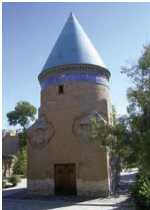
شکل ۶-۴- آرامگاه حمدالله مستوفی

حمدالله مستوفی : او نویسنده و مورخ و جغرافیدان معروف سده هشتم (تولد ۶۸۰هـ. و وفات ۷۵۰هـ.ق) و مؤلف تاریخ گزیده نزه القلوب و ظفرنامه، در دوره ایلخانان مغول می‌باشد. مستوفی در کارهای دیوانی و محاسباتی سرآمد بود. مزار او در محله ملک‌آباد قزوین واقع است.