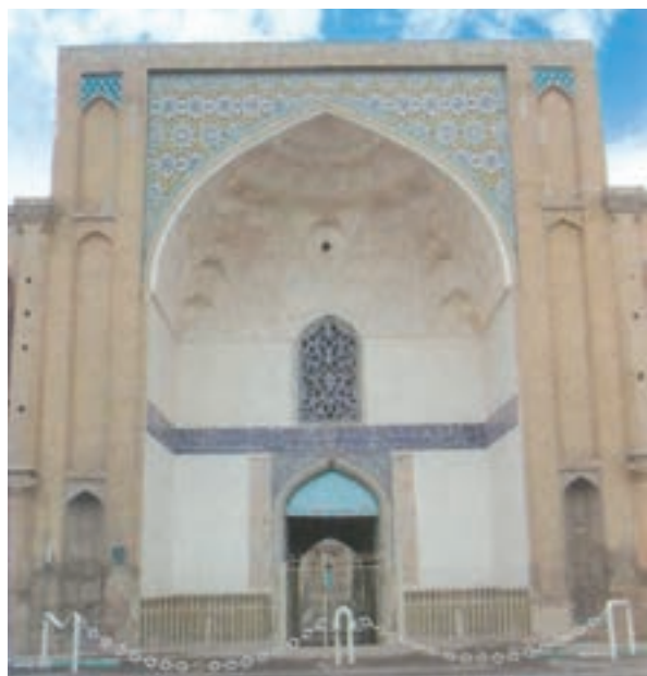
شکل ۳-۴- سردر عالی قابو از بناهای دوران صفویه

ورود سپاهیان مغول به ایران موجب ویرانی‌های بسیاری شد. با ورود آنان به شهر قزوین مردم شهر، تا سه روز با رشادت و شجاعت در مقابل مغولان مقاومت کردند، اما در نهایت سپاه مهاجم وارد شهر شد و خسارات فراوانی بر آن وارد کرد. پس از پایان حکومت مغولان و نبود حکومت قوی، صفویان توانستند دولتی نیرومند در ایران تأسیس نمایند و ثبات و نظم را به کشور بازگردانند. در زمان شاه تهماسب اول (۹۸۴-۹۳۰ ه.ق) قزوین به‌عنوان پایتخت ایران برگزیده شد و این موجب رونق و توسعه شهر گردید و واحدهای تجارتی جدیدی چون: کاروانسراها، بازارها و قیصریه‌ها در آن بنا شد. کالاها از نواحی مختلف به سوی آن سرازیر شد و راه‌های تجارتی توسعه و رونق یافت.