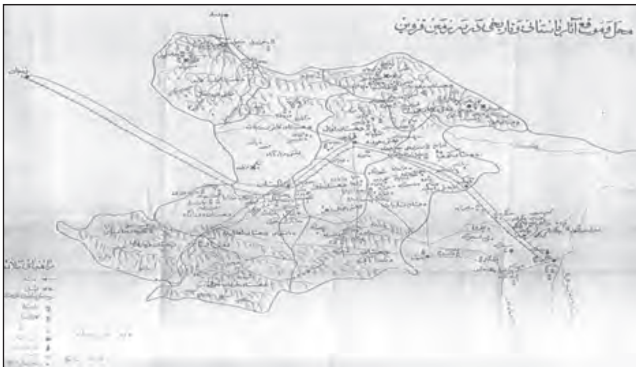
شکل ۱-۴- محل و موقع آثار باستانی و تاریخی در سرزمین قزوین