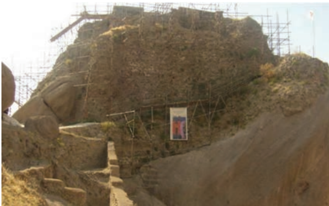
شکل ۲-۴- قلعه حسن صباح الموت، در حال مرمت