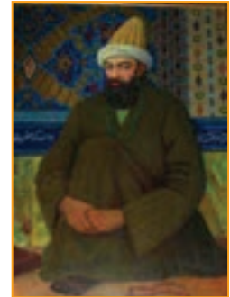
شکل ۱۶-۴- شاه نعمت الله ولی