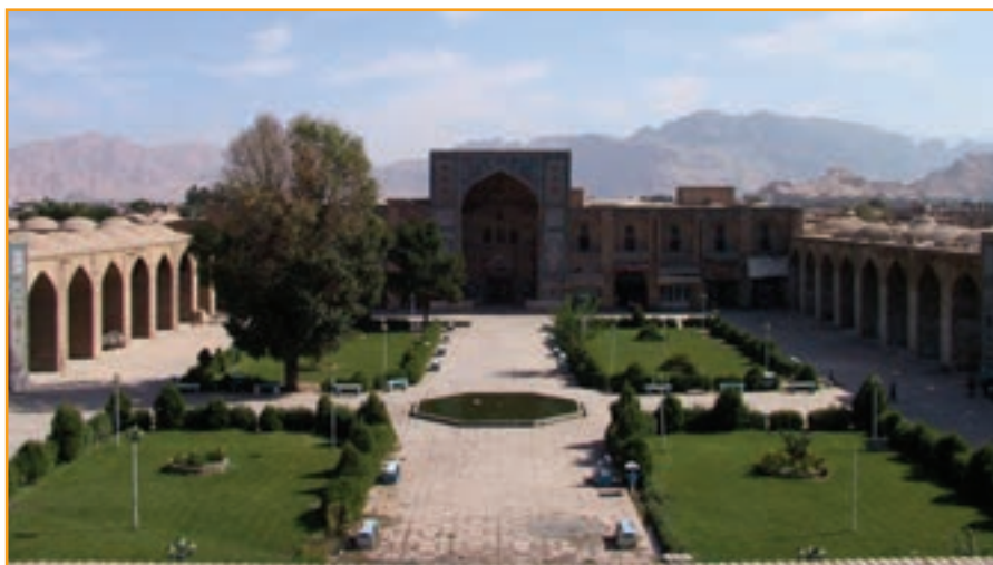
شکل ۲-۴- مجموعه تاریخی گنجعلی خان کرمان

ب) دوران اسلامی : بنا به روایات تاریخی، کرمان در سال ۲۴ هجری توسط مسلمانان فتح شد. اما تا سال ۸۶ هجری زرتشتیان در کرمان بیشترین قدرت و قوت را دارا بودند. با به قدرت رسیدن صفاریان، کرمان تا حدودی روی آبادی را به خود دید و بناهای متعددی از جمله مسجدی عظیم در جیرفت بنا نهاده شد.