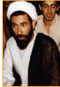
شکل ۱۲-۴- شهید دکتر محمد جواد باهنر