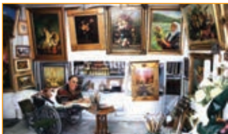
شکل ۲۵-۴- جهان بخش صادقی گوغری