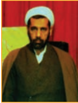
شکل ۱۴-۴- شهید حجت الاسلام علی ایرانمنش