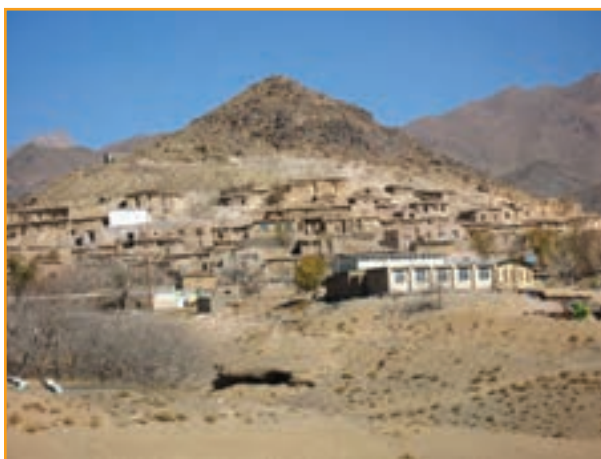
شکل ۲۶-۴- روستای شهید پرور گنجان شهرستان رابر

«روستای گنجان شهرستان رابر دومین روستای نمونه شهیدپرور کشور به لحاظ داشتن بیشترین تعداد شهید به نسبت جمعیت است.»