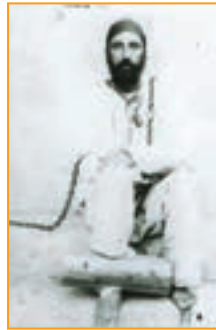
شکل ۱۸-۴- میرزا رضای کرمانی