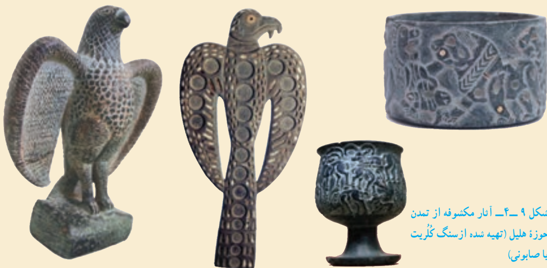
شکل ۹-۴- آثار مکشوفه از تمدن حوزه هلیل (تهیه شده از سنگ گلریت یا صابونی)

باستان شناسان یافته‌های کنار صندل (شمالی و جنوبی) را مربوط به نیمه دوم هزاره چهارم قبل از میلاد می‌دانند. و تاکنون بیش از ۳۰۰ اثر مهر از آن به دست آمده است. به نظر می‌رسد این اثر مهرها، در ارتباط با تأمین امنیت محتویات کیسه‌های کوچک، سبدهای کوچک و دیگر ظروف کوچک بوده‌اند. این مدارک مهرسازی، بر روابط تنگاتنگ این منطقه با فرهنگ‌های همزمان عصر مفرغ در میان رودان، دره سند و آسیای مرکزی اشاره دارند، تنوع موجود در هنر مهرسازی حکایت از این دارد که کنار صندل جنوبی در مرکز شبکه‌ی فعالی از تجارت راه دور قرار داشته است.