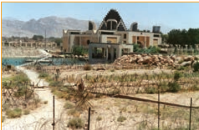
شکل ۳۲-۴ موزه دفاع مقدس استان کرمان

استان کرمان با ۸۱۸ گلزار شهید و ۲۷ حرم مطهر شهدای گمنام، یکی از استان های نمونه کشور است. همچنین موزه دفاع مقدس که در سال ۱۳۷۶ به هنگام برگزاری کنگره سرداران ۸۰۰۰ شهید استان های کرمان و سیستان و بلوچستان و هرمزگان به عنوان اولین موزه دفاع مقدس کشور افتتاح شد و ستاد معراج شهدا یادگار ۶۴۰۲ شهید و سرداران شهید استان، از جمله یادمان های دفاع مقدس استان به شمار می آیند. نصب تصاویر کاشی شهدا در سطح شهرهای استان و تندیس های دفاع مقدس در میادین شهرهای استان از دیگر یادمان های دفاع مقدس است.