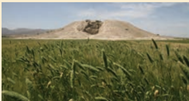
شکل ۱۰-۴- محوطه باستانی تبه یحیی