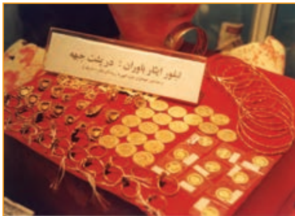
شکل ۳۴-۴- نمونه‌ای از کمک‌های مردم استان کرمان در طول هشت سال دفاع مقدس

استان کرمان در حوزه کمک‌های مردمی سرآمد سایر استان‌های کشور بود. اعزام کاروان‌هایی با بیش از ۳۰۰ دستگاه انواع مختلف خودرو، همراه با حمل کمک‌های مردم شهیدپرور کرمان در نوع خود کم نظیر بود.