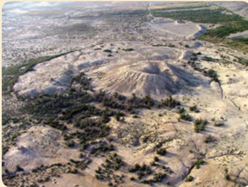
شکل ۸-۴- تپه تاریخی کنار صندل (تمدن حوزه هلیل)

وجود تپه‌های تاریخی فراوان در استان کرمان دلیل قدمت چندین هزار ساله تمدن آن است.