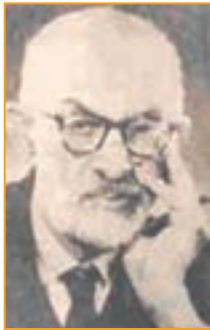
شکل ۱۹-۴- دکتر سعید نفیسی