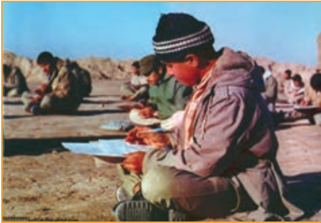
شکل ۳۰-۴ دانش آموزان رزمنده کرمانی در جبهه دفاع مقدس