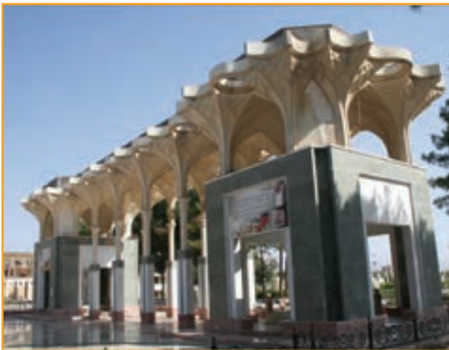
شکل ۳۱-۴ بنای یادمان شهدای گمنام استان کرمان