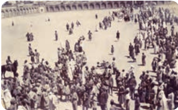
شکل ۳-۴- ارگ تاریخی کرمان (میدان ارگ فعلی)

در آستانه به قدرت رسیدن صفویان، کرمان از جمله مناطقی بود که در معرض حمله و غارت ازبکان قرار گرفت و شاه اسماعیل صفوی با شکست ازبکان، امنیت را برای کرمان به ارمغان آورد. حاکم مشهور کرمان در دوره صفویه گنجعلی خان بود. وی در طول سی سال حکومت خود بر کرمان به احداث آثار و بناهای متعدد از جمله کاروانسرا، بازار، حمام، مسجد، مدرسه و آب انبار پرداخت.