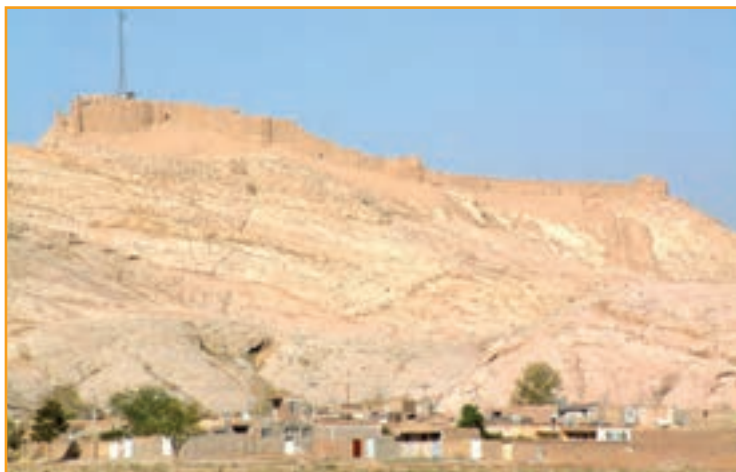
شکل ۱-۲- قلعه دختر کرمان

الف) قبل از اسلام : کرمان در دوره هخامنشی یکی از ولایات مهم تابعه پارس محسوب می شده است. اردشیر بابکان که محل تولد و نشو و نما او شهر بابک کرمان بود، در آبادانی این مملکت سعی فراوان داشت از جمله اینکه در شهر کرمان در جوار قلعه دختر، قلعه اردشیر را بنا نهاد و آن را گواشیر نامید و هنوز آثار خرابه‌های قلعه دختر و قلعه اردشیر بر فراز تپه‌ای در شرق کرمان پابرجاست.