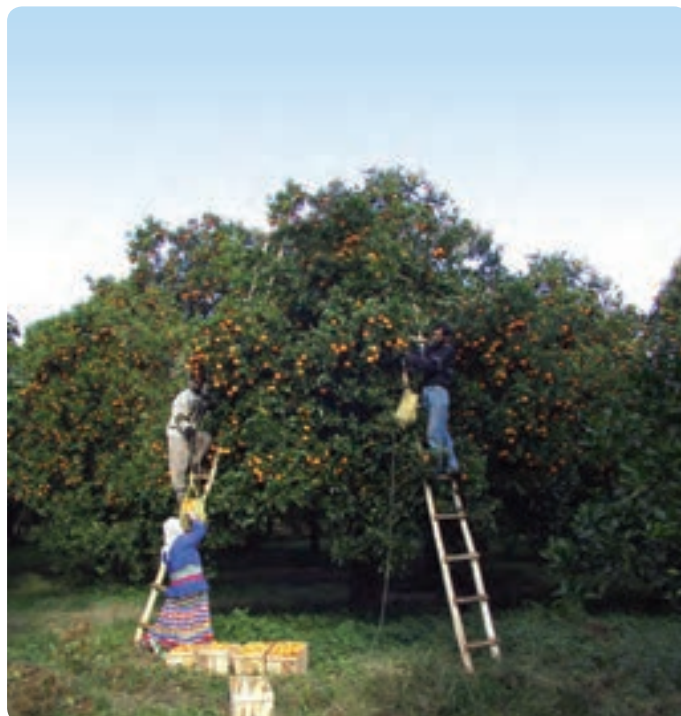
شکل ۲۳-۵- برداشت مرکبات

استان گیلان با برخورداری از امکانات و استعدادهای متنوع آبرزی پروری به جهت دارا بودن مزارع پرورش ماهیان گرم آبی، سردآبی و ماهیان خاویاری، آب بندان‌ها، چاه‌های آب و مزارع شالیزاری، یکی از قطب‌های مهم پرورش آبزیان کشور است که در صورت فراهم شدن بستر مناسب‌تر، این فعالیت می‌تواند نقش به‌سزایی در توسعه پایدار و همه‌جانبه استان ایفا کند. گفتنی است گیلان اولین استان در کشور است که در زمینه پرورش ماهیان خاویاری شروع به کار کرد و گونه منحصر به فرد فیل ماهی را پرورش داد و سبب شد ایران دومین کشور در زمینه تکثیر این ماهی در جهان باشد.