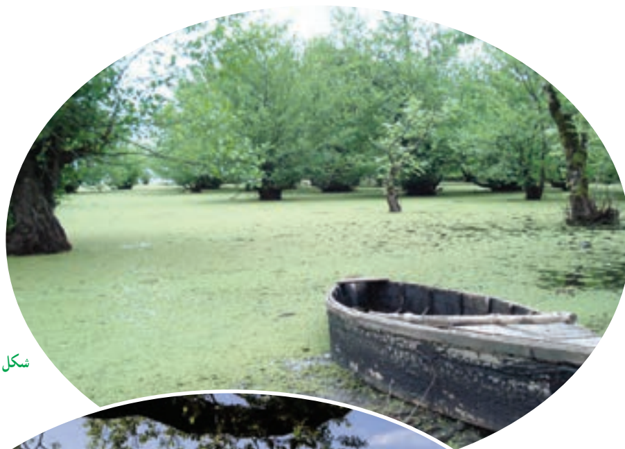
شکل ۲-۵- تالاب استیل آستارا