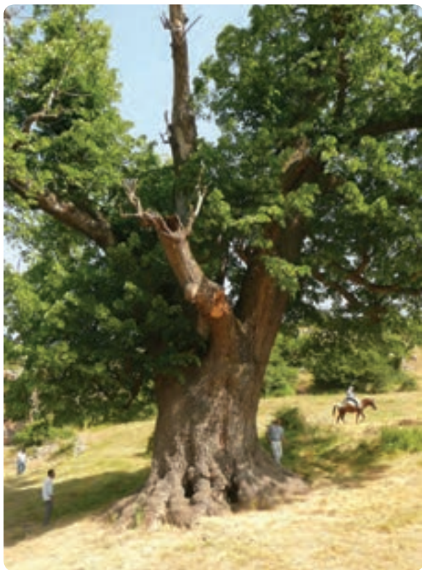
شکل ۱۴-۵-ب- درختی کهنسال و غول پیکر در ارتفاعات رودبار