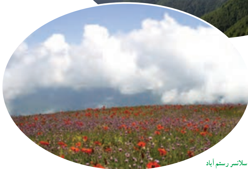
شکل ۴-۵- سانسر رستم آباد