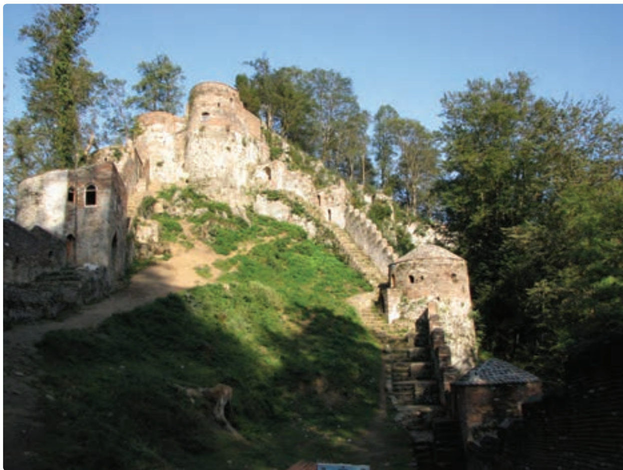
شکل ۱۳-۵- قلعه رودخان در جنوب فومن