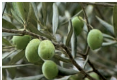
شکل ۲۰-۵-الف - محصول زیتون

مهم ترین کانون فعالیت های کشاورزی استان، مناطق پست جلگه ای است. زمین های کوهپایه ای به پوشش جنگلی و در برخی مناطق محصولات باغی اختصاص دارد کشت برخی از محصولات خاص زمین های جلگه ای مانند برنج در امتداد درّه ها بر روی تراس های رودخانه ای تا جایی که وسعت زمین و شرایط رویش اجازه دهد، در نواحی کوهپایه ای نیز معمول است. درّه سفیدرود از رستم آباد تا حوالی منجیل و لوشان به کشت زیتون اختصاص دارد.