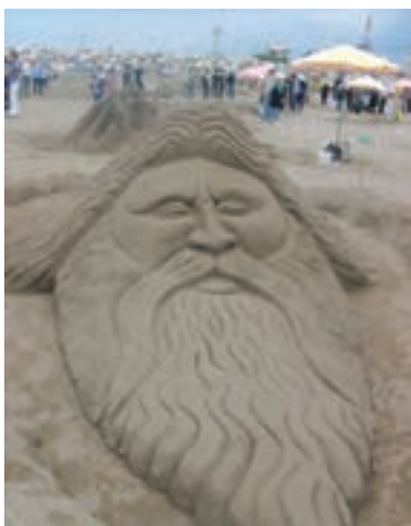
شکل ۱-۵-ج - جشنواره مجسمه‌های شنی در سواحل گیلان

استان گیلان یکی از مراکز مهم گردشگری در ایران است. این استان دارای امتیازهای قابل توجهی برای جذب گردشگر است که به چند مورد آن اشاره می‌شود. از جمله: آب و هوای مناسب، تنوع ناهمواری و پوشش گیاهی، تنوع چشم‌اندازهای انسانی و موقعیت نسبی مناسب برای جذب گردشگران داخلی و خارجی.