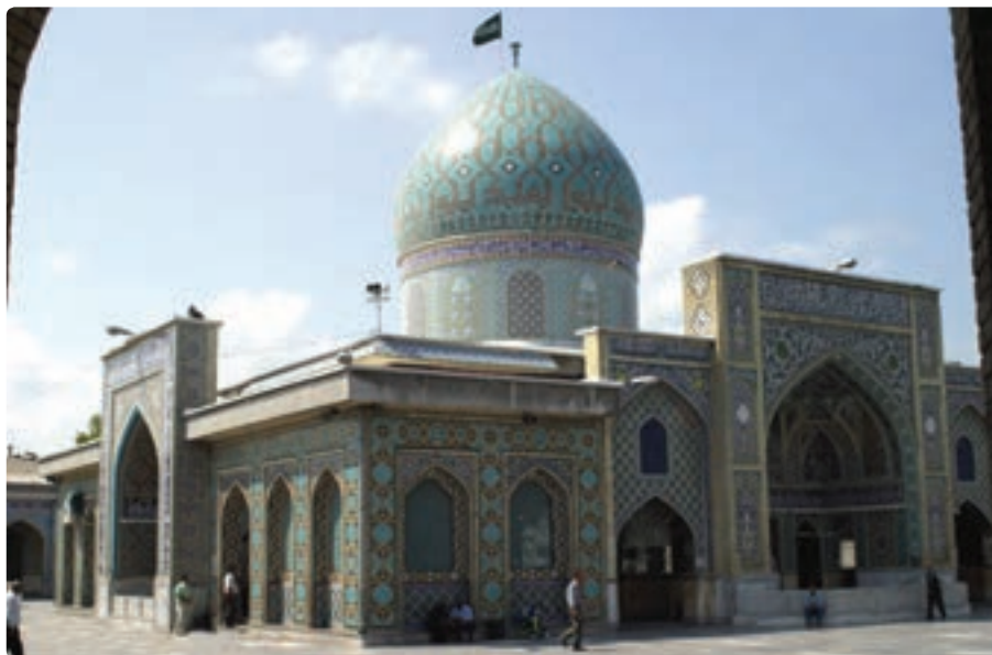
شکل ۱۵-۵- مرقد سید جلال‌الدین اشرف