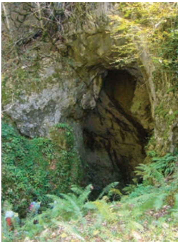
شکل ۷-۵- غار آویشو - شاندرمن

۲- جاذبه‌های تاریخی و یادمانی: قدیمی‌ترین بناهای تاریخی و یادمانی گیلان در کوهپایه‌ها و مناطق کوهستانی است و آثار مربوط به پیش از ورود آریایی‌ها مثل تپه‌های مارلیک در حوالی روستای نصفی رحمت‌آباد رودبار و مسکن ماقبل تاریخ مریان در روستای مریان کرگانرود تالش از نظر تاریخی اهمیت ویژه‌ای دارند.