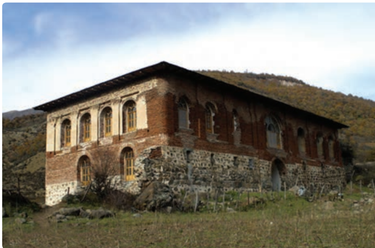
شکل ۸-۵- کاخ آق اولر تالش (یکی از قصرهای سردار اُمجد در تالش)