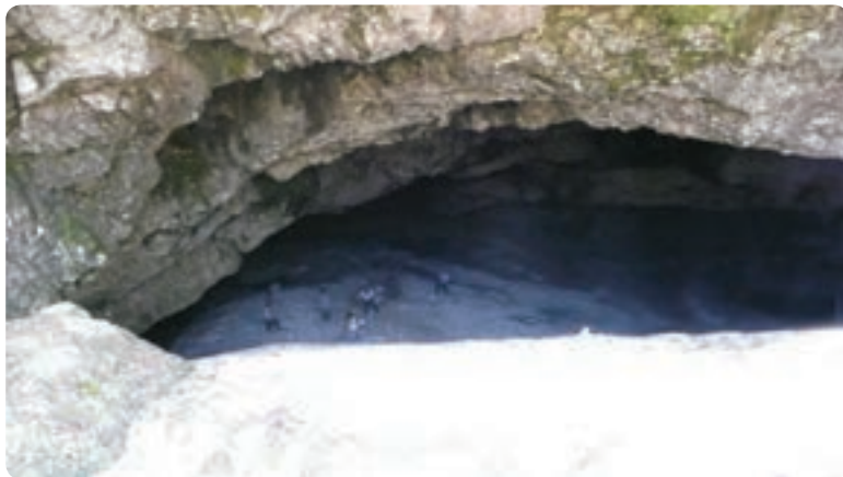
شکل ۵-۵- برفچال در کوه دلفک

پ) رودها: بستر رودهای گیلان عموماً در مسیر دره‌های کوهستانی که از جنگل‌های سرسبز و انبوه پوشیده شده‌اند، قرار دارد. این رودها از نظر ماهیگیری و صید قزل‌آلا اهمیت داشته، به دلیل جریان تند خود برای قایقرانی قابلیت دارند. ت) کوهستان‌ها و نواحی ییلاقی: نواحی ییلاقی گیلان به دلیل تلفیق جنگل، مرتع و رودهای جاری در آن از ییلاق‌های سایر قسمت‌های کشور ما متمایزند و علاوه بر آب و هوای مطبوع دارای چشمه‌های آب معدنی و قابل دسترسی هستند.