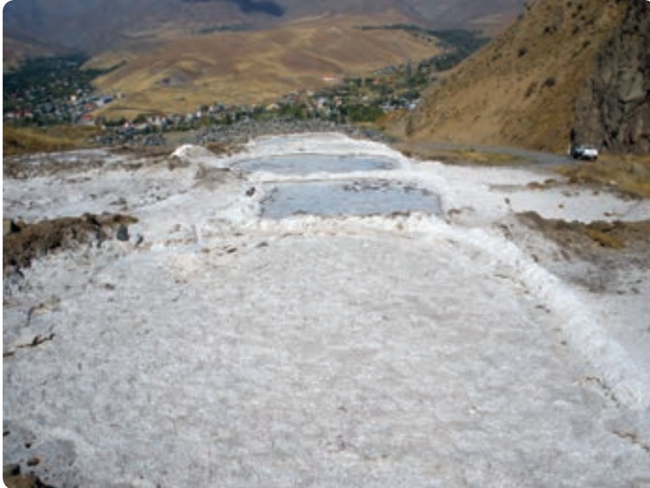
شکل ۱۱-۱۳- معدن نمک در طالقان

معادن : استان البرز وسعت چندان زیادی ندارد اما ۱۱۱ معدن دارای پروانه بهره‌برداری در شهرستان‌های آن فعال‌اند. وجود ۳۸ معدن غیر فعال و ۳ معدن در حال اکتشاف نیز از دیگر ظرفیت‌های استان است. معادن در حال بهره‌برداری بیشتر سنگ‌های ساختمانی، گچ و معدن زغال سنگ باریت، سنگ‌های تزئینی می‌باشند.