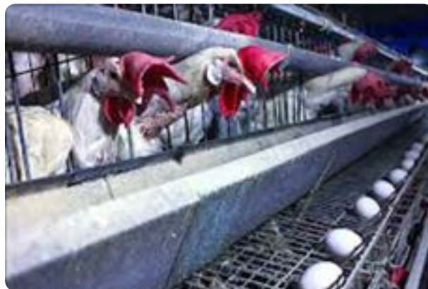
شکل ۵-۱۳- واحدهای مرغداری و گاو‌داری صنعتی

پرورش شتر، اسب، شترمرغ، بلدرچین و ...، از دیگر فعالیت‌های دام و طیور است که در سال‌های اخیر مورد توجه قرار گرفته است.