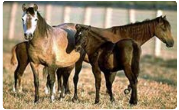
شکل ۶-۱۳- پرورش اسب و شترمرغ

موقعیت کوهستانی همراه با دامنه‌های سرسبز و سودآوری مناسب سبب شده که استان یکی از کانون‌های مهم فعالیت زنبورداری باشد. شهرستان طالقان و ارتفاعات کهار از مراکز اصلی تولید عسل محسوب می‌شوند.