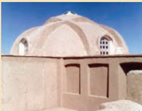
شکل ۱۳-۵- خانه ملاصدرا در کبهک (دوره صفویه)

ث) خانه‌های تاریخی: شامل خانه حضرت امام خمینی (ره)، آیت الله بروجردی، ملا صدرا، حاج علی خان زند، حاج قلی خان و ... است.