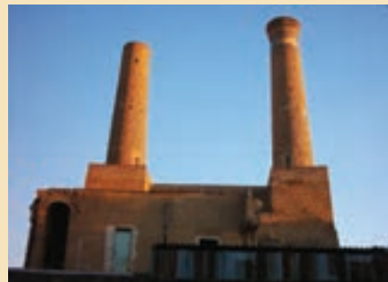
شکل ۱۶-۵- مناره های میدان کهنه