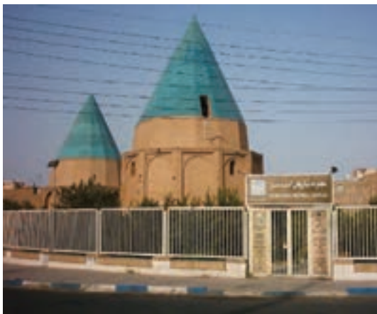
شکل ۵-۵- مقابر گنبد سبز