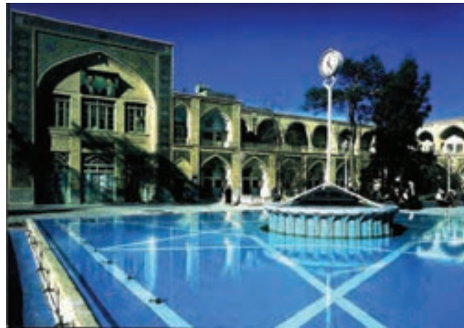
شکل ۳۴-۵- مدرسه فیضیه قم

— مدرسه فیضیه : مدرسه فیضیه یکی از پرآوازه‌ترین حوزه‌های علوم دینی در جهان اسلام است. این مدرسه از نیمه اول قرن سیزدهم هجری جایگزین بنای «مدرسه آستانه» شده و به اعتبار متون معتبر تاریخی از اواسط قرن ششم هجری قمری وجود داشته است. این مدرسه دارای چهار ایوان بوده و در دو طبقه با ۴۰ حجره تحتانی متعلق به عصر قاجار و ۴۰ حجره فوقانی متعلق به قرن چهاردهم هجری قمری است که با هدایت حضرت آیت الله حائری یزدی (ره) بر فراز حجره‌های پیشین در گرداگرد حیاط مرکزی بنا شد. قدیمی‌ترین بخش مدرسه، ایوان جنوبی آن است که مزین به کاشی‌کاری‌های زیبای معرق است. این ایوان طرف قبله و متصل به حرم مطهر است و سر در صحن عتیق حضرت فاطمه معصومه (س) از طرف فیضیه محسوب می‌شود. مدرسه فیضیه در شکل‌گیری و پیروزی انقلاب اسلامی نقش مهمی داشته است.