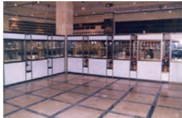
الف- موزه آستانه مقدسه حضرت معصومه (س)