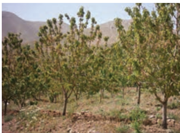
شکل ۲۸-۵- باغ های میوه (گیلاس) در جنوب استان