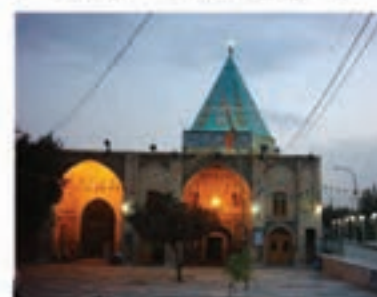
امامزاده علی ابن جعفر