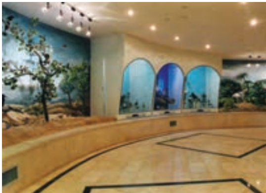
ب- تصویری از موزه طبیعی