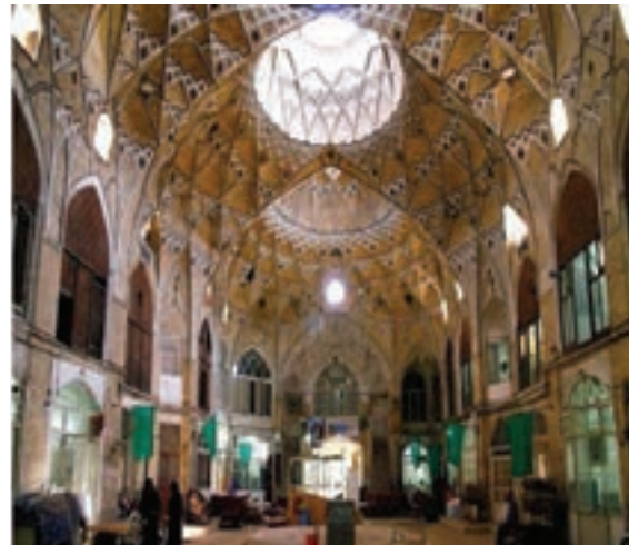
شکل ۳-۵- تیمچه بازار قم

۳- بناهای قدیمی و تاریخی: بناهای تاریخی زیادی در استان وجود دارد که در اینجا با بعضی از آنها آشنا می‌شوید: الف) مجموعه بازار قم: بازار قم با قدمت حدود ۴۰۰ سال در مرکز شهر واقع شده و شامل دو راسته بازار نو و کهنه با پوشش گنبدی و سرپوشیده است. یکی از بناهای باشکوه در بازار قم، تیمچه بازار است. این تیمچه در سمت شمال راسته بازار نو، قرار دارد. این بنا از نظر وسعت، هنر معماری و تزیینات از جمله بناهای منحصر به فرد به‌شمار می‌رود که در دوره قاجاریه ساخته شده است.