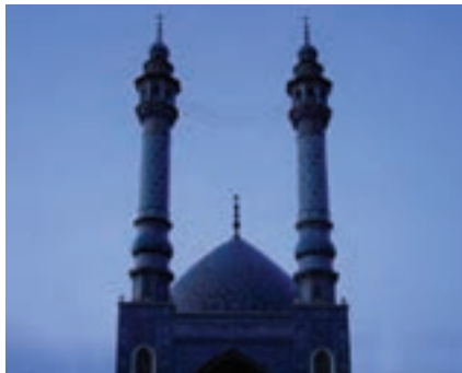
شکل ۶-۵- مسجد اعظم

در استان قم مساجد بزرگی وجود دارد که مهم‌ترین آنها عبارت است از: