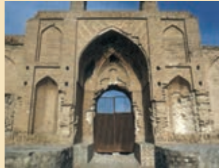
شکل ۱۴-۵- کاروان سرای محمدآباد کاج