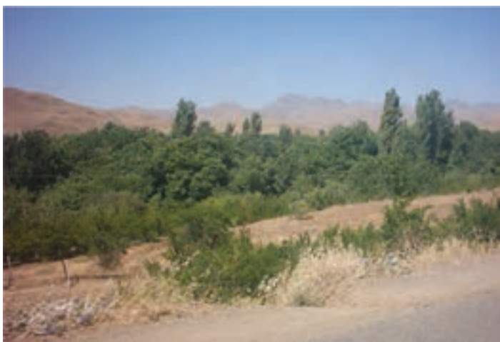
شکل ۲۷-۵- منطقه بیلاقی خلیجستان