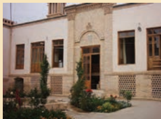
شکل ۱۲-۵- منزل حضرت امام خمینی (ره)

ج) قلعه‌ها: مانند قلعه قمروند، قلعه مظفرآباد و قلعه ملک آباد ج) کاروان‌سراها: مانند کاروان‌سرای حوض سلطان، دیر گچین، پل دلاک و پاسنگان ح) پل‌ها: مانند پل دلاک، حوض سلطان و طینوج خ) آب‌انبارها: مانند آب‌انبار چهل اختران، صدرآباد، لب‌چال، راهجرد و کوه سفید د) میل‌ها: مانند میل صفر علی و میل بابک ذ) آتشکده‌ها و تپه‌های تاریخی: مانند آتشکده نویس در منطقه خلجستان و تپه تاریخی صرم، قلی‌درویش و قره تپه قمروند که در درس دهم با آنها آشنا شدید. ر) آثار دیگر: مانند مناره‌های میدان کهنه که قبلاً سر در مدرسه علمیة غیاثیه بوده است و تک منار میدان کهنه که در خیابان آیت الله طالقانی (آذر) قرار دارد.