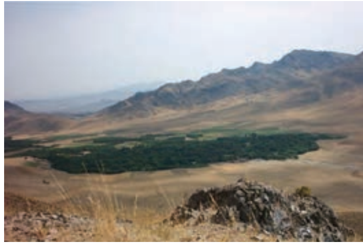
شکل ۲۵-۵- منطقه زیبای درباغ در بخش کهک

۴- منطقه ییلاقی خلیجستان: این منطقه با داشتن آب و هوای معتدل و وجود روستاهای بسیار زیبا مانند قاهان و ونان یکی از مناطق زیبای ییلاقی استان قم است. وجود باغ‌های زیبا، کوه‌های مرتفع و قرار گرفتن در مسیر راه قم به ساوه و قم به تفرش سبب شده تا گردشگران بسیاری از این منطقه دیدن کنند.