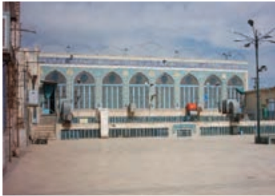
شکل ۸-۵- مسجد امام حسن عسکری (ع)