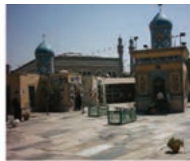
مقبره میرزای قمی و ذکریا ابن آدم