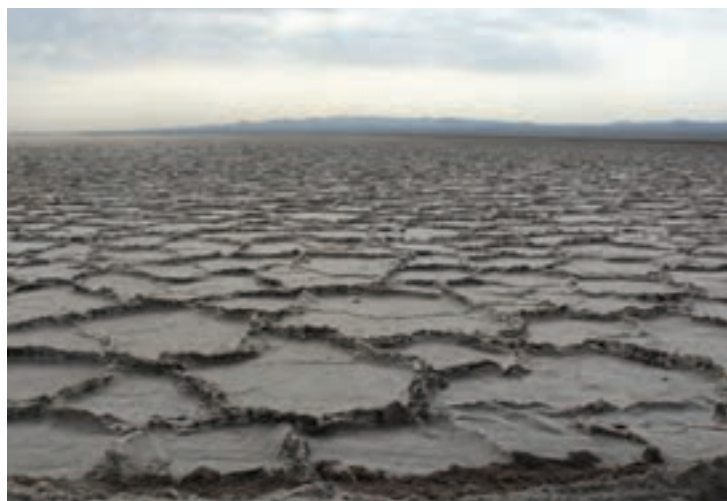
شکل ۲۳-۵- چشم اندازی از دریاچه حوض سلطان

۲- دریاچه حوض سلطان : شامل دو چاله جدا از هم به نام حوض سلطان و حوض مژه است. دریاچه حوض سلطان با طبیعت زیبای خود، مناظر بدیعی را برای بازدیدکنندگان خلق می‌کند. علفزارهای اطراف دریاچه حوض سلطان در گذشته شکارگاه مخصوص سلاطین و حاکمان بوده است.