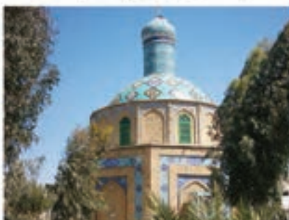
امامزاده احمد بن قاسم