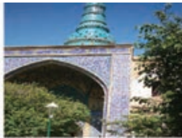
امامزاده شاه حمزه