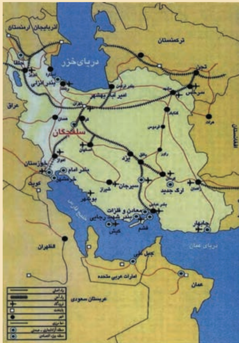
شکل ۳۲-۵- نقشه موقعیت جغرافیایی منطقه ویژه اقتصادی سلفچگان در ایران و منطقه

به شکل ۳۲-۵ توجه کنید. منطقه ویژه اقتصادی سلفچگان در محدوده‌ای به وسعت ۲۰۰۰ هکتار در ۳۰ کیلومتری شهر قم و در چهارراه جاده‌های ترانزیت، در مرکز ایران واقع شده است. این منطقه به‌عنوان مهم‌ترین و نزدیک‌ترین منطقه ویژه اقتصادی به مرکز سیاسی - اقتصادی کشور، واقع در مسیر راه‌آهن سراسری و بزرگراه‌های