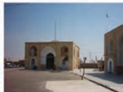
پنج امامزاده جمکران