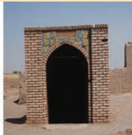
شکل ۱۹-۵- آب انبار در نزدیک امامزاده سکینه خاتون