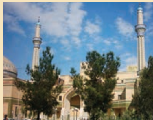
شکل ۱۰-۵- مدرسه علمیه امام خمینی (ره)

ت) مدرسه‌های علوم دینی: شهر قم از دیرباز محلّ تدریس علوم دینی و پایگاه فقاہت شیعه بوده است؛ از این رو مدارس فراوانی برای آموزش علوم دینی به طلاب در قم وجود دارد که مهم‌ترین آنها مدرسه فیضیه، دارالشفاء، سبطیه (بیت النور)، رضویه، حجتیه، جهانگیر خان و ... است که در این میان، مدرسه فیضیه از جهت تاریخی و انقلابی از اهمیت بیشتری برخوردار است.