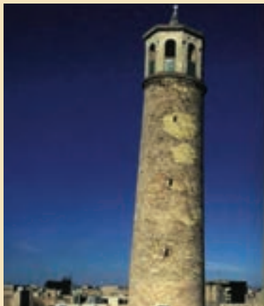
شکل ۲۰-۵- مناره میدان کهنه