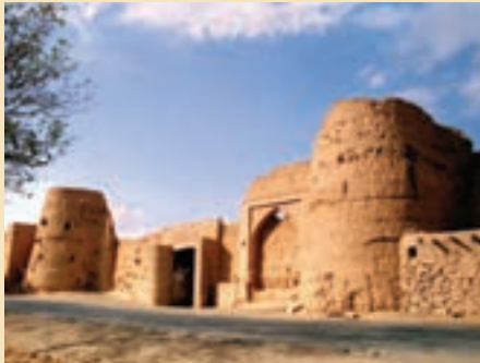
شکل ۱۵-۵- قلعه قمرود