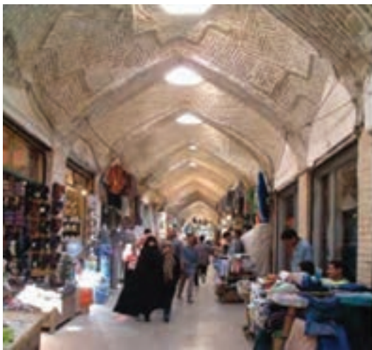
شکل ۴-۵- بازار قم