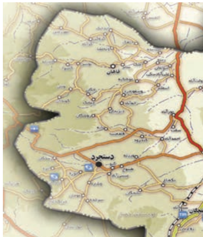
شکل ۲۶-۵- نقشه منطقه ییلاقی خلیجستان

۴- منطقه ییلاقی خلیجستان: این منطقه با داشتن آب و هوای معتدل و وجود روستاهای بسیار زیبا مانند قاهان و ونان یکی از مناطق زیبای ییلاقی استان قم است. وجود باغ‌های زیبا، کوه‌های مرتفع و قرار گرفتن در مسیر راه قم به ساوه و قم به تفرش سبب شده تا گردشگران بسیاری از این منطقه دیدن کنند.