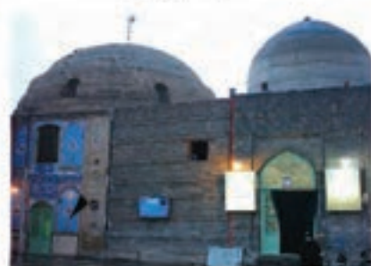
امامزاده موسی مبرقع و چهل اختران