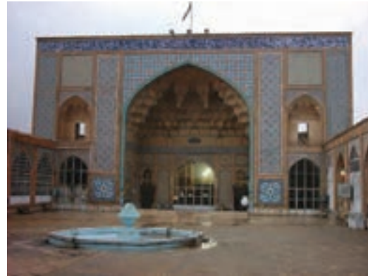
شکل ۷-۵- مسجد جامع شهر قم