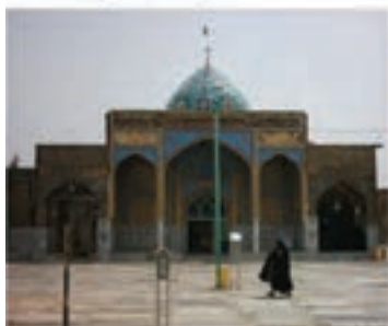
امامزاده سید علی