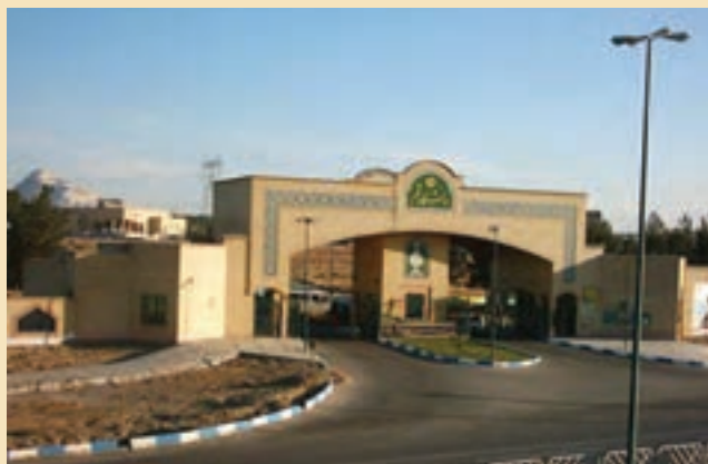
شکل ۳۵-۵- دانشگاه قم

پ) کتابخانه ها: در حال حاضر، در شهر قم کتابخانه های بزرگ و مهمی مانند کتابخانه آیت الله مرعشی نجفی، کتابخانه دفتر تبلیغات اسلامی حوزه علمیه قم، کتابخانه مدرسه فیضیه، کتابخانه مسجد اعظم، وجود دارد که در این میان، کتابخانه آیت الله مرعشی نجفی (ره) دارای اهمیت جهانی است.