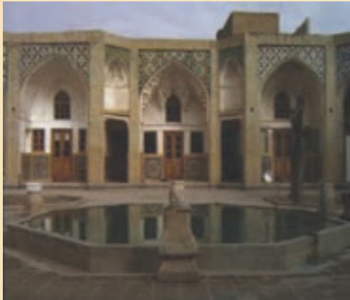
شکل ۱۱-۵- مدرسه علمیة جهانگیر خان

ث) خانه‌های تاریخی: شامل خانه حضرت امام خمینی (ره)، آیت الله بروجردی، ملا صدرا، حاج علی خان زند، حاج قلی خان و ... است.