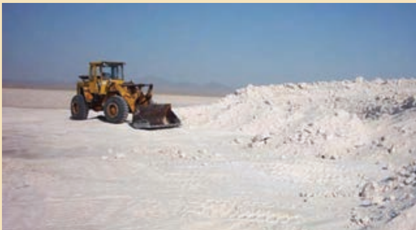
شکل ۳-۵- استخراج نمک از دریاچه حوض سلطان

معادن دریاچه نمک قم و حوض سلطان: دریاچه نمک قم به عنوان منبع عظیم و سرشار انواع املاح معدنی طی سالیان اخیر مورد توجه و مطالعه قرار گرفته است. نتایج طرح مطالعه، بیانگر وجود ۲۰ میلیون تن منیزیم در دریاچه است که کاربردی مؤثر در صنایع نسوز دارد. علاوه بر منیزیم از شورابه‌ها حدود ۱۲ کانی می‌توان به دست آورد، که کاربردهای متنوعی در صنایع گوناگون نظیر کودهای شیمیایی، کاغذ، عایق کاری لوله، ضد یخ و ... دارند. در دریاچه حوض سلطان نیز انواع نمک‌های خوراکی و صنعتی وجود دارد که هم‌اکنون استخراج می‌شود.