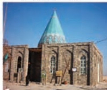
امامزاده طیب و طاهر