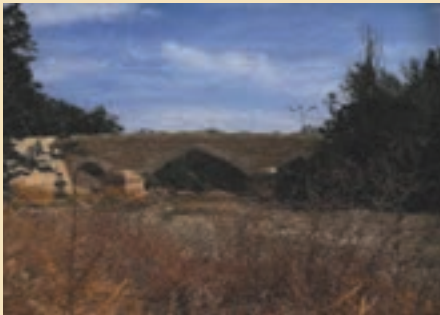
شکل ۱۷-۵- پل تاریخی طبنوج