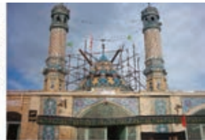
امامزاده معصومه کهنک