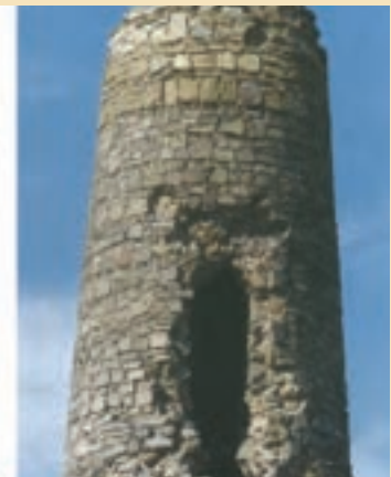
شکل ۱۸-۵- میل علی آباد از آناردوره سلجوقی

۴- موزه آستانه مقدسه: این موزه در سال ۱۳۱۴ افتتاح شد. بخش اعظم نفیس موزه شامل قرآن‌های نفیس خطی، کاشی‌های محراب و مرقد، تابلوهای نقاشی و مینیاتور، ظروف شیشه‌ای و سفالی، انواع هنر خاتم و سکه‌های ضرب شده دوران اسلامی است.