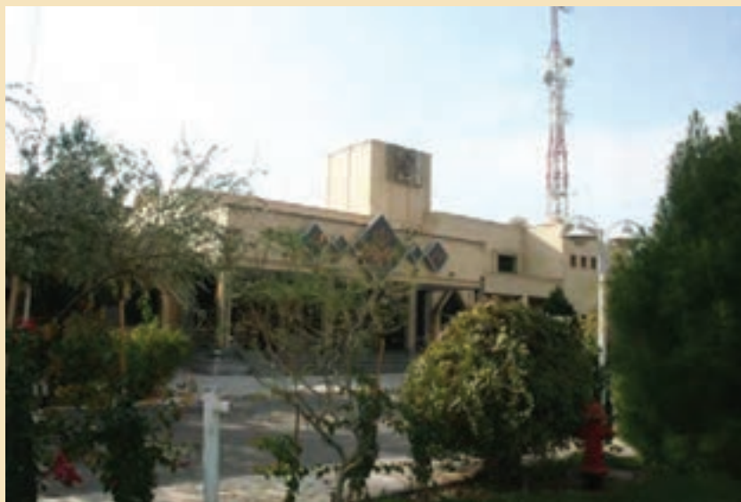
شکل ۳۷-۵- صدا و سیمای مرکز قم

ث) صدا و سیما : شهر مقدس قم به سبب آنکه مرکز معنوی جهان تشیع و خاستگاه انقلاب اسلامی ایران محسوب می‌شود و نیز به برکت بارگاه ملکوتی کریمه اهل بیت (س) و مسجد مقدس جمکران از جایگاه ممتاز معنوی و فرهنگی برخوردار است. از این رو صدا و سیمای مرکز قم باید در شأن این شهر مقدس باشد. نقش صدا و سیمای مرکز قم به مراتب فراتر از یک شبکه استانی است. در مرکز قم علاوه بر برنامه‌سازی برای بیش از یک میلیون و چهل هزار نفر جمعیت استان قم از چشمه جوشان اهل بیت (ع) در این شهر به نفع شبکه‌های ملی و فراملی استفاده کرده و برنامه‌های مورد نیاز صدا و سیما را در حوزه معارف دینی تولید می‌کند. این ویژگی صدا و سیمای مرکز قم، ویژگی منحصر به فردی است و هیچ‌یک از مراکز صدا و سیما این شرایط خاص را ندارد. رادیو سراسری معارف از این استان پخش می‌شود.