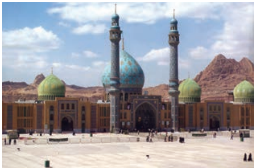
شکل ۹-۵- مسجد مقدس جمکران