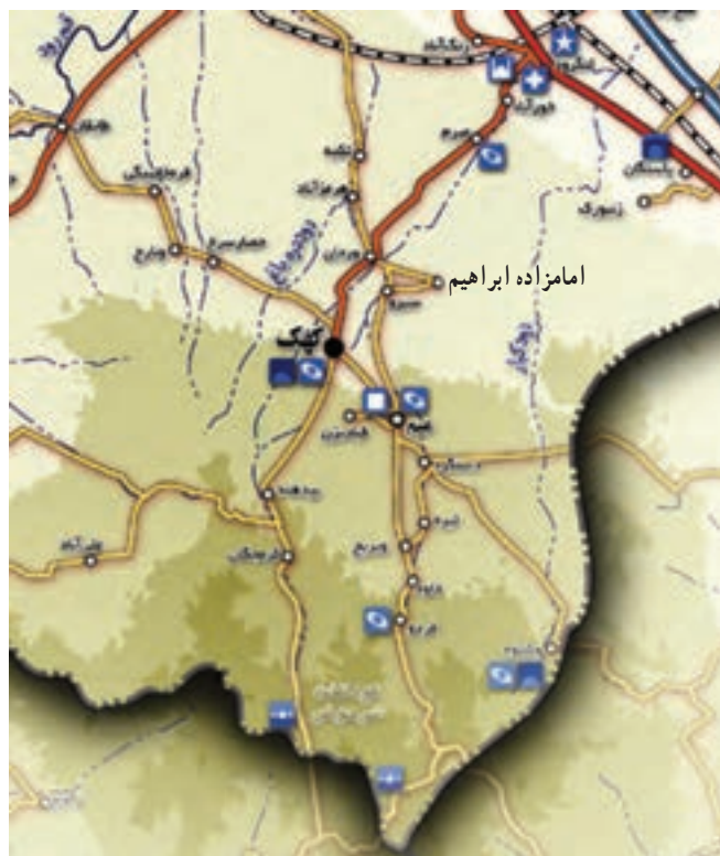
شکل ۲۴-۵- نقشه منطقه بیلاقی کهک

۳- منطقه بیلاقی کهک : شهر کهک با روستاهای اطراف آن، مانند فردو، وشنوه و کرمجگان و خاوه، یکی از مناطق زیبای بیلاقی استان قم محسوب می‌شود. وجود باغ‌های زیبا، آب و هوای معتدل و وجود چشم اندازهای بسیار زیبا سبب جذب گردشگران داخلی و خارجی به این منطقه زیبا می‌شود.