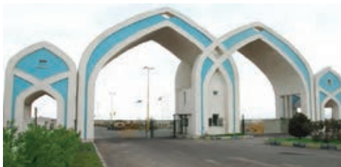
شکل ۳۳-۵- منطقه ویژه اقتصادی سلفچگان قم