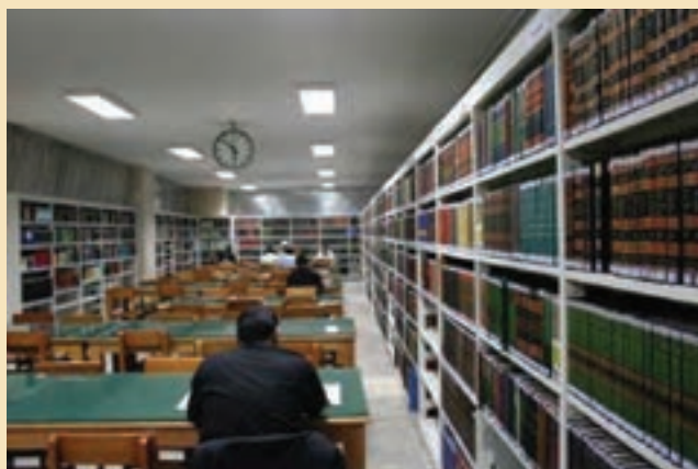
شکل ۳۶-۵- کتابخانه آیت الله مرعشی نجفی

کتابخانه آیت الله مرعشی نجفی: این کتابخانه، یکی از غنی ترین کتابخانه های جهان تشیع است که با همت آیت الله مرعشی نجفی (ره) تأسیس شد. این کتابخانه دارای گنجینه ای با ارزش از نسخه های خطی نفیس بالغ بر ۶۵۰۰۰ عنوان است که بسیاری از آنها در جهان همتا ندارند و غالباً توسط دانشمندان مسلمان در سده های سوم و چهارم (بیش از هزار سال پیش) به زبان های مختلف نوشته شده اند و هم چنین، نزدیک به یک میلیون جلد کتاب های چاپی دارد. این کتابخانه نخستین کتابخانه کشور از نظر نسخه های خطی و سومین کتابخانه جهان اسلام به شمار می رود.