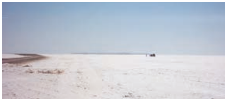
شکل ۲۲-۵- منظره‌ای از دریاچه نمک (در انتهای عکس کوه سرگردان مشاهده می‌شود).

۱- دریاچه نمک : این دریاچه بین سه استان قم، اصفهان و سمنان قرار گرفته است. در سطح این دریاچه، نمک‌های پف کرده شکل‌های هندسی زیبایی را به وجود آورده که به «پلی‌گون» معروف است و هنگام طلوع و غروب خورشید مناظر دیدنی و زیبایی را به وجود می‌آورد. هم‌چنین، هنگام وزش باد توده‌های بزرگ ماسه، مانند امواج دریا به حرکت در می‌آیند و تپه‌های موقتی تشکیل می‌دهند. ارتفاع برخی از این تپه‌ها به ۴۰ متر و طول برخی از آنها به چند کیلومتر می‌رسد. دریاچه نمک می‌تواند مقصد بسیاری از گردشگران طبیعت باشد.