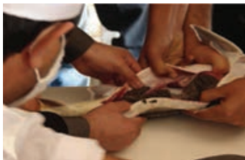
شکل ۲۹-۵- تولید ماهی خاویار در استان