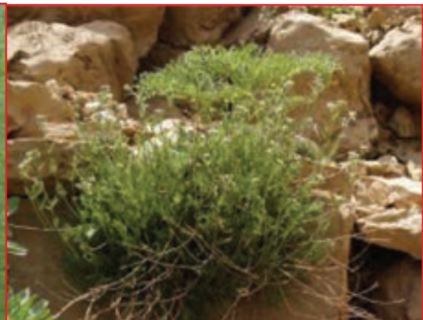
درمنه (آویشن مه)

شکل ۱۸-۵- چند نمونه از گیاهان دارویی و صنعتی استان