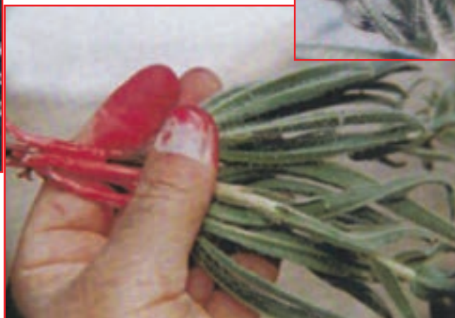
شکل ۱۷-۵- چند نمونه از گیاهان دارویی و صنعتی استان