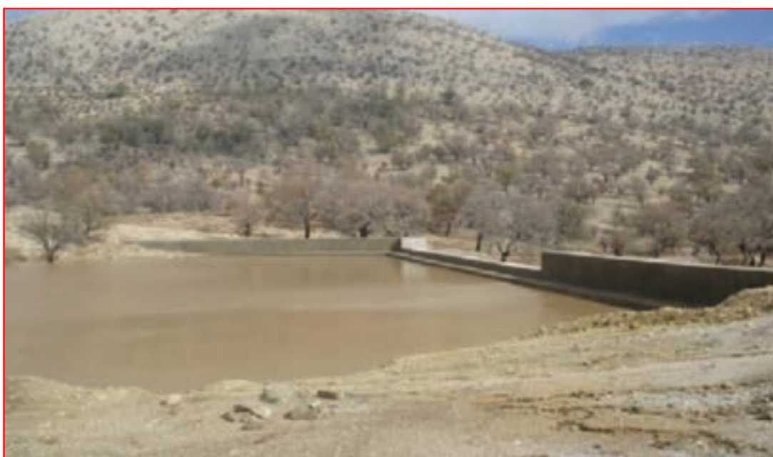
شکل ۱۶-۵- توانمندی‌های حوزه آبخیزداری استان در مهار آب