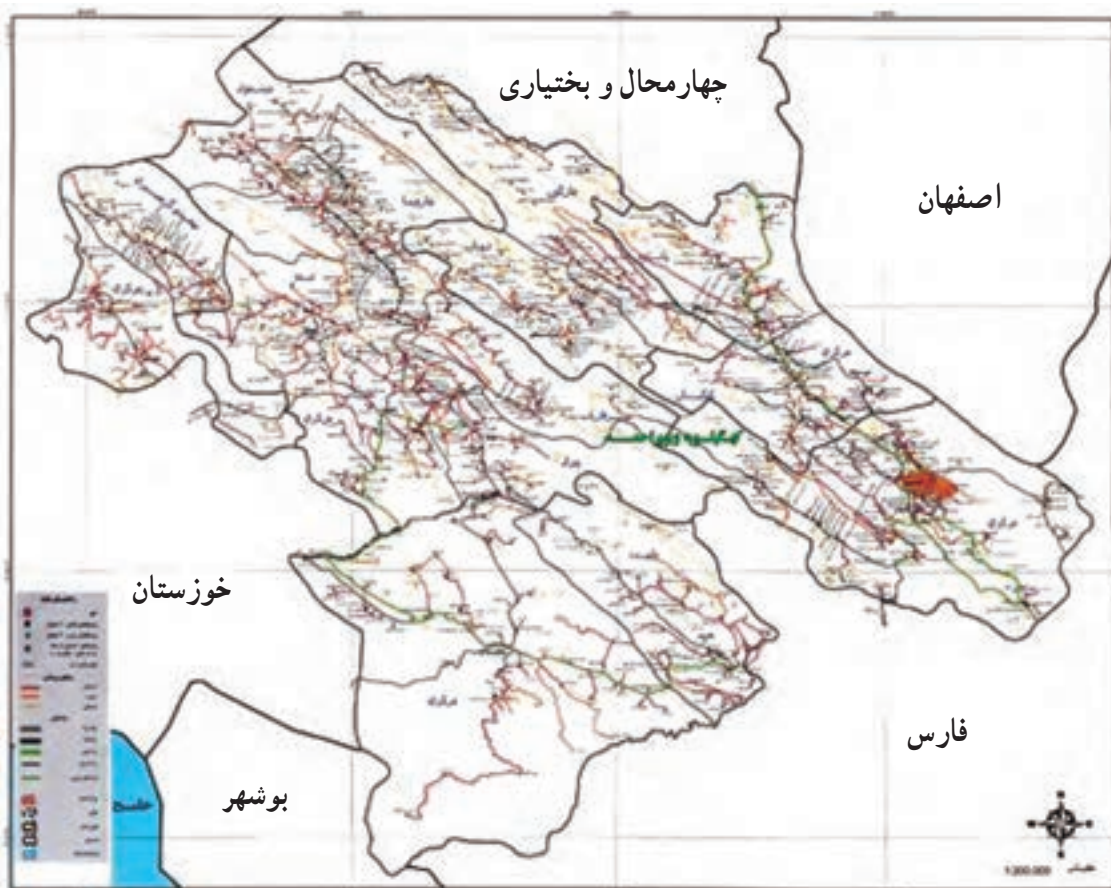
شکل ۲۱-۵- نقشه راه‌های استان