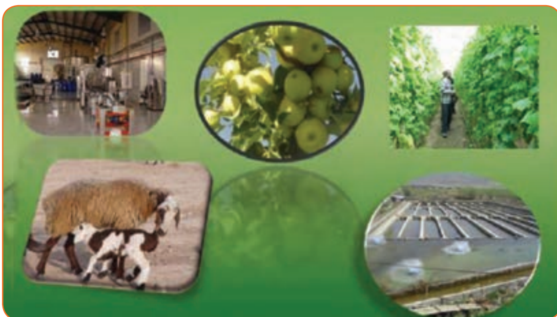
شکل ۱۵-۵. بخشی از توانمندی های اقتصادی استان

بخش کشاورزی در استان می تواند در تولید اشتغال و امنیت غذایی کشور نقش مهمی داشته باشد. استان کهگیلویه و بویراحمد در سال زراعی ۸۸-۱۳۸۷ حدود ۲۶۲۰۰۰ هکتار اراضی زراعی آبی و دیمی را به خود اختصاص داده است و سطح زیر کشت گندم آبی و دیم به ترتیب به ۲۵۱۱۰ و ۸۰۰۰ هکتار رسیده است. از نظر تولید حبوبات با ۵۹۶۲ تن دارای رتبه ۱۱ و از نظر تولید محصولات باغی این استان در زمینه تولید گردو در کشور رتبه دوم و از نظر تولید سیب درختی در رتبه نهم قرار دارد. این استان در تولید جو رتبه هشتم کشور را داراست.