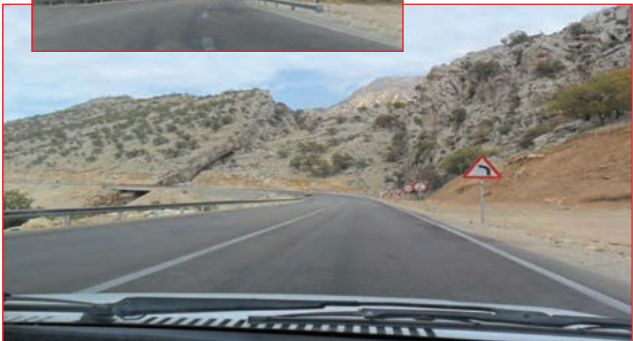
شکل ۲۰-۵- راه‌های ارتباطی استان