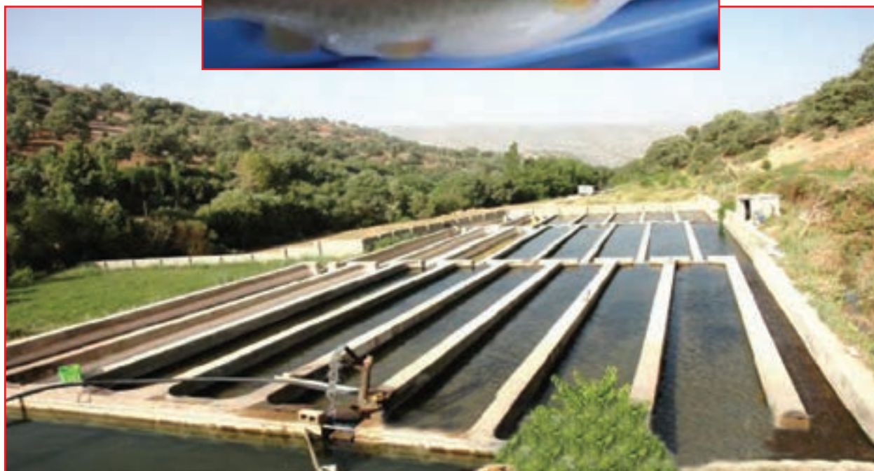
شکل ۱۹-۵- مزرعه پرورش ماهی قزل‌آلا