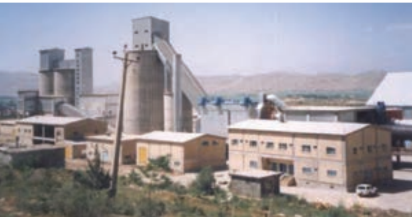
شکل ۲۲- ۵