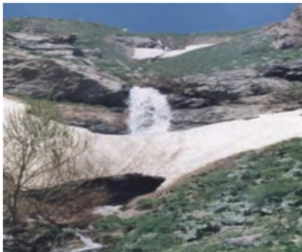
شکل ۸-۵- چشم انداز طبیعی جل چه مه