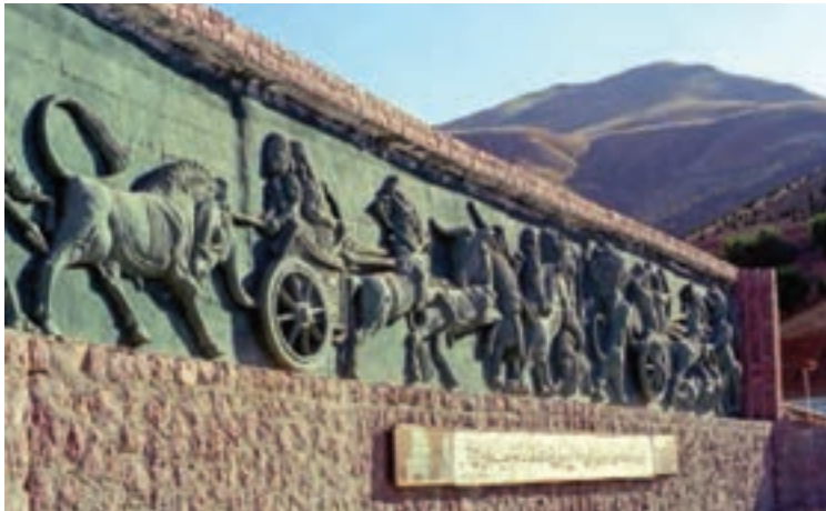
شکل ۱۳-۵- نقش برجسته زیویه در بوستان آبیدر