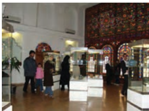
شکل ۱۷-۵. گنجینه (موزه سنندج)

● قلعه باستانی قم چقای : این دژ باستانی در ۴۵ کیلومتری بیجار و در ۱۲ کیلومتری روستای قم چقای قرار گرفته است. موقعیت طبیعی آن باعث شده که این قلعه از اهمیت خاصی برخوردار باشد؛ زیرا از یک سو به پرتگاهی بسیار هولناک و از سوی دیگر به دره‌ای عمیق مشرف است که رودخانه‌ای در خط‌القدر آن جاری است. در سمت شمالی آن که از ارتفاع کمتری برخوردار است، بقایای دیواری عریض و محکم از سنگ لاشه با ملات و برج‌های نیم استوانه‌ای قرار دارد. معماری باشکوه قلعه در کنار دره عمیق موجب شگفتی هر بازدیدکننده‌ای می‌شود.