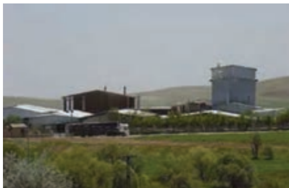
شکل ۳۴-۵- کارخانجات کاشی کسری