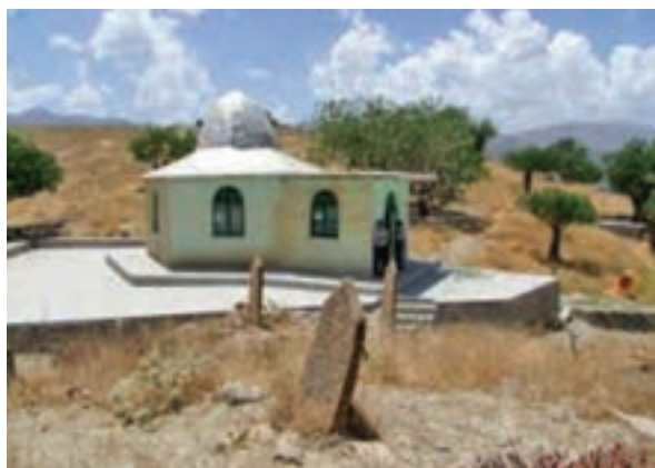
شکل ۲۴-۵- مقبره حضرت عکاشه