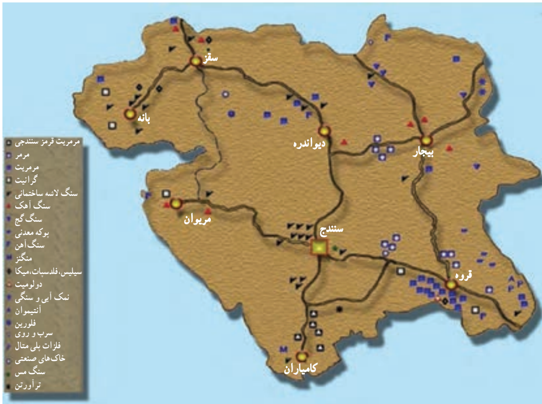
شکل ۳۵-۵ نقشه پراکنندگی معادن مهم استان

استان کردستان با ۱۹۹ معدن فعال، ذخیره قطعی ۳۸۶ میلیون تن و استخراج سالیانه ۴/۵ میلیون تن مواد معدنی یکی از قطب های معدنی کشور محسوب می شود. این استان از نظر تنوع و میزان کانسارهای معدنی بسیار غنی است؛ به طوری که ذخیره و منابع معدنی شناسایی شده و در حال بهره برداری استان، بسیار فراوان است و موارد مهم آن عبارتند از: سنگ آهن، طلا، سیلیس، فلدسپات، خاک صنعتی، میکا، انواع سنگ های تزئینی، سنگ آهک، نمک، پوکه معدنی، سنگ گچ و ... .