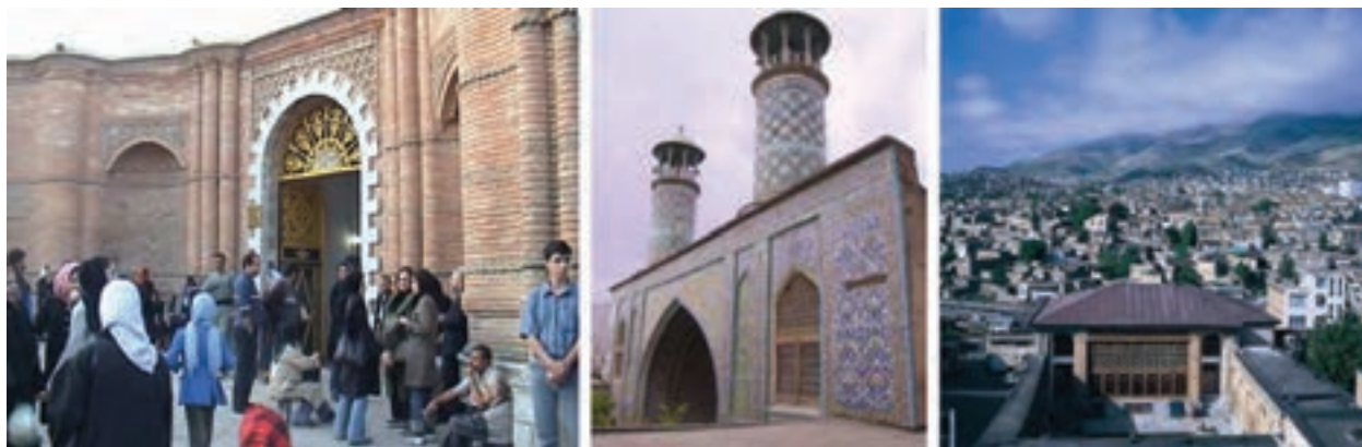
شکل ۱۰-۵- بخشی از آثار و جاذبه های تاریخی و فرهنگی - مذهبی استان

* آیا می دانید که استان کردستان یکی از کانون های فرهنگ و تاریخ کشور ماست و دارای آثار فراوانی در این زمینه است؟