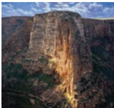
شکل ۱۵-۵. قلعه قم چقای بیجار