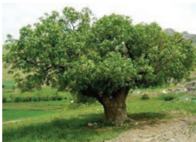
شکل ۲۷-۵- درخت بنه

در استان کردستان گیاهان دارویی و صنعتی و میوه‌های نسبتاً منحصر به فرد (توت‌فرنگی و انگور دیم) تولید می‌شود، به طوری که استان ما بالاترین میزان برداشت توت‌فرنگی در سطح کشور را دارد. گذشته از آن با توجه به برخورداری استان کردستان از شرایط مناسب کشت چغندر قند، دانه‌های روغنی و درختان بنه، هم‌چنین فراوانی بوته‌گون، شیرین بیان و تنوع سایر گیاهان دارویی، می‌توان به ایجاد صنایع تبدیلی مرتبط با این محصولات اقدام کرد.