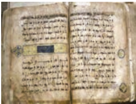
شکل ۲۱-۵- قرآن تاریخی نگل

● روستای نگل و قرآن تاریخی آن: روستای نگل در ۶۵ کیلومتری جاده سنندج - مریوان واقع شده است. بنا به روایت در قرون اولیه اسلامی، چهار جلد قرآن نوشته شده و به چهار منطقه فرستاده شده است که یکی از آنها هم اکنون در مسجد روستای نگل نگهداری می‌شود. این قرآن که به خط کوفی و بر روی پوست آهو نوشته شده است، در میان مردم منطقه جایگاه خاصی دارد و به دلیل برخورداری از ارزش معنوی، هنری و تاریخی، هر ساله مشتاقان زیادی را به سوی خود جذب می‌کند.