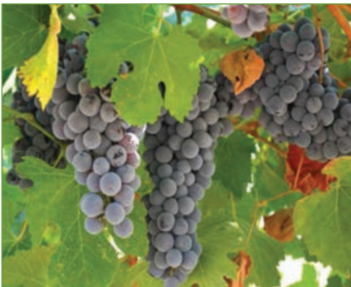
شکل ۲۹-۵- توت فرنگی و انگور دیم از محصولات عمده کشاورزی استان

● دامپروری: دامپروری از فعالیت‌های بسیار کهن در استان کردستان محسوب می‌شود که از دیر باز بسیاری از ساکنان روستاها و حتی شهرها بدان مشغول بوده‌اند. با توجه به وجود ۱۷۲۰۰۰۰ هکتار جنگل و مرتع در استان کردستان، این استان یکی از مناطق عمده دامپروری کشور است. استان ما دارای ۳/۵ میلیون واحد دامی، معادل ۴/۹ درصد دام‌های کشور است. در این استان،