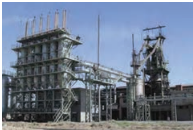
شکل ۳۳-۵- شرکت فولاد زاگرس