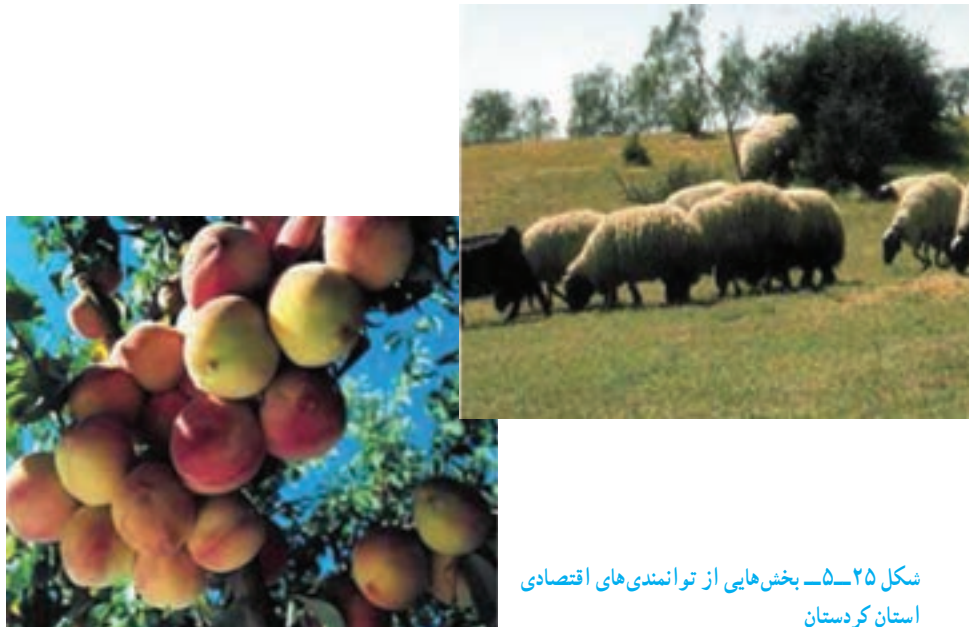
شکل ۲۵-۵. بخش‌هایی از توانمندی‌های اقتصادی استان کردستان

* به شکل‌های زیر نگاه کنید و بگویید که مهم‌ترین توانمندی‌های اقتصادی استان ما چیست؟