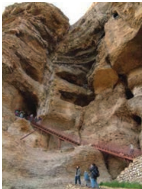
شکل ۱۴-۵- نمای بیرونی و طبقات غار کرفتو

● غار باستانی کرفتو : این غار در ۶۷ کیلومتری شمال غربی دیواندره قرار دارد و یکی از قدیمی ترین و در عین حال شگفت انگیزترین غارهای طبیعی ایران است که در ادوار مختلف مورد استفاده و سکونت انسان بوده و طی این دوره ها جهت سکونت تغییر حالت داده و فضاهایی به صورت معماری صخره ای در چهار طبقه و در دل کوه حفر شده است.