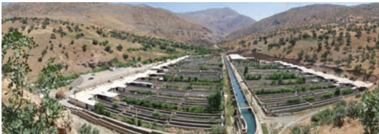
شکل ۳۱-۵- مجتمع پرورش ماهی سردآبی پالنگان