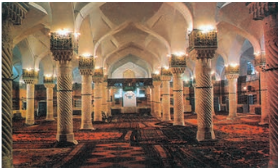
شکل ۲۲-۵- شبستان مسجد جامع سنندج