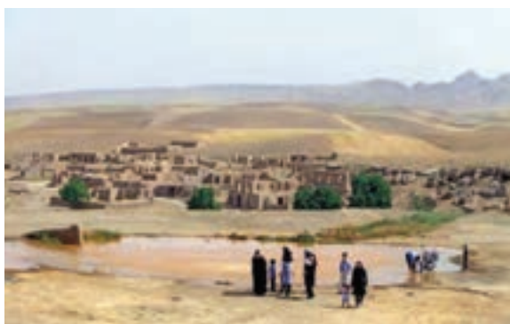
شکل ۶-۵- چشمه آب معدنی باباگرگر و بقعه امامزاده سیدجلال الدین در جوار آن