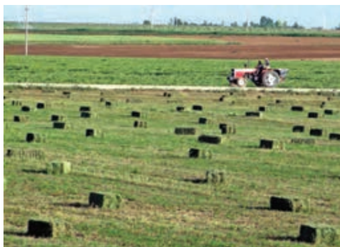
شکل ۳۰-۵- تولید علوفه یکی از توان‌های بخش کشاورزی استان

فرآورده‌های دامی استان: فرآورده‌های دامی مانند: گوشت قرمز، شیر، پنیر، و محصولات فرعی نظیر چرم و پوست، موهر و کُرک از جمله محصولات مهم استان به شمار می‌روند. کُرک بز مرکز کردستان بسیار مرغوب است و در تولید انواع لباس و صنایع دیگر از آن استفاده می‌شود. بز مرکز که خاستگاه آن استان کردستان است، شهرت جهانی دارد. یکی دیگر از دام‌های اصیل استان کردستان، اسب کُردی است.