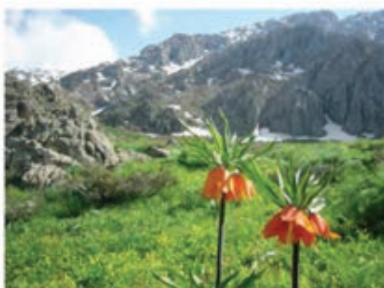
شکل ۳-۵- برخی از جاذبه‌های طبیعی استان

استان کردستان از جاذبه‌های طبیعی فراوانی برخوردار است که هر کدام به تناسب فصول مختلف سال جلوه‌های زیبای خود را در مقابل دیدگان گردشگران می‌کشایند. هریک از شهرستان‌ها و مناطق استان از چند جاذبه طبیعی زیبا مانند آبشار، سراب، غار و ... برخوردار است که در این جا به برخی از مهم‌ترین آن‌ها اشاره می‌شود.