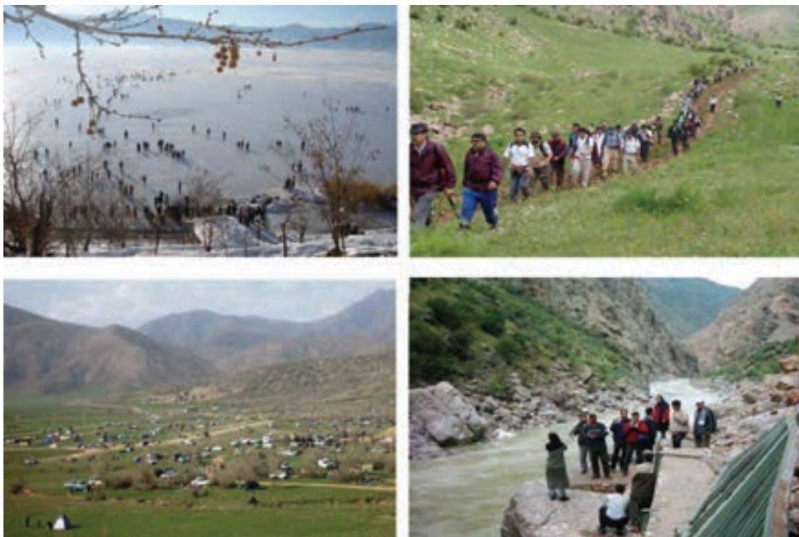
شکل ۱-۵- برخی از چشم‌اندازهای گردشگری استان کردستان

* به عکس‌های زیر نگاه کنید و بگویید چرا استان ما جزو استان‌های برتر در زمینه طبیعت گردی است؟