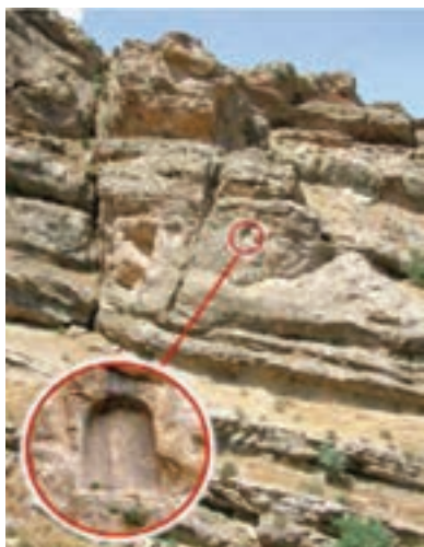
شکل ۱۶-۵. کتیبه (زینانه) تنگی ور (شهرستان کامیاران)