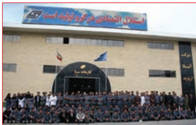
شکل ۳۸-۵- شرکت تولید تجهیزات پزشکی آتیلا ارتوپد

● شرکت تولیدی آتیلا ارتوپد: مجتمع صنایع تولید تجهیزات پزشکی شرکت آتیلا ارتوپد واقع در شهرک صنعتی شماره ۳ سنندج با برخورداری از دانش روز و به‌کارگیری فن‌آوری بسیار پیشرفته، برای اولین بار در کشور، لوازم جراحی تخصصی و فوق تخصصی ارتوپدی و ستون فقرات را تولید می‌کند. محصولات این شرکت که مطابق با بالاترین استانداردهای بین‌المللی توسط جوانان تحصیل کرده و متخصص استان تولید می‌شود در درمان ده‌ها هزار بیمار کشورمان از جمله بیماران مبتلا به بیماری‌های صعب‌العلاج با نتایج بسیار مطلوب مورد استفاده قرار می‌گیرد. این مجتمع تولیدی منحصر به فرد در کشور، حاصل بهره‌برداری از سه طرح از طرح‌های نه‌گانه شرکت آتیلا ارتوپد در استان کردستان است. هم‌اکنون طرح چهارم شرکت جهت تولید مفصل مصنوعی لگن در شهرک صنعتی شماره یک سنندج در حال احداث است. بدین ترتیب با راه‌اندازی طرح‌های شرکت آتیلا ارتوپد، استان کردستان در راستای اهداف و راهبردهای توسعه در بخش صنعت و معدن به قطب صنایع و تجهیزات پزشکی کشور با اشتغال‌زایی قابل توجه‌ای تبدیل خواهد شد.