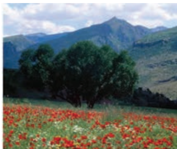
شکل ۷-۵- چشم اندازهای طبیعی و فرهنگی هه‌ورامان