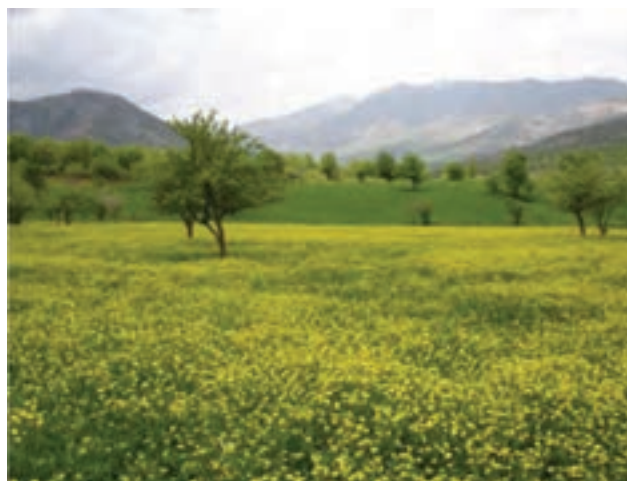
شکل ۹-۵- نمایی از طبیعت شهرستان بانه