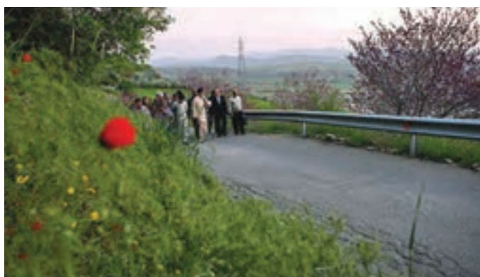
شکل ۵-۵- بازدید رهبر معظم انقلاب اسلامی از پارک کوهستانی آبیدر سنندج

● دریاچه زریبار : این دریاچه که مهم‌ترین جاذبه طبیعی گردشگری استان کردستان است، در غرب شهر مریوان واقع شده و شرق و غرب آن را دو رشته کوه پوشیده از جنگل‌های بلوط در بر گرفته است. در شمال و جنوب آن نیز، دشت‌های سرسبز بیلو و مریوان واقع شده‌اند. این دریاچه در هر فصل، چشم‌اندازهای زیبایی به نمایش می‌گذارد و شرایط مناسبی را برای گردش و تفریح در طبیعت پیرامون آن، قایقرانی، ماهی‌گیری، شنا، شکار و ... در اختیار گردشگران قرار می‌دهد. یکی از جالب‌ترین چشم‌انداز گردشگری زریبار، یخبندان سطح دریاچه در فصل زمستان است که امکان تفریح، گشت و گذار و اسکی بر روی آن را برای علاقه‌مندان فراهم می‌آورد.