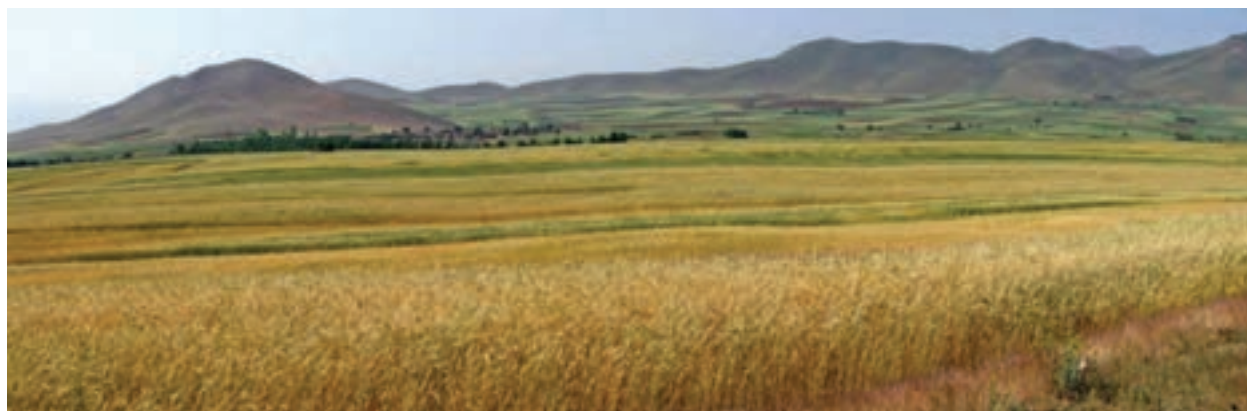
شکل ۲۶-۵- منظره‌ای از مزارع گندم استان

● زراعت و باغداری: حدود ۳۰ درصد از سطح استان (۱۰۴۵۶۸۸ هکتار) به زمین‌های کشاورزی اختصاص دارد که از این مقدار، ۱۴/۶۴ درصد زیر کشت آبی و مابقی آن به صورت دیم کشت می‌شود. استان کردستان از نظر سطح زیر کشت در کشور رتبه هفتم، سطح زیر کشت دیم رتبه اول و از نظر تولید توت فرنگی رتبه اول و تولید گندم رتبه ششم کشور را داراست. میزان تولید محصولات کشاورزی استان در سال ۱۳۸۷ در جدول ۳-۵ درج شده است.