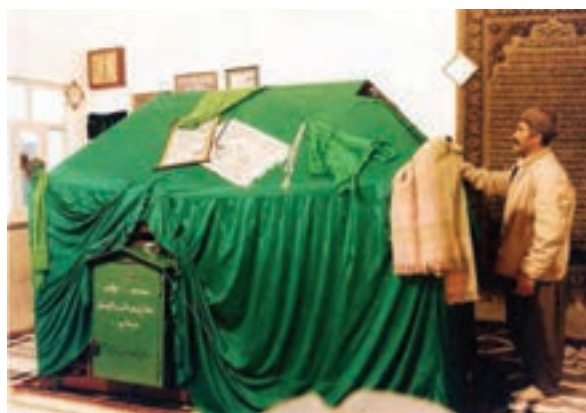
شکل ۲۳-۵- مقبره متبرکه حضرت امامزاده هاجره خاتون