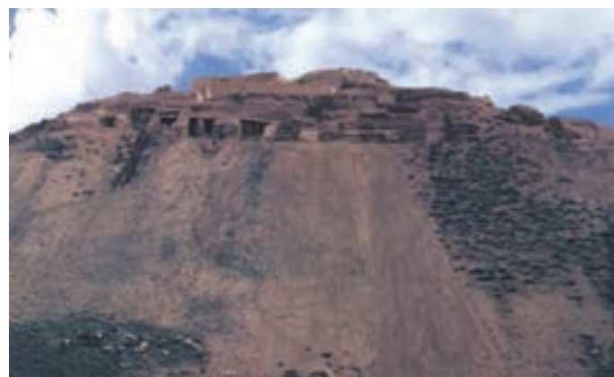
شکل ۱۱-۵- قلعه باستانی زیویه

● قلعه باستانی زیویه : این قلعه در ۴۵ کیلومتری شرق سقز و در شمال روستای زیویه واقع شده است. قلعه زیویه هم از نظر معماری و هم از نظر آثار هنری یکی از شاخص ترین مکان های تاریخ ایران باستان محسوب می شود و مربوط به اقوام مان نایی