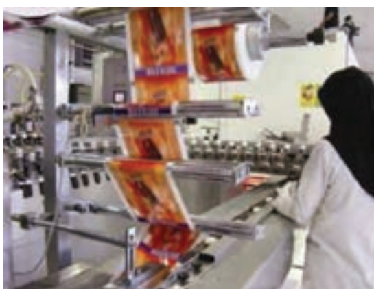
شکل ۳۲-۵- گوشه‌هایی از فعالیت‌های صنعتی در استان