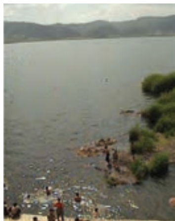
شکل ۴-۵- دریاچه زریبار مریوان

● دریاچه زریبار : این دریاچه که مهم‌ترین جاذبه طبیعی گردشگری استان کردستان است، در غرب شهر مریوان واقع شده و شرق و غرب آن را دو رشته کوه پوشیده از جنگل‌های بلوط در بر گرفته است. در شمال و جنوب آن نیز، دشت‌های سرسبز بیلو و مریوان واقع شده‌اند. این دریاچه در هر فصل، چشم‌اندازهای زیبایی به نمایش می‌گذارد و شرایط مناسبی را برای گردش و تفریح در طبیعت پیرامون آن، قایقرانی، ماهی‌گیری، شنا، شکار و ... در اختیار گردشگران قرار می‌دهد. یکی از جالب‌ترین چشم‌انداز گردشگری زریبار، یخبندان سطح دریاچه در فصل زمستان است که امکان تفریح، گشت و گذار و اسکی بر روی آن را برای علاقه‌مندان فراهم می‌آورد.