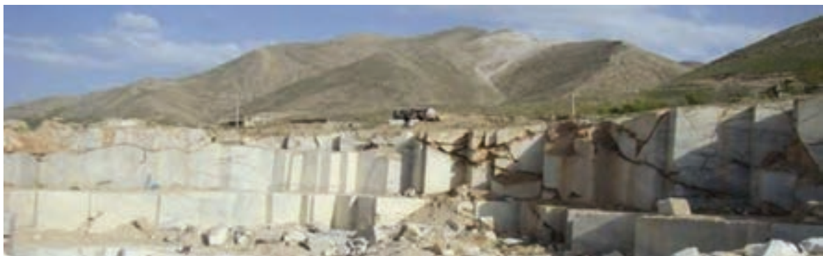
شکل ۳۶-۵ ذخایر معدنی یکی از توانمندی های استان

استان کردستان با ۱۹۹ معدن فعال، ذخیره قطعی ۳۸۶ میلیون تن و استخراج سالیانه ۴/۵ میلیون تن مواد معدنی یکی از قطب های معدنی کشور محسوب می شود. این استان از نظر تنوع و میزان کانسارهای معدنی بسیار غنی است؛ به طوری که ذخیره و منابع معدنی شناسایی شده و در حال بهره برداری استان، بسیار فراوان است و موارد مهم آن عبارتند از: سنگ آهن، طلا، سیلیس، فلدسپات، خاک صنعتی، میکا، انواع سنگ های تزئینی، سنگ آهک، نمک، پوکه معدنی، سنگ گچ و ... .