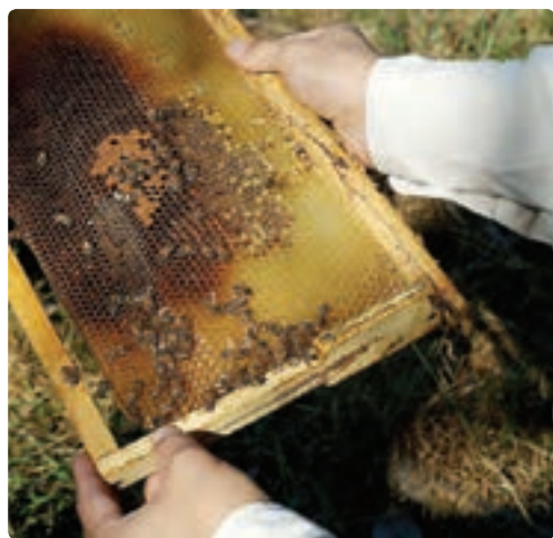
شکل ۱۰-۶- پرورش زنبور عسل

— یکپارچه‌سازی اراضی و مکانیزه کردن کشاورزی: سرانه زمین کشاورزی گیلان ۱/۱۳ هکتار است. وسعت کم زمین‌های کشاورزی و کوچک کردن هریک از قطعه‌ها باعث می‌شود تا سرمایه‌گذاری‌ها و مکانیزه کردن کشاورزی مقرون به صرفه نباشد و بازدهی تولید پایین بیاید.