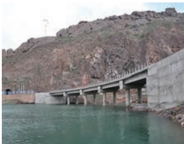
شکل ۱۶-۶- راه آهن قزوین - رشت - آستارا در حال احداث

برای توسعه بازرگانی، رشد صنایع کارخانه‌ای، گردشگری و ... توسعه جاده تهران - قزوین - رشت به آستارا ضروری است. این محور ارتباطی در جابه‌جایی بار و مسافر و ارتباط با کشورهای خارجی و استان اردبیل نقش عمده‌ای دارد.