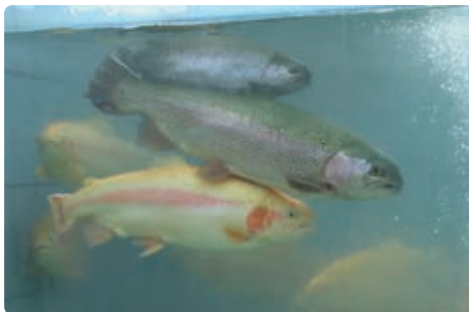
شکل ۲-۶- پرورش ماهی قزل‌آلا

تأمین می‌کند. این استان در بخش مربوط به فعالیت‌های صیادی و آبی‌پروری موقعیت منحصر به فردی دارد که با وجود رودها و آبگیرهای داخلی و دریا، مقدار تولید قابل افزایش است.