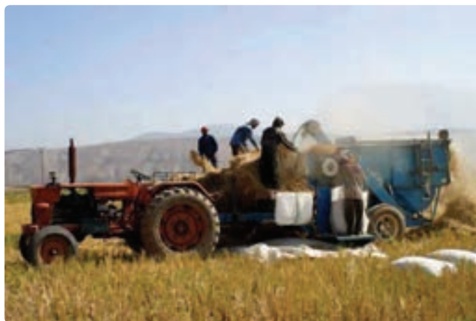
شکل ۱۱-۶- کشاورزی مکانیزه

— توسعه صنایع تبدیلی محصولات کشاورزی : تولید محصولات مختلف کشاورزی مثل زیتون، گیاهان دارویی، چوب، آبریان و ... در استان می‌تواند با توسعه صنایع تبدیلی به افزایش اشتغال، تأمین ارز، تأمین درآمد و سهم آن در افزایش تولید خالص ملی و برآورده کردن نیازهای مصرفی جمعیت کمک کند. — افزایش تولیدات گلخانه‌ای : کشت گلخانه‌ای در استان، زمینه را برای تولید بیش‌تر انواع مختلف محصولات کشاورزی فراهم می‌سازد و علاوه بر سوددهی بالا موجب می‌شود تا از این تولیدات در همه فصول سال استفاده کنیم.