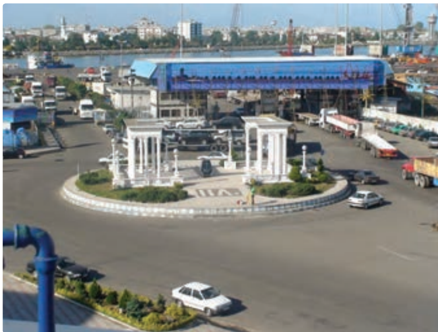
شکل ۴-۶- بندر انزلی - میدان توحید