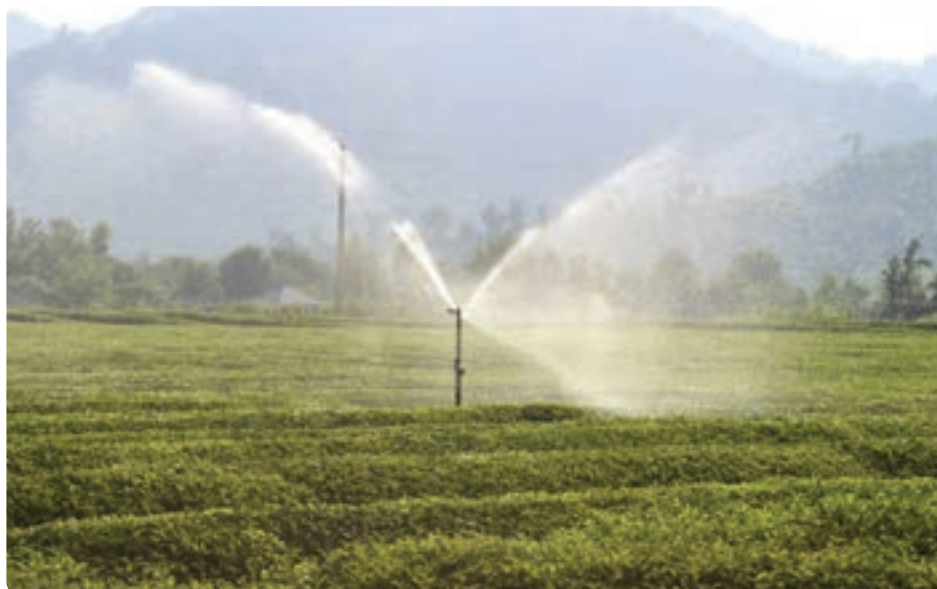
شکل ۱-۶- آبیاری مکانیزه

به دلیل رشد جمعیت و افزایش مصرف مواد غذایی ناشی از آن طی چند دهه گذشته، لازم است جهت افزایش محصولات کشاورزی مخصوصاً در استان‌هایی مانند گیلان برنامه‌ریزی‌هایی انجام شود.