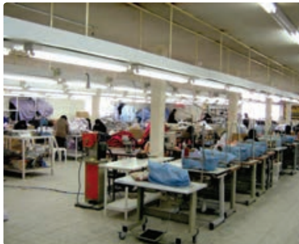
شکل ۱۳-۶- نمونه‌ای از صنایع استان

برای توسعه بازرگانی، رشد صنایع کارخانه‌ای، گردشگری و ... توسعه جاده تهران - قزوین - رشت به آستارا ضروری است. این محور ارتباطی در جابه‌جایی بار و مسافر و ارتباط با کشورهای خارجی و استان اردبیل نقش عمده‌ای دارد.