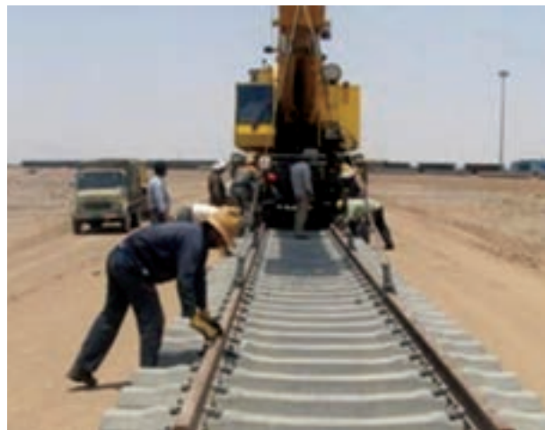
شکل ۱۵-۶- مراحل ساخت راه آهن قزوین - رشت - آستارا