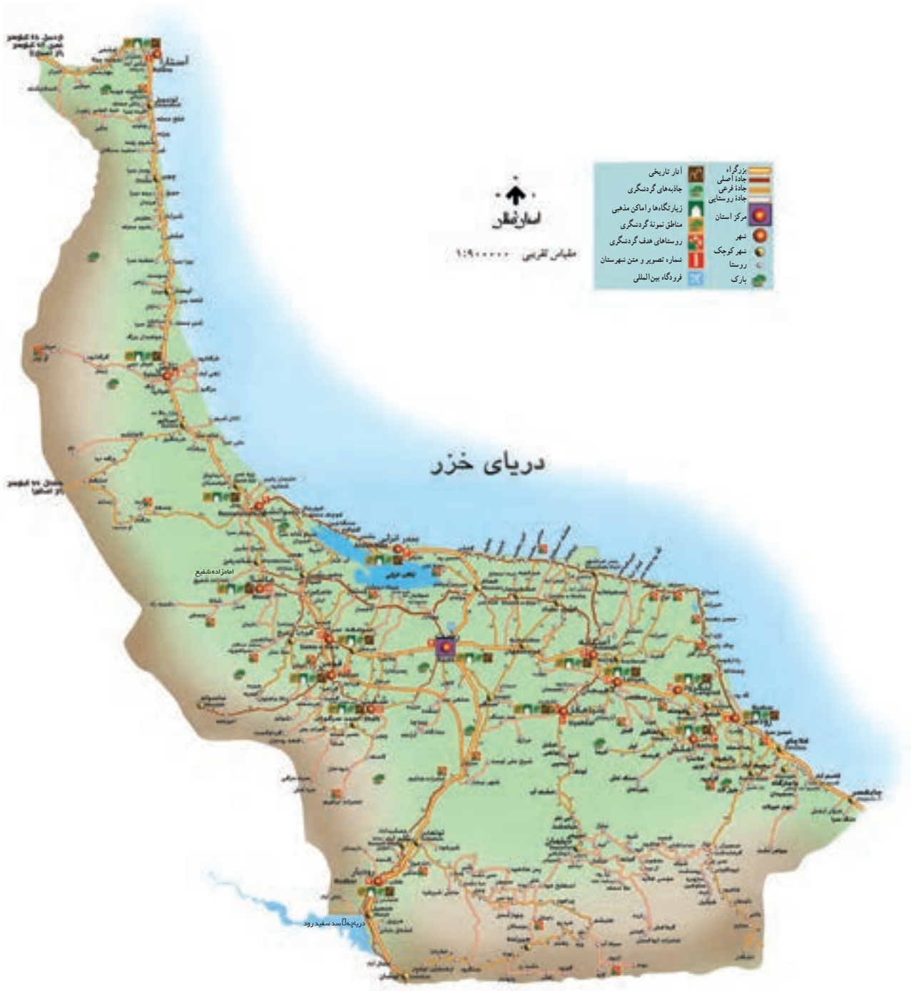
شکل ۱۸-۶ نقشه گردشگری استان