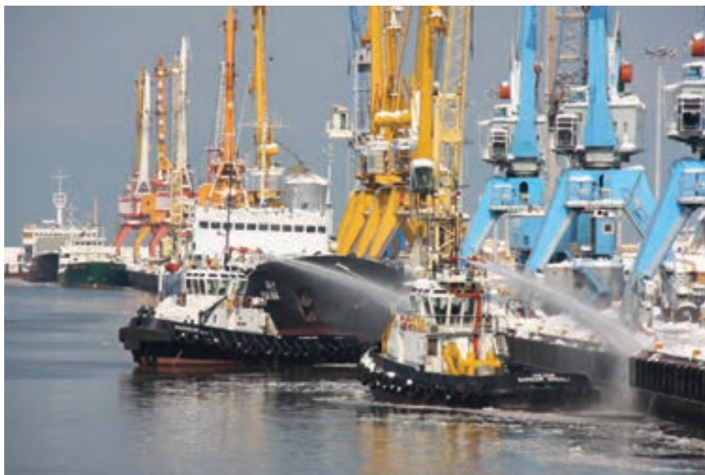
شکل ۶-۷- حمل و نقل دریایی

بعد از سال ۱۳۵۷، ظرفیت بارگیری و تخلیه بار بندر انزلی افزایش یافت و چهار پست اسکله و دو باب انبار سرپوشیده به این تأسیسات اضافه شد. طول موج شکن غربی افزایش یافت و بخشی از کانال به منظور دسترسی به محوطه مورد نیاز احیا شد.