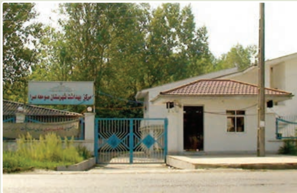
شکل ۸-۶- مرکز بهداشت

۴- حمایت از هویت و فرهنگ اسلامی : تعداد کتابخانه‌های عمومی قبل از انقلاب در استان ۲۵ باب بود که در سال ۱۳۸۶ به ۵۹ باب رسیده است. در این مدت، تعداد اعضا و مراجعان به کتابخانه نیز افزایش محسوسی داشته است. تعداد کل موزه‌های تحت نظارت اداره فرهنگ و هنر قبل و بعد از انقلاب یک باب است. همچنین، در دوران انقلاب اسلامی یک موزه در بندر انزلی و تحت نظارت نیروی دریایی ایجاد شده است. گردشگران خارجی استفاده‌کننده از هتل‌های استان به ۸۰۸۴ نفر در سال ۱۳۸۵ رسیده و در سال‌های اخیر، از نظر تأسیسات گردشگری نیز رشد قابل توجهی صورت گرفته است؛ به گونه‌ای که تعداد اتاق‌های تأسیسات اقامتی از ۱۱۱۳ اتاق در سال ۸۰ به ۱۷۰۳ اتاق در سال ۸۵ رسیده است. قبل از انقلاب اسلامی، تعداد نشریات محلی اعم از هفته‌نامه، ماهنامه، فصل‌نامه و سالنامه تنها ۵ عنوان بود که در سال ۱۳۷۳ به ۱۵ عنوان و در سال ۱۳۸۶ به ۸۷ عنوان رسیده و تعداد تأسیسات و مکان‌های ورزشی نیز از ۲۳ مکان در سال ۱۳۵۷ به ۱۷۴ مکان در سال ۱۳۸۶ رسیده است.