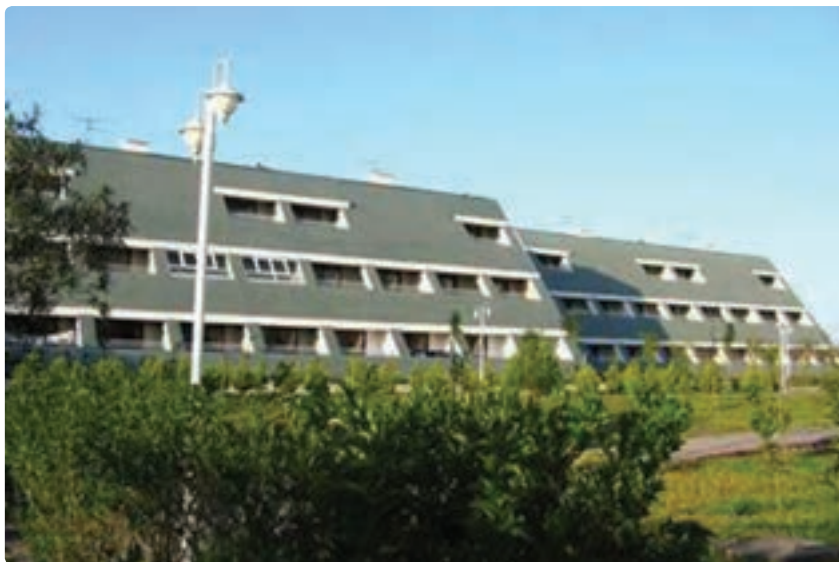
شکل ۶-۶- هتل سفید کنار

۳- وضعیت خدمات و بازرگانی: در طی سه دهه اخیر در استان، بخش خدمات بسیار پیشرفت کرده است. در تمامی سال‌های مورد بررسی، شمار شاغلان آن به طور مطلق و نسبی افزایش یافته است. آهنگ افزایش در سال‌های ۸۵-۱۳۷۵ به شدت رشد داشته و سهم شاغلان این بخش از ۳۹/۱ درصد به ۵۰/۱ درصد افزایش یافته است. در این دوره به طور متوسط، سالانه ۱۳۳۴ شغل در این بخش ایجاد شده است.