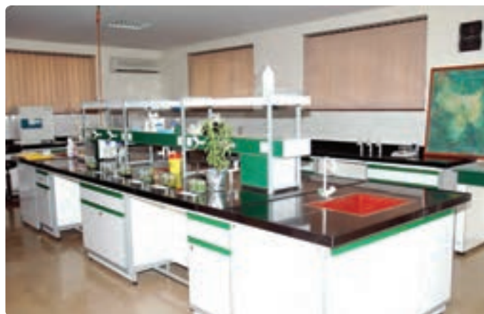
شکل ۱۲-۶- روش‌های جدید بیوتکنولوژی

افزایش بازدهی آبیاری و ازدیاد نرخ بهره‌وری از منابع آب : با استفاده بهینه از منابع آب و با بالابردن بازدهی آبیاری می‌توان کشاورزی استان را توسعه داد. در این زمینه، لازم است بین ارگان‌های مختلف برای استفاده صحیح و معقول از آب هماهنگی‌هایی صورت گیرد. ایجاد تأسیسات کوچک مهار آب‌های سطحی و بهره‌برداری بیشتر از آب‌های زیرزمینی به همراه استفاده از روش‌های جدید آبیاری، می‌تواند در افزایش تولید باغ‌های چای، زیتون، توت و کشتزارهای برنج مؤثر باشد.