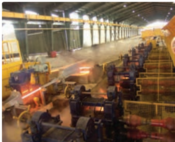
شکل ۱۴-۶- نمونه‌ای از صنایع استان