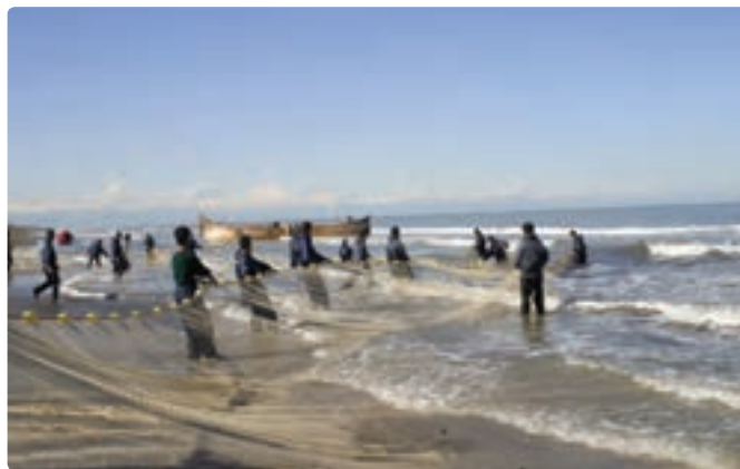
شکل ۳-۶- صید ماهی در دریای خزر