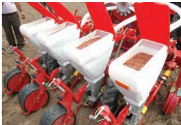
شکل ۹-۶- کاشت مکانیزه بادام زمینی (آستانه اشرفیه)