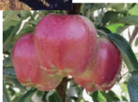
شکل ۴۳-۵- توانمندی‌های کشاورزی استان