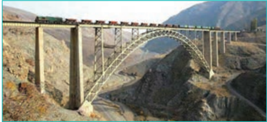
شکل ۶۶-۵- پل هوایی قطور- خوی