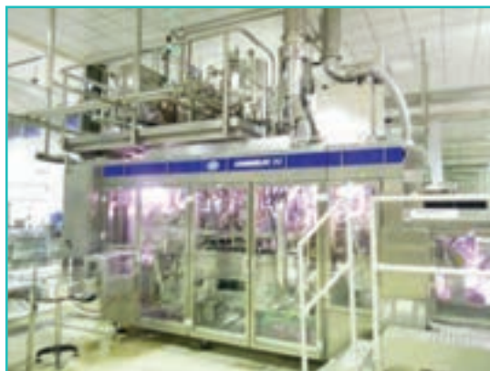
شکل ۵۴-۵- کارخانه شیر باستوریزه

آیا می‌توانید صنایع تبدیلی کشاورزی استان محل زندگی خود را نام ببرید؟