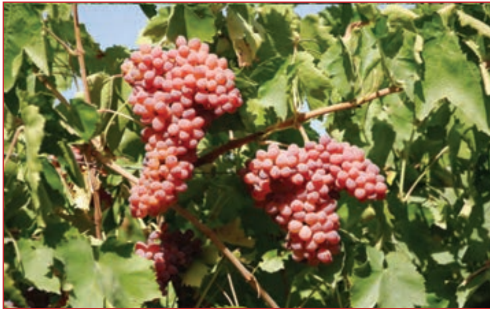
شکل ۴۵-۵- محصولات باغی استان

الف) زراعت : استان آذربایجان غربی با تولید ۴۶ نوع محصول زراعی و باغی از قطب های مهم کشاورزی کشور محسوب