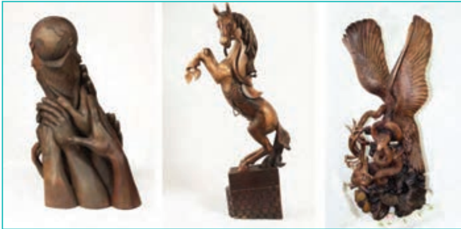
شکل ۶۲-۵- پیکره تراشی

۳- پیکره تراشی: این هنر به طور گسترده در شهرستان ارومیه کار می‌شود. ماده اصلی پیکره‌ها چوب گردو است.