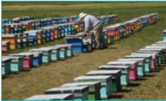
شکل ۴۸-۵- پرورش زنبور عسل