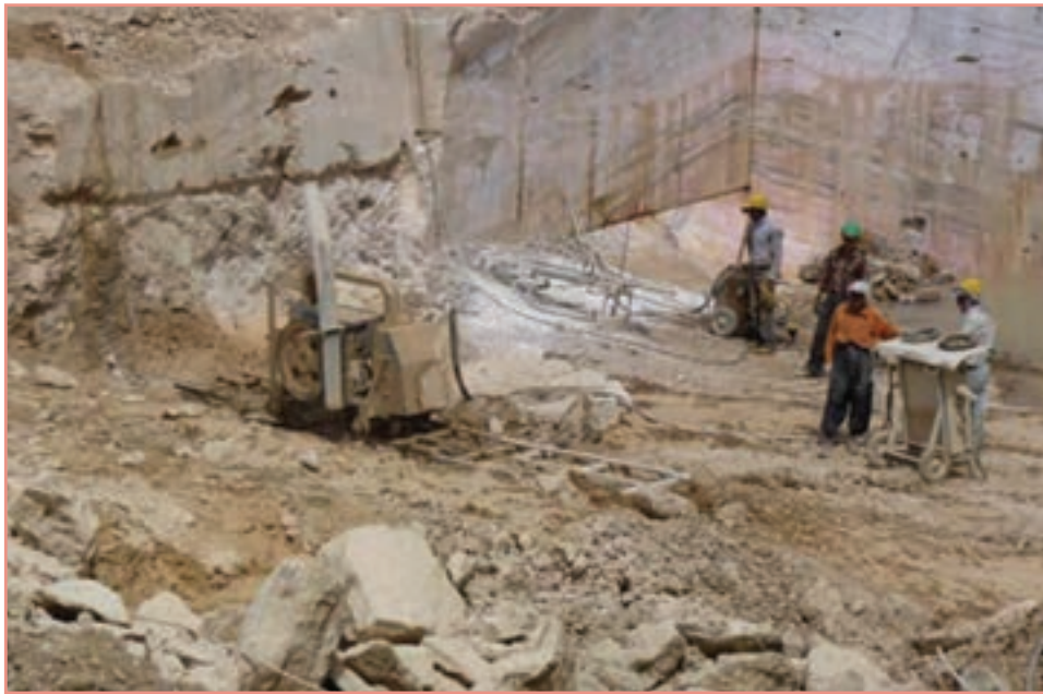
شکل ۶۵-۵- بهره‌برداری از معادن استان