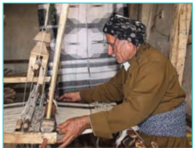
شکل ۵۸-۵- صنایع نساجی سنتی استان