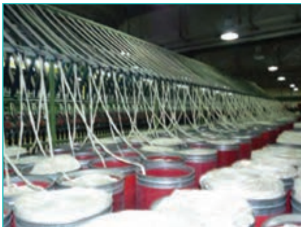
شکل ۵۶-۵- تصویری از کارخانه نساجی