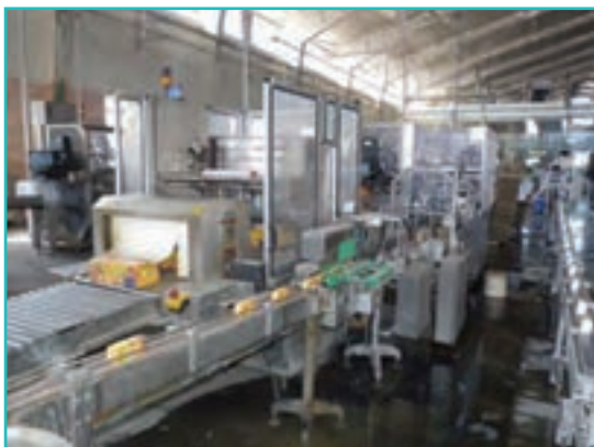
شکل ۵۵-۵- کارخانه آب میوه‌گیری