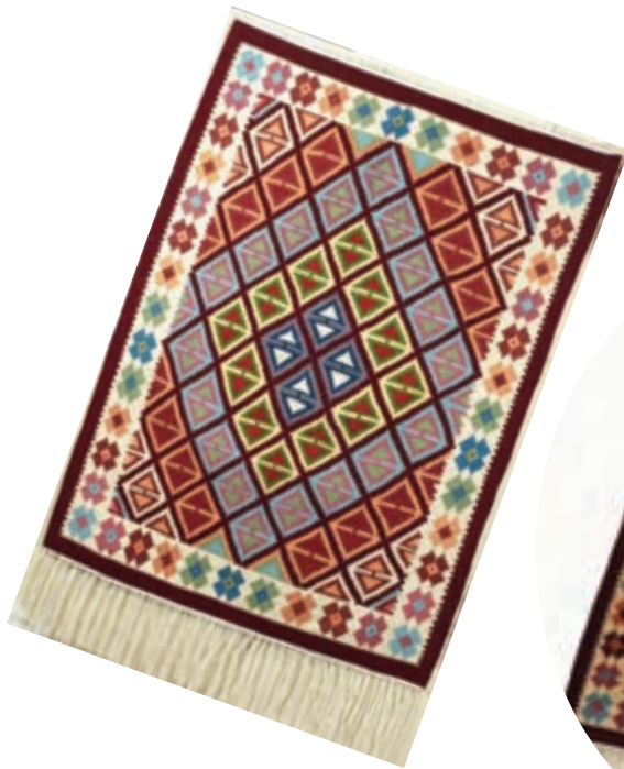
شکل ۵۹-۵- گلیم بافی

در بافت گلیم به کار می‌رود. نقوش گلیم به‌طور معمول هندسی است و بافت آن بیشتر در میان عشایر متداول است. از مراکز مهم گلیم‌بافی می‌توان به شهرستان‌های تکاب، مهاباد و بوکان اشاره کرد.