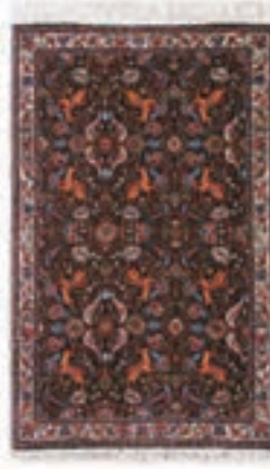
نام طرح: فرش افشار نام نقشه: شکارگاه ابعاد: ۲.۵ \times ۳.۵ ۲ \times ۳ ۱.۷ \times ۲.۴ بافت: تکاب