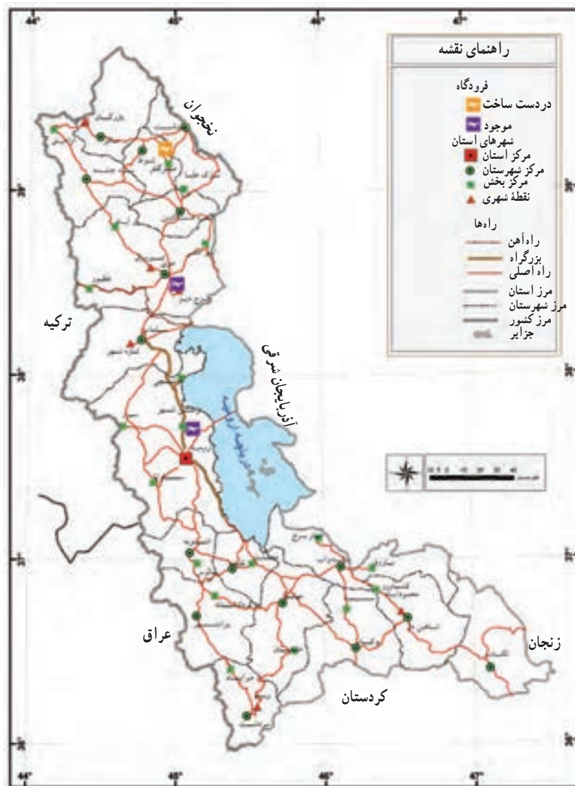
شکل ۶۷-۵- نقشه پراکندگی راه‌های مهم استان