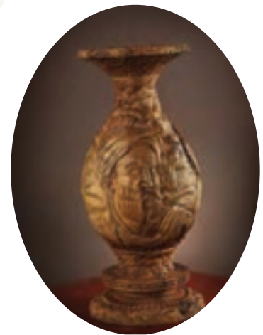
شکل ۶۰-۵- منبت‌کاری