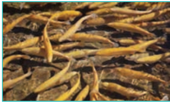
شکل ۴۷-۵- پرورش ماهی