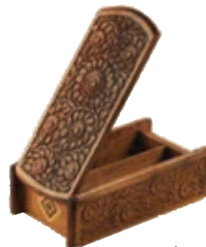
شکل ۶۱-۵- ریزه‌کاری

۲- ریزه‌کاری: هنری بسیار ظریف، زیبا و کاربر است. در این هنر چوب‌هایی بر اساس طرح و نقش از قبل آماده می‌شود و بر قسمت خالی شده چوب روکش می‌شود. ارومیه مرکز اصلی این هنر است. عمده‌ترین تولیدات این صنعت رحل قرآن، جعبه جواهرات، جعبه دستمال کاغذی، قاب عکس، صفحه شطرنج و... است.