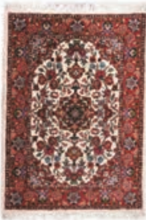
نام طرح: فرش افشار نام نقشه: شکارگاه ابعاد: ۲.۵ \times ۳.۵ ۲ \times ۳ ۱.۷ \times ۴.۰ بافت: تکاب