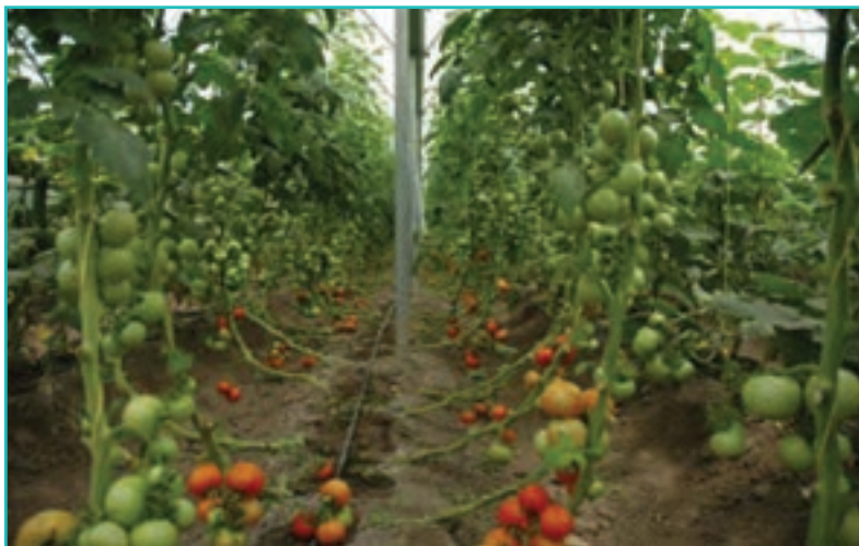
شکل ۴۶-۵- کشت گلخانه‌ای

در سال‌های اخیر کشت گلخانه‌ای نیز در استان رونق زیادی پیدا کرده است. آیا می‌توانید بگویید چرا این نوع کشت مورد استقبال و توجه کشاورزان قرار گرفته است؟ آیا می‌توانید بگویید در شهرستان محل زندگی شما کدام محصولات زراعی در گلخانه تولید می‌شوند؟ از کشت گلخانه‌ای محل زندگی خود تصاویری تهیه و در کلاس ارائه کنید.