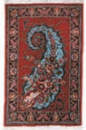
نام طرح: فرش افشار نام نقشه: بته چقه ابعاد: ۳ \times ۴ ۳ \times ۳ بافت: شاهین دژ و بوکان