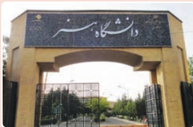
شکل ۱۴-۱۴- دانشگاه هنر - کرج