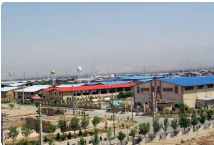
شکل ۲-۱۴- شهر صنعتی نظرآباد

در سال‌های اخیر به دنبال ممنوعیت تأسیس کارگاه‌های صنعتی در تهران، بخش‌هایی از استان برای احداث شهرک‌های صنعتی مورد توجه قرار گرفت که بسیاری از آن‌ها به مرحله بهره‌برداری رسیده است و تعدادی دیگر در حال تکمیل است. اشتغال‌زایی و افزایش تولیدات داخلی از نتایج ایجاد این شهرک‌های صنعتی می‌باشد.