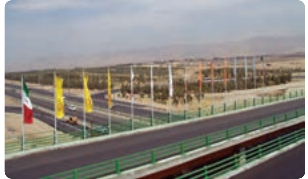
شکل ۷-۱۴- راه‌های استان