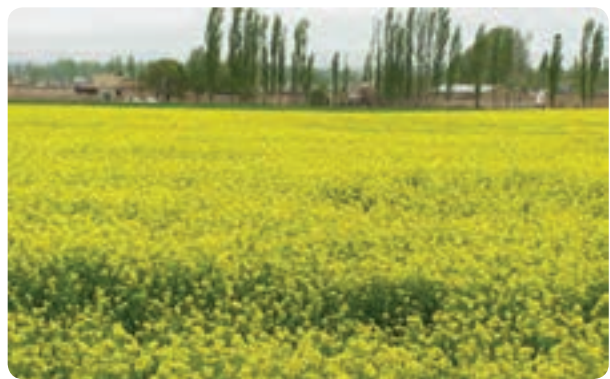
شکل ۱۴-۱- تغییر شیوه‌های سنتی و تبدیل آن به کشت‌های جدید