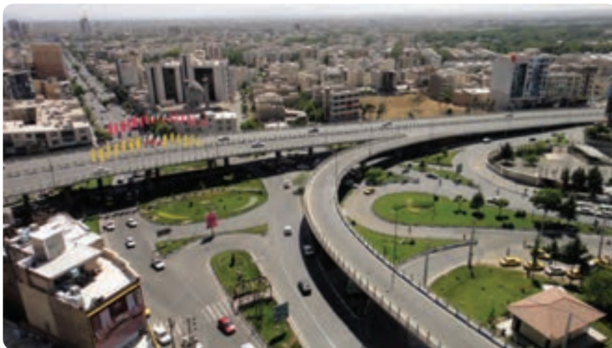
شکل ۴-۱۴- بل‌های روگذر آزادگان نمونه‌ای از فعالیت‌های عمرانی استان

فعالیت‌های عمرانی استان به سه بخش تقسیم می‌شوند: ۱- عمران شهری ۲- عمران روستایی ۳- راه و ترابری و حمل و نقل. ۱- عمران شهری: فعالیت‌ها و دستاوردهای عمرانی بسیاری (در زمینه تهیه طرح‌های تفضیلی و هادی، خدمات شهری، افزایش و اصلاح راه‌های ارتباط درون شهری و سایر تأسیسات زیربنایی) موجب پیشرفت و توسعه شهرهای استان شده است.