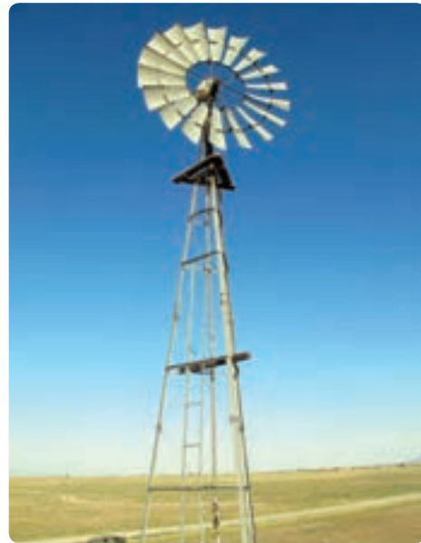
شکل ۱۸-۱۴- استفاده از انرژی‌های نو