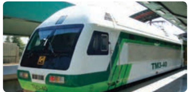
شکل ۸-۱۴- نمونه‌هایی از فعالیت‌های ساخت و ساز در مترو