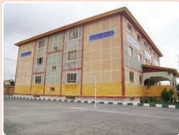
شکل ۱۲-۱۴- مدارس

جدول ۱۳-۱۴- تعداد دانش‌آموزان و کارکنان آموزشی کلیه مقاطع تحصیلی ۹۲-۱۳۹۱