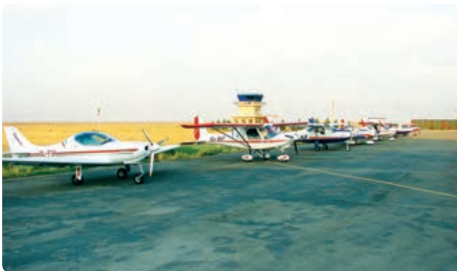
شکل ۱۱-۱۴- فرودگاه آزادی - نظرآباد

✳️ فرودگاه آزادی: این مجتمع فرودگاهی سال ۱۳۷۹ در شرق روستای صالحیه شهرستان نظرآباد افتتاح شد. مهم‌ترین اهداف احداث این فرودگاه تربیت نیروی انسانی در زمینه طراحی و ساخت هواپیماهای کوچک و آموزش هوانوردی است.