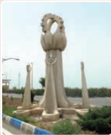
شکل ۳-۱۴- ورودی شهرک صنعتی اشتهارد

شهرک صنعتی اشتهارد: این شهرک به علت دسترسی به راه‌های ارتباطی و زمین‌های بایر و وسیع در مسیر جاده اشتهارد- بومین زهرا مکان‌یابی شد و در حال حاضر با داشتن ۵۲۵ واحد صنعتی فعال (فلزی - غذایی - شیمیایی و...) از اصلی‌ترین مناطق صنعتی کشور محسوب می‌شود.