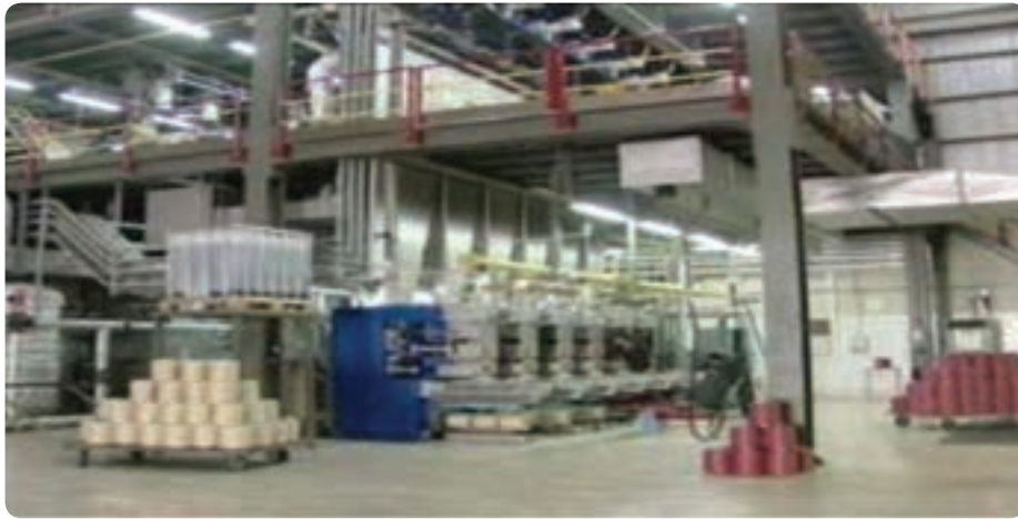
شکل ۱۵-۶- کارخانه کابل نوری یزد