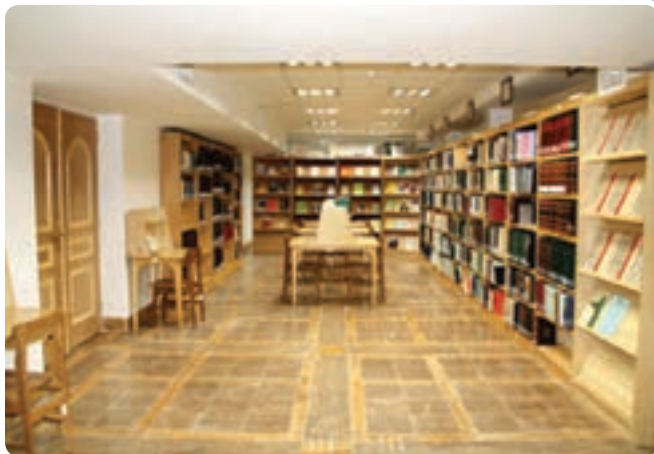
شکل ۱۳-۶- سالن کتابخانه وزیری یزد