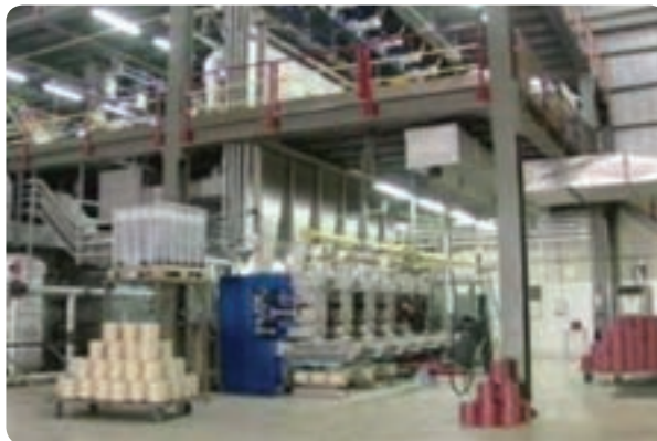
شکل ۸-۶- کابل‌های نوری شهید قندی در یزد