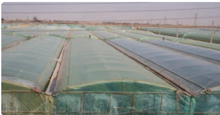
شکل ۱۷-۶- کشت گلخانه‌ای در مهریز