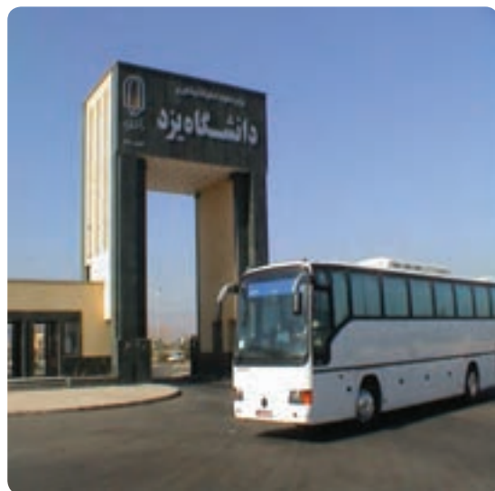
شکل ۱۱-۶- دانشگاه یزد

آموزش: بررسی شاخص‌های مربوط به آموزش و پرورش عمومی نشان دهنده وضعیت مطلوب استان در مقایسه با میانگین