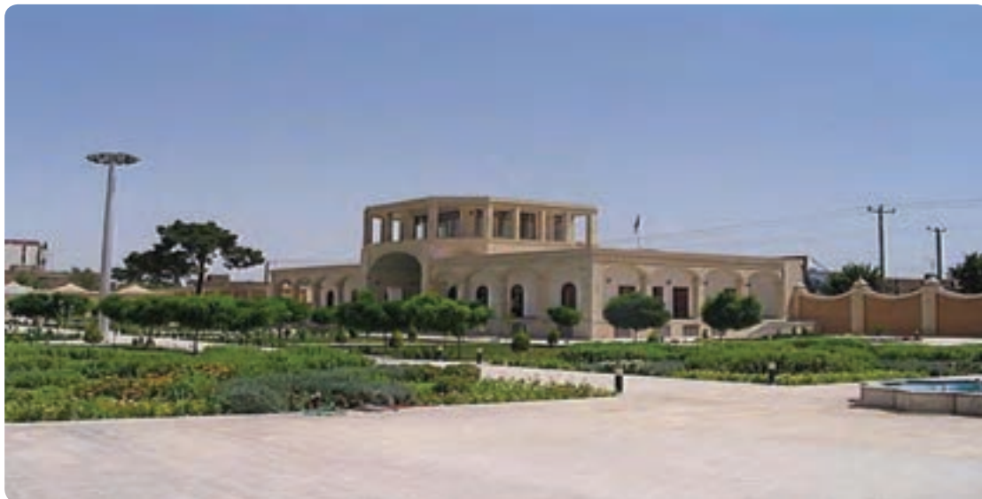
شکل ۲۱-۶- پارک علم و فناوری یزد

محورهای اصلی توسعه بخش زیربنایی، عمران شهری و مسکن اجرای پروژه‌های انتقال آب از خارج حوزه به استان به‌ویژه طرح عظیم خط دوم انتقال آب از سرشاخه‌های کارون بازسازی بافت‌های فرسوده احداث مخازن آب شهری اجرای طرح توسعه دوچرخه‌سواری در شهرها (احیای فرهنگ دوچرخه‌سواری) سرمایه‌گذاری مشترک در جهت احداث پارک‌های عمومی شهری و احداث باغ‌شهرها با اولویت باغ‌شهر یزد تأمین مسکن به‌ویژه برای طبقات محروم و اقشار کم‌درآمد، با استفاده از مصالح و فناوری‌های جدید و روز دنیا رئوس محورهای سند جامع توسعه IT و ICT ایجاد بانک اطلاعات شهری و ارائه خدمات الکترونیک توسط شهرداری‌ها توسعه فروشگاه‌ها و بازارهای اینترنتی توسعه بانکداری الکترونیک توسعه مشاوره و خدمات پزشکی از راه دور توسعه سیستم‌های الکترونیک در سطح مراکز بهداشتی درمانی و دارویی