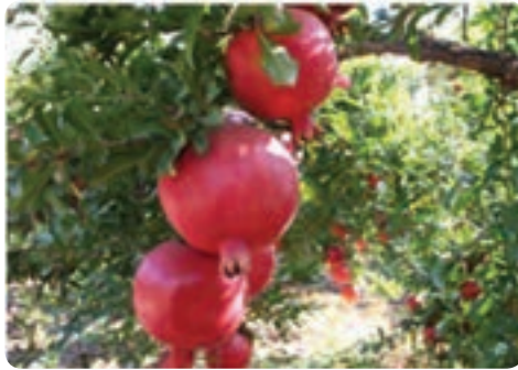
تولید انار - تفت - مهریز