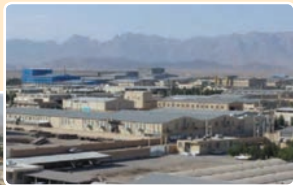
شکل ۴-۶- شهرک صنعتی خضرآباد یزد