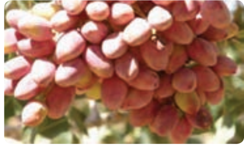
تولید پسته - اردکان