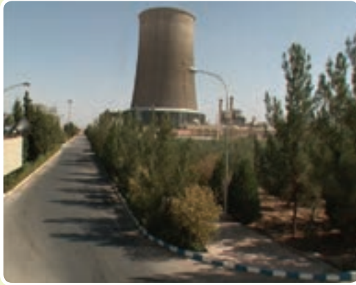
شکل ۱۰-۶- نیروگاه سیکل ترکیبی

۶- ثبت ۳۹ اختراع از سال ۱۳۸۴ تاکنون توسط واحدها و شرکت‌های مستقر در پارک یزد ۷- کسب ۷ مقام کشوری در حوزه رباتیک توسط تیم رباتیک پارک علم و فناوری یزد انرژی: بررسی شاخص‌های صنعت برق نشان می‌دهد، بیشترین سهم مصرف برق استان به ترتیب متعلق به بخش صنعت با ۵۷ درصد و بخش خانگی با ۱۸ درصد است.