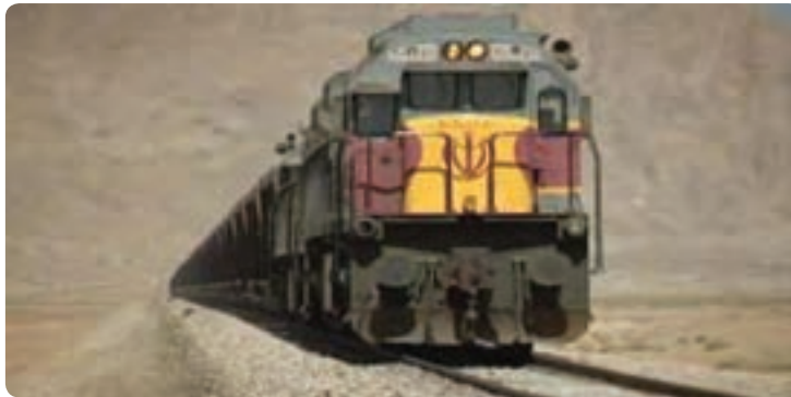
شکل ۱۹-۶- راه آهن استان

با توجه به قرارگیری استان در مرکز کشور و بر سر راه دالان‌های بین‌المللی شمال - جنوب و شرق - غرب و شبکه بزرگراه‌های آسیایی و محل تلاقی مهم‌ترین راه‌های مواصلاتی کشور و همچنین قرارگیری استان در مسیر راه‌های ترانزیتی از بندرعباس و بندر چابهار و مرزهای شرقی کشور به سمت پایتخت و مناطق شمالی - شمال غرب و غرب کشور، بخش حمل و نقل مورد توجه ویژه‌ای قرار دارد.