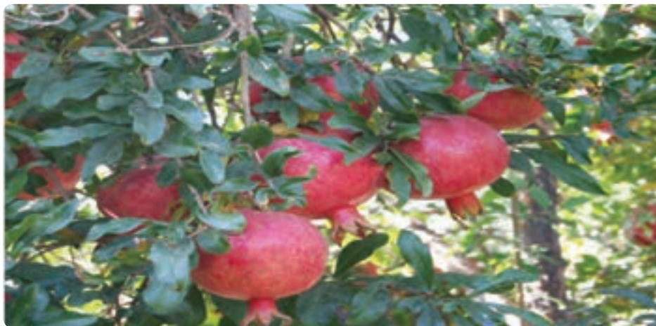
شکل ۱۶-۶- محصول انار

چشم‌انداز توسعه کشاورزی استان: بخش کشاورزی استان، بخشی توسعه یافته و پایدار، مبتنی بر دانش فنی و تجربه بالای بهره‌برداران و نیروی انسانی سخت‌کوش و توانمند است که لازم بوده تا در ارتباط با سایر بخش‌ها و محدودیت‌های موجود در منابع، جایگاه برتر را در تولید و صدور محصولات کشاورزی، تولید بذر اصلاح شده و تولید قلمه و نهال در سطح کشور کسب کند.