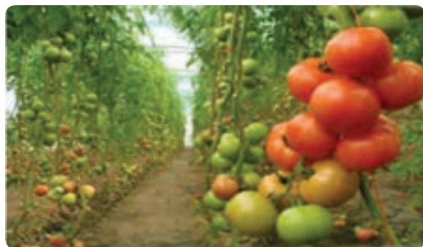
گلخانه تولید گوجه‌فرنگی