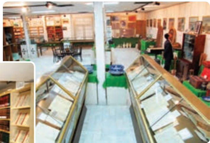
شکل ۱۲-۶- موزه کتابخانه وزیری یزد

فرهنگ و هنر: در سال‌های ۱۳۸۵-۱۳۵۷ تعداد کتابخانه‌های عمومی استان نزدیک به پنج برابر و تعداد کتاب‌های موجود در این کتابخانه بیش از ۹ برابر افزایش داشته است. تعداد سالن‌های سینما از سه سالن به پنج سالن افزایش یافته است. تعداد چاپخانه‌ها نیز چهار برابر و نشریات محلی از سه عنوان به ۶۲ عنوان رسیده است. توسعه و گسترش کانون‌های پرورش فکری کودکان و نوجوانان و کانون‌های فرهنگی و هنری از جمله دیگر فعالیت‌های فرهنگی انجام گرفته بعد از پیروزی انقلاب است. همزمان با گسترش شبکه‌های سراسری صدا و سیما شبکه استانی صدا و سیما نیز افتتاح گردیده است.