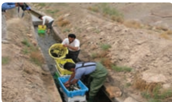
شکل ۲-۶- پرورش ماهی در مظهر قنات

توانمندی‌های شیلات: وجود آب‌های زیرزمینی شور و غیر قابل مصرف در امر کشاورزی، محیط‌های مناسب برای پرورش ماهی از قبیل استخرهای خاکی، استخرهای ذخیره آب کشاورزی و مظاهر قنات فراهم می‌کند. با توجه به شرایط فوق و وجود افراد علاقه‌مند در همه مناطق و شهرستان‌های استان، ماهی پرورش داده می‌شود.