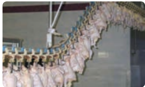
تولید مرغ - میبد