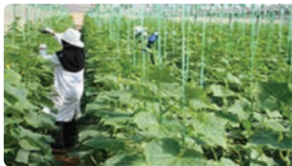
گلخانه تولید خیار