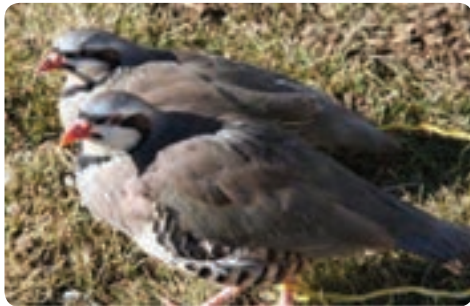
پرورش کبک - میبد