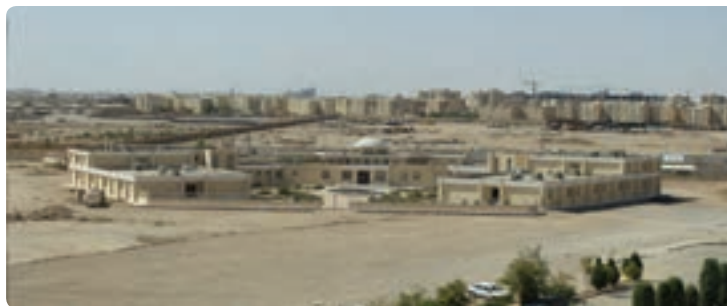
شکل ۲۰-۶- احداث درمانگاه تخصصی و فوق تخصصی بیمارستان شهید صدوقی

ایجاد مراکز مشاوره خدمات پیشگیری آسیب‌های اجتماعی و سلامت