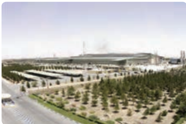
شکل ۹-۶- شرکت فولاد آلیازی اشکذر