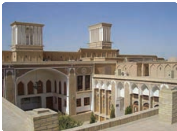
شکل ۱۸-۶- هتل به سبک سنتی در یزد

ایجاد واحدهای اقامتی سنتی و پذیرایی در بافت قدیمی شهرها