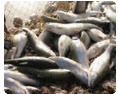
شکل ۱-۶- نمونه‌ای از تولیدات در زمینه کشاورزی استان یزد