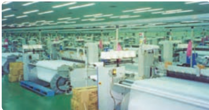
شکل ۶-۷ نمونه ای از صنایع نساجی استان

به موارد فوق می توان محصولات نوین در حال ظهور دارای تکنولوژی بالا با ترکیبات نانو را افزود.