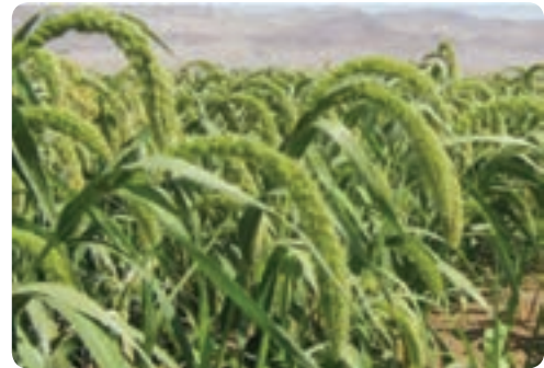
تولید ذرت - خاتم