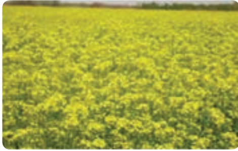
تولید کلزا - ابرکوه