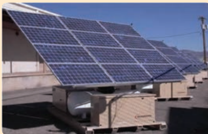
شکل ۱۴-۶- انرژی خورشیدی

در استان یزد به دلیل پتانسیل بالای تابش خورشید، نیروگاه خورشیدی - حرارتی در زمینی به مساحت ۹ کیلومترمربع در اشکذر در حال احداث است. به منظور ساخت این نیروگاه مشاوران آلمانی و ایرانی (پژوهشگاه وزارت نیرو) ضمن امکان‌سنجی و ارزیابی مناطق مناسب برای نصب نیروگاه، با توجه به مواردی چون: میزان تابش خورشید، تولید، تقاضا و مصرف برق، دسترسی به خطوط انتقال و شبکه دسترسی به سوخت و آب، مسائل زیست محیطی و هزینه زمین مورد استفاده، ناحیه‌ای در شمال غربی استان یزد را به عنوان مناسب‌ترین محل در ایران جهت احداث این نیروگاه انتخاب کرده‌اند.