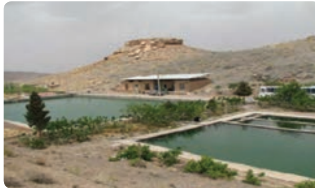
شکل ۳-۶- استخر پرورش ماهی