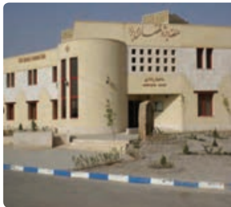
شکل ۵-۶- منطقه ویژه اقتصادی یزد