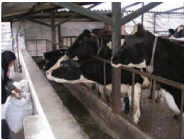
شکل ۲۰-۶- گاوداری صنعتی