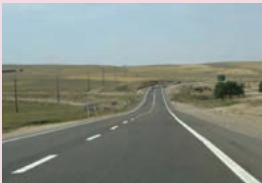
شکل ۴۳-۶- راه‌های بین شهری

در بخش انرژی کارهای بزرگی در استان فارس شروع شده که علاوه بر گسترش واحدهای تولیدی مجتمع پتروشیمی شیراز پالایشگاه گاز پارسیان که از آن به عنوان نقطه اتکا از کشور یاد می‌شود، کشف منابع جدید نیز در زمینه نفت در مناطق مختلف استان صورت گرفته است و امید می‌رود در زمینه صنعت نفت استان فارس قدم‌های بزرگی در آینده برداشته شود.