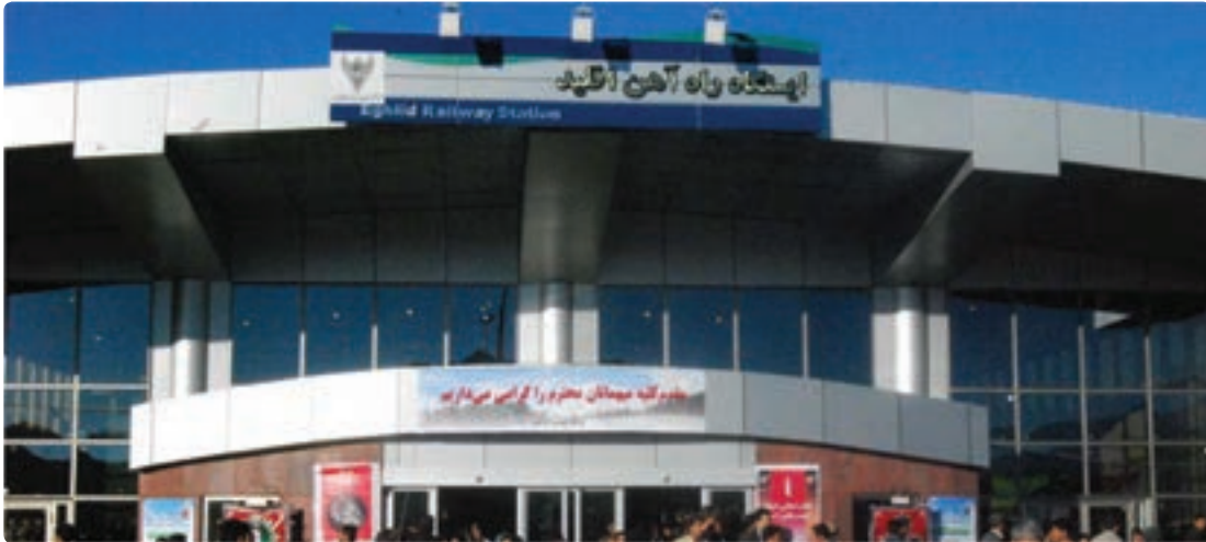
شکل ۲۸-۶- ایستگاه راه آهن اقلید

اگر بخواهیم پرافتخارترین طرح عمرانی استان فارس را در سال‌های اخیر نام ببریم، بی شک راه‌اندازی قطار شیراز - اصفهان است که کلیه مراحل مطالعه - برنامه‌ریزی و اجرای آن در زمان جمهوری اسلامی انجام شده است.