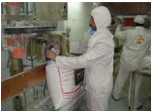
شکل ۳۴- صنایع غذایی بیضا