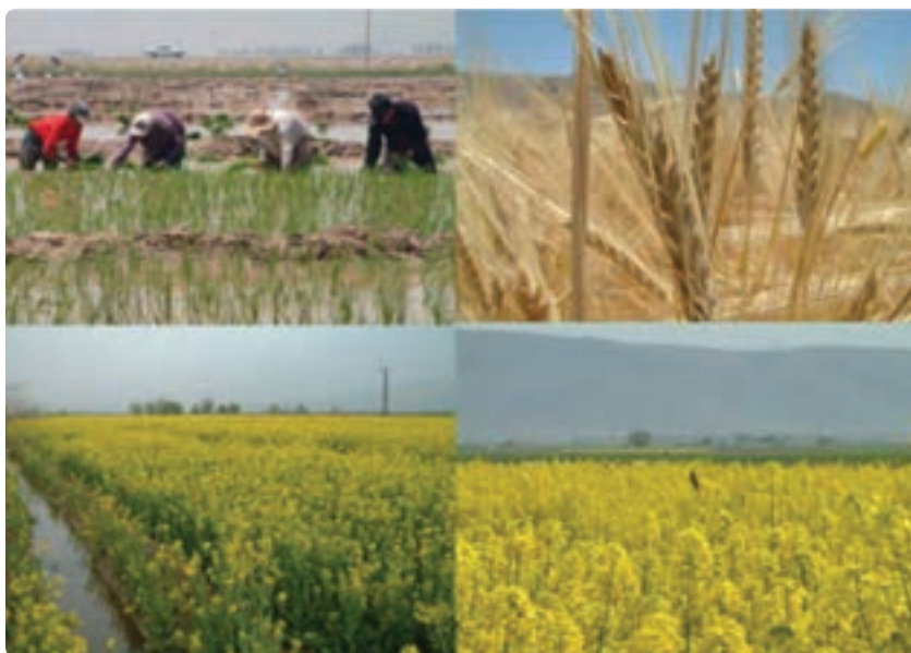
شکل ۲-۶- توسعه کشاورزی