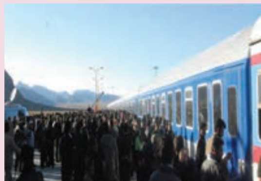
شکل ۴۲-۶- ایستگاه راه‌آهن