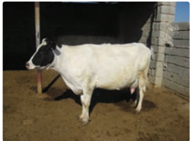
شکل ۱۹-۶- گاوداری صنعتی

علاوه بر فعالیتهای زراعی و باغی در زمینه دامپروری و تولیدات دامی و پرورش آبزیان و ماهیان پرورشی روستائیان و عشایر فارس توانسته‌اند سهم عمده‌ای از تولید گوشت قرمز و سفید کشور را به خود اختصاص دهند. جدول ۲-۶ بخشی از فعالیتهای دامپروری و تولیدات آن را در سال ۱۳۸۶ نشان می‌دهد.