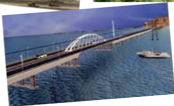
شکل ۱-۶- بخش‌های دستاوردهای انقلاب اسلامی