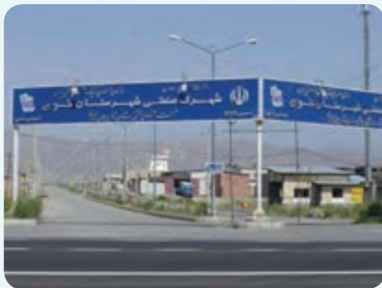
شکل ۴-۶- شهرک صنعتی خوی

صنعتی استان از نظر ایجاد اشتغال شهرک صنعتی خوی است. این شهرک با وسعت ۲۲۱/۸۳ هکتار در ۱۵ کیلومتر ۱۵ خوی - سلماس قرار دارد. تعداد واحدهای به بهره‌برداری رسیده این شهرک ۱۰۵ واحد و میزان اشتغال ۲۱۰۲ نفر است. نزدیکی به نیروگاه سیکل ترکیبی، فرودگاه خوی و شبکه راه آهن سراسری در سال‌های اخیر در توسعه آن نقش مهمی ایفا کرده است.