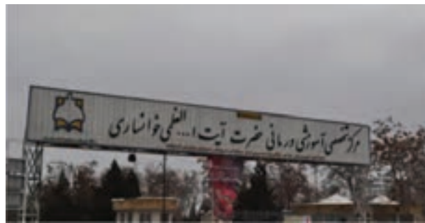
شکل ۹-۶- بیمارستان آیت الله خوانساری اراک