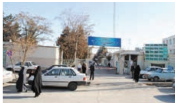
شکل ۱۰-۶- بیمارستان امام خمینی (ره) خمین