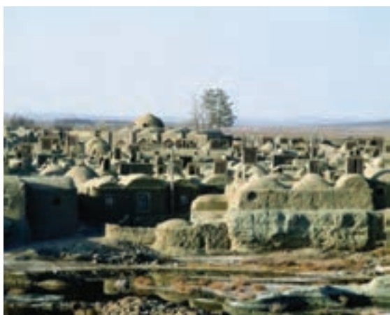
شکل ۱۴-۱۲- بافت تاریخی روستای خور شهر خوسف