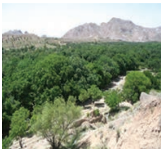
شکل ۲۰-۱۲- دره ییلاقی کریمو و مصعبی سرایان