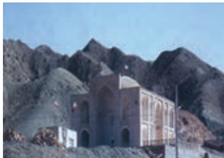
شکل ۱۸-۱۲- امامزاده سلطان ابراهیم رضا