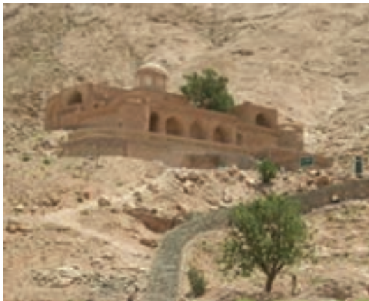
شکل ۳۷-۱۲- بوذرجمهر قاین