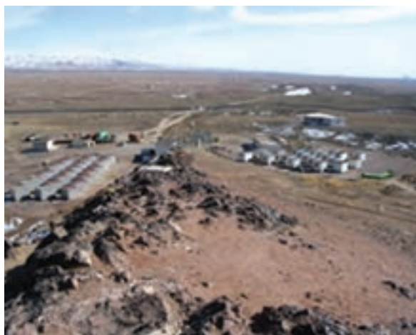
شکل ۳۳-۱۲- آب گرم فردوس