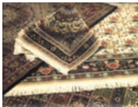
شکل ۶-۱۳- فرش مود

* کدام یک از صنایع دستی در شهرستان محل زندگی شما از رونق برخوردار است؟ چند مورد را نام ببرید. ب) بخش معدن: به جدول ۵-۱۳ توزیع پراکندگی معادن استان ما نگاه کنید. بگویید که بیشترین و کمترین معادن فعال استان در محدوده کدام شهرستان‌ها واقع شده است؟