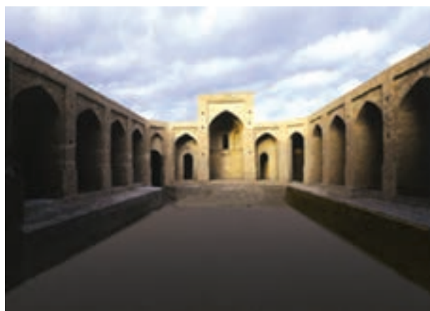
شکل ۲۱-۱۲- کاروانسرای سرایان