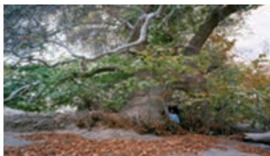
شکل ۱۹-۱۲- درخت هزار ساله دوشنگان