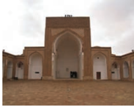
شکل ۳۴-۱۲- مسجد جامع فردوس

● منطقه نمونه گردشگری بوذرجمهر قاین : منطقه نمونه گردشگری بوذرجمهر با وسعتی حدود ۵۰۹ هکتار در ضلع شرقی شهر قاین واقع شده است که پیوند تنگاتنگی با پایتخت زعفران جهان و کانون شهری دیرینه و پایدار سرزمین قهستان و فرهنگ و تمدن کهن دارد.