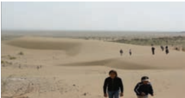
شکل ۱۲-۲۴- کویر همت آباد شهرستان زیرکوه