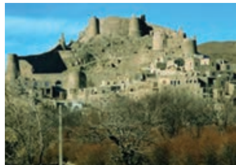
شکل ۱۷-۱۲- قلعه فورگ درمیان