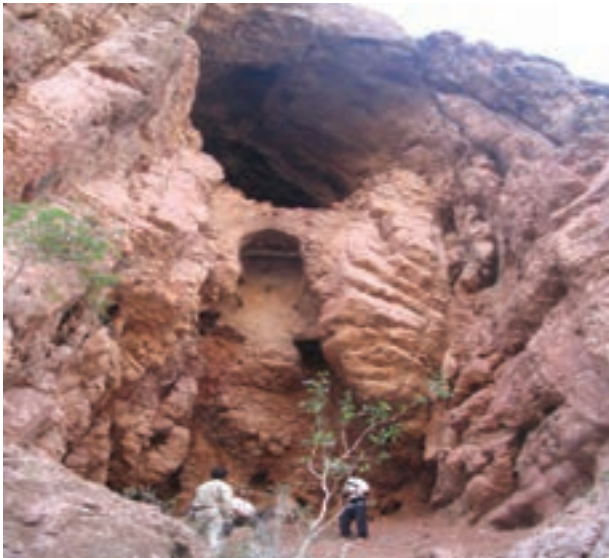
شکل ۱۲-۲۲- غار پهلوان شهرستان زیرکوه