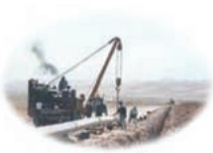
شکل ۵-۱۴- اجرای طرح‌های جامع شهری، راهبردی مناسب برای عمران شهری