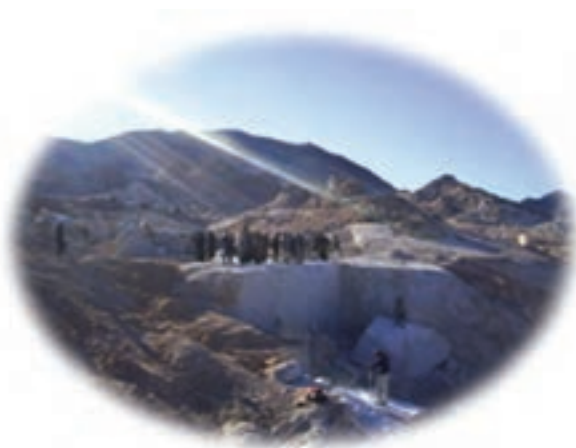
شکل ۳-۱۴- توسعه معادن بعد از انقلاب اسلامی