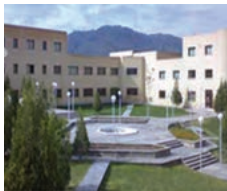
شکل ۷-۱۴- دانشگاه صنعتی بیرجند