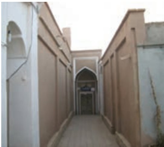
شکل ۹-۱۴- موزه بشرویه

● فعالیت‌های فرهنگی: پس از پیروزی انقلاب اسلامی گسترش مراکز فرهنگی و ایجاد مکان‌هایی که در مسیر فعالیت‌های فرهنگی قرار دارند، مورد توجه مسئولان استان ما قرار گرفت. کتابخانه‌ها، کانون‌های پرورش فکری کودکان و نوجوانان، مجتمع‌های فرهنگی - هنری، موزه‌ها، سینماها، انجمن‌های نمایشی از آن جمله‌اند.