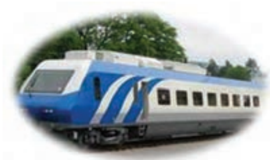
شکل ۲-۱۵- چشم‌انداز آینده استان در بخش حمل و نقل