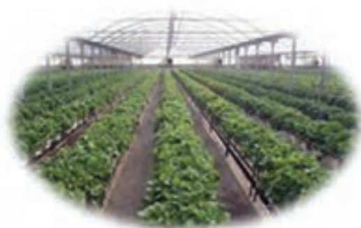
شکل ۱-۱۵- چشم‌انداز آینده استان در بخش کشاورزی