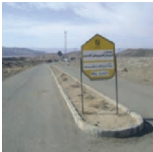
شکل ۴-۱۴- اجرای طرح‌های هادی، راهبردی مناسب برای عمران روستایی