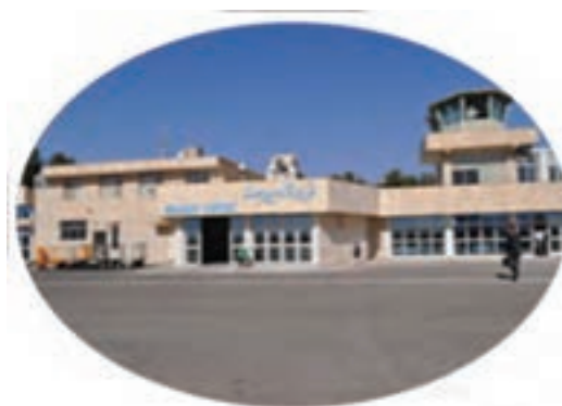
شکل ۶-۱۴- فرودگاه بین‌المللی بیرجند