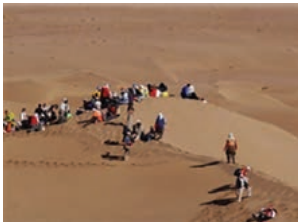
شکل ۳-۱۵ چشم انداز آینده استان در بخش فرهنگی و گردشگری