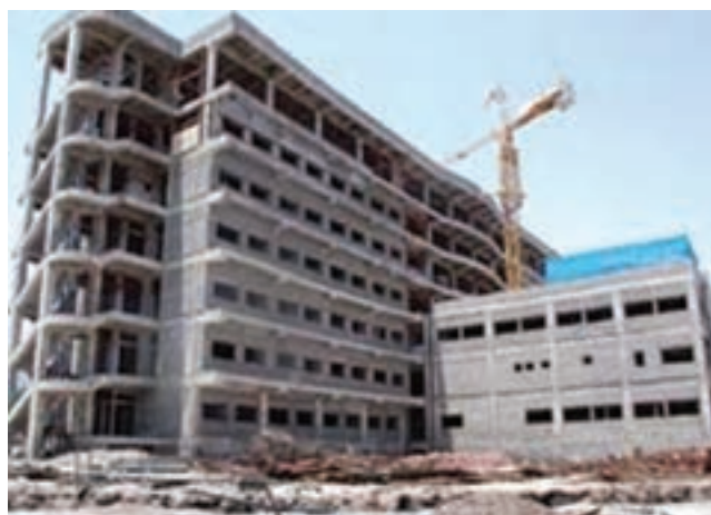
شکل ۱۰-۱۴- عملیات ساخت بیمارستان ۲۰۰ تختخوابی امام رضا(ع)

● فعالیت‌های بهداشتی درمانی: از دستاوردهای مهم انقلاب اسلامی در استان خراسان جنوبی، ارتقای شاخص‌های بهداشتی، درمانی و اختصاص اعتبارات ویژه به بهداشت و درمان است. توسعه مراکز و پایگاه‌های بهداشتی طبق نظام شبکه بهداشت و درمان، راه‌اندازی واحدهای جدید بهداشتی برای دسترسی بیشتر مردم به خدمات بهداشتی و درمانی به خصوص در مناطق روستایی از اقدامات مهم وزارت بهداشت و درمان در سال‌های بعد از انقلاب است.