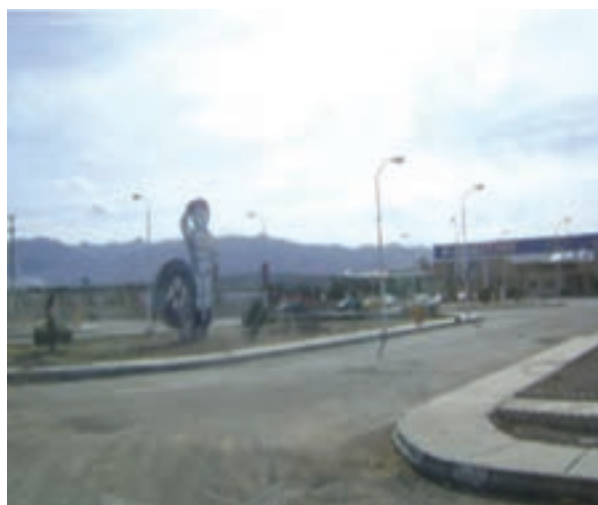
شکل ۱-۱۴- شهرک صنعتی بیرجند