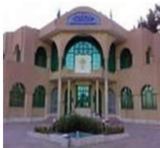
شکل ۸-۱۴- کتابخانه امام رضا(ع)