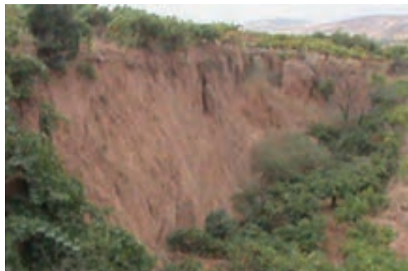
شکل ۱۱-۶- زمین لغزش در باغات روستای نرگسلو در بجنورد