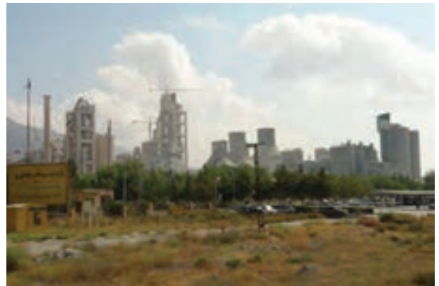
شکل ۱۵-۶- صنعت سیمان صنعتی قابل گسترش در استان