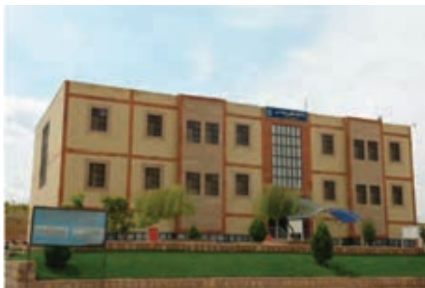
شکل ۶-۸ نمایی از پروژه‌های آموزشی استان بعد از پیروزی انقلاب اسلامی