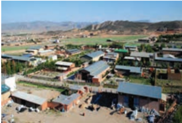
شکل ۱۶-۶- شهرک صنعتی و بستر سازی برای ایجاد اشتغال