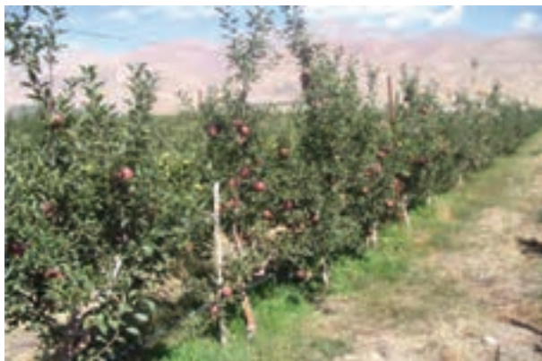
شکل ۱۴-۶- آبیاری قطره ای در باغات سیب پایه مالینگ