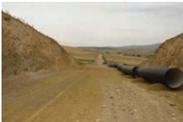
شکل ۱۳-۶- اجرای پروژه انتقال آب از سد شیرین دره به شهر بجنورد