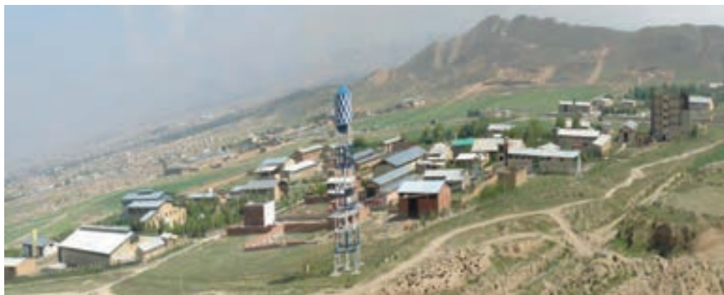
شکل ۲-۶- چشم اندازی از یک شهرک صنعتی در استان

شهرک‌ها و نواحی صنعتی ۱ استان : بعد از پیروزی شکوهمند انقلاب اسلامی، در جهت ایجاد مراکز و مهیا کردن فضایی برای رشته‌ها و حرفه‌های مختلف صنعتی، در اقدامی هماهنگ با سایر استان‌ها، در استان خراسان شمالی نیز ایجاد شهرک‌ها و نواحی صنعتی از سوی مسئولان تصویب شد و مکان‌هایی برای آنها اختصاص یافت که بسیاری از آنها به بهره‌برداری رسیده و در تعدادی از شهرستان‌ها در حال تأسیس‌اند. این اقدام از یک سو موجب جذب سرمایه‌های بخش خصوصی در مسیرهای تولیدی متناسب با نیازهای جامعه شده و از سوی دیگر زمینه اشتغال به کار جوانان را فراهم کرده است.