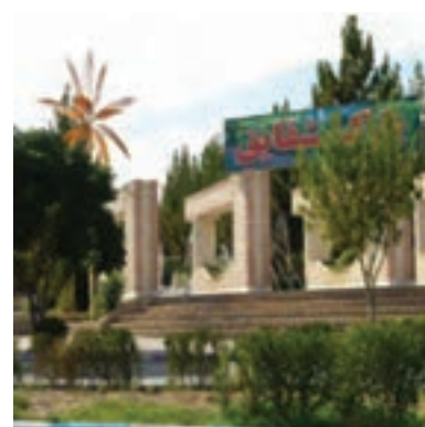
شکل ۱-۶- برخی از دستاوردهای انقلاب شکوهمند اسلامی در استان

انقلاب اسلامی در سال ۱۳۵۷ به پیروزی رسید. این انقلاب علاوه بر یک رویداد سیاسی - مذهبی، تحولی عظیم در تمام عرصه‌های اقتصادی، اجتماعی، فرهنگی، صنعتی، عمرانی و ... به وجود آورد.