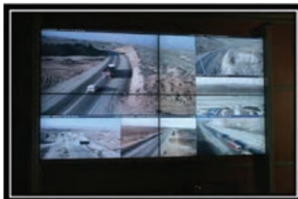
شکل ۶-۷ بخشی از فعالیت‌های انجام گرفته پس از انقلاب اسلامی در بخش راه و ترابری استان