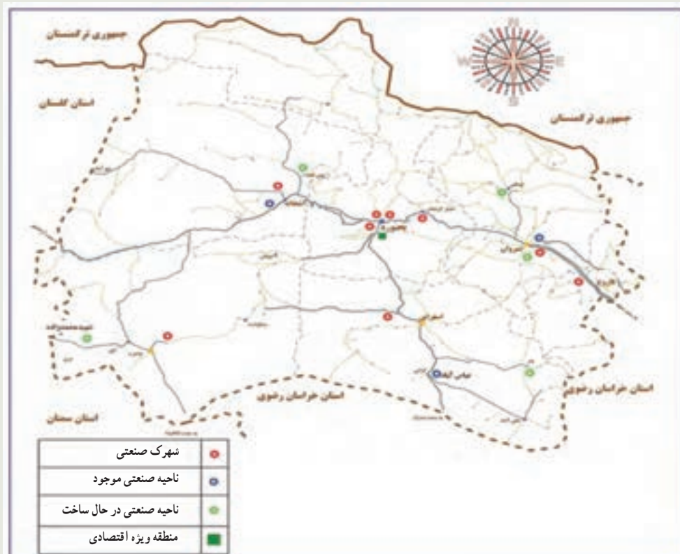
شکل ۳-۶- نقشه موقعیت مکانی شهرک‌ها و نواحی صنعتی استان