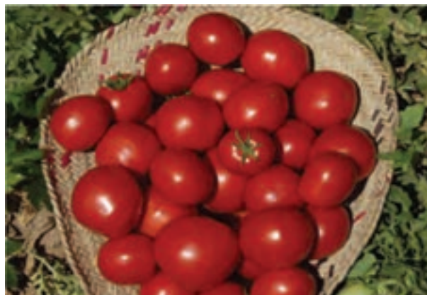
شکل ۱۲-۶- محصولات که زمینه ساز توسعه صنایع تبدیلی در استان اند