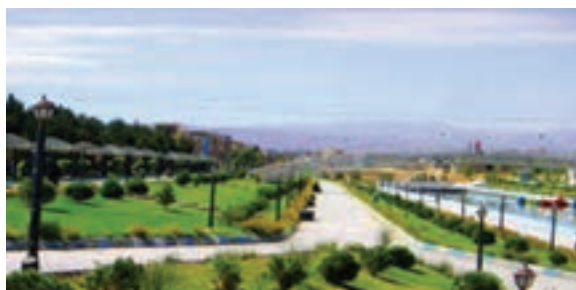
شکل ۵-۶- نمایی از پروژه‌های مهم عمران شهری در استان بعد از پیروزی انقلاب اسلامی