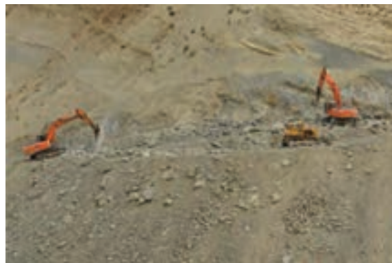
شکل ۱۰-۶- تشکیلات سخت مانعی در توسعه راه‌های استان

* به نظر شما علاوه بر موارد نام برده شده، چه مشکلات دیگری بر سر راه توسعه استان وجود دارد؟