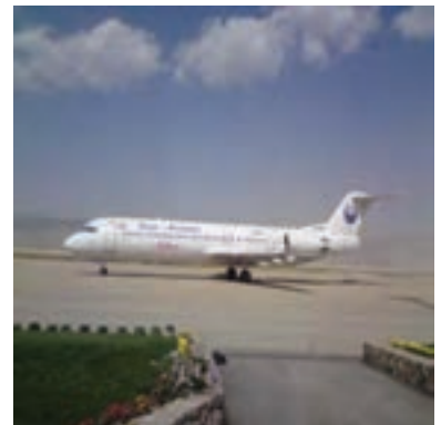
شکل ۹-۶ بخشی از توانمندی‌های استان مبنایی برای چشم انداز آینده

سی و سه سال از پیروزی انقلاب شکوهمند اسلامی می‌گذرد و درخت انقلاب امروز به حدی بزرگ و تنومند شده که شاخ و برگ آن بر تمامی گستره ایران اسلامی سایه افکنده است. پیشتر گفته شد که، بسیاری از شاخص‌های اقتصادی، اجتماعی و فرهنگی استان در سال‌های پس از انقلاب رشد چشمگیری داشته است. با توجه به دستاوردهای انقلاب شکوهمند اسلامی و با در نظر گرفتن استعدادهای خدادادی، موقعیت خاص، توان‌های محیطی، نیروی انسانی ماهر و متخصص، خراسان شمالی می‌تواند در آینده در بسیاری از زمینه‌ها رشد و شکوفایی پیدا کند. این اتفاق نمی‌افتد مگر اینکه مسئولان استان به این توانمندی‌ها توجه کنند و در راه توسعه و پیشرفت استان گام‌های اساسی را بردارند. با تمام این نقاط قوت و فرصت‌ها در مسیر توسعه استان ضعف‌ها و تهدیدهایی وجود دارد که در اینجا به برخی از آنها اشاره می‌شود :