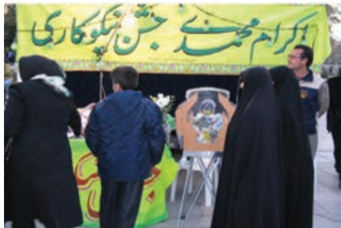
شکل ۲-۷- جشن نیکوکاری

عام‌المنفعه، خدمات خود را در جهت سه محور امور حمایتی از محرومان، امور توانمندسازی محرومان و امور اعتمادسازی و جلب مشارکت‌های مردمی دنبال می‌کند.