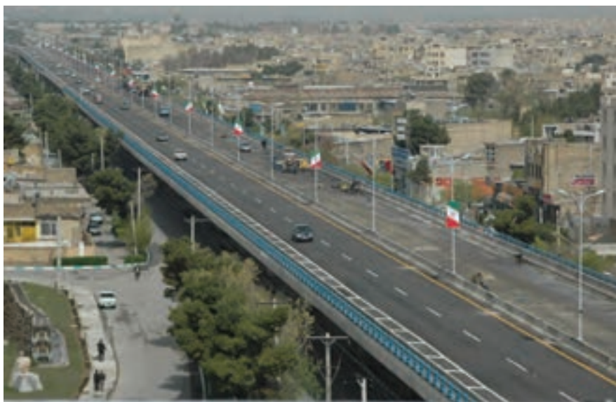
شکل ۳-۷- پل روگذر غیر مسطح امام خمینی (ره)

— حمل و نقل درون شهری : تا پایان شش ماهه اول سال ۱۳۸۷ سهم حمل و نقل عمومی در کلان‌شهر اصفهان ۶۸ درصد بوده است. طی ۳۰ سال (۸۵-۱۳۵۸) جمعیت شهری استان حدود ۲/۱۵ برابر شده؛ در حالی که تعداد وسایل حمل و نقل عمومی به بیش از ۵۹ برابر رسیده است.