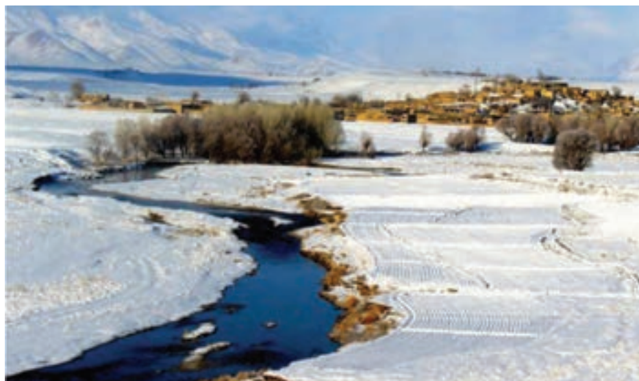
شکل ۱-۲- روستایی در فریدن

گفتنی است که وجود ۲۸ روستا به عنوان هدف گردشگری، تصویب ۶۰ منطقه نمونه گردشگری در توسعه گردشگری در استان اصفهان مؤثر بوده است. علاوه بر این، تعریف ۲۸ محور گردشگری، تولید نقشه ایران با محورهای گردشگری، حفظ و احیای رشته های صنایع دستی و ارائه سامانه اطلاعات مکانی آثار تاریخی و فرهنگی استان و طرح ملی تور الکترونیکی سبب افزایش گردشگران داخلی و خارجی در اصفهان شده است.