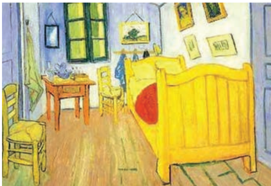
تصویر ۶۲-۱- اثری از ون‌گوگ