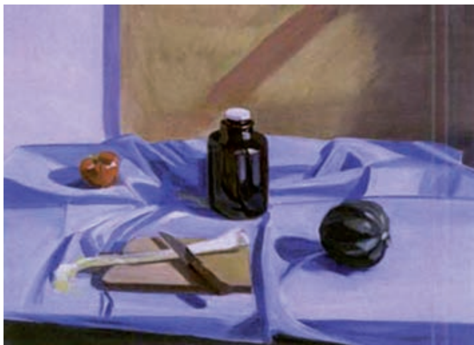
تصویر ۶۱-۱- نقاشی رنگ و روغن با تأکید بر روی خط

خط صریح و روشن : گاهی خط در آثار نقاشی به طور واضح و صریح به کار می‌رود . در بعضی از نقاشی‌های طبیعت بی‌جان نیز خطوط لبه‌های گوناگون اشیاء را معین می‌کنند و با وجود نبودن خطوط واقعی این نقاشی‌ها نیز در رده بندی نقاشی‌های خطی جامی گیرد (تصاویر ۶۲ و ۶۱-۱).