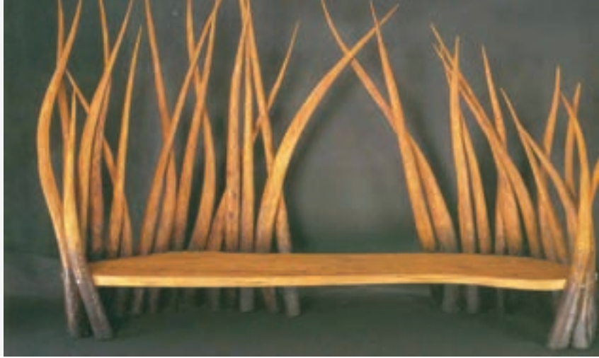
تصویر ۵۹-۱ کاربرد خط در طراحی اشیاء کاربردی

خط در نقاشی می‌تواند عنصر مهمی باشد، زیرا یک نقاشی با فضای رنگی نسبت به طراحی از محدودیت کم‌تری برخوردار است، رنگ و خط می‌توانند مکمل یکدیگر باشند. وقتی هنرمند عمداً خط را به عنوان خطوط محیطی در نقاشی در نظر می‌گیرد، خط از ارزش زیادی برخوردار می‌شود زیرا به وسیله تیره و ضخیم شدن آن تصویر مورد نظر مشخص می‌گردد. به کمک تکرار و تغییر در کیفیت خط در نقاشی می‌توان بافت‌های متنوع و بدیعی به وجود آورد. (تصویر ۶۰-۱).