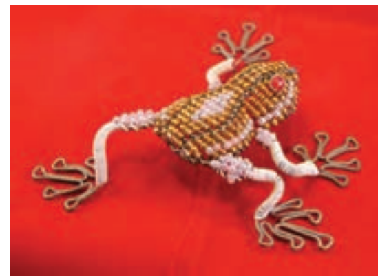
تصویر ۱-۷۴- استفاده از منجوق برای تولید بافت در اجمام ساده