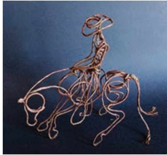
تصویر ۱-۷۳- مراحل ساده تبدیل حجم و سه بعدی کار