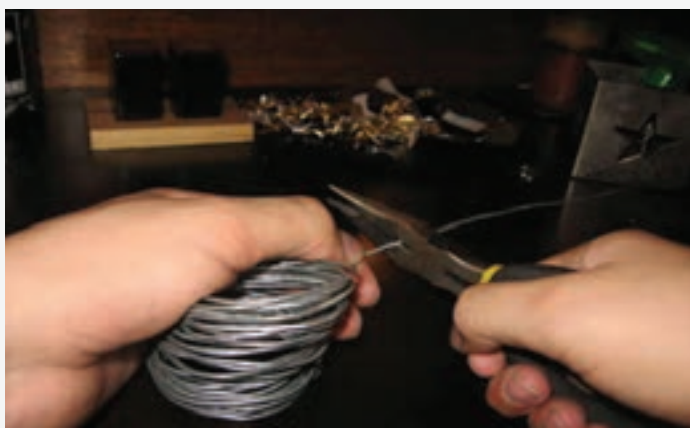
تصویر ۶۸-۱ طرز کاربرد سیم چین، دم باریک