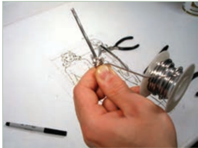
تصویر ۱-۶۹- نحوه ایجاد حلقه ها جهت تولید فرم یا گره ، سیم