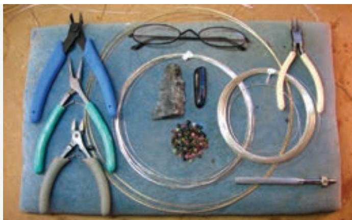
تصویر ۶۷-۱ لوازم اولیه

پیش‌طرح کار را به روش طراحی خطی اجرا نمایید. با خم کردن مفتول و پیچ و خم‌های لازم طرح را بوجود آورید. تا حد امکان از گره‌ها یعنی برش و اتصال پرهیز نمایید. به تصاویر با دقت توجه کنید. در اجرا به خطوط و تقسیم‌بندی‌ها در تصویر توجه کنید. حالات انواع خطوط را به لحاظ هویت آنها را با استفاده از سیم (ضخیم، نازک،...) به کار بگیرید. (تصاویر ۶۷ الی ۶۷-۱)