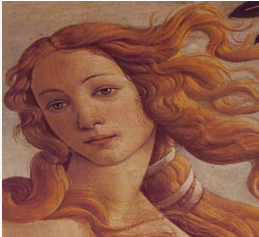
تصویر ۶۰-۱ بخشی از اثر تولد ونوس - ساندر بوتیچلی

خط در نقاشی می‌تواند عنصر مهمی باشد، زیرا یک نقاشی با فضای رنگی نسبت به طراحی از محدودیت کم‌تری برخوردار است، رنگ و خط می‌توانند مکمل یکدیگر باشند. وقتی هنرمند عمداً خط را به عنوان خطوط محیطی در نقاشی در نظر می‌گیرد، خط از ارزش زیادی برخوردار می‌شود زیرا به وسیله تیره و ضخیم شدن آن تصویر مورد نظر مشخص می‌گردد. به کمک تکرار و تغییر در کیفیت خط در نقاشی می‌توان بافت‌های متنوع و بدیعی به وجود آورد. (تصویر ۶۰-۱).