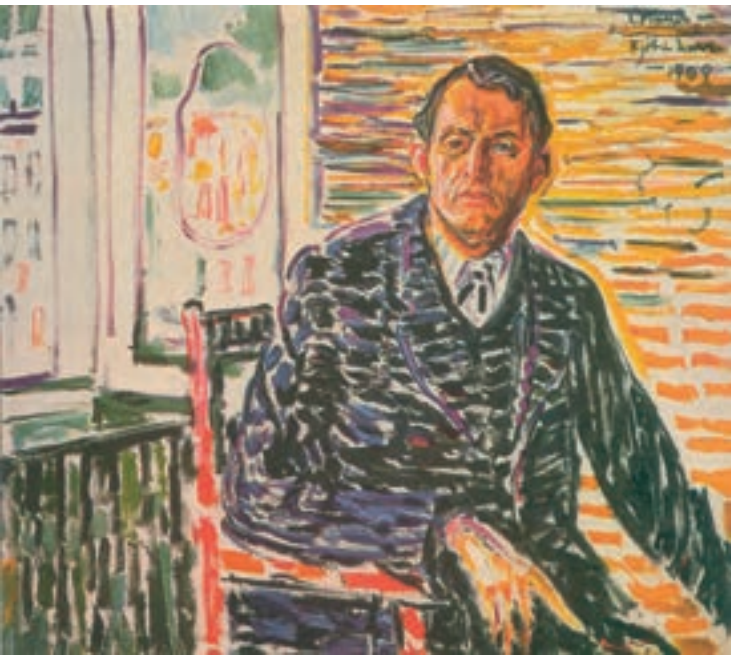
تصویر ۱-۶۳- اثری از ادوارد مونک (مونش)