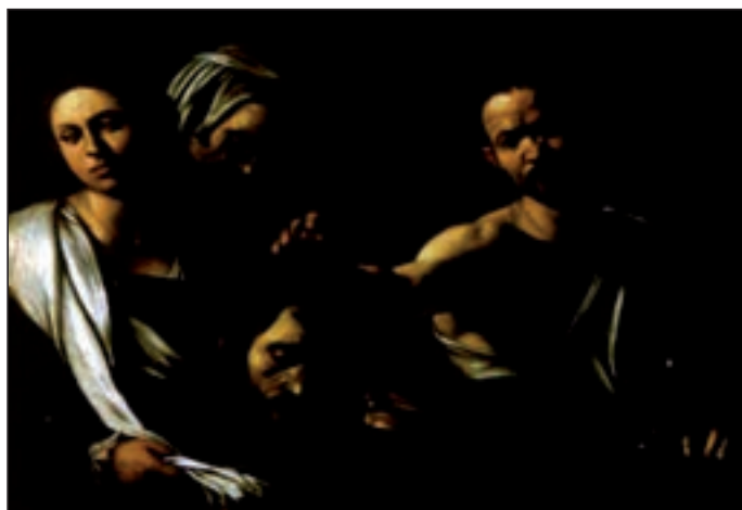
تصویر ۶۶-۱- کاراواجو