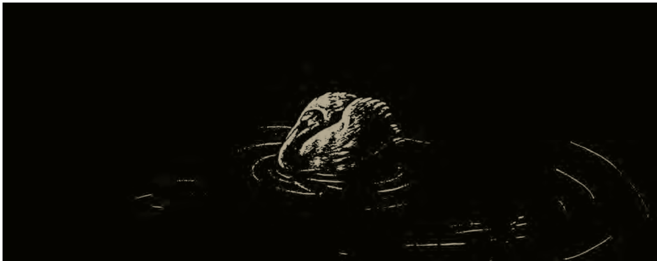
اثر : عبدا... حاجیوند (نقاشی برای همین کتاب)