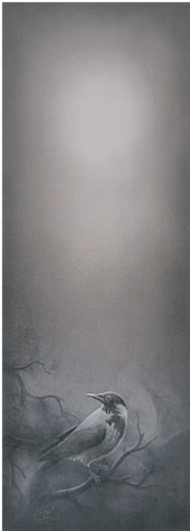
اثر: عبدال... حاجیوند (نقاشی برای همین کتاب)

کادر عمودی برای مرگ در آسمان و افقی برای مرگ در دریا انتخاب شده‌اند.