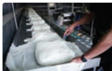
شکل ۴-۳- آب‌گیری از لخته