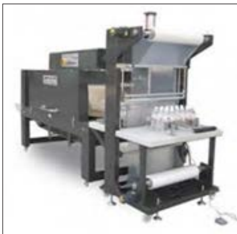
شکل ۴-۱۳- دستگاه پرکن عرقیات