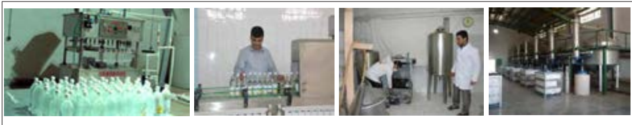
شکل ۴-۱۴- مراحل پرکردن و بسته‌بندی عرقیات

انتخاب ظرف بستگی به مدت زمان نگهداری دارد. برای نگهداری عرقیات در حجم زیاد و مدت طولانی از مخازن استیل ضد زنگ دارای همزن استفاده می‌شود؛ زیرا اسانس و عرق در طی دوره نگهداری از هم جدا می‌شوند، ولی برای نگهداری عرقیات در حجم کم از ظروف شیشه‌ای و یا ظروف پلاستیکی سفید رنگ با مواد درجه یک استفاده می‌شود.