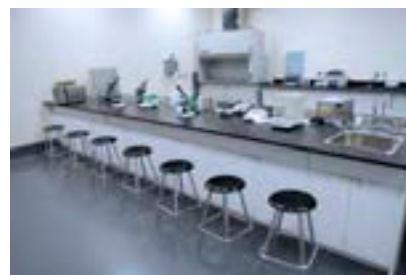
شکل ۱۶-۴- آزمایشگاه مواد غذایی

عرقیات گیاهی تولید شده باید بوی خاص و استاندارد داشته باشند، بوی سوختگی و گندیدگی ندهند و دارای ذرات معلق یا لرد نباشند. همچنین در عملیات کنترل کیفی عرقیاتی که اسانس‌دار هستند؛ چرب بودن آنها نشانه خالص بودن است؛ مانند خانواده نعناعیان.