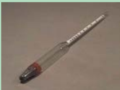
شکل ۴-۱۸- الکل سنج