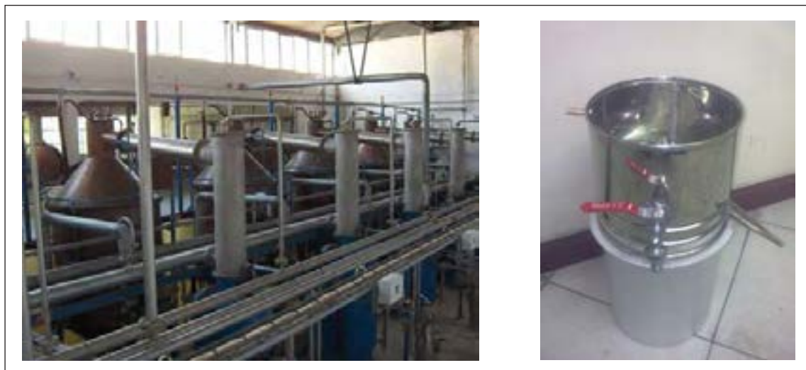
شکل ۴-۱۱ مراحل پاستوریزاسیون

معمولاً عرقیات گیاهی در بسته‌های اسپتیک بسته‌بندی می‌شوند.