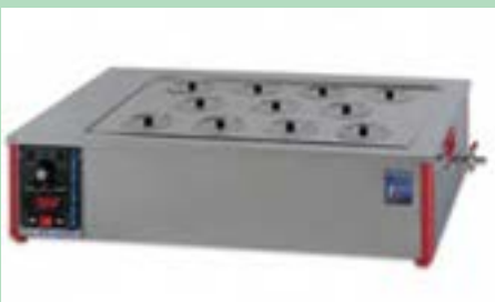
شکل ۴-۱۲- بن ماری