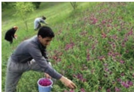
شکل ۴-۴- برداشت و انتقال گیاهان دارویی