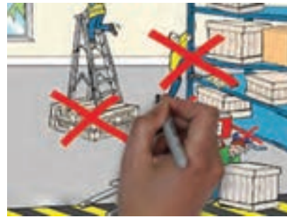
شکل ۱۵-۴- انبارداری

کیفیت به چه معناست و منظور از انجام عملیات کنترل کیفی در صنایع غذایی چیست؟