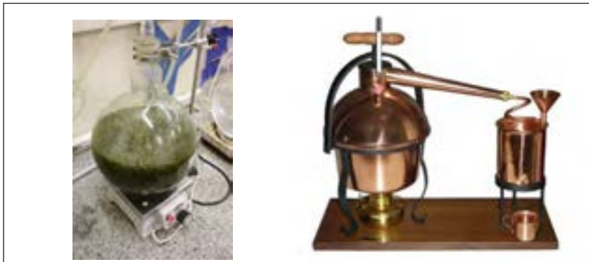
شکل ۴-۷- دستگاه تقطیر