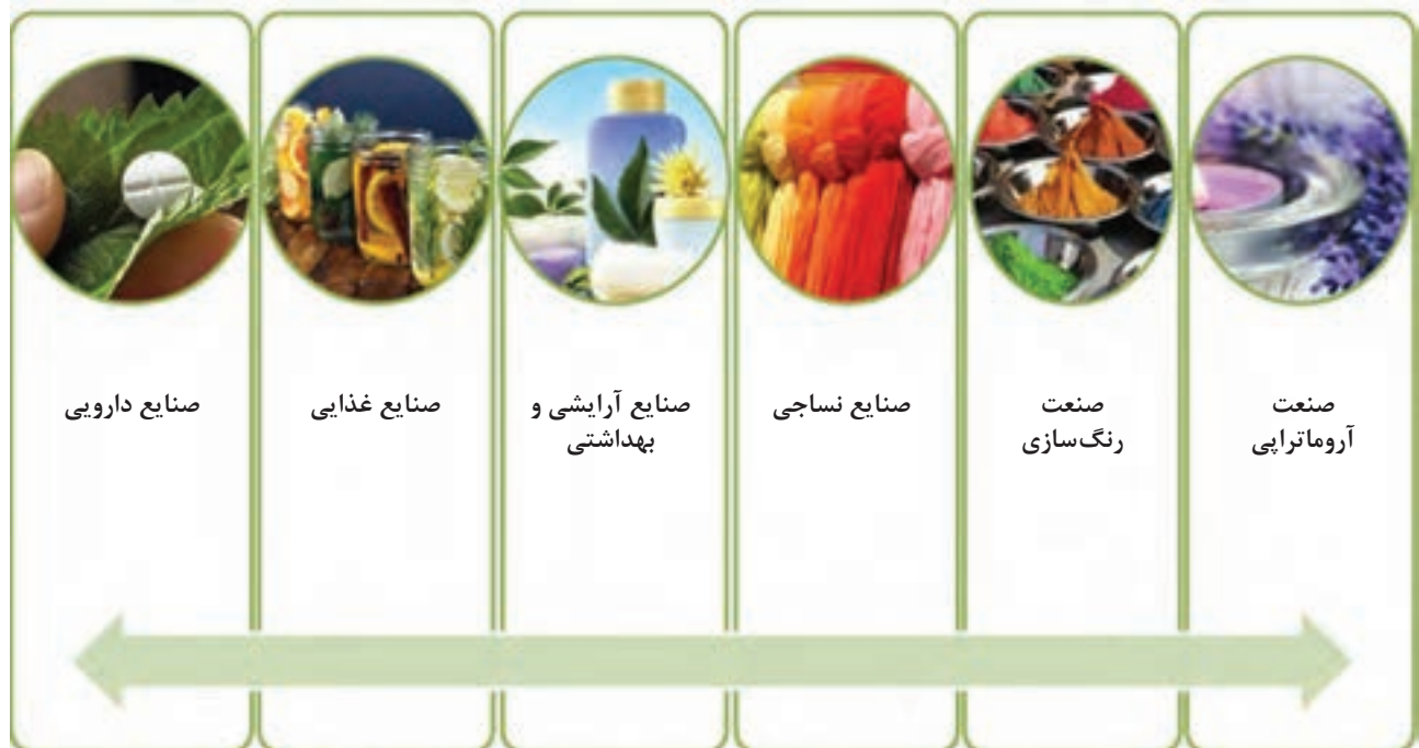
شکل ۱-۴. استفاده از گیاهان در صنایع مختلف

این بخش‌های گیاهی به صورت سنتی و فقط با خشک کردن به عنوان «کالای عطاری» عرضه می‌شوند. علاوه بر این، برخی از گیاهان دارویی به عنوان چاشنی با هدف ایجاد عطر و طعم دلپذیر به غذاها اضافه می‌شوند. به همین سبب دو اصطلاح دارویی و معطر معمولاً به صورت همراه با هم به کار می‌روند.