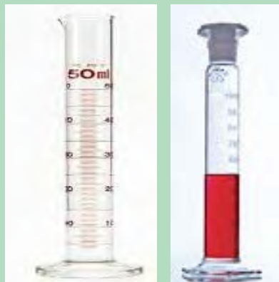
شکل ۴-۱۹- استوانه مدرج