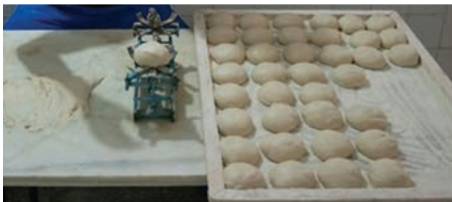
شکل ۹- چانه‌گیری با ترازو

چانه‌گیری به صورت دستی و با ترازو انجام می‌شود. (شکل ۹)