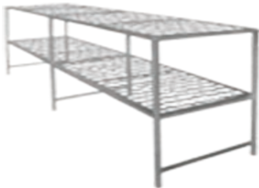
شکل ۱۷- توری سرد کردن نان

نان پس از پخته شدن دچار تغییرات فیزیکی، شیمیایی و میکروبی شده که شدت این تغییرات به عواملی مثل دما، زمان نگهداری نان و مواد اولیه آن بستگی دارد. هدف از سرد کردن نان حفظ کیفیت مطلوب و آماده کردن آن برای عملیات بعدی مثل برش دادن است. تماس بیش از حد نان با هوا برای سرد شدن، باعث خروج آب و خشک شدن آن می‌شود و از طرفی بسته‌بندی نان گرم هم باعث رشد میکروارگانیسم‌ها می‌شود و نیز بیات شدن نان را تشدید می‌کند. بنابراین کنترل دما، زمان و رطوبت، موقع سرد کردن نان حائز اهمیت است. (شکل ۱۷)