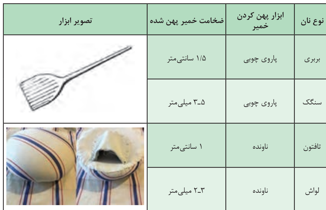
جدول ۹- ابزارآلات پهن کردن خمیر و ضخامت آن در انواع نان سنتی

با توجه به نوع نان تولیدی، چانه‌های آماده شده را روی ابزارهای ویژه‌ای با ضخامت مشخص و به طور یکنواخت پهن می‌کنند. جدول زیر برخی از ابزارهای مورد استفاده در تولید نان سنتی را نشان می‌دهد.