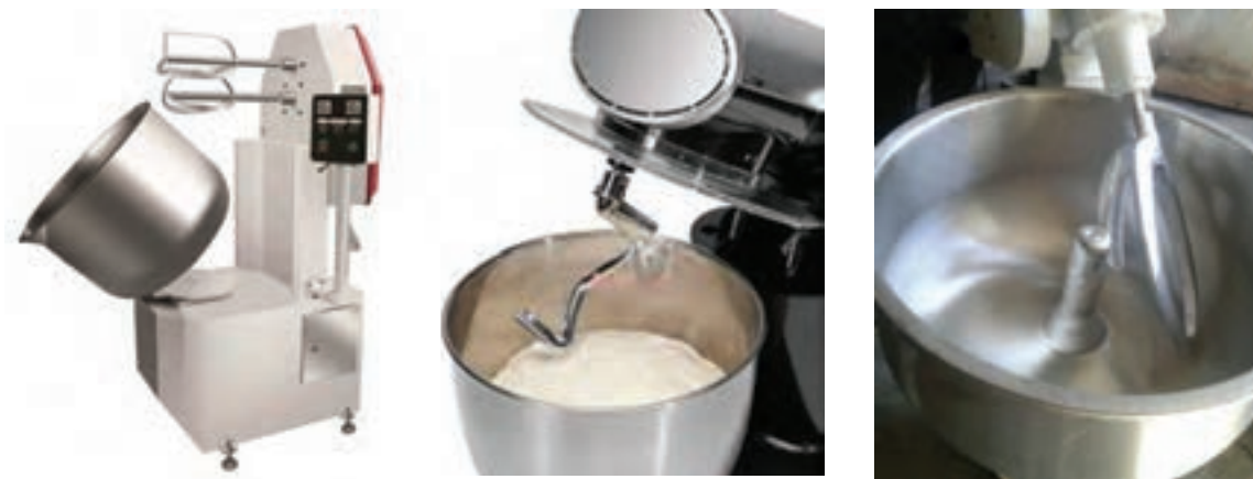
شکل ۷- انواع دستگاه خمیرگیر