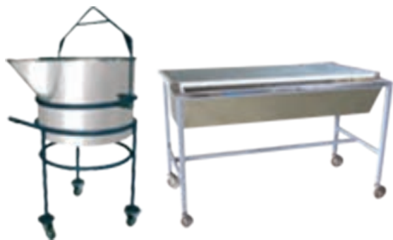
شکل ۸- تگار برای نگهداری و حمل خمیر

عوامل موثر بر روی کیفیت تخمیر عبارت‌اند از: الف) ظرف تخمیر: مثلاً در مورد نان سنگک از تگارهای ویژه از جنس فولاد ضدزنگ و دارای عایق دمایی مناسب استفاده می‌شود تا عمل تخمیر با سرعت بیشتری انجام گیرد. (شکل ۸)