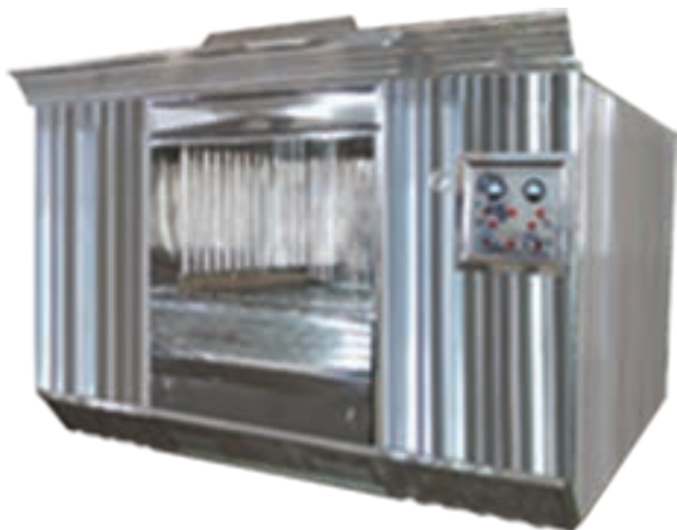
فر پخت دوار با حرارت مستقیم یا غیرمستقیم