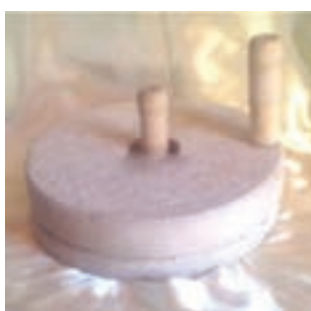
تصاویر آسیاب غلتکی