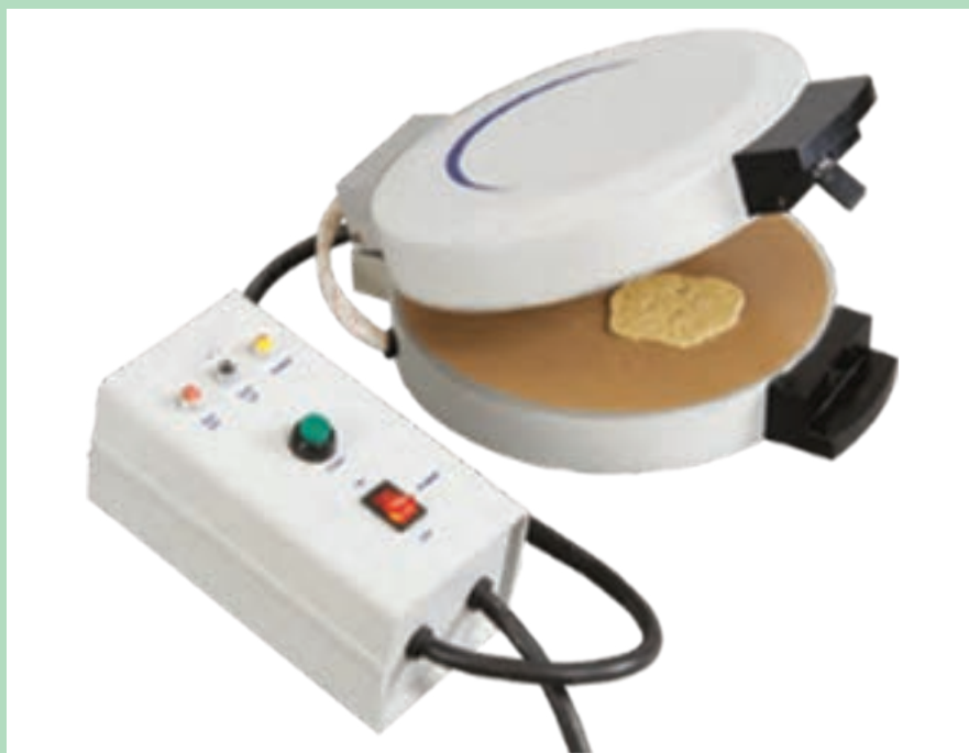
شکل ۵ - دستگاه پرس گلوتن

■ ورقه های گلوتن را بدون تغییر شکل دادن به منطقه دیگری از پرس منتقل کنید و دوباره آنها را به مدت ۵ ثانیه پرس کنید و این عمل را ۱۵ بار تکرار کنید.