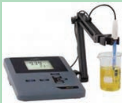
شکل ۶ - pH متر